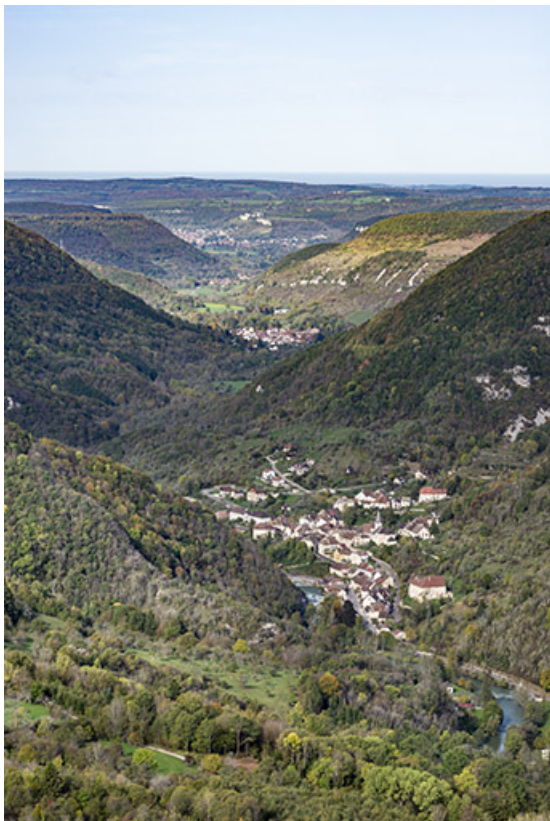
Vallée de la Loue depuis le belvédère du Moine à Renédale. Au premier plan le village de Lods.