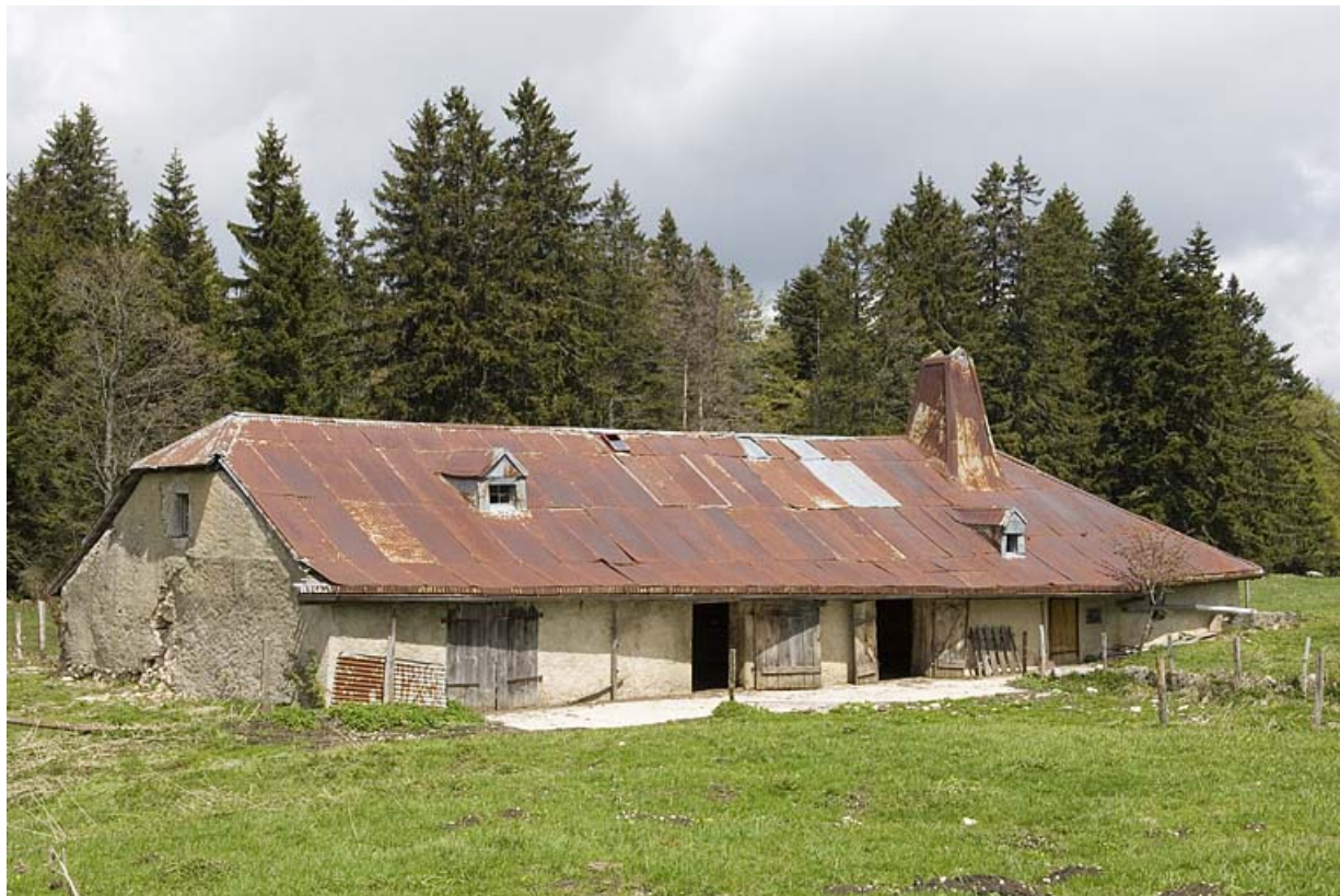
Vue générale de trois quart gauche.