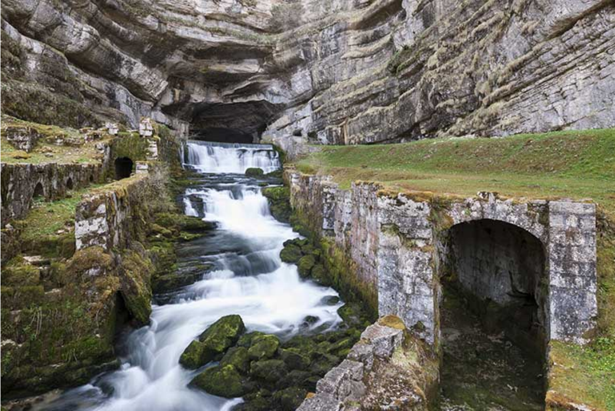
La source et les vestiges des moulins du dessus.