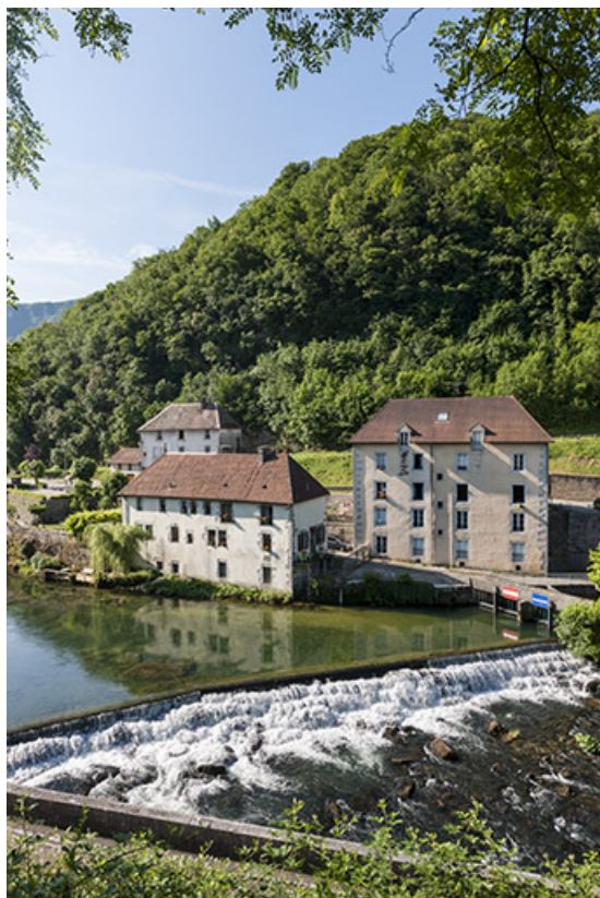
Le barrage et les logements d'ouvriers, depuis la rive droite.