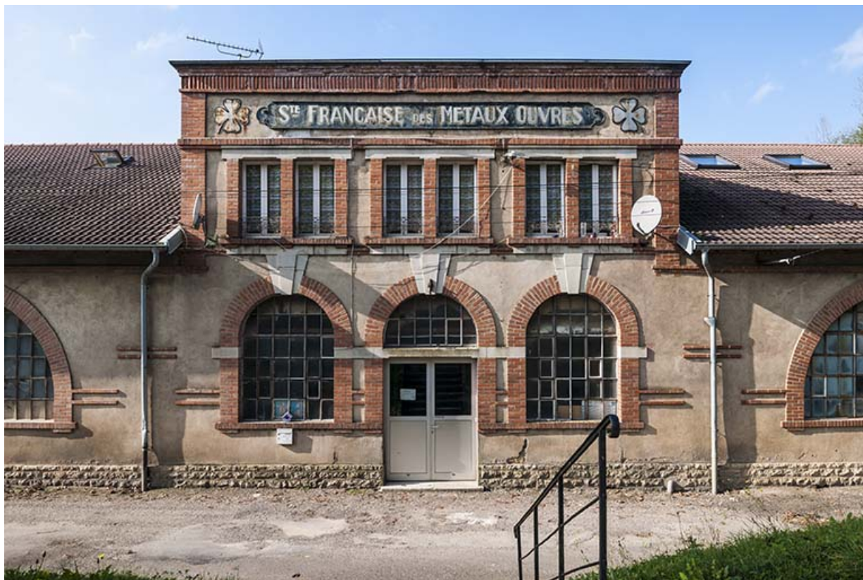
Atelier de fabrication de la Société française des Métaux ouvrés. Travée centrale.