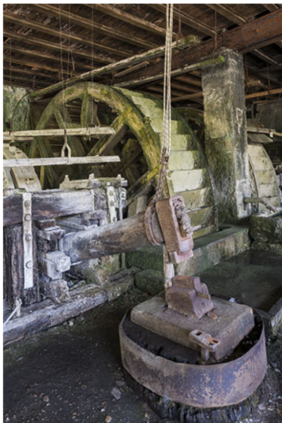
Le martinet est : le bras (ou manche) et la tête. Au sol : la chabotte et l'enclume.