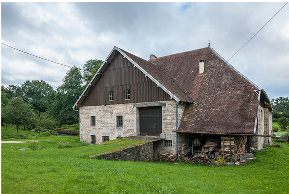
Vue d'ensemble depuis le nord.