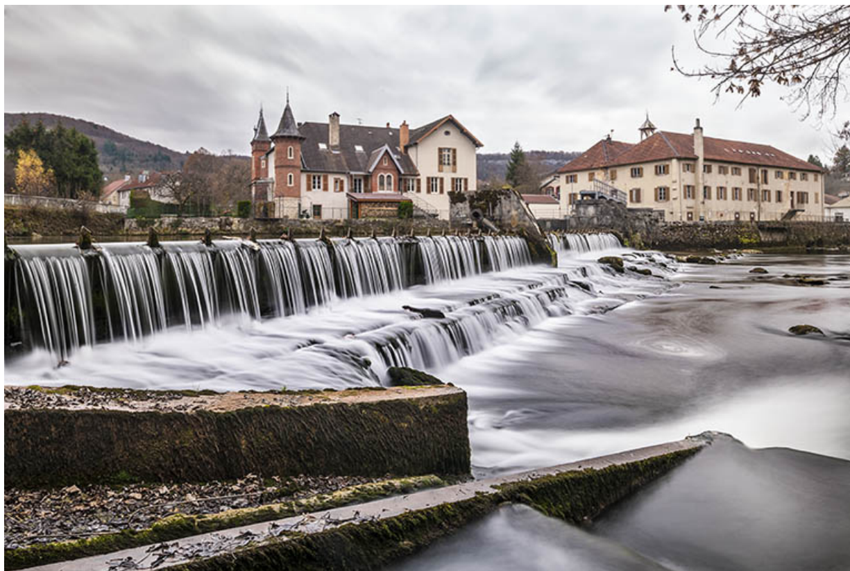
Vue d'ensemble depuis le nord-est.