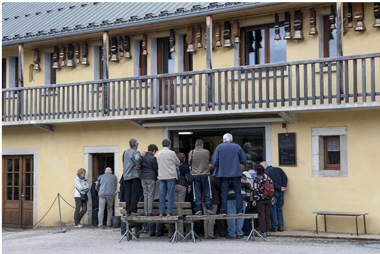
La coulée, vue de l'extérieur.