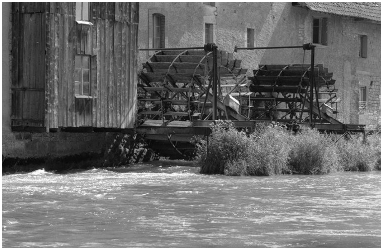
Façade postérieure : les deux roues à aubes.