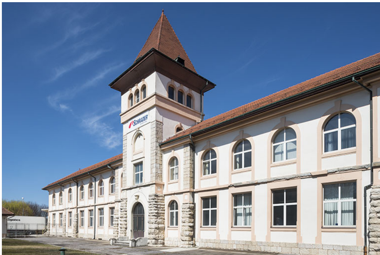
Bâtiment administratif vu de trois quarts droite.