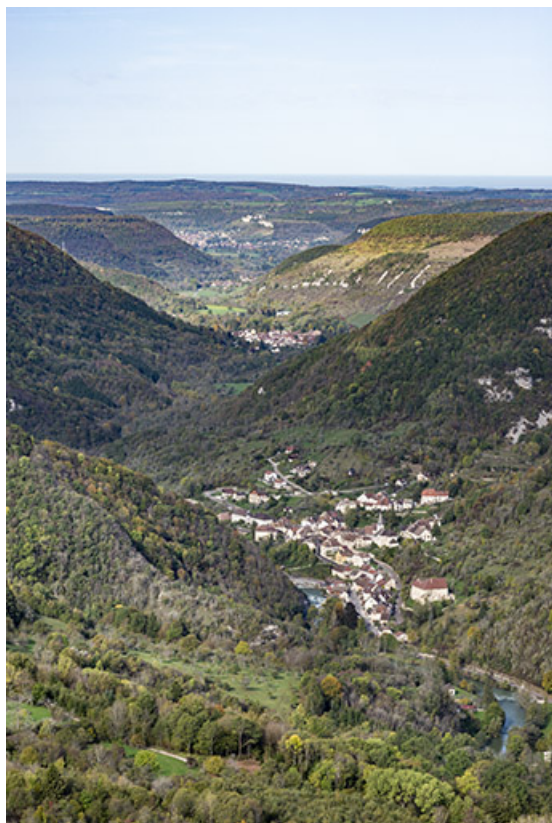
Vallée de la Loue depuis le belvédère du Moine à Renédale. Au premier plan le village de Lods.