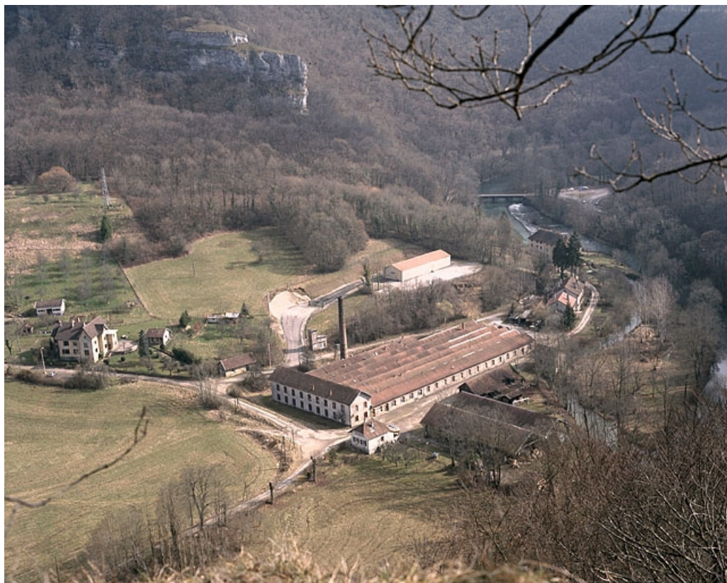
Vue d'ensemble depuis le sud-ouest.