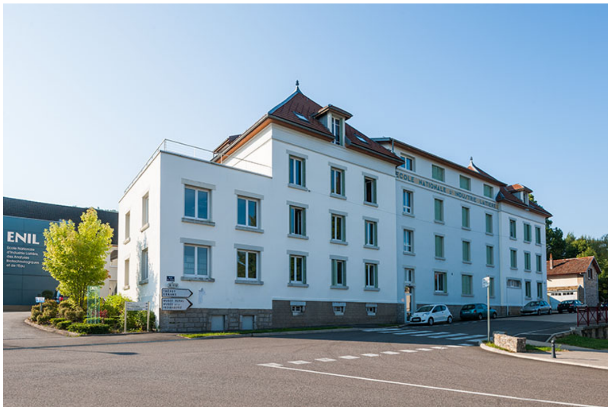
Façade sur rue du bâtiment d'administration et d'externat.