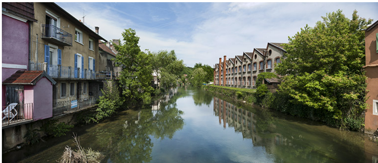
Canal dit du moulin (petit bras du Doubs).