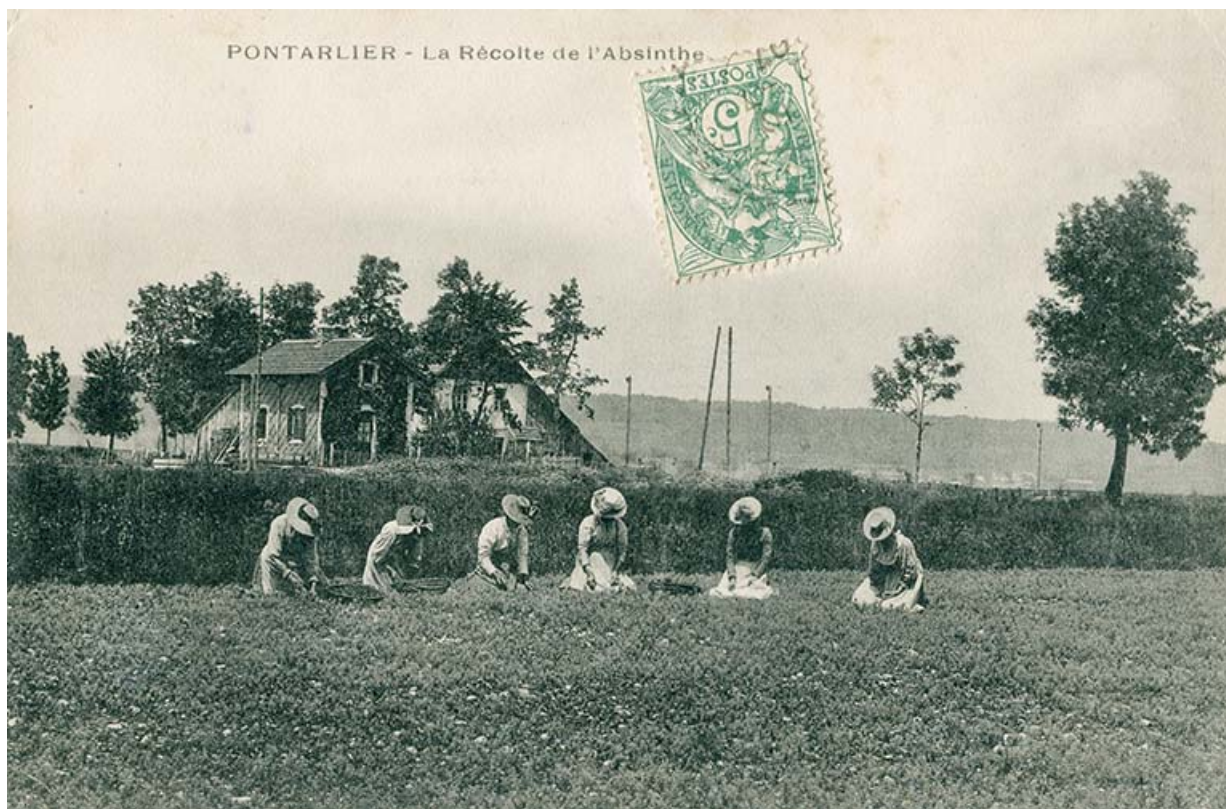
Pontarlier - La récolte de l'absinthe, carte postale, s.d. [fin 19e ou 20e siècle].