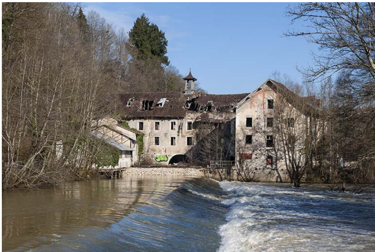
Vue depuis la rive droite du barrage.