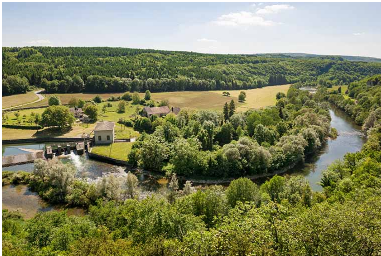
Vue plongeante d'ensemble depuis le nord-est.