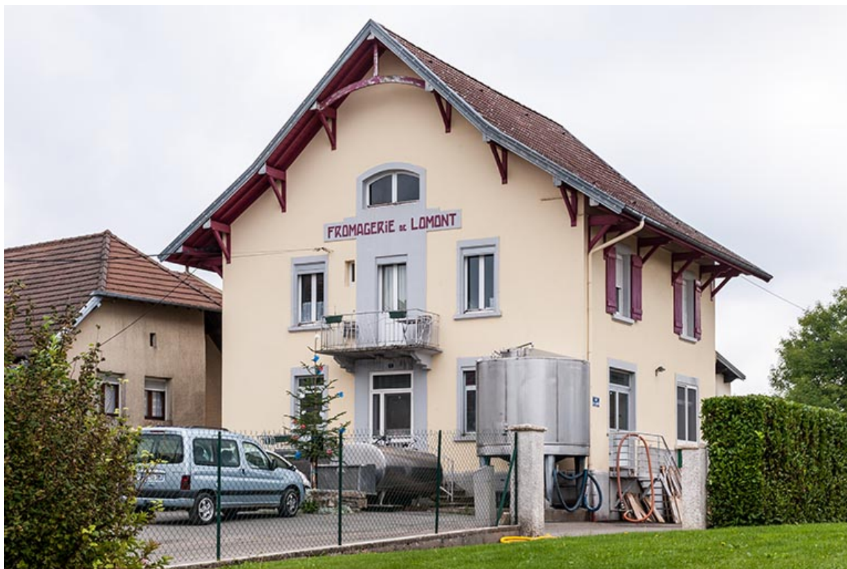
Vue de trois quarts droite.