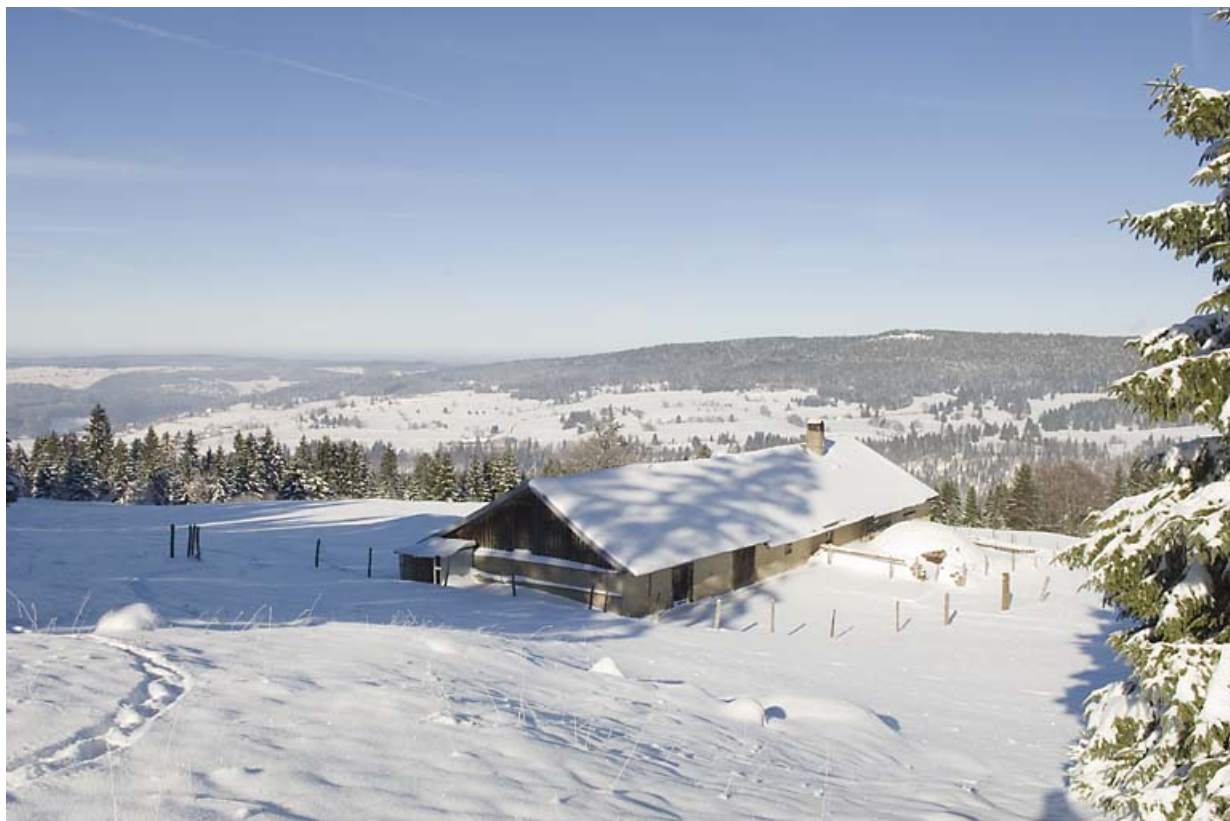
Chalet d'estive de la Caffode, à Jougne.