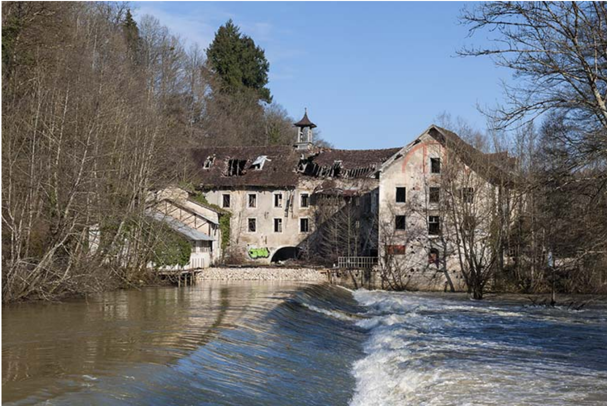
Vue depuis la rive droite du barrage.