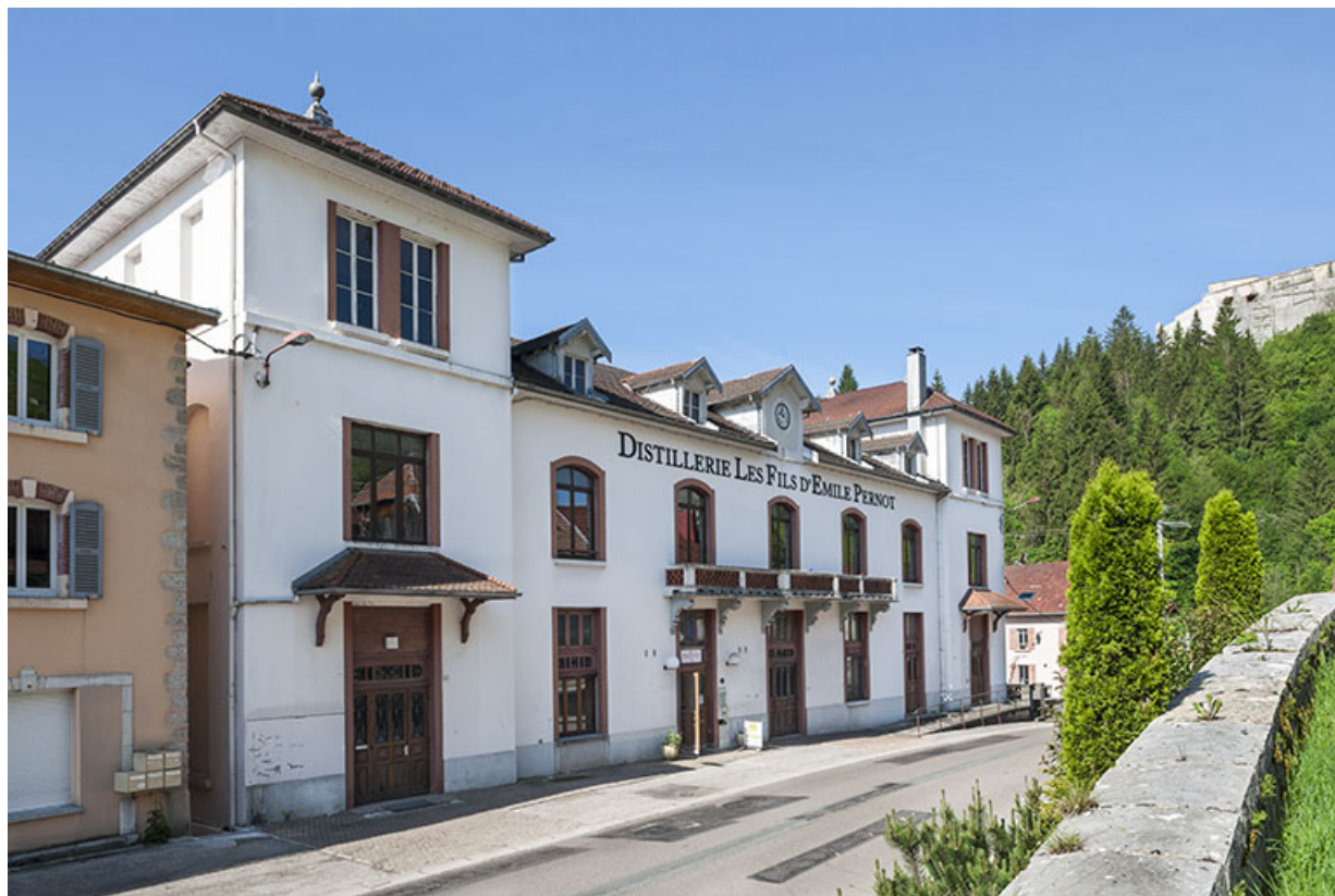
Vue de trois quarts gauche.