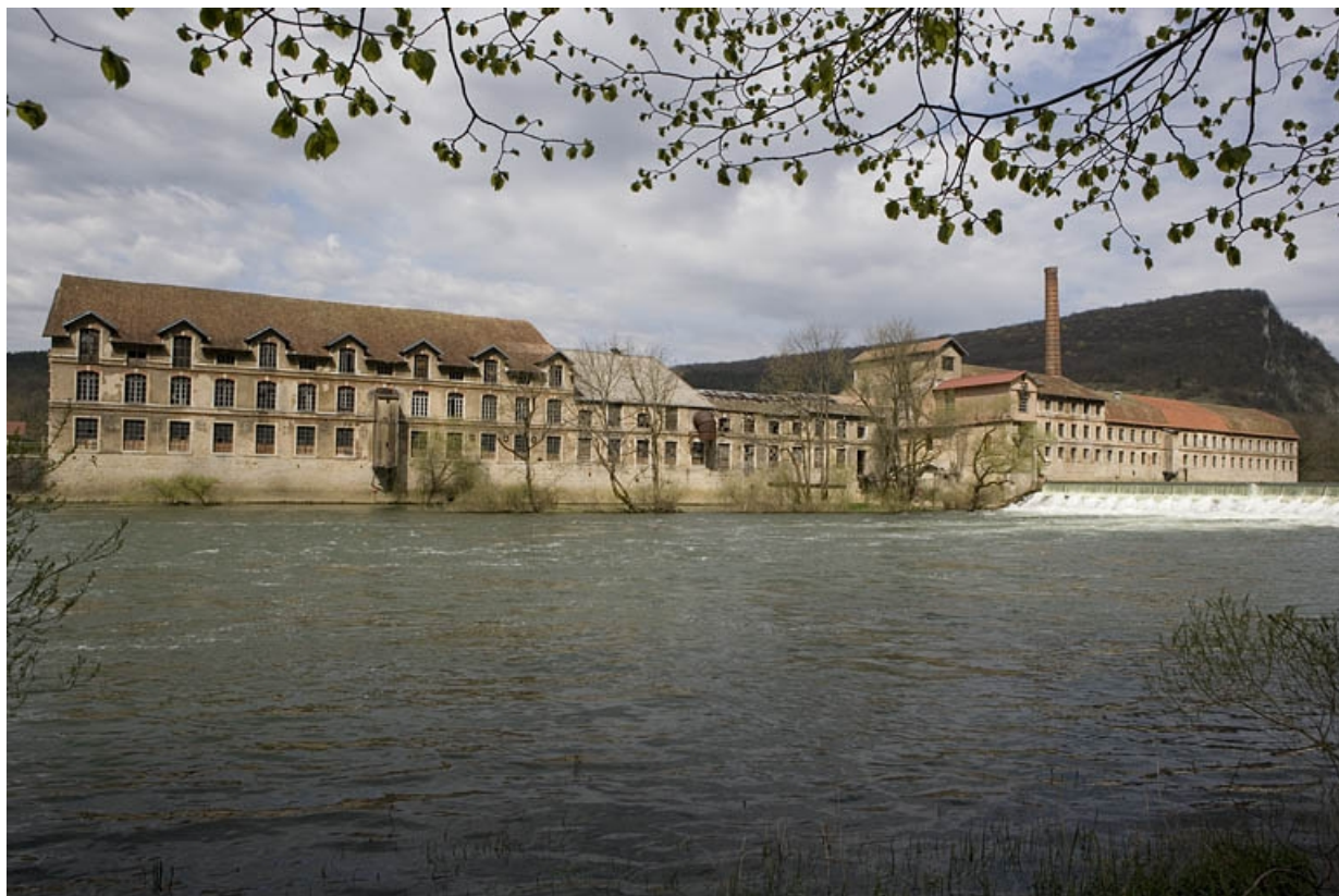
Vue d'ensemble depuis l'aval.