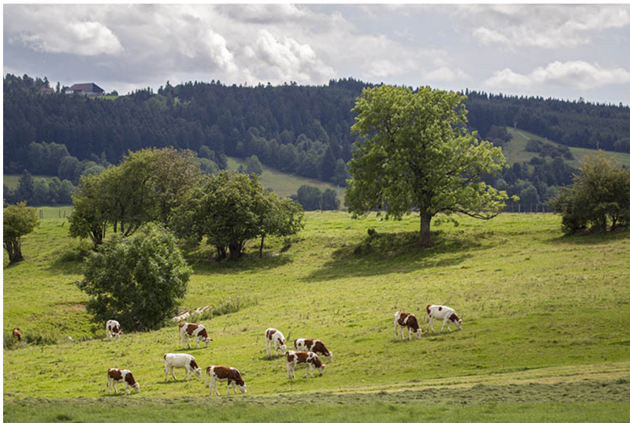
Paysage avec vaches.