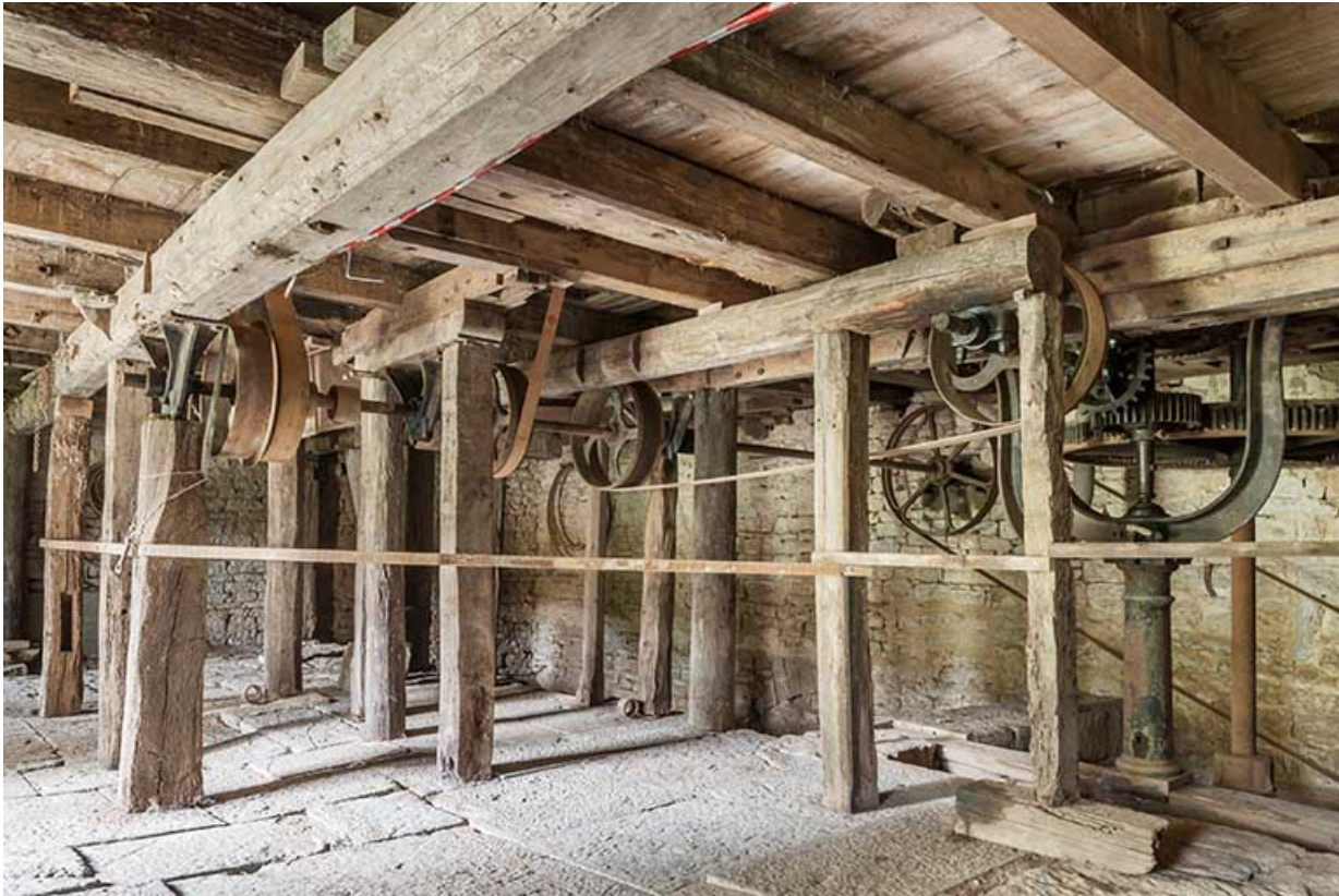
Vue d'ensemble de l'étage de soubassement.