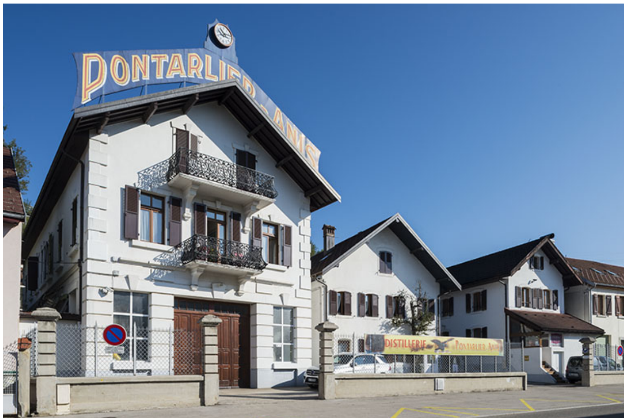
Vue d'ensemble depuis le sud-ouest.