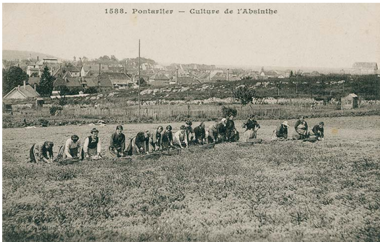
Pontarlier - Culture de l'absinthe, carte postale, s.d. [fin 19e ou 20e siècle].