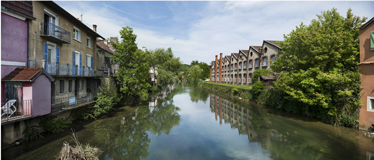
Canal dit du moulin (petit bras du Doubs).