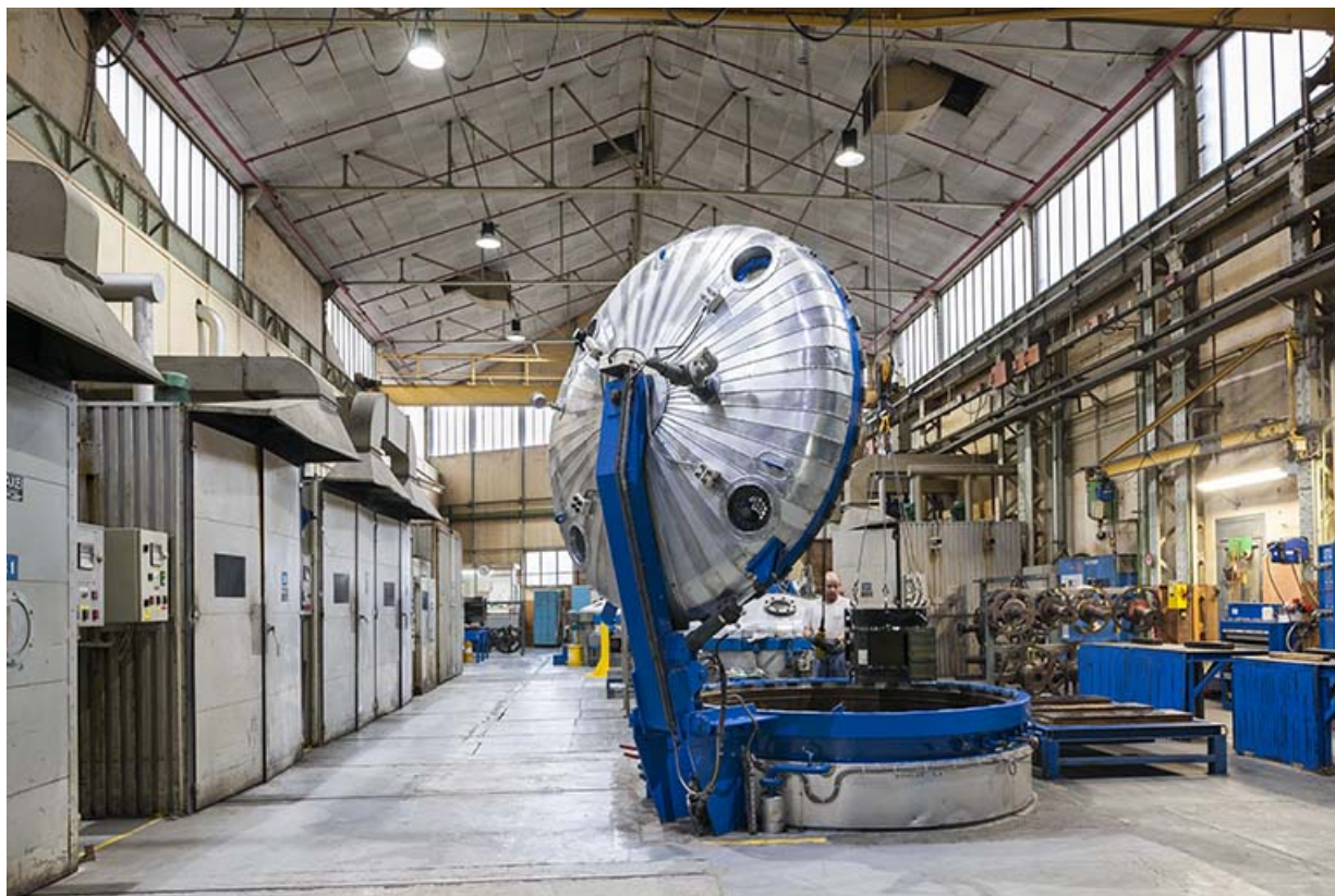
Atelier d'imprégnation (autoclave ouvert).