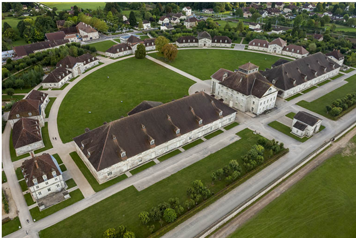
Vue aérienne depuis le sud.