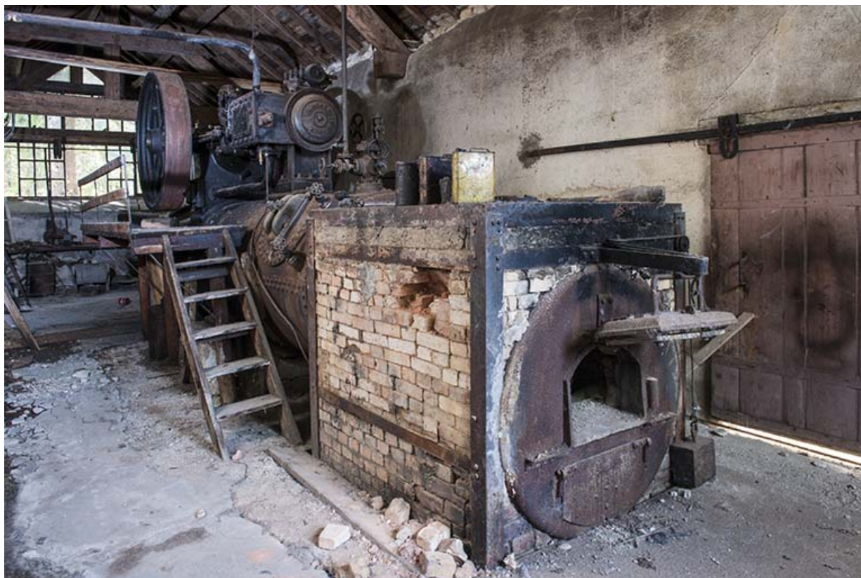
Machine à vapeur King. Vue d'ensemble depuis l'entrée.