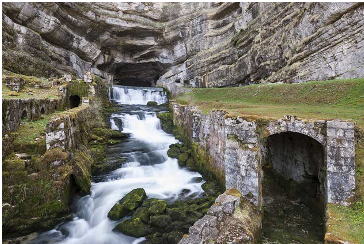
La source et les vestiges des moulins du dessus.

25, Ouhans, lieudit : la Source de la Loue