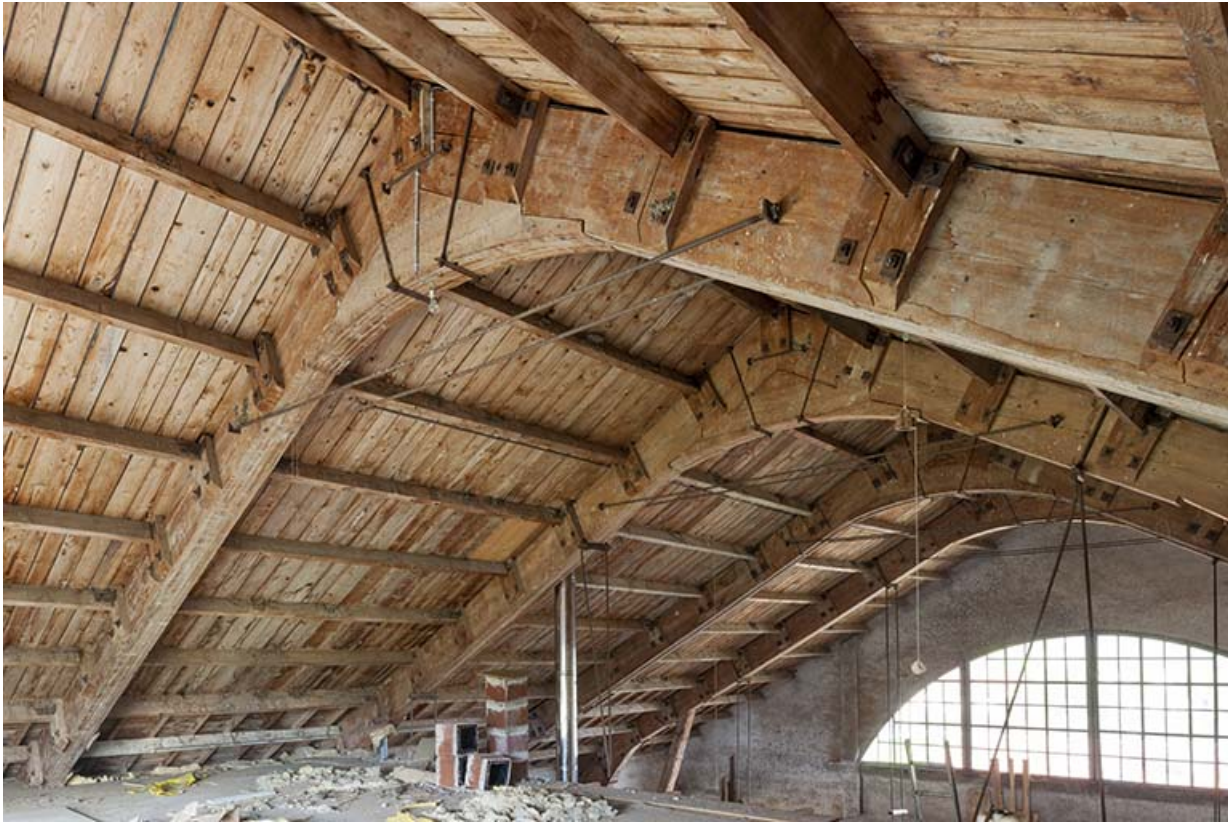
Vue désaxée de la charpente.