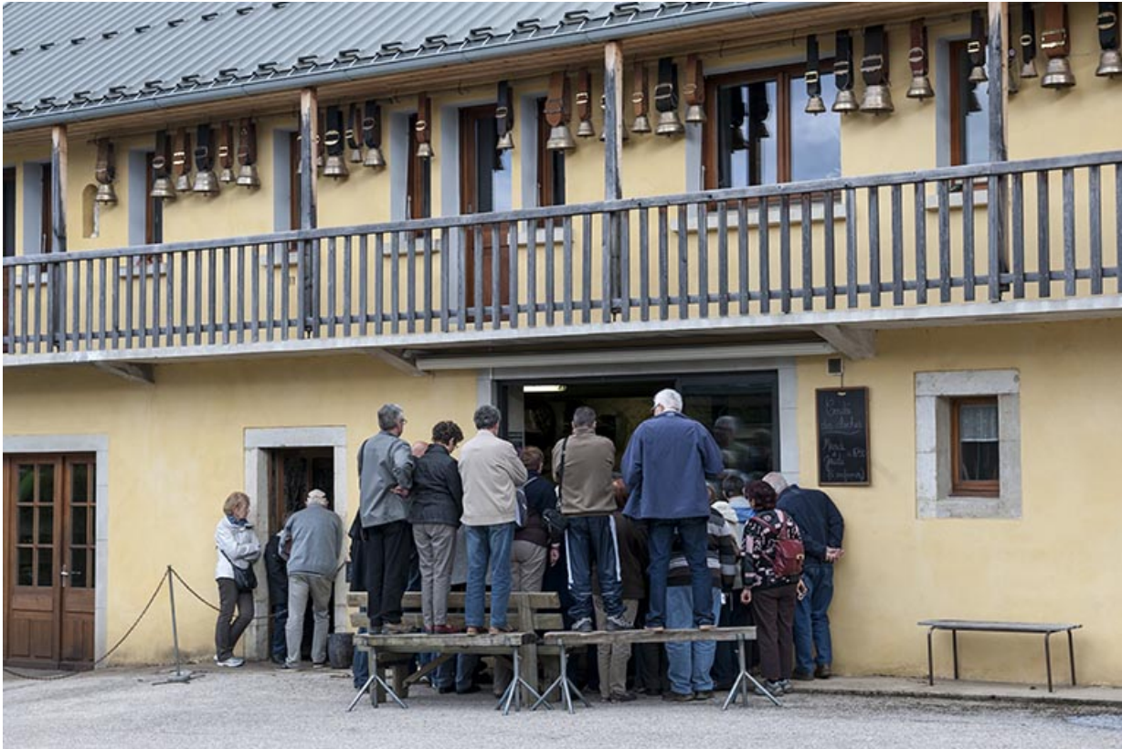
La coulée, vue de l'extérieur.