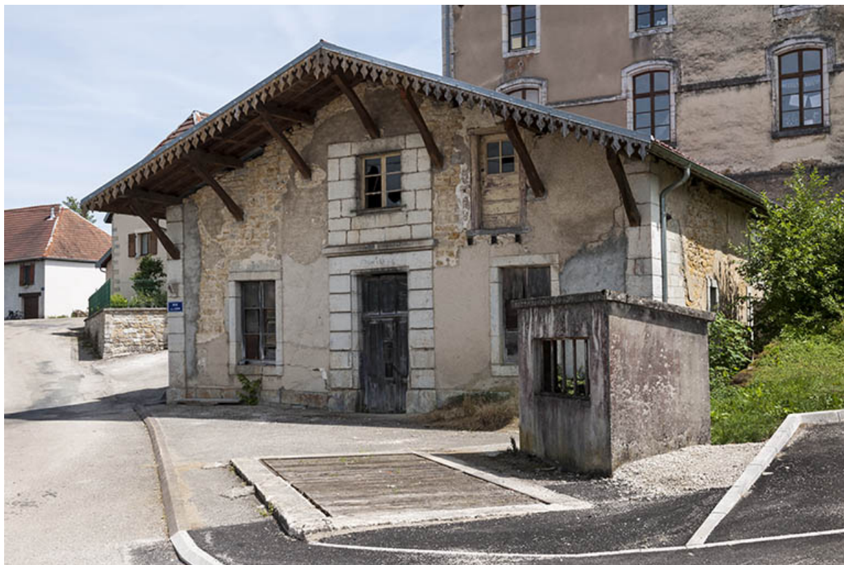
Vue de trois quarts droite.