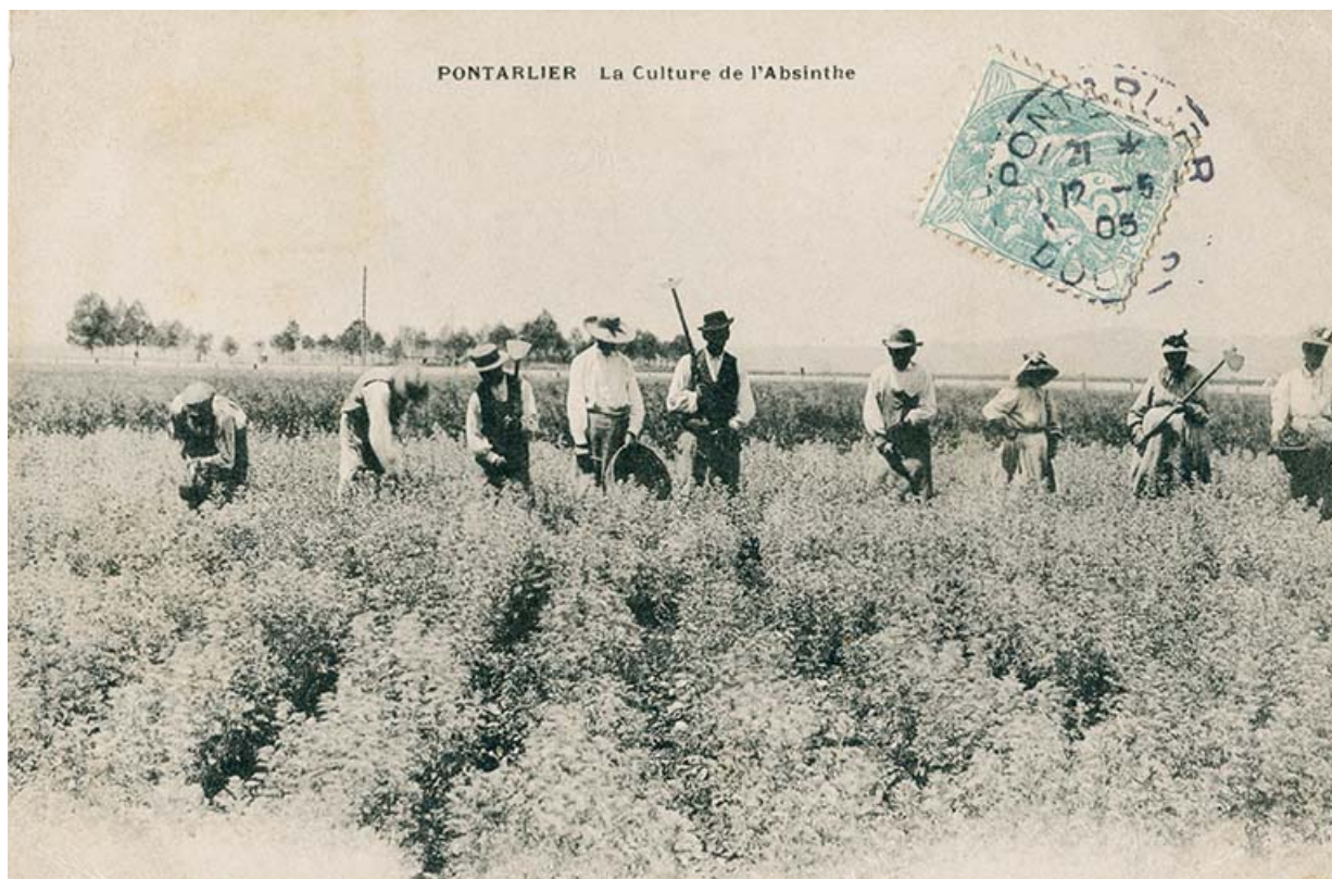
Pontarlier - La culture de l'absinthe, carte postale, s.d. [fin 19e ou 20e siècle].