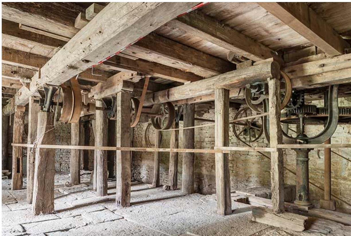
Vue d'ensemble de l'étage de soubassement.