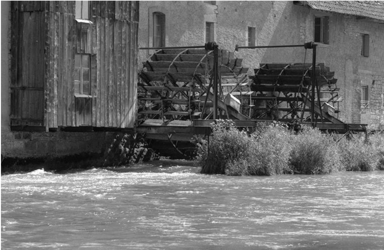
Façade postérieure : les deux roues à aubes.