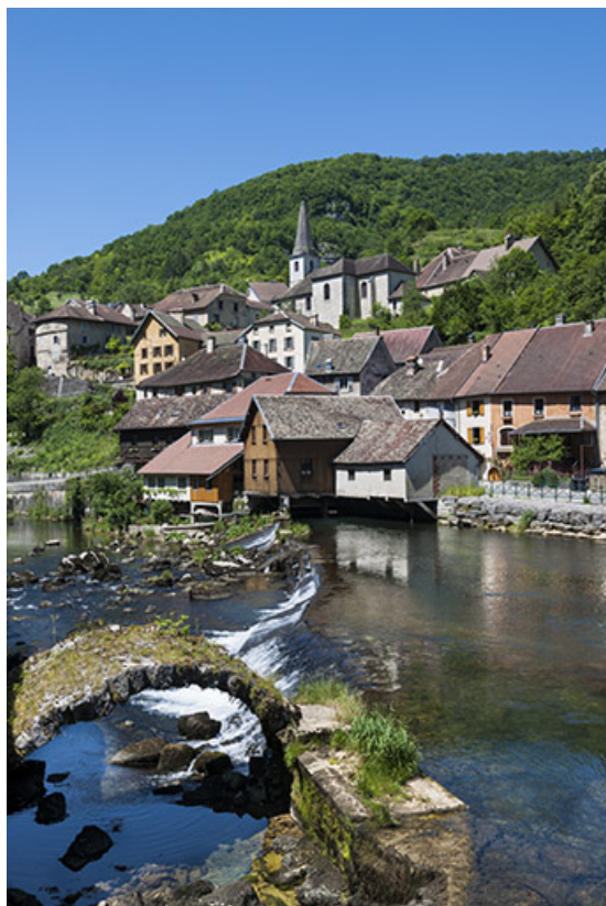
Vue générale, avec le village au second plan.