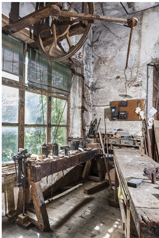
Détail du tour à pédalier.