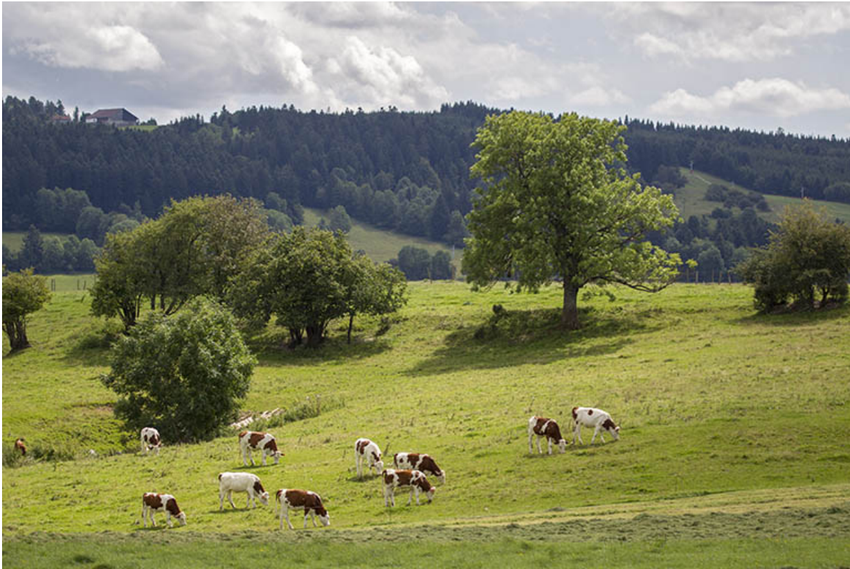
Paysage avec vaches.