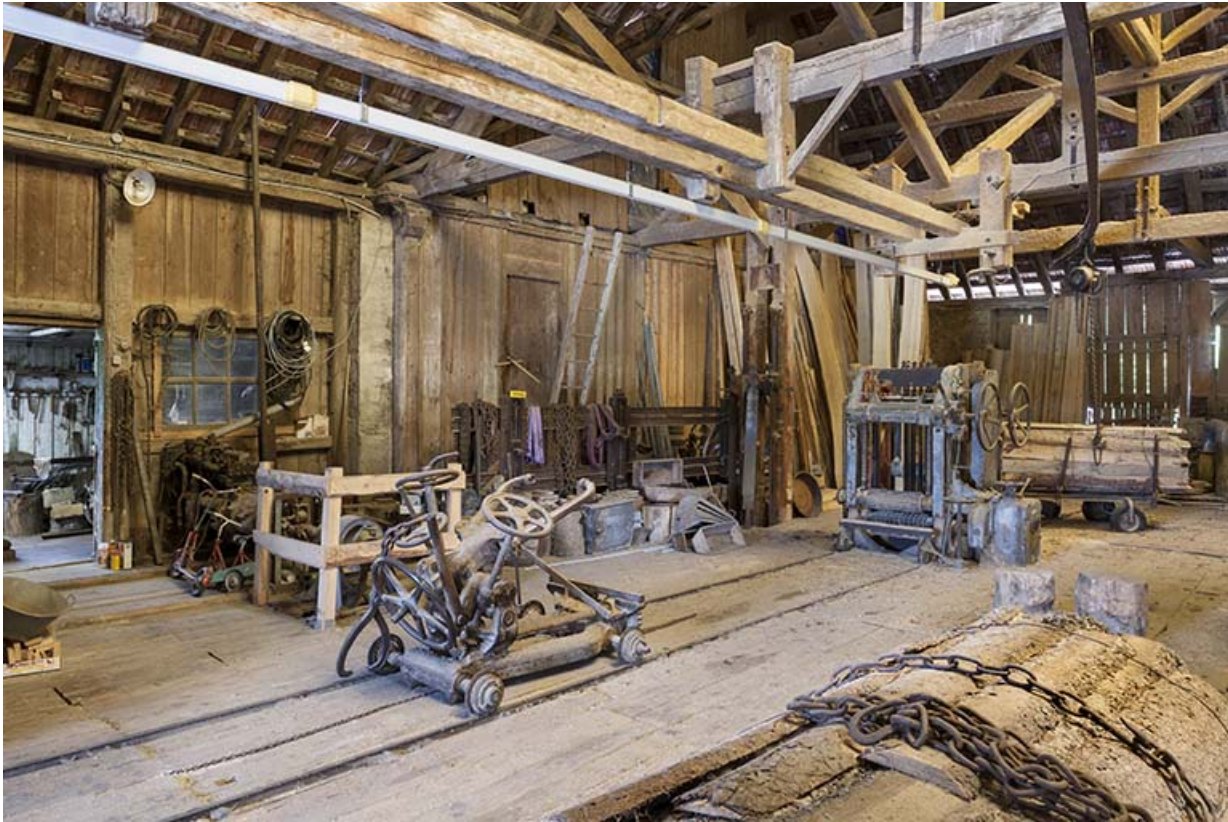
Vue d'ensemble de l'atelier de scierie.