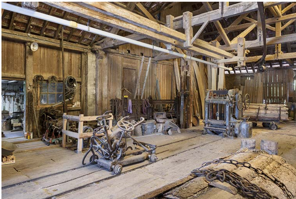
Vue d'ensemble de l'atelier de scierie.