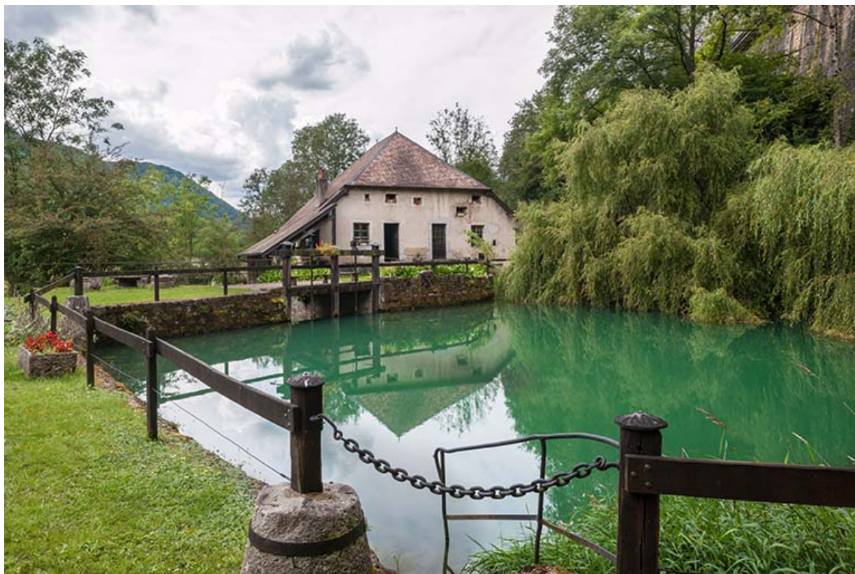
La source et le moulin depuis le nord-est.