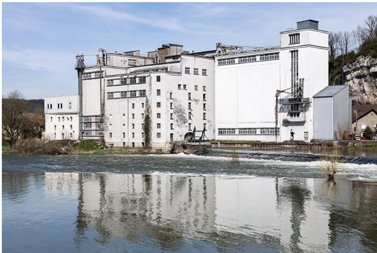
Vue de trois quarts.