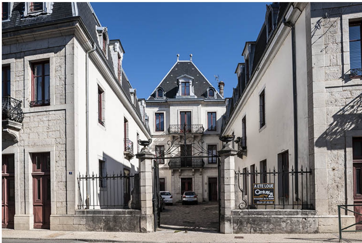
Logement patronal et ses communs. Vue de face.