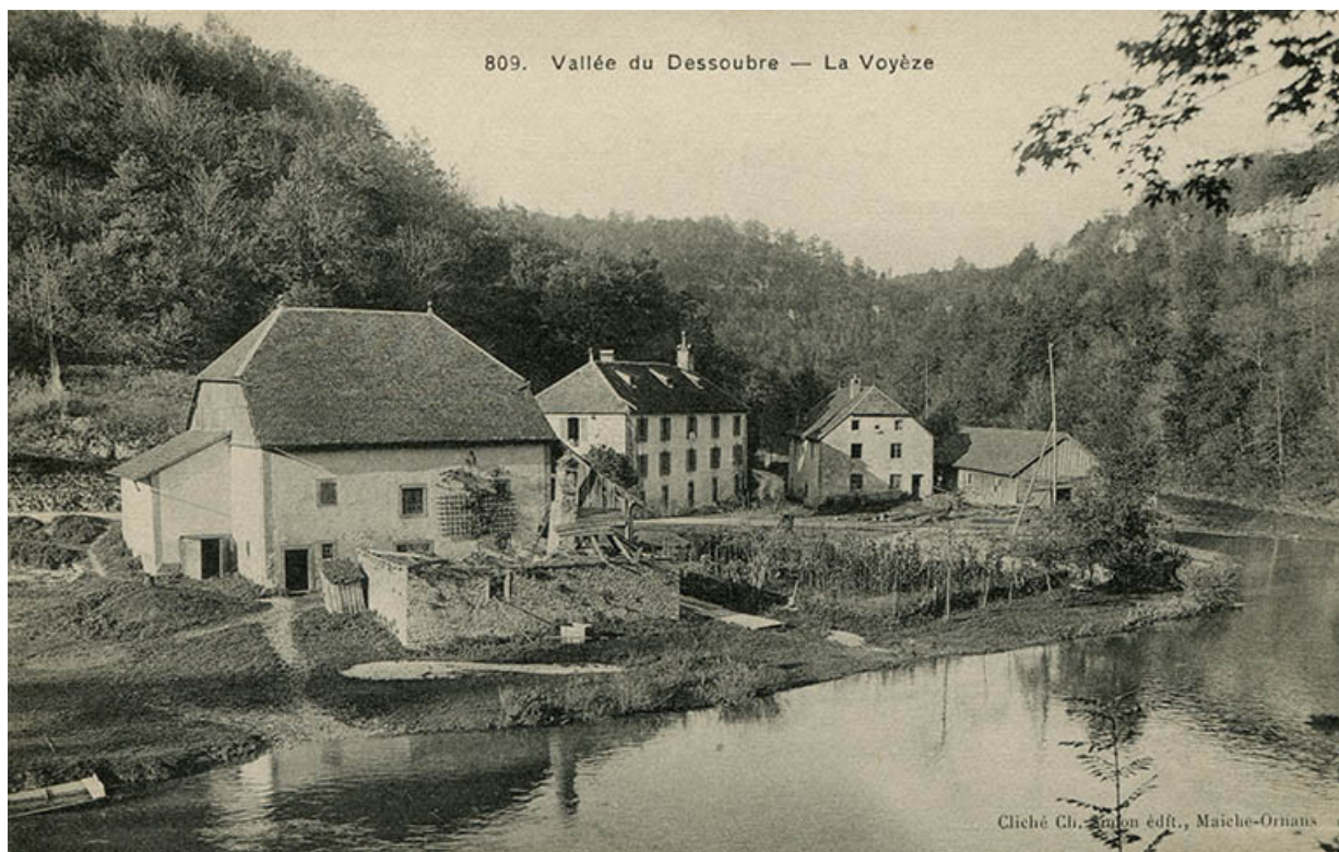
809. Vallée du Dessoubre - La Voyèze, 4e quart 19e siècle (avant 1903). 25, Vauclusotte, lieudit : la Voyèze