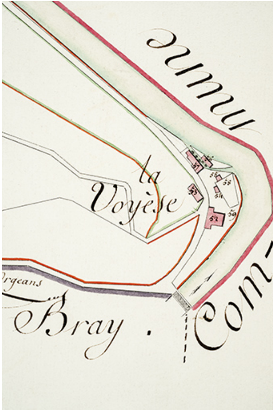
[Plan-masse et de situation, extrait du plan cadastral de la commune de Vaclusotte, section B du Chanois, 1ère feuille], 1810. 25, Vaclusotte, lieudit : la Voyèze