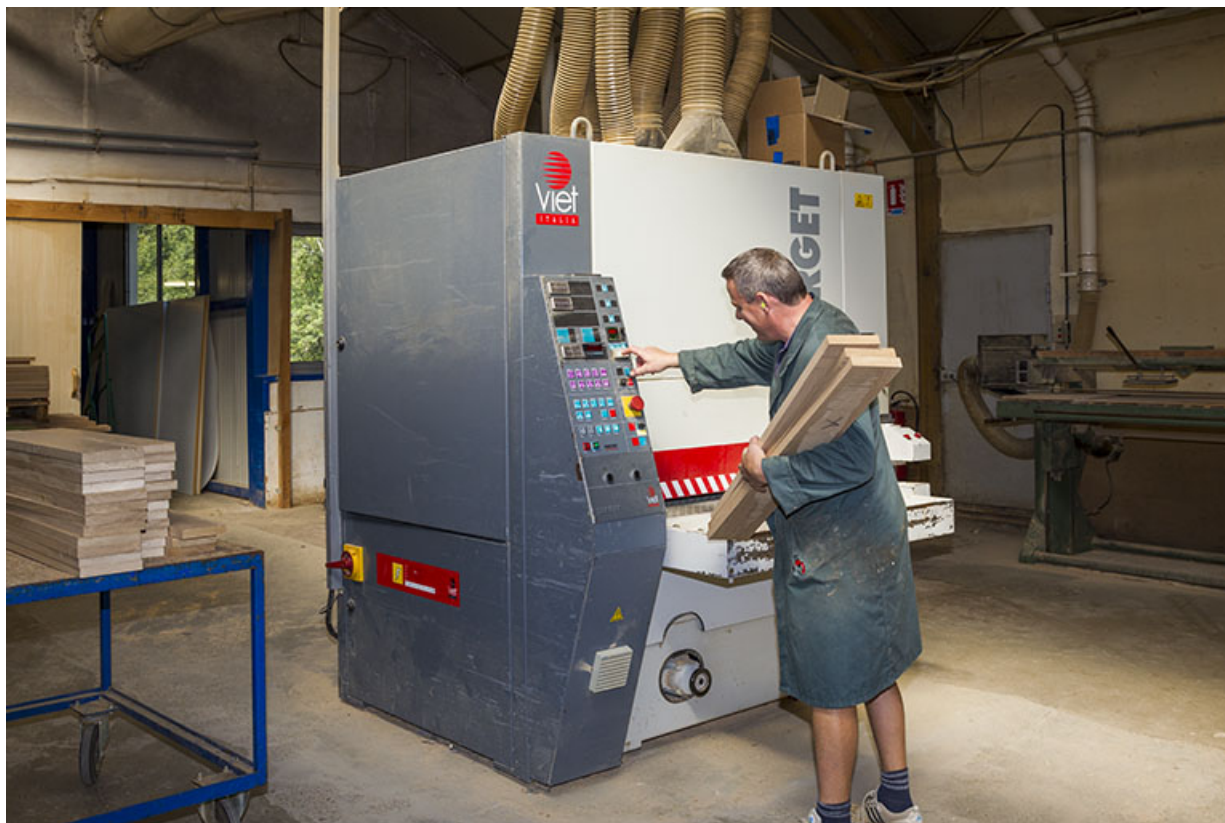
Atelier des années 1980 : ponceuse Viet. 25, Vauclusotte, lieudit : la Voyèze