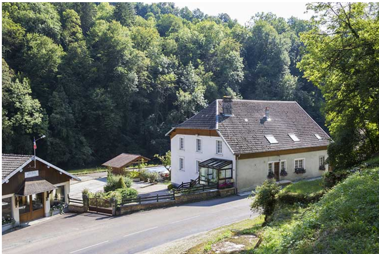
Le magasin et le logement patronal, depuis le nord.