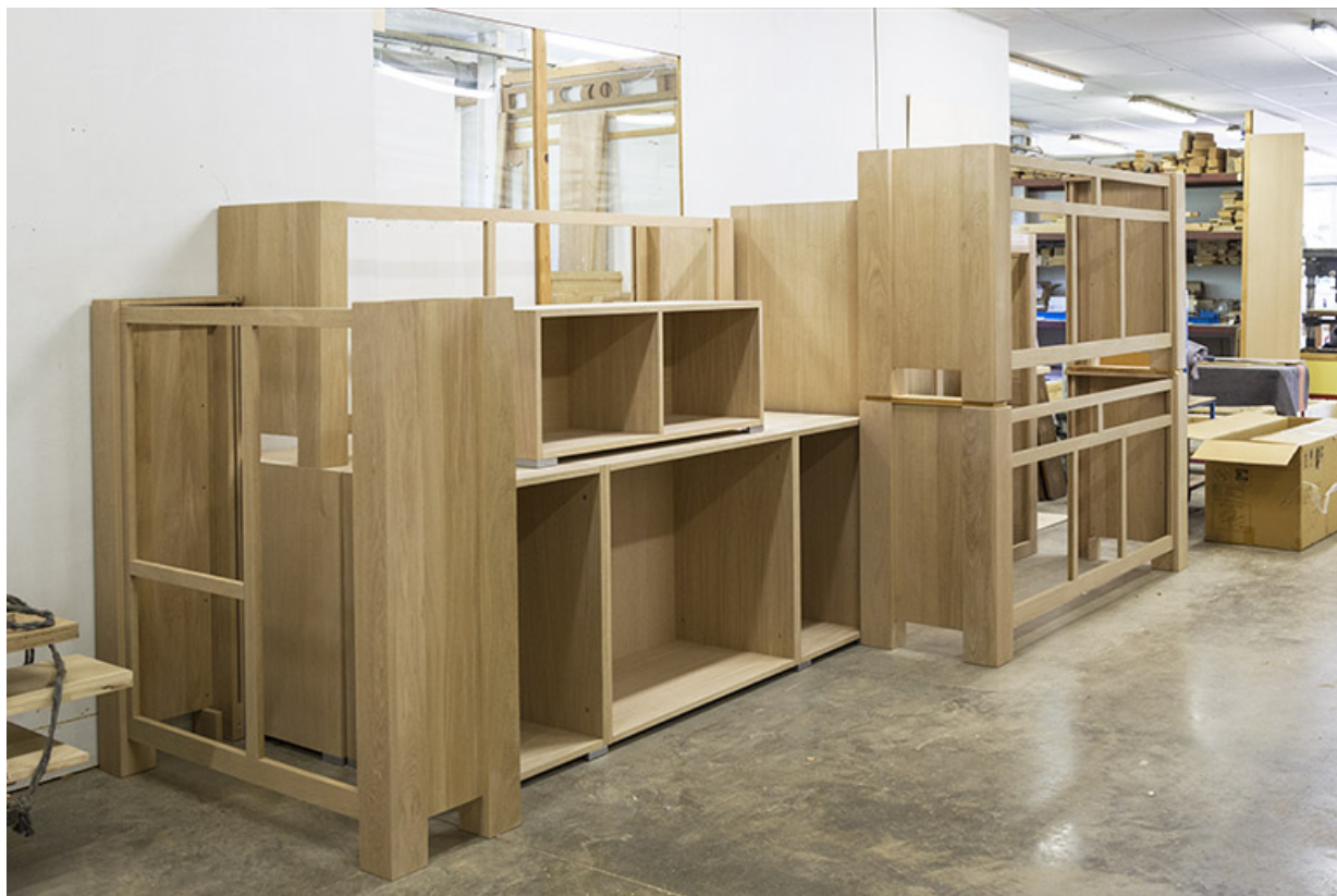
Atelier de 1990 : meubles en cours de fabrication.