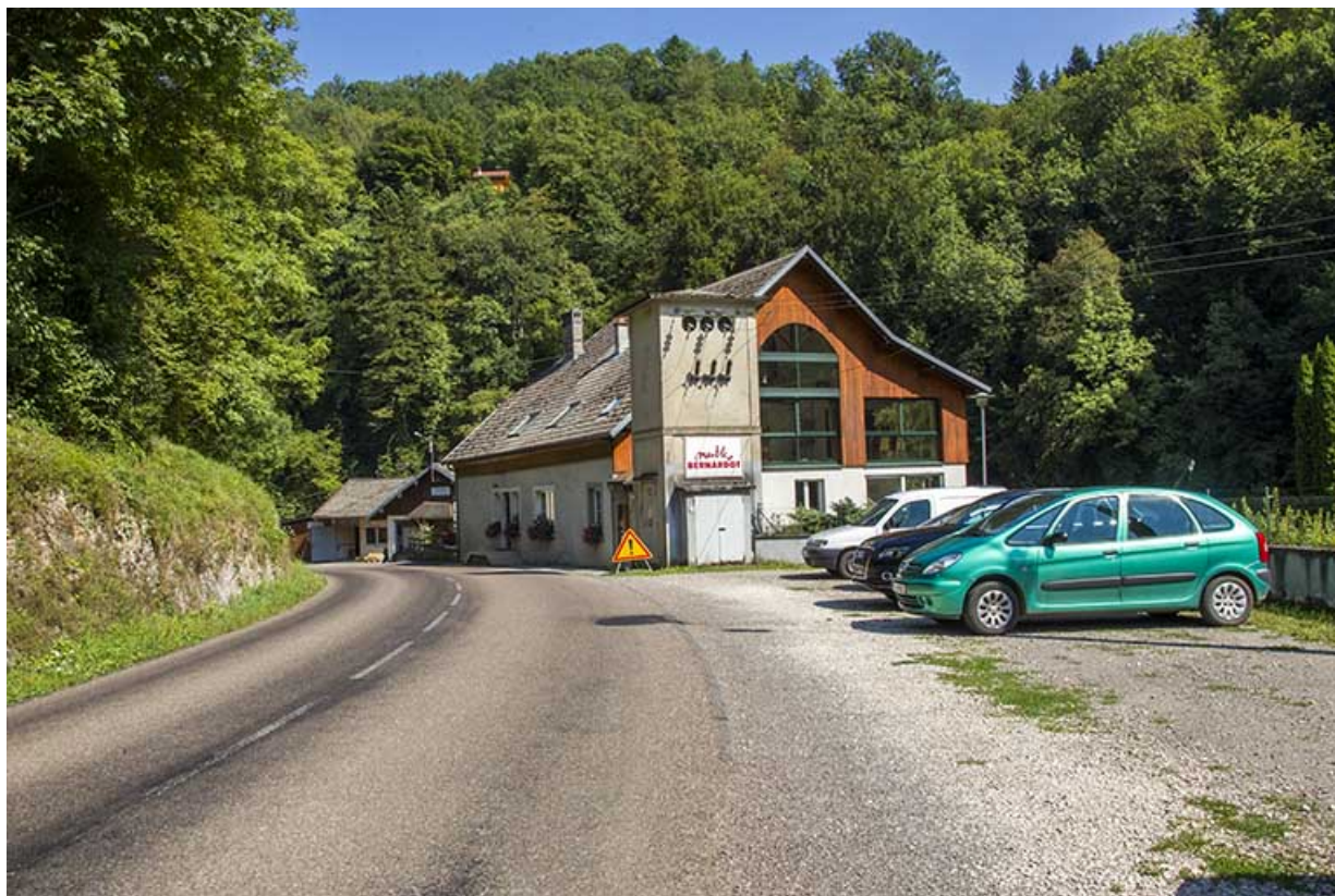
Le logement patronal et le transformateur, depuis la route à l'ouest.