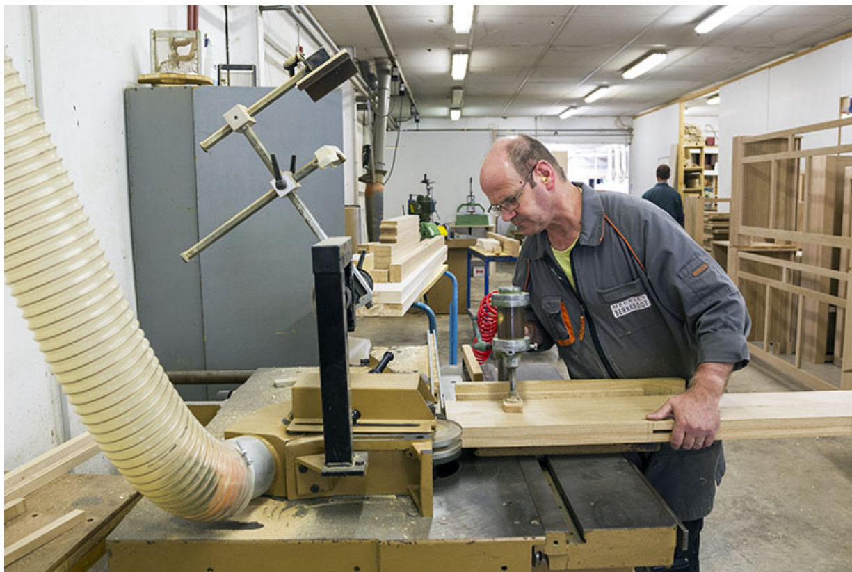
Atelier de 1990 : tenonneuse.