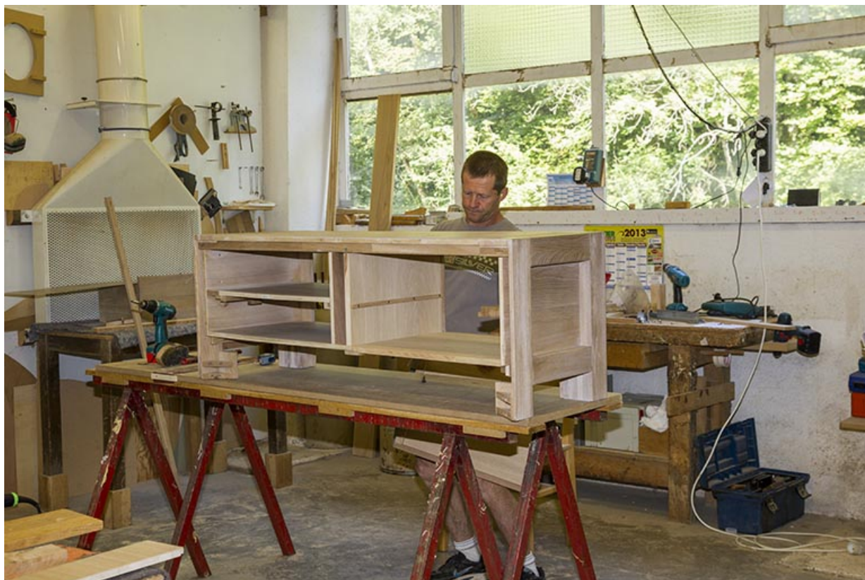
Atelier de 1990 : montage d'un meuble.