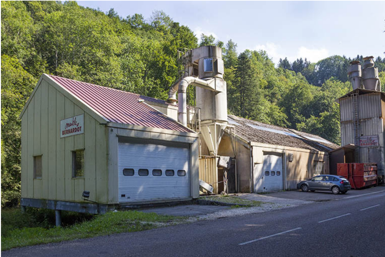
L'usine, depuis la route au nord : bâtiment postérieur à 1998 au premier plan, construit entre 1980 et 1988 au second plan 25, Vaclusotte, lieudit : la Voyèze