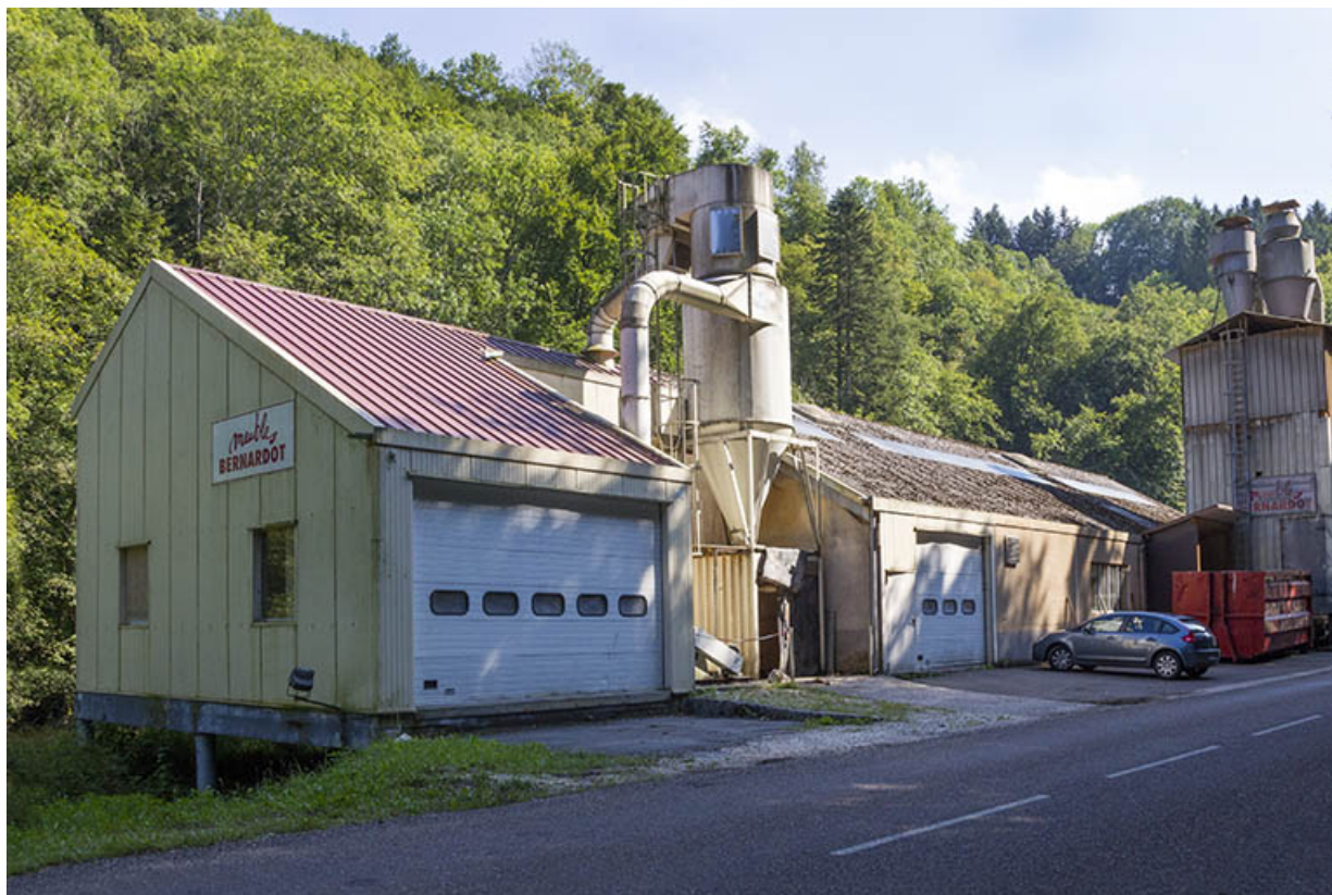
L'usine, depuis la route au nord : bâtiment postérieur à 1998 au premier plan, construit entre 1980 et 1988 au second plan 25, Vaclusotte, lieudit : la Voyèze