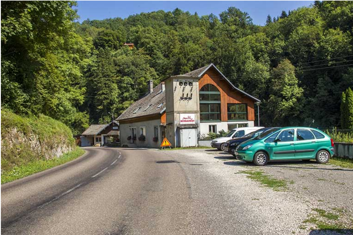
Le logement patronal et le transformateur, depuis la route à l'ouest.