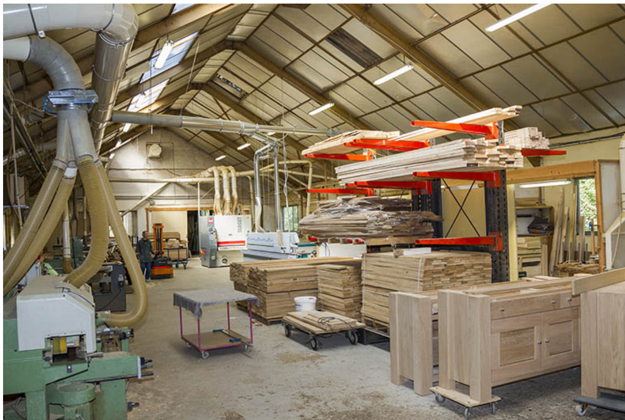
Intérieur de l'atelier des années 1980.