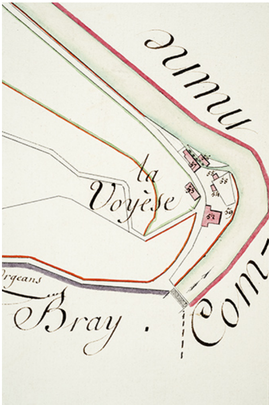
[Plan-masse et de situation, extrait du plan cadastral de la commune de Vaclusotte, section B du Chanois, 1ère feuille], 1810. 25, Vaclusotte, lieudit : la Voyèze