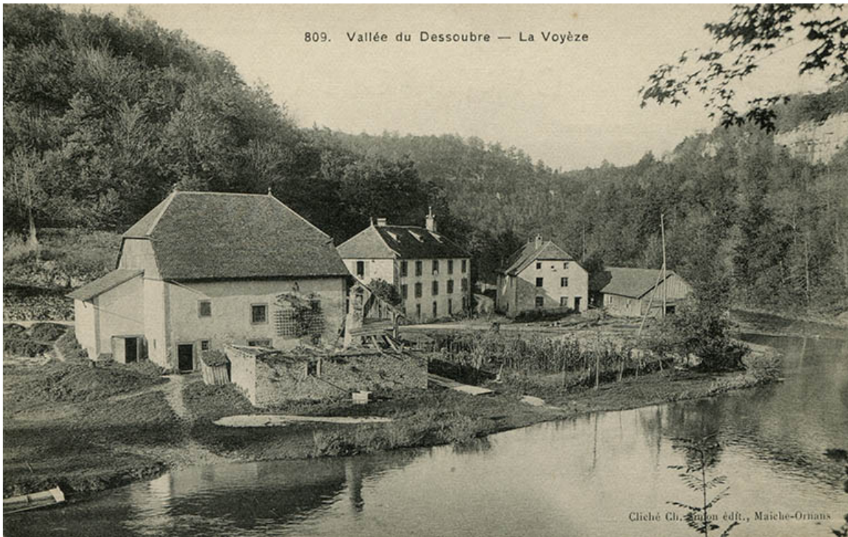
809. Vallée du Dessoubre - La Voyèze, 4e quart 19e siècle (avant 1903). 25, Vauclusotte, lieudit : la Voyèze