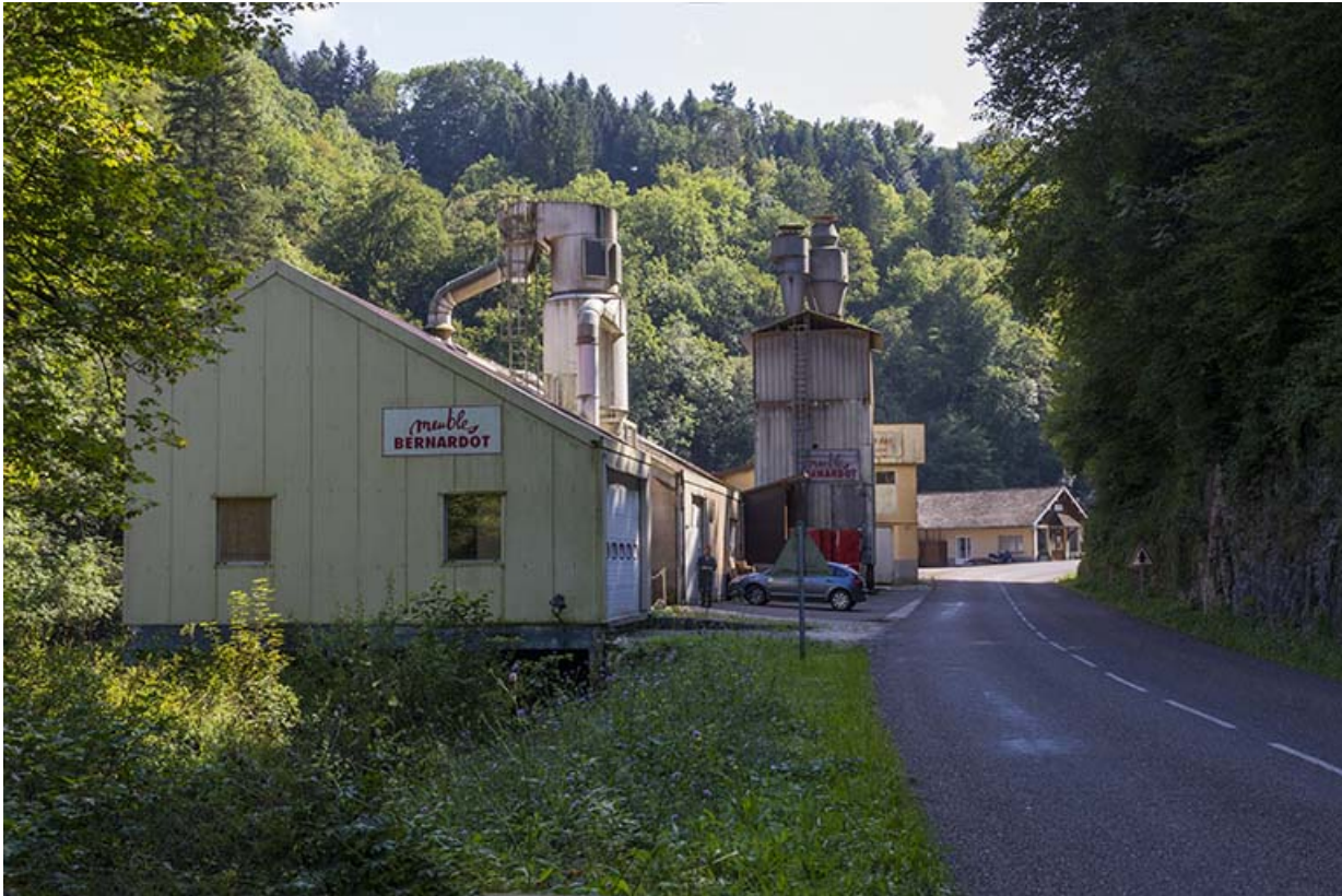
Vue d'ensemble du site, depuis le nord.