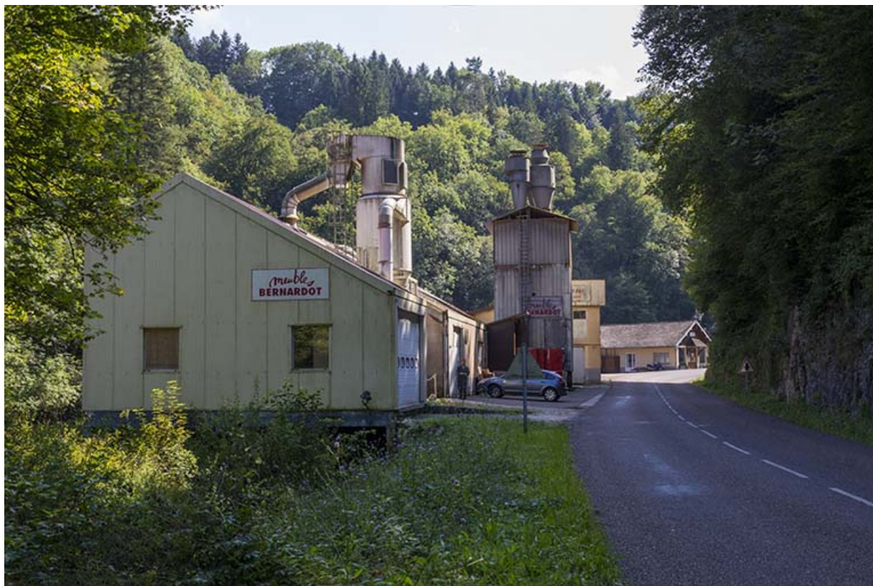
Vue d'ensemble du site, depuis le nord.