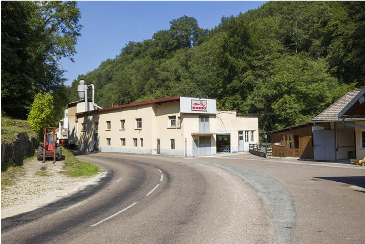
L'usine, depuis la route au sud : bâtiment refait en 1990.