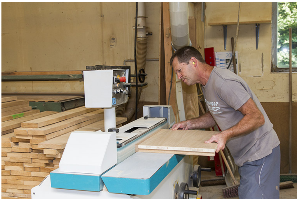
Atelier des années 1980 : ponceuse de chant Griggio.