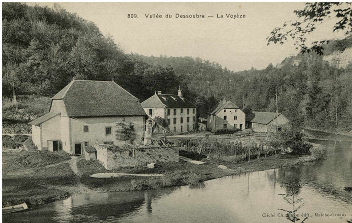
809. Vallée du Dessoubre - La Voyèze, 4e quart 19e siècle (avant 1903). 25, Vauclusotte, lieudit : la Voyèze