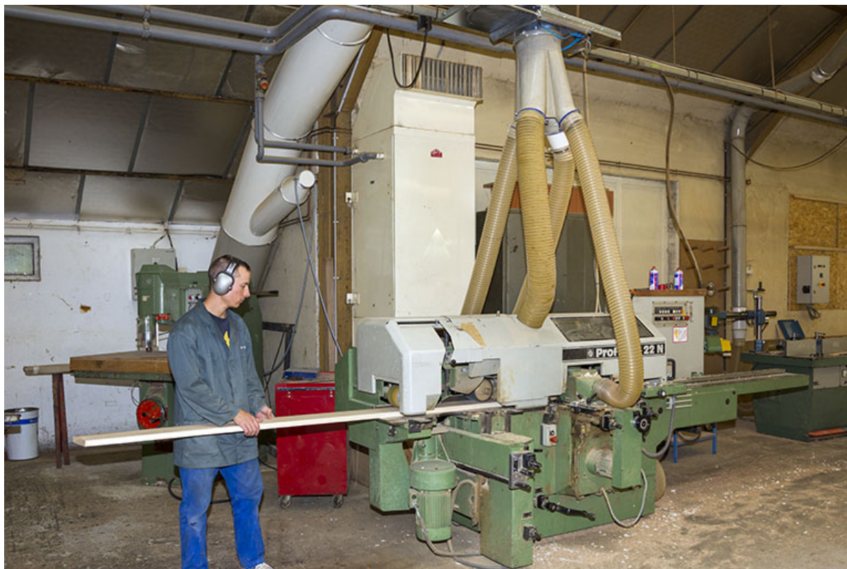
Atelier des années 1980 : raboteuse Profimat. 25, Vauclusotte, lieudit : la Voyèze