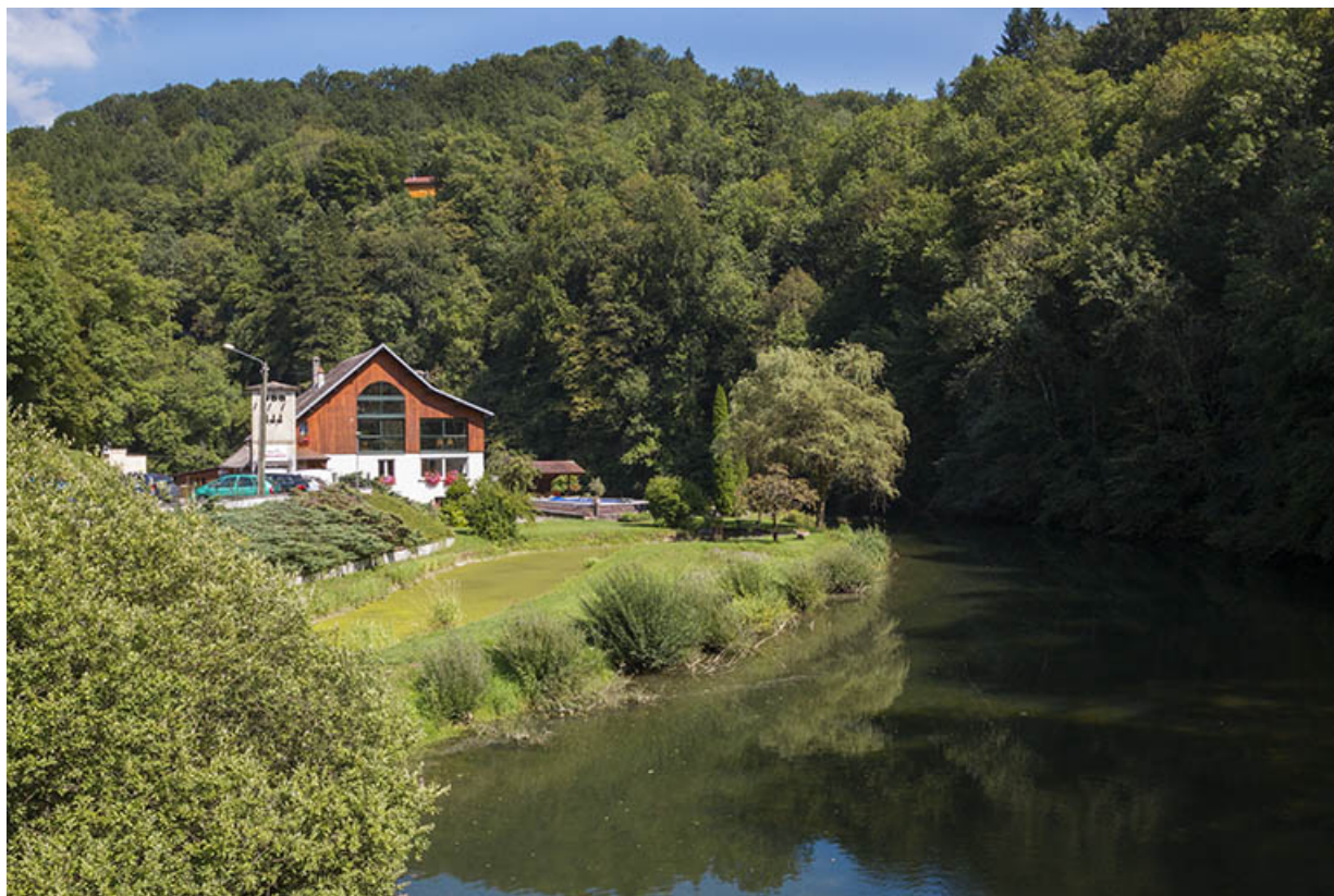
Vue d'ensemble du site, depuis l'ouest.