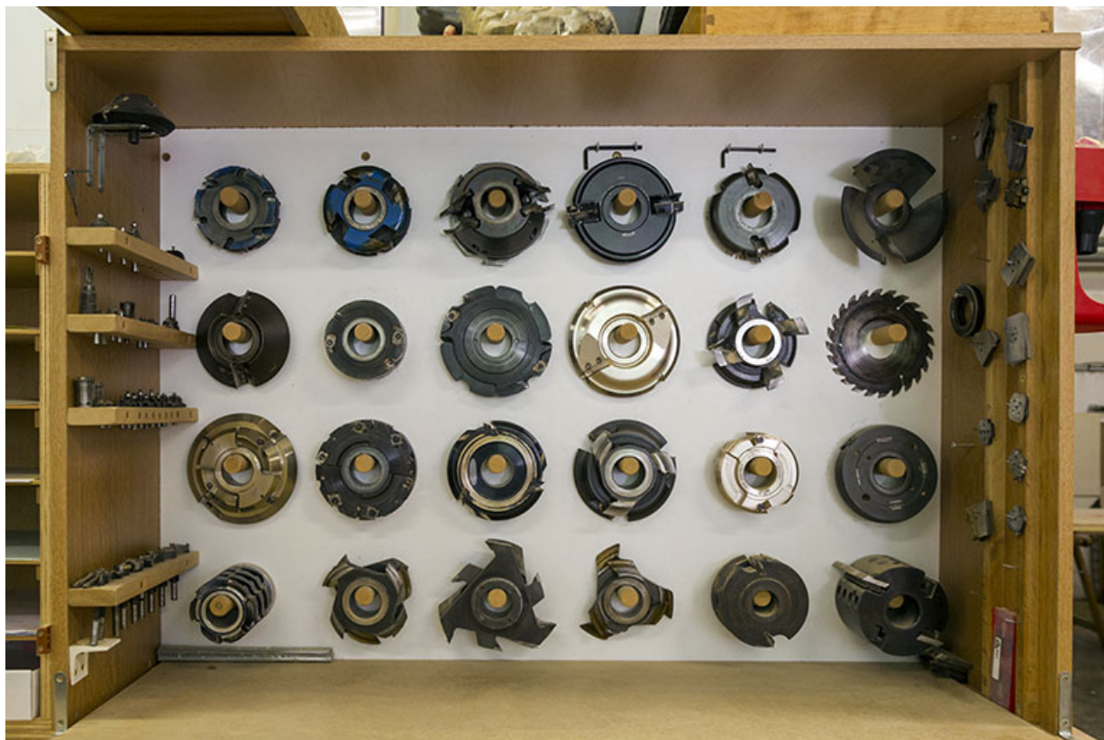
Atelier de 1990 : fraises et outils de coupe.