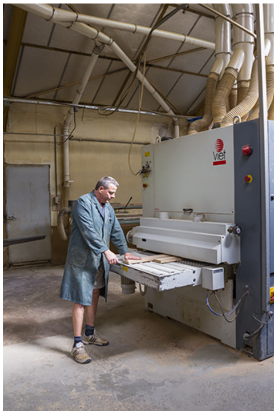
Atelier des années 1980 : ponceuse Viet.