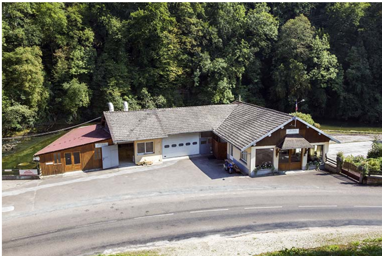
Vue plongeante sur le magasin, depuis le nord.