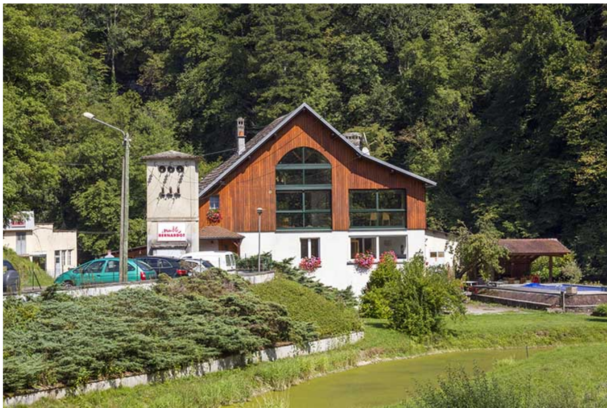
Le logement patronal et le transformateur, depuis l'ouest.