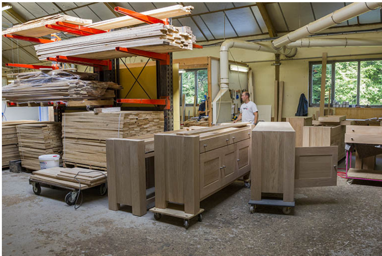
Atelier des années 1980 : stockage de bois et de meubles.