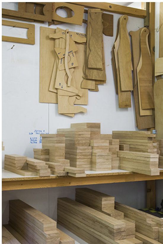
Atelier de 1990 : stock de bois et gabarits.