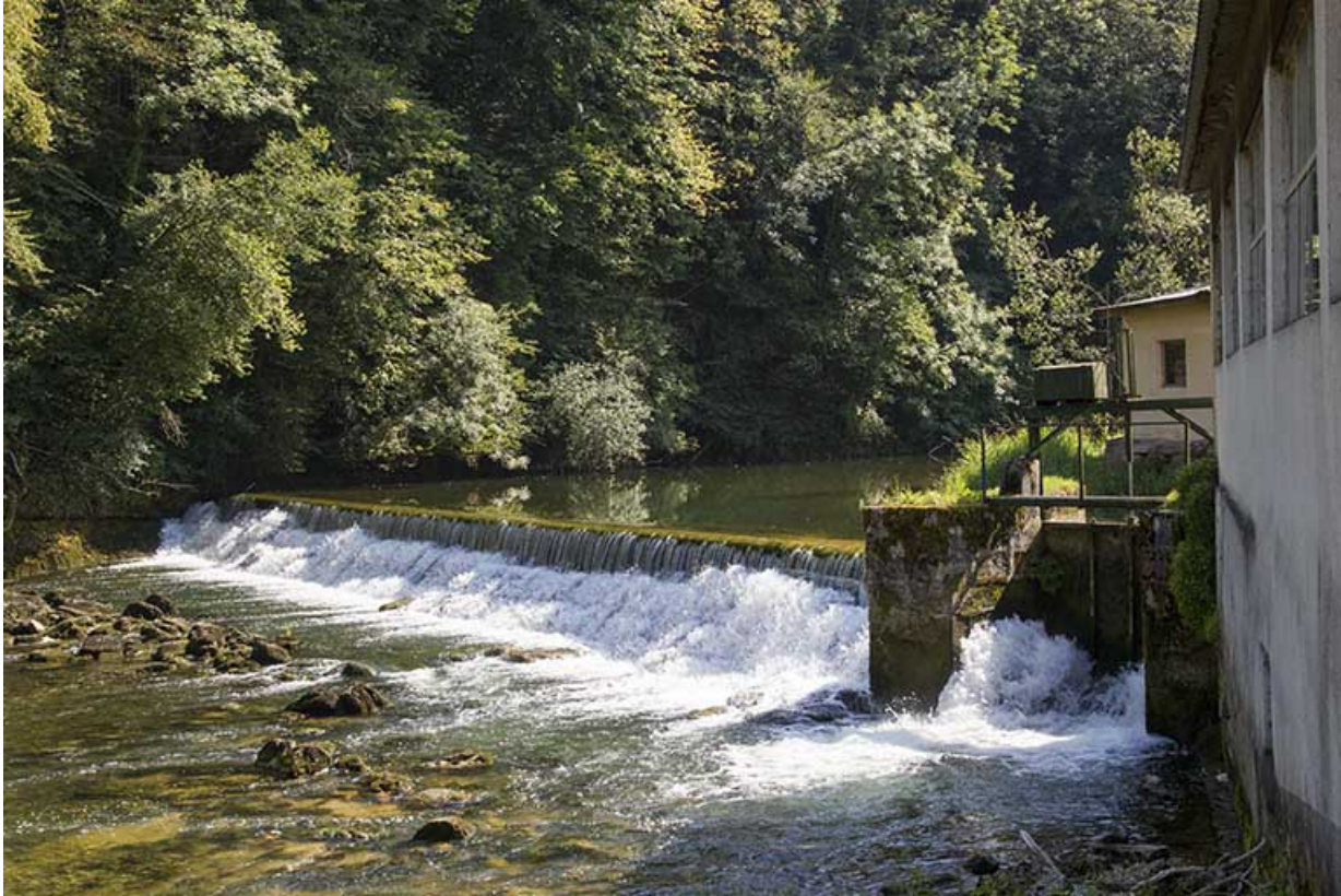
Le barrage et la vanne de décharge.