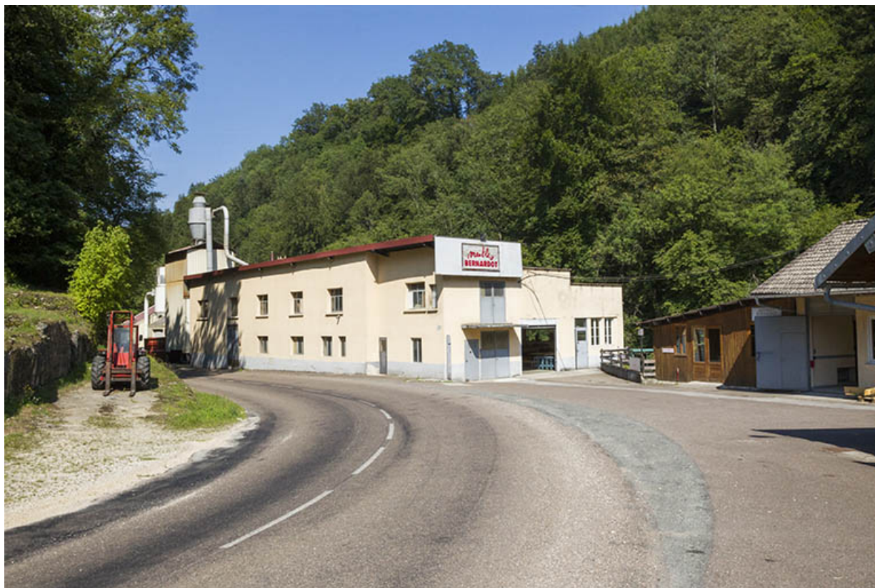
L'usine, depuis la route au sud : bâtiment refait en 1990.