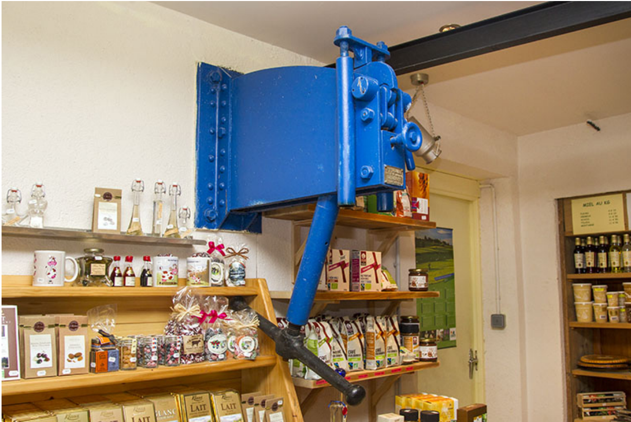
Presse à vis Jabouille.