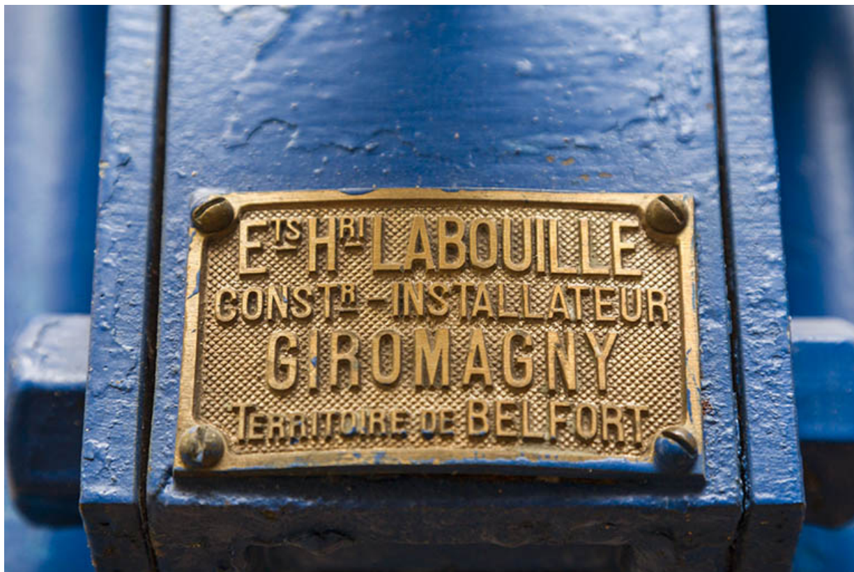
Plaque du constructeur Henri Jabouille.