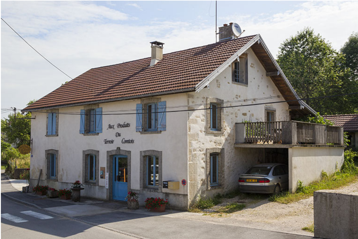
Façades antérieure et latérale droite.