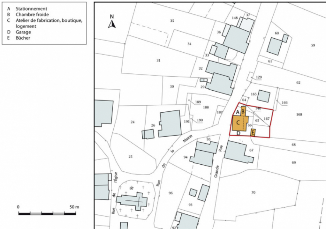
Plan-masse et de situation. Extrait du plan cadastral, 2015, section AB. 25, Provenchère, 9 Rue Grande