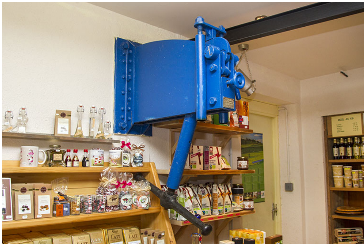
Presse à vis Jabouille.