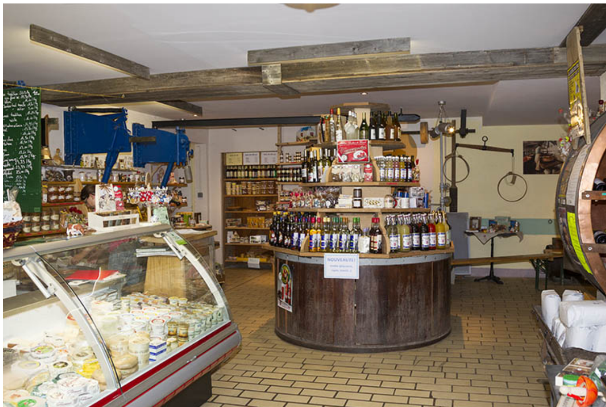
Intérieur de l'ancien atelier de fabrication.