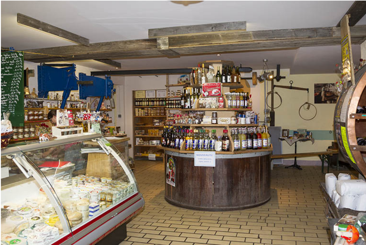
Intérieur de l'ancien atelier de fabrication.