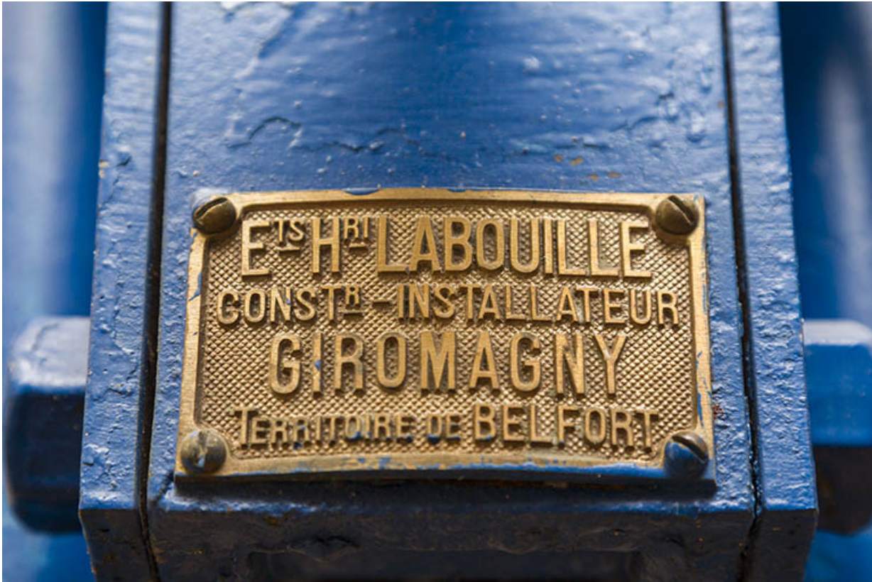
Plaque du constructeur Henri Jabouille.