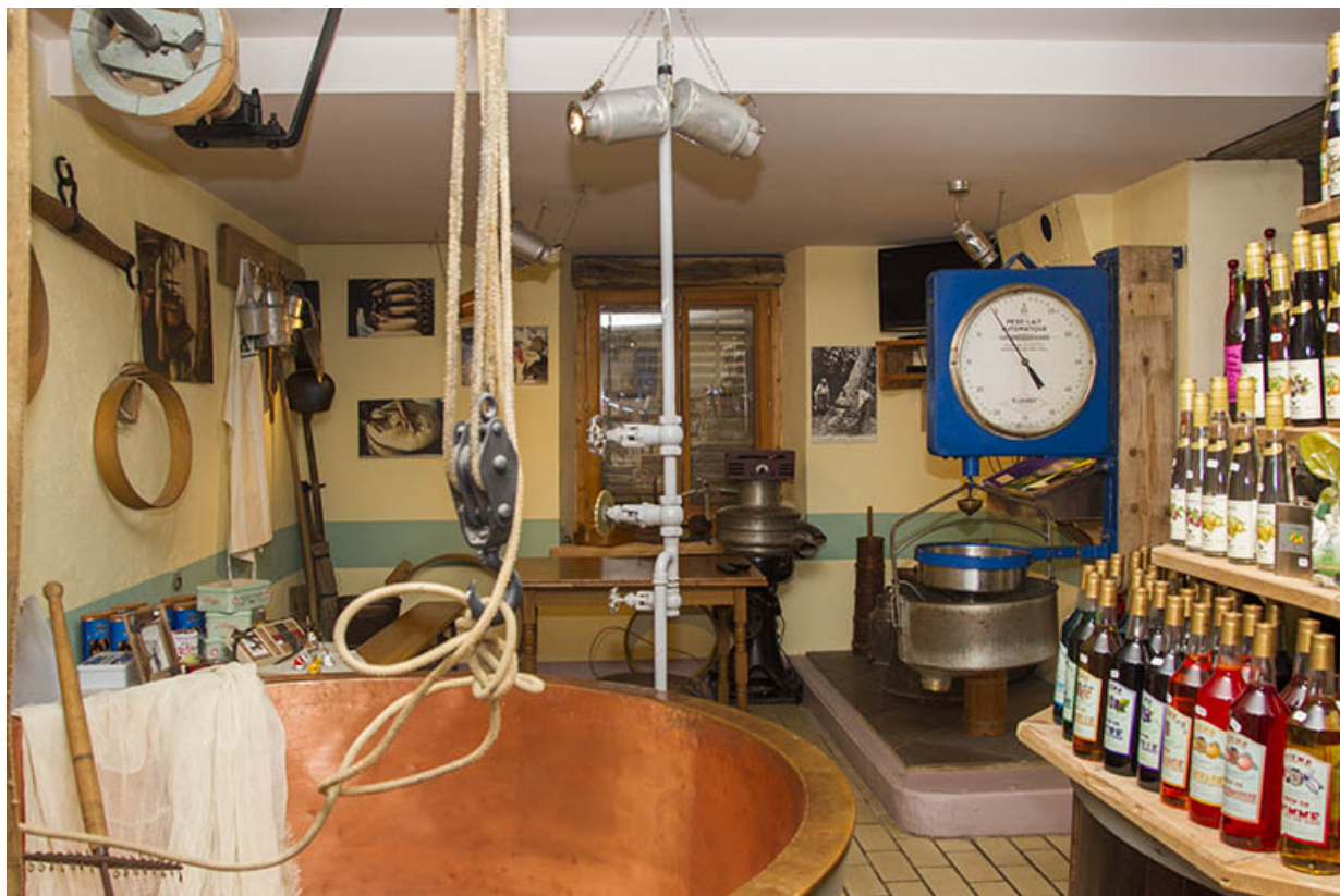
Cuve de fabrication, pèse-lait, écrémeuse et instruments de fromager. 25, Provenchère, 9 Rue Grande