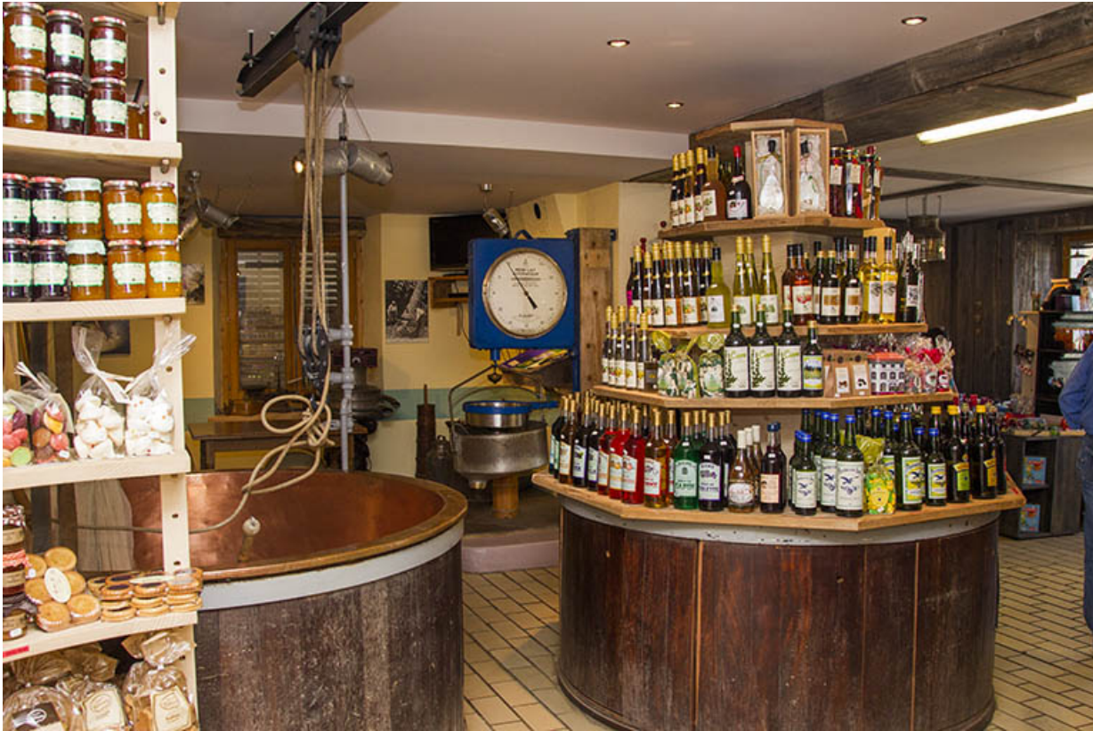
Deux cuves de fabrication.