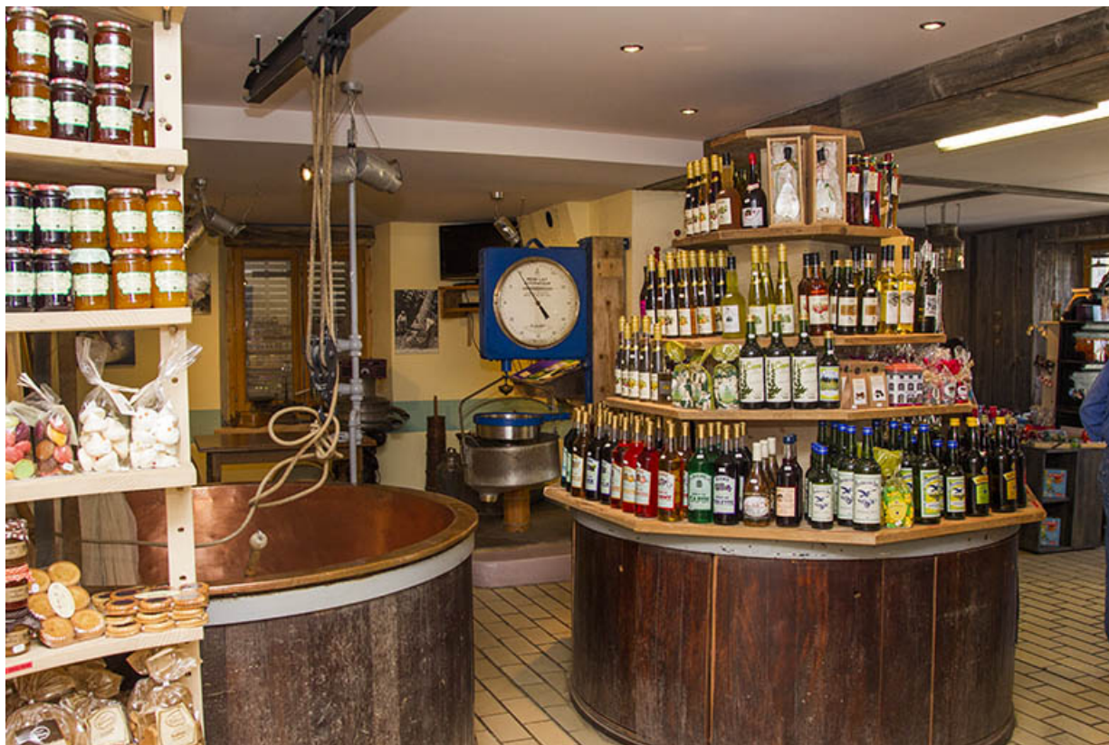
Deux cuves de fabrication. 25, Provenchère, 9 Rue Grande