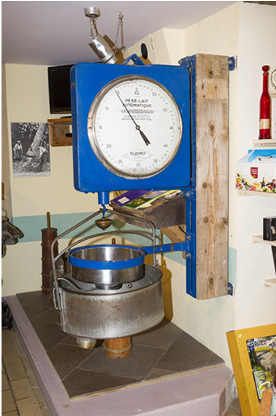
Pèse-lait Le Montagnard.