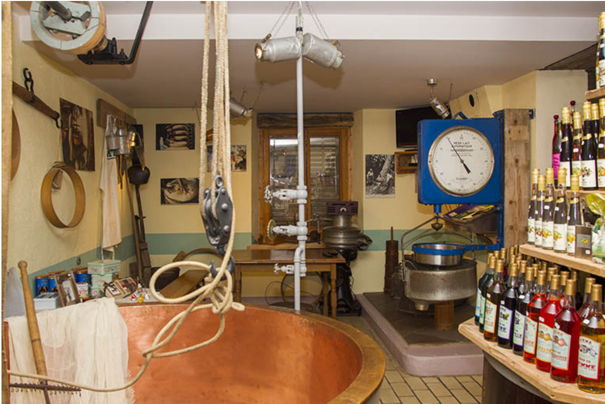
Cuve de fabrication, pèse-lait, écrémeuse et instruments de fromager. 25, Provençère, 9 Rue Grande