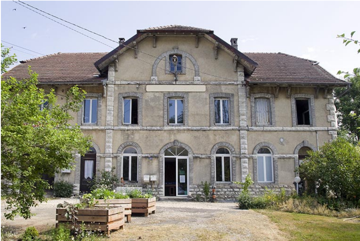
Façade antérieure : avant-corps central.