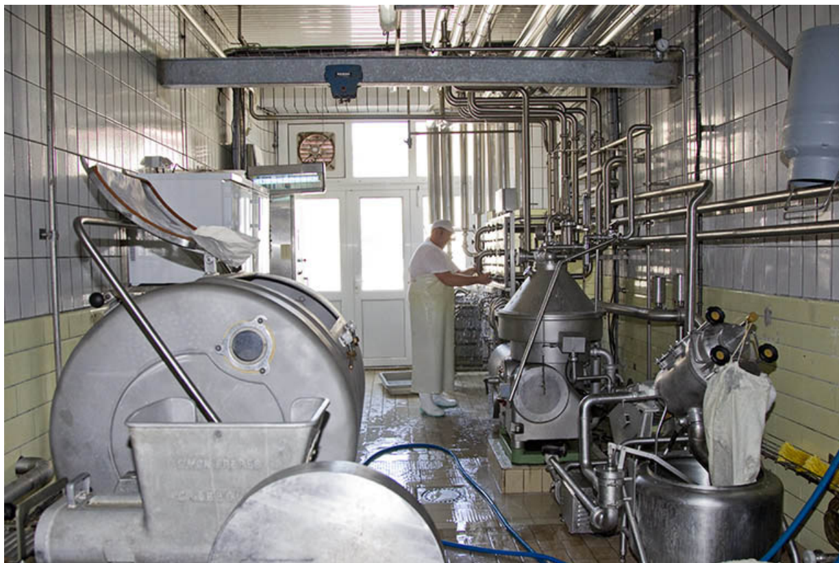
Salle de la baratte (à gauche) et de l'écrémeuse (à droite). 25, Belleherbe, 22 Grande Rue