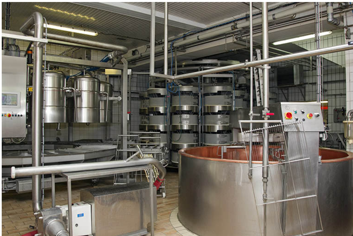
Intérieur de l'atelier de fabrication. Au premier-plan une cuve, au second le groupe de moulage (à gauche) et celui de pressage (à droite).