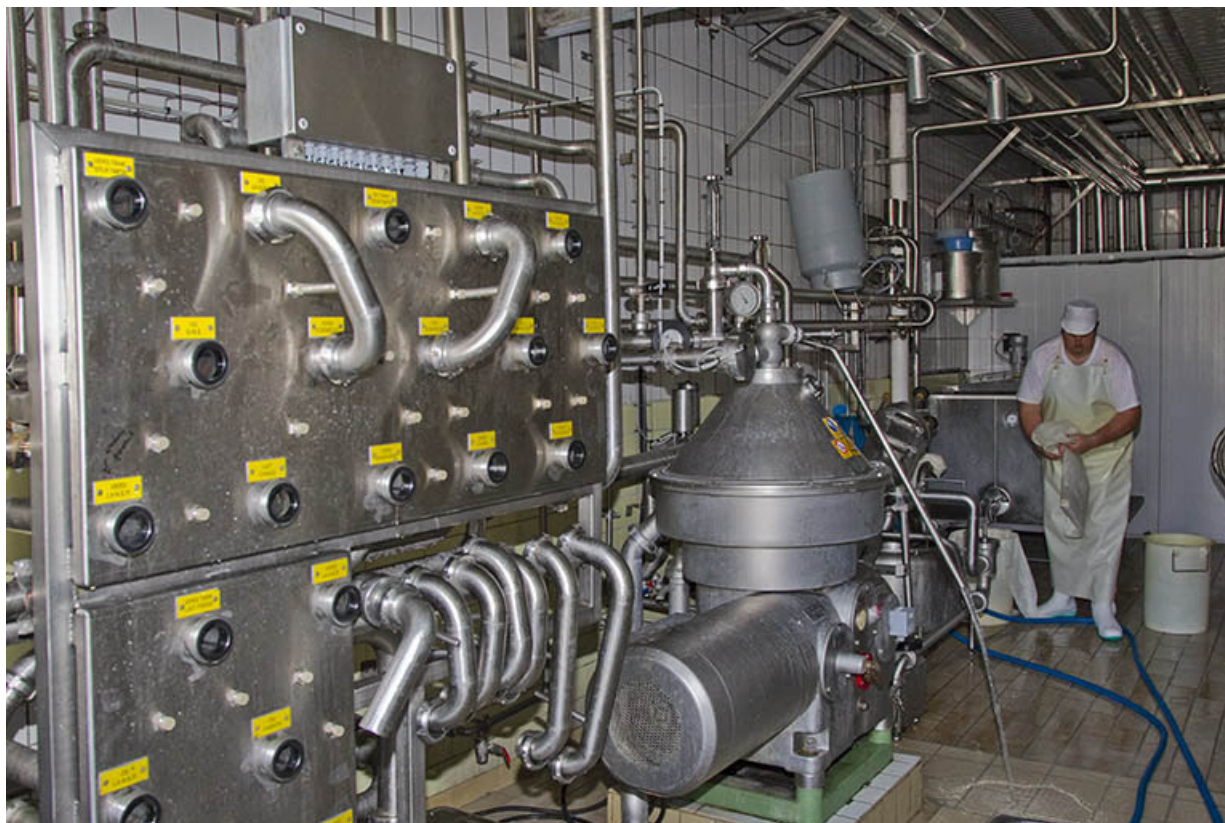
Panneaux de gestion des flux de liquide. 25, Belleherbe, 22 Grande Rue