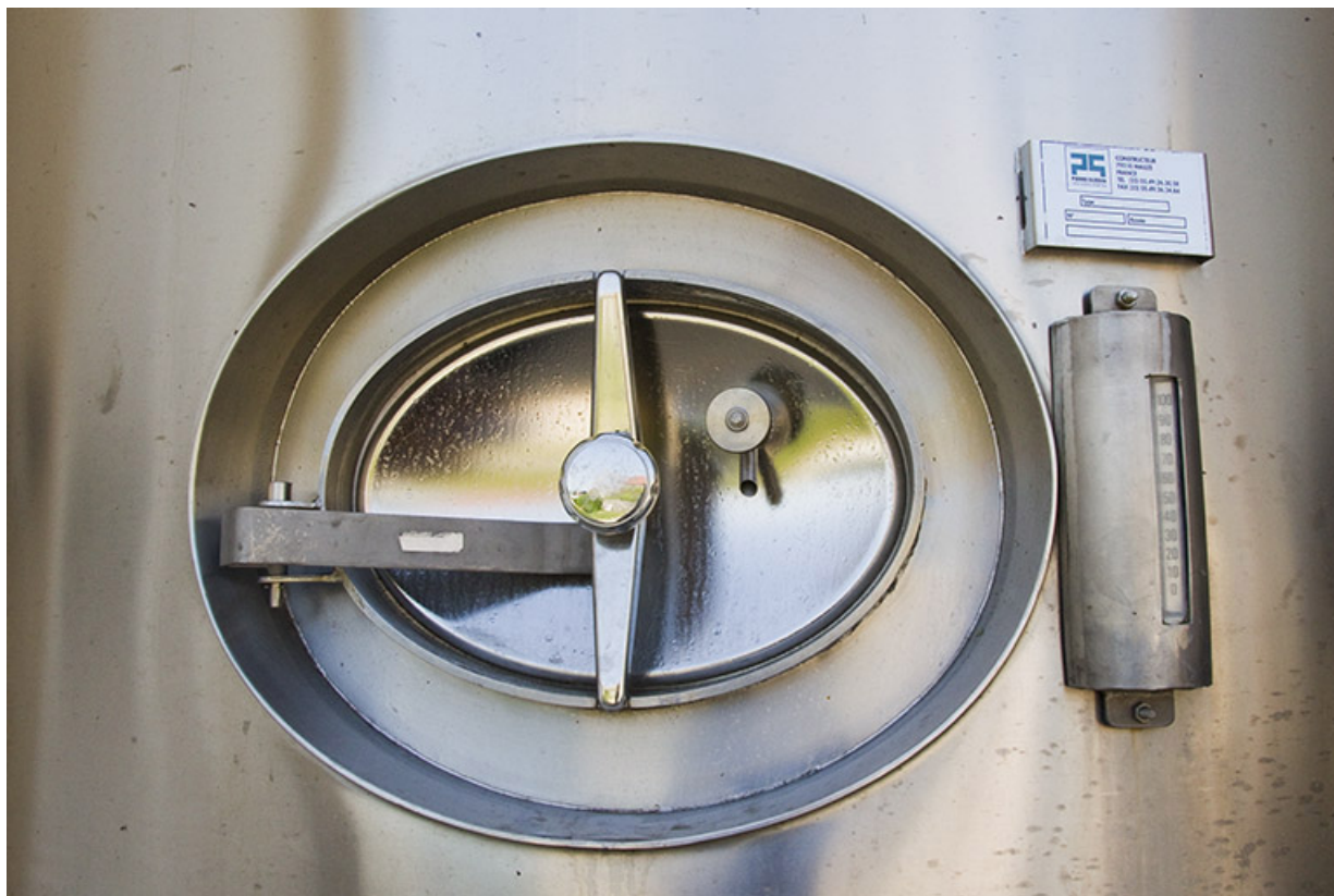
Porte d'une cuve de stockage.