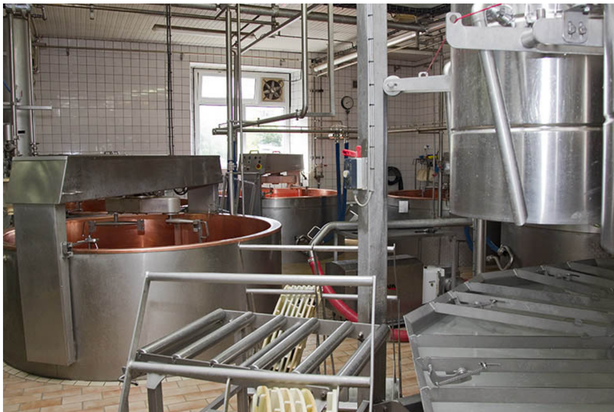
Intérieur de l'atelier de fabrication, depuis le groupe de moulage. 25, Belleherbe, 22 Grande Rue