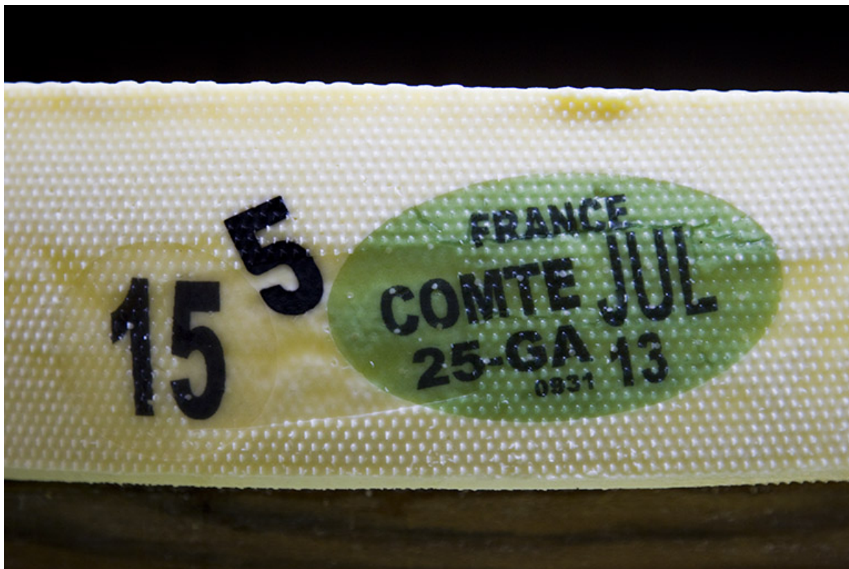
Plaque verte de caséine ("carte d'identité" de la meule de comté).