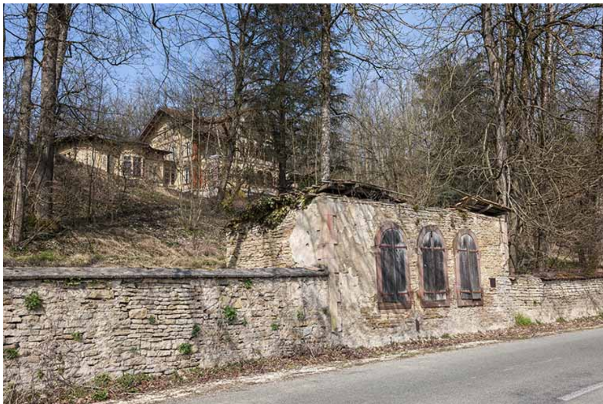
Au premier plan, local de la machine élévatoire du château d'eau. 25, Appenans route départementale 29