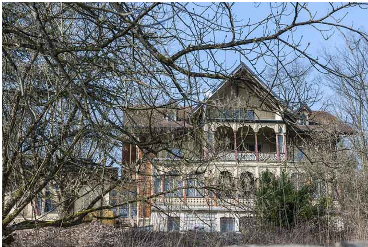
Façade sud du logement patronal.