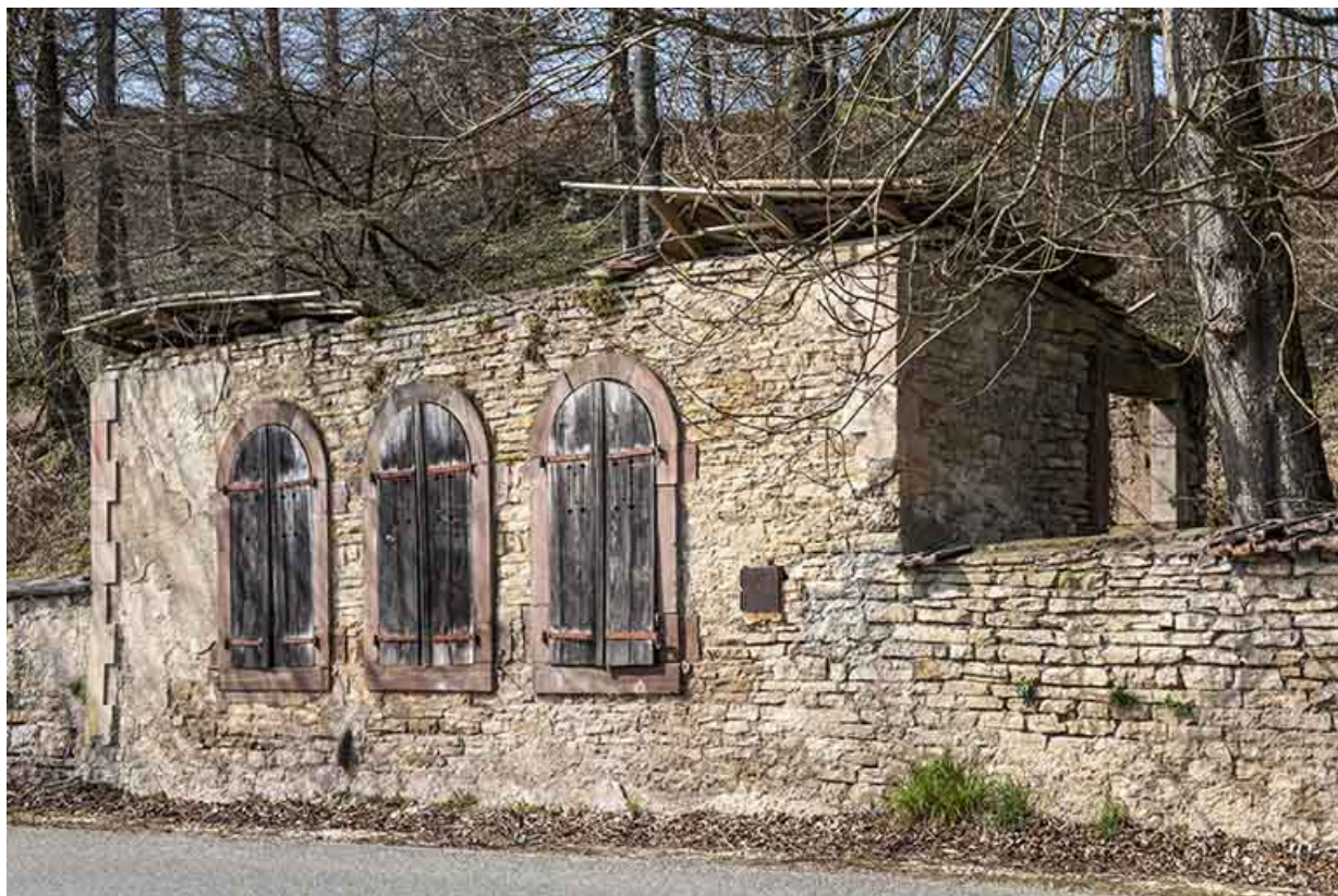
Vestiges du local de la machine élévatoire du château d'eau.