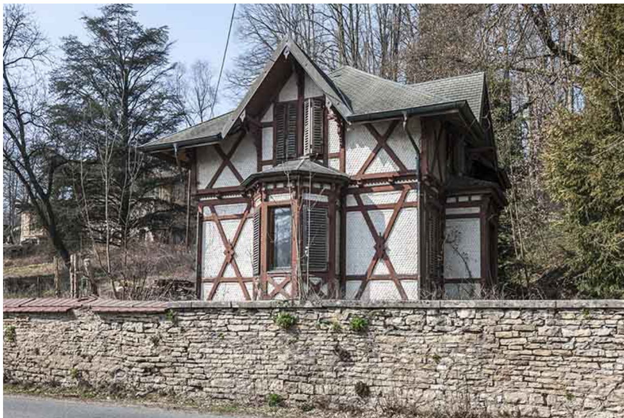
Façade sud de la conciergerie.