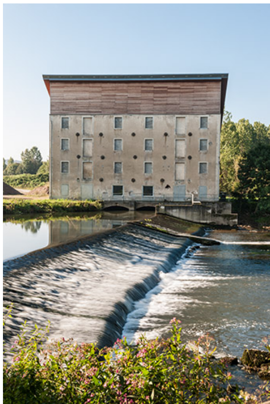
Façade nord depuis l'extrémité du barrage. 25, Avilley rue du Moulin