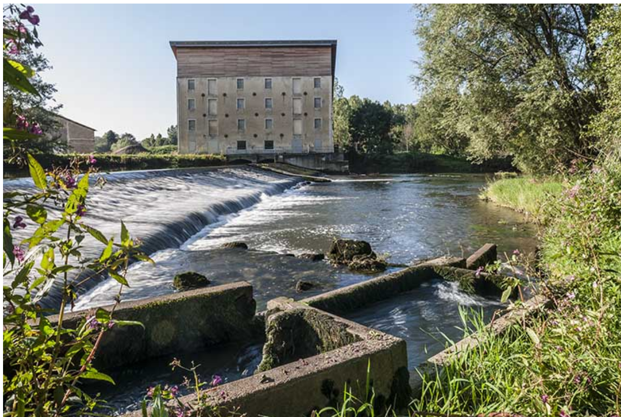
vue d'ensemble depuis le nord. 25, Avilley rue du Moulin