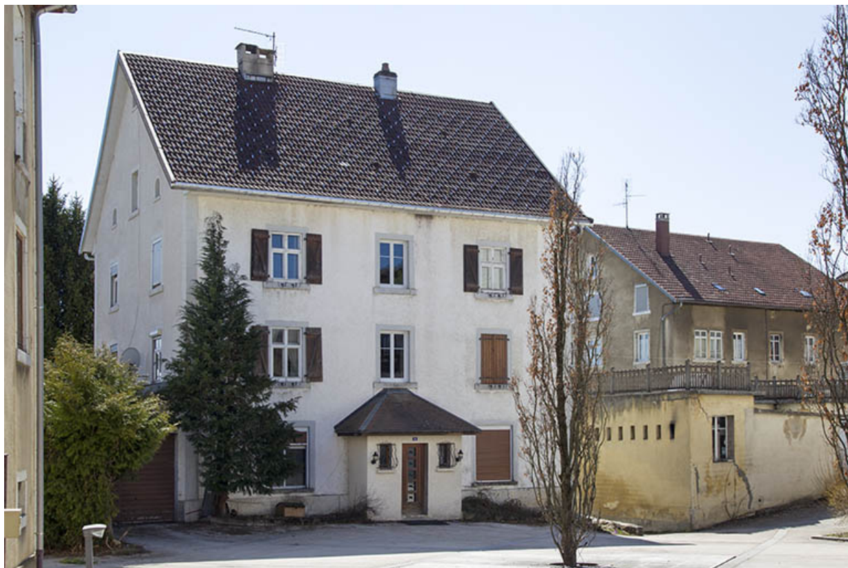
Façade antérieure, de trois quarts gauche. 25, Charquemont, 12 place de l' Hôtel de Ville