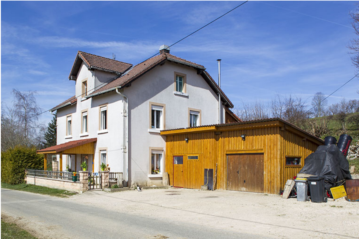
Vue d'ensemble, depuis l'est.