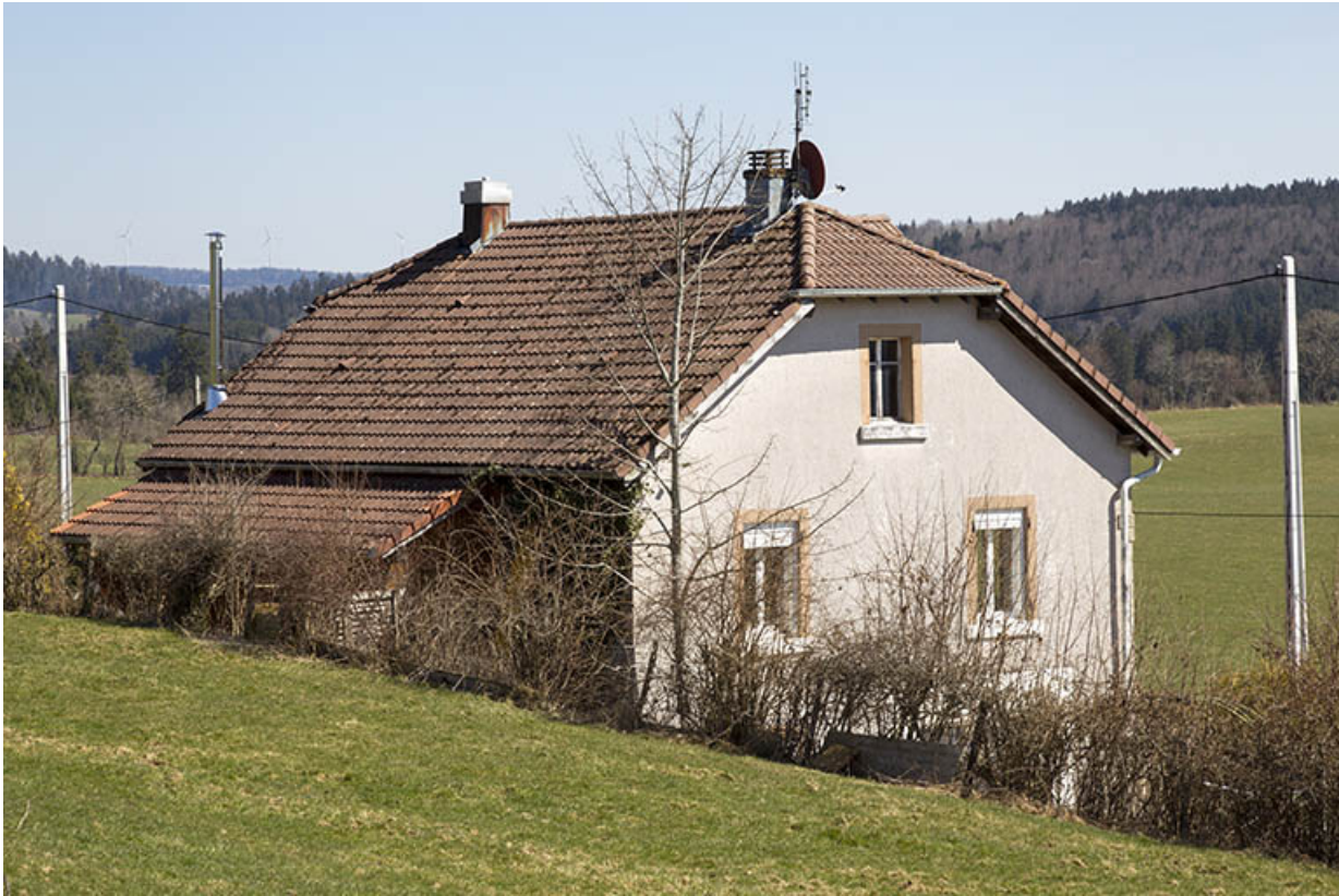
Façades postérieure et latérale droite.