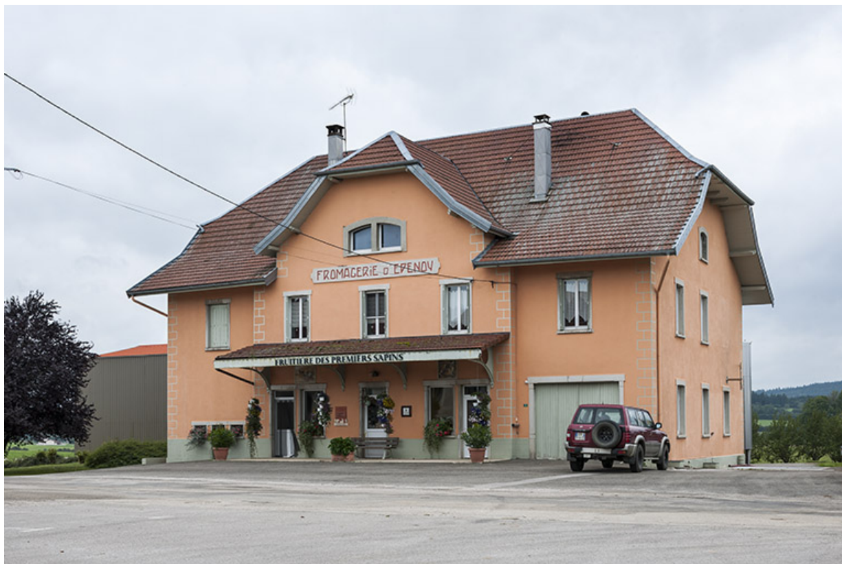
Vue de trois quarts droite.