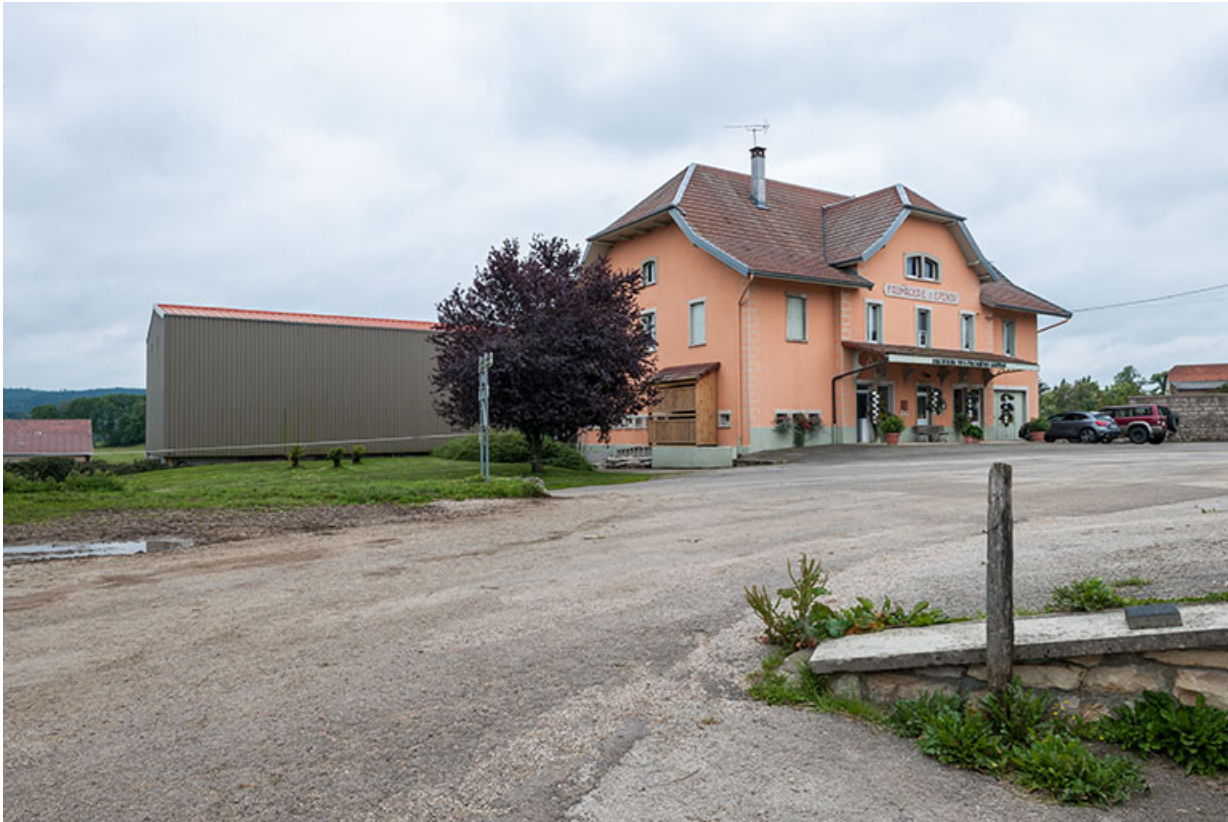
Vue d'ensemble depuis le nord.