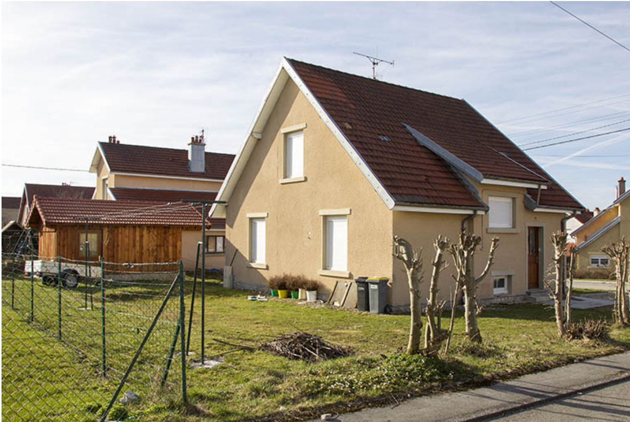
Façades latérale gauche et postérieure.