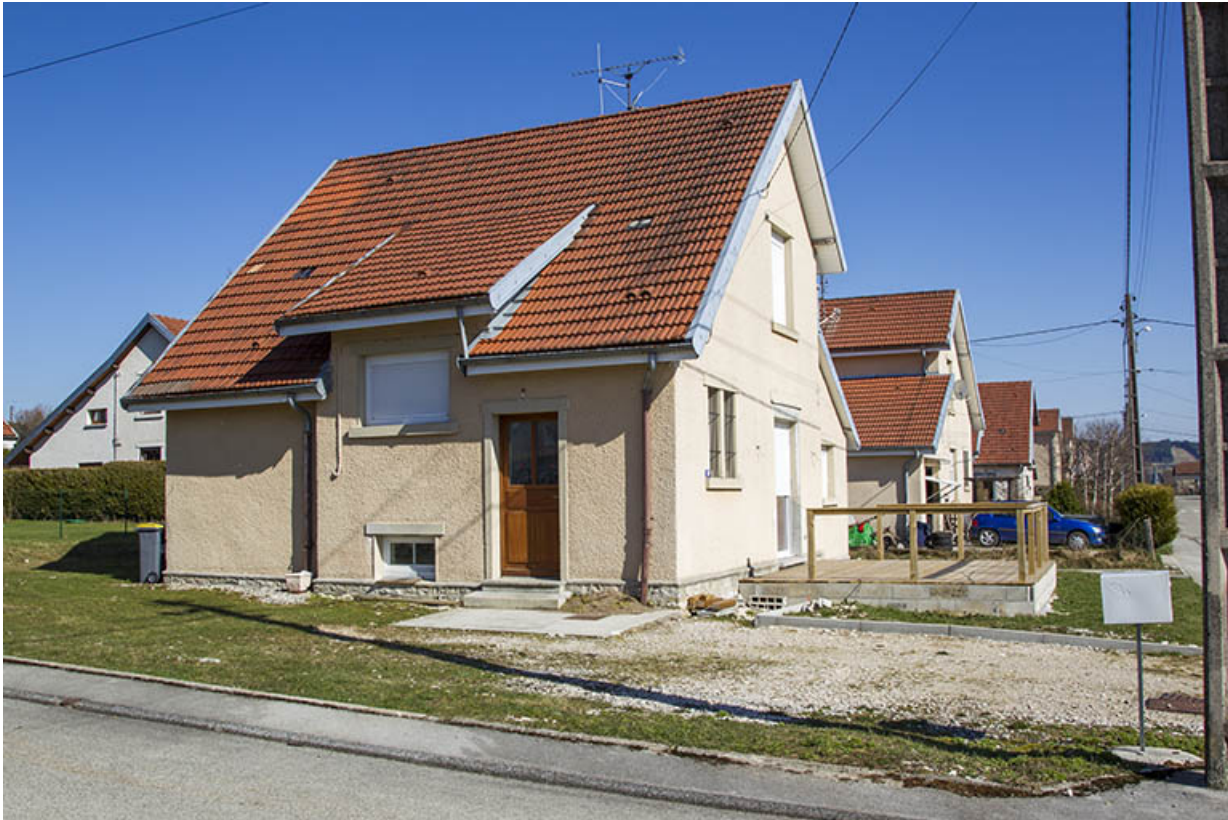
Façades latérale gauche et antérieure.