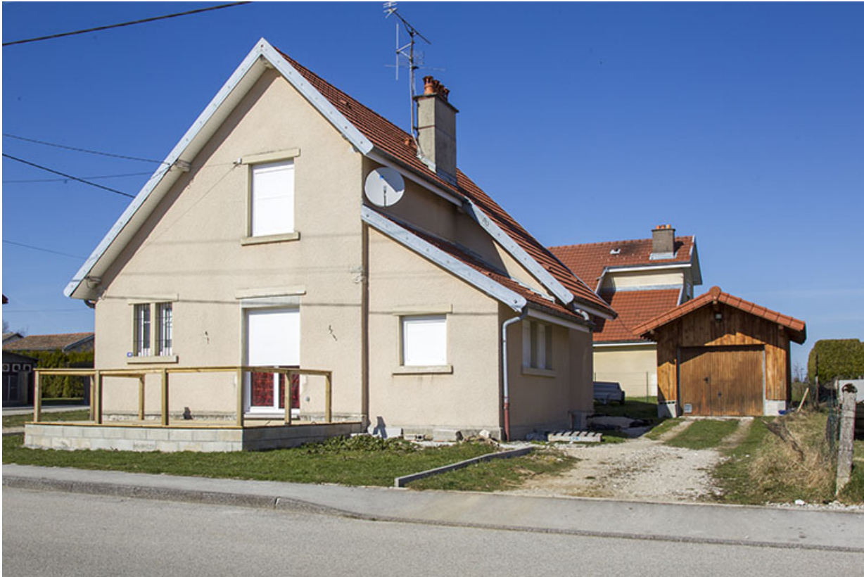
Vue d'ensemble, depuis le sud (façades antérieure et latérale droite). 25, Charquemont, 20 rue des Cités