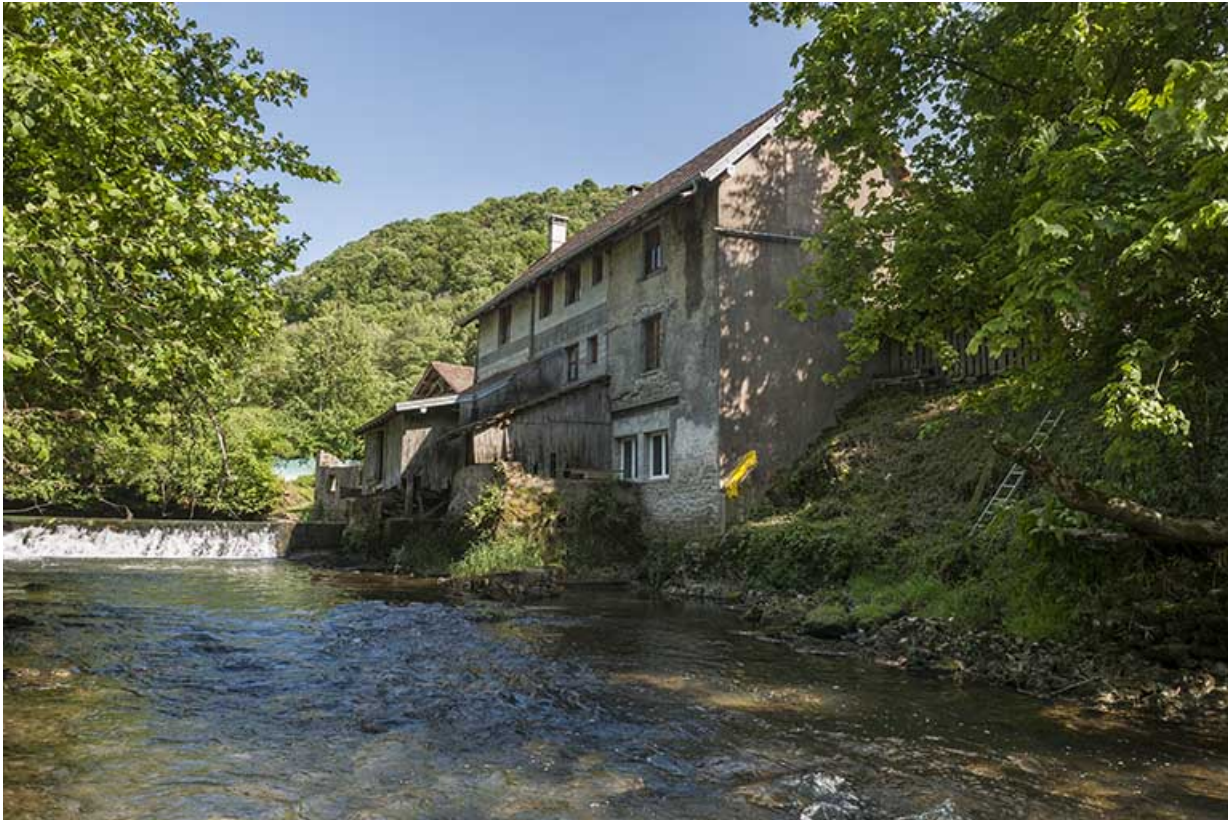
Vue d'ensemble depuis l'aval.

25, Guillon-les-Bains, 4 rue de la Taillanderie