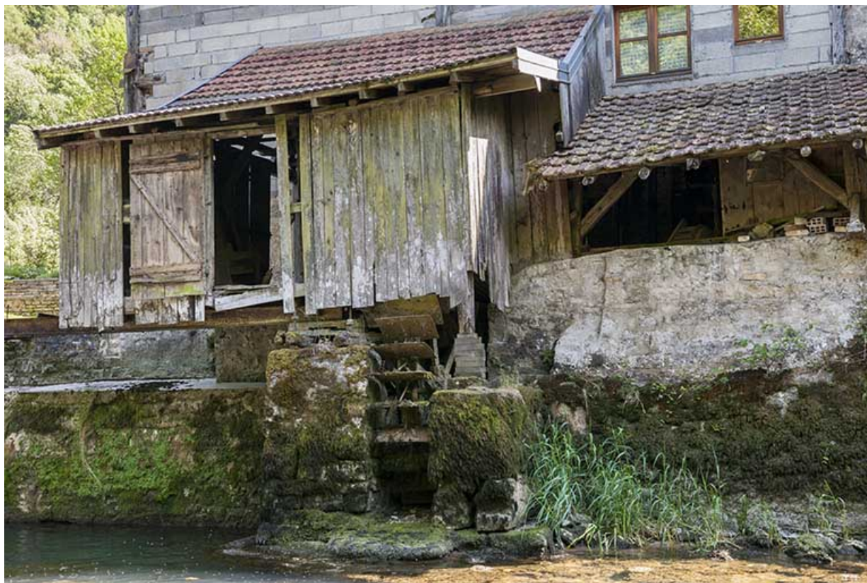
Façade nord. Le bâtiment d'eau.

25, Guillon-les-Bains, 4 rue de la Taillanderie