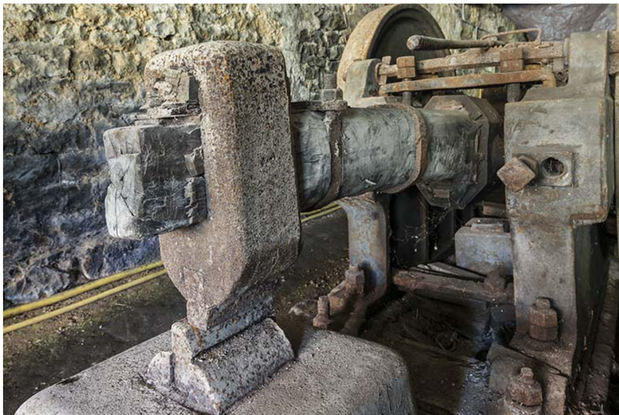
Tête du martinet (côté droit).

25, Guillon-les-Bains, 4 rue de la Taillanderie