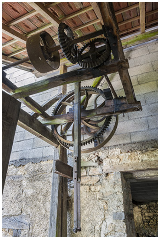
Bâtiment d'eau. Système de transmission des soufflets de la forge (disparus). 25, Guillon-les-Bains, 4 rue de la Taillanderie