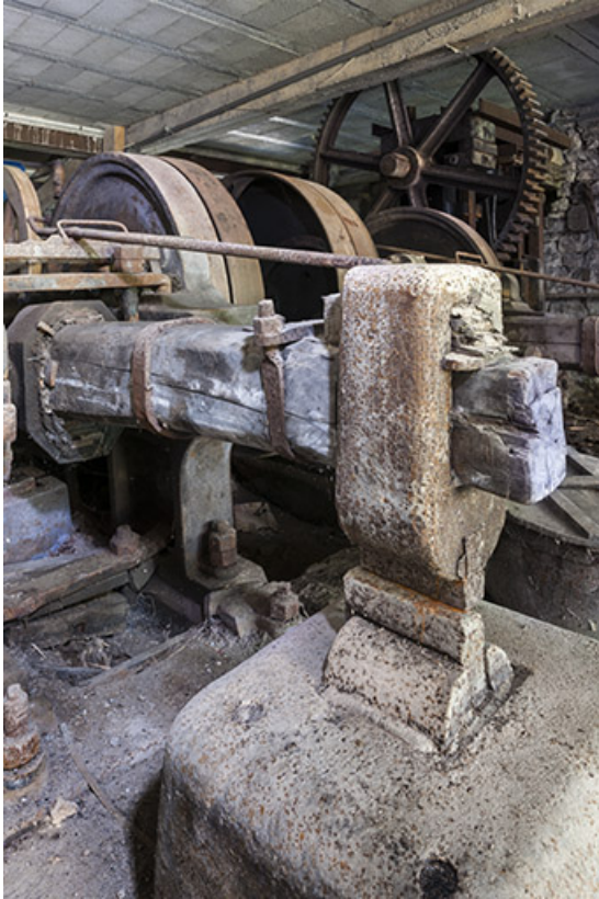
Tête du martinet (côté gauche).

25, Guillon-les-Bains, 4 rue de la Taillanderie