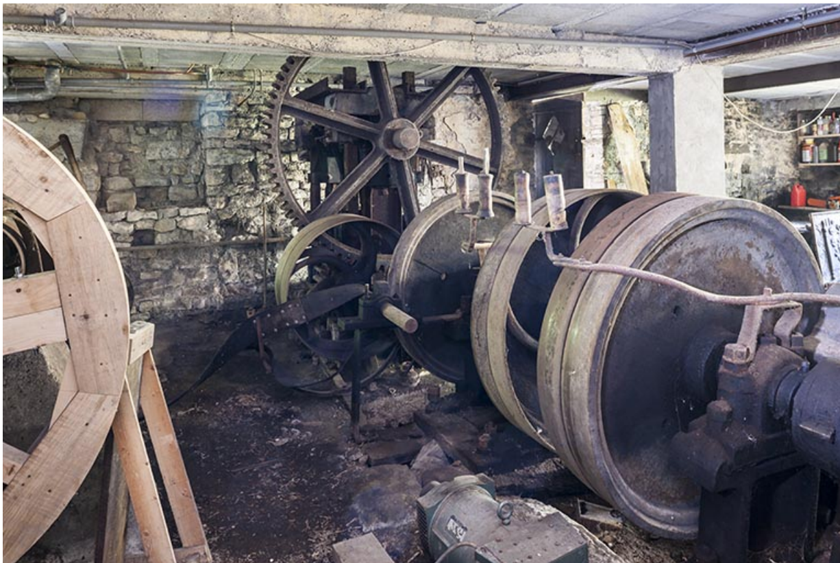
Système d'entraînement des martinets (volants de transmission et d'inertie). 25, Guillon-les-Bains, 4 rue de la Taillanderie