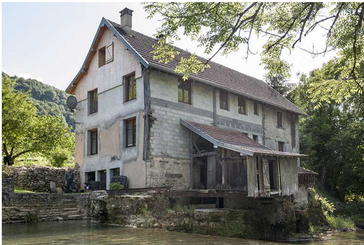
Vue de trois quarts, depuis la rive droite.

25, Guillon-les-Bains, 4 rue de la Taillanderie