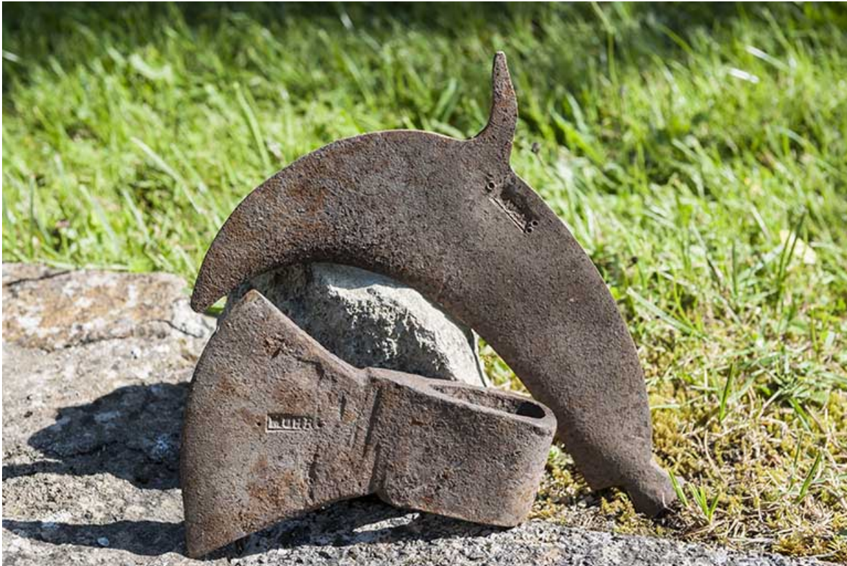
Outils estampillés du taillandier (Muhr).