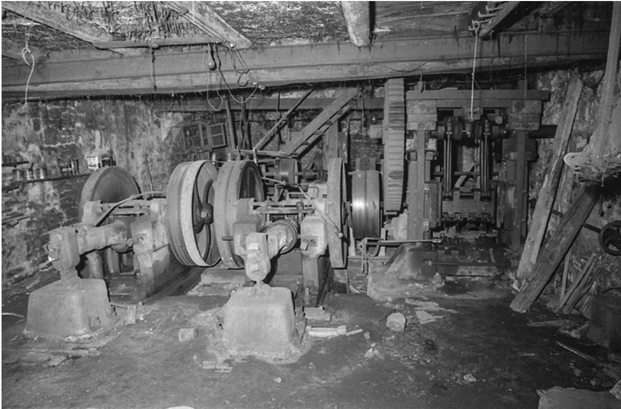
Les martinets et la presse à forger en 1980. 25, Guillon-les-Bains, 4 rue de la Taillanderie