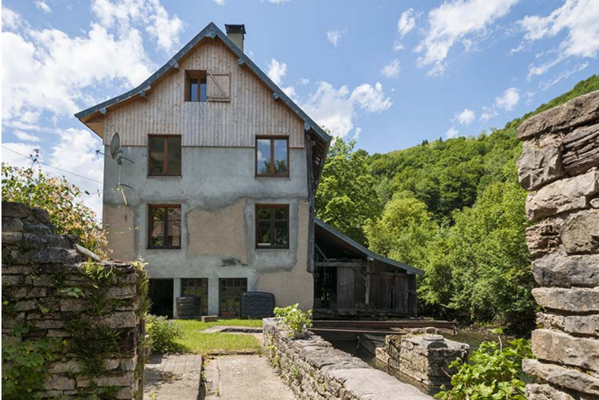
Pignon est (atelier de taillanderie à l'étage de soubassement).

25, Guillon-les-Bains, 4 rue de la Taillanderie