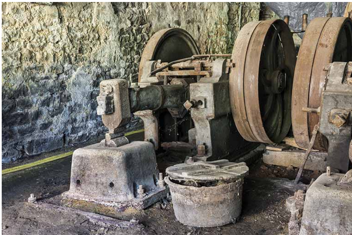
Le martinet sud.

25, Guillon-les-Bains, 4 rue de la Taillanderie