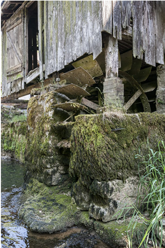
Bâtiment d'eau. Roue en dessous.

25, Guillon-les-Bains, 4 rue de la Taillanderie