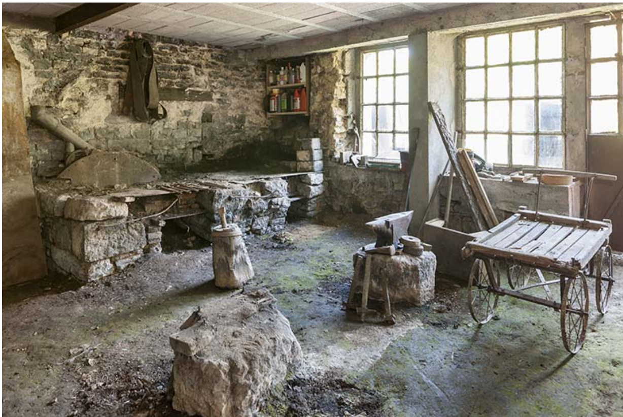
Partie est de l'atelier.

25, Guillon-les-Bains, 4 rue de la Taillanderie