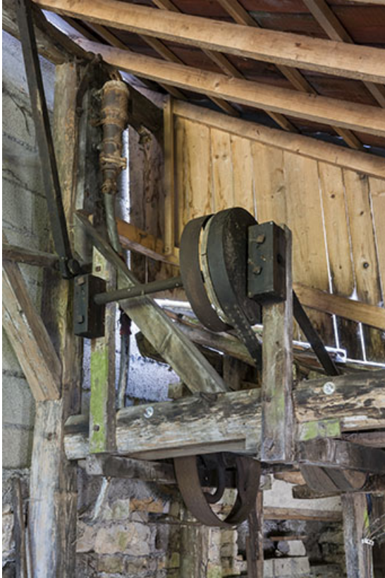
Bâtiment d'eau. Transmission supérieure au droit des turbines.

25, Guillon-les-Bains, 4 rue de la Taillanderie