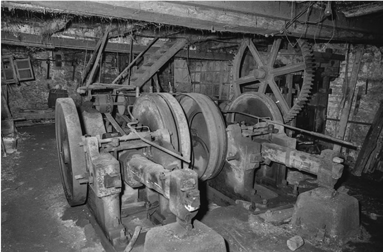
Vue rapprochée des martinets en 1980.