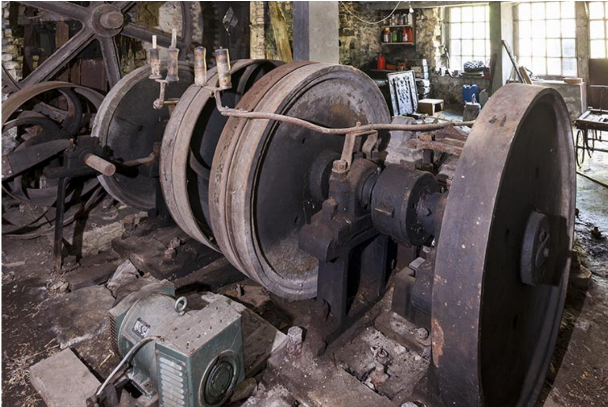
Volants du martinet et arbre à cames.

25, Guillon-les-Bains, 4 rue de la Taillanderie