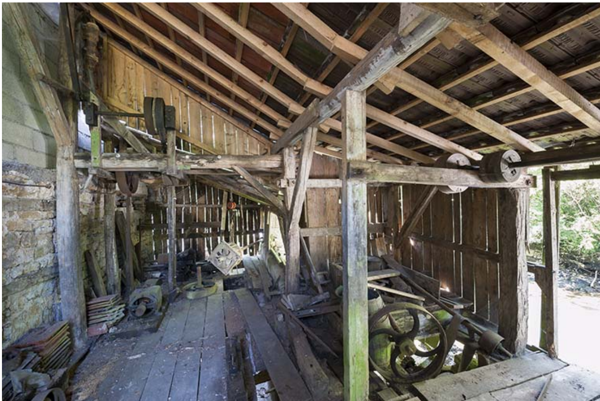
Vue intérieure du bâtiment d'eau.

25, Guillon-les-Bains, 4 rue de la Taillanderie