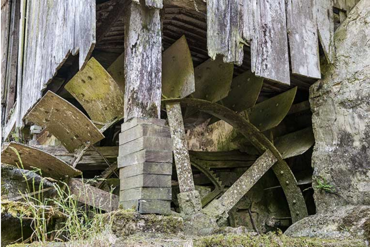
Partie supérieure de la roue en dessous. 25, Guillon-les-Bains, 4 rue de la Taillanderie