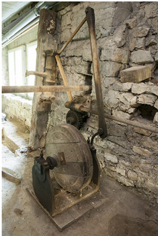
Système d'actionnement de la pompe à eau (bielle-manivelle).

25, Guillon-les-Bains, 4 rue de la Taillanderie