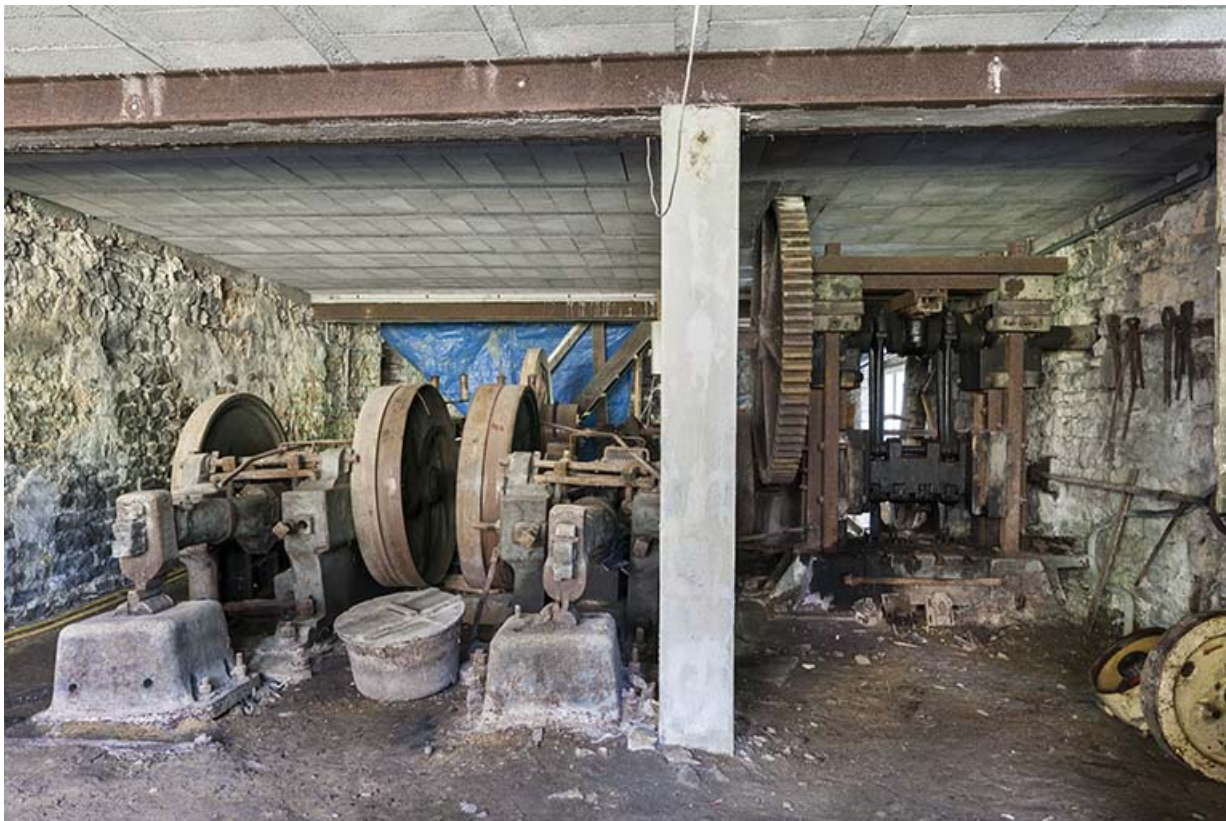
Vue d'ensemble de l'atelier.

25, Guillon-les-Bains, 4 rue de la Taillanderie