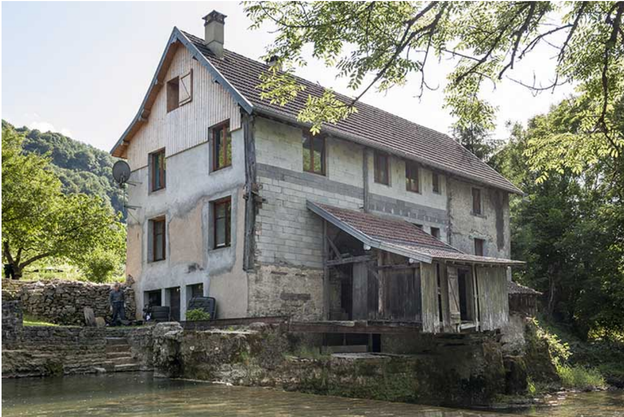
Vue de trois quarts, depuis la rive droite. 25, Guillon-les-Bains, 4 rue de la Taillanderie