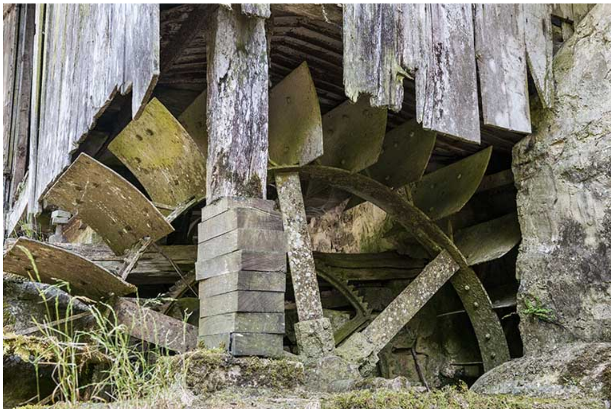
Partie supérieure de la roue en dessous.

25, Guillon-les-Bains, 4 rue de la Taillanderie