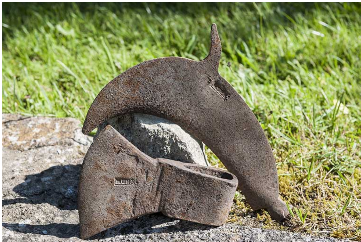
Outils estampillés du taillandier (Muhr).