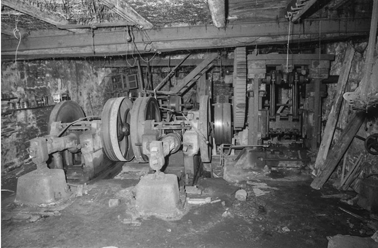
Les martinets et la presse à forger en 1980. 25, Guillon-les-Bains, 4 rue de la Taillanderie