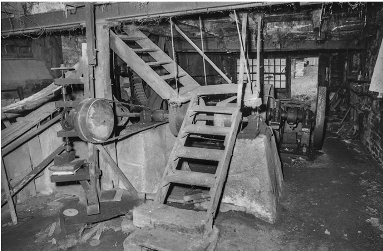
Vue intérieure de l'atelier.

25, Guillon-les-Bains, 4 rue de la Taillanderie