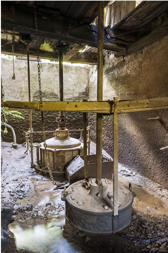
La chambre d'eau des turbines.

25, Guillon-les-Bains, 4 rue de la Taillanderie