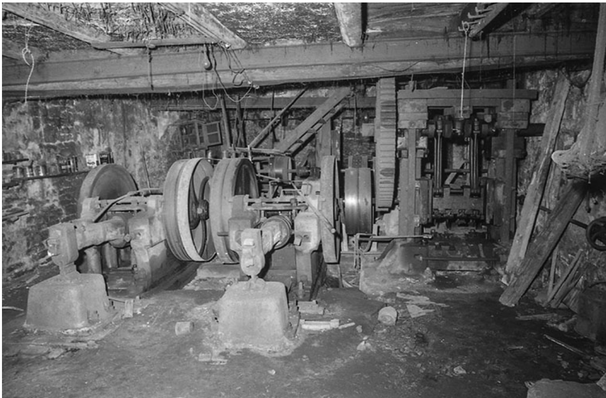
Les martinets et la presse à forger en 1980.

25, Guillon-les-Bains, 4 rue de la Taillanderie