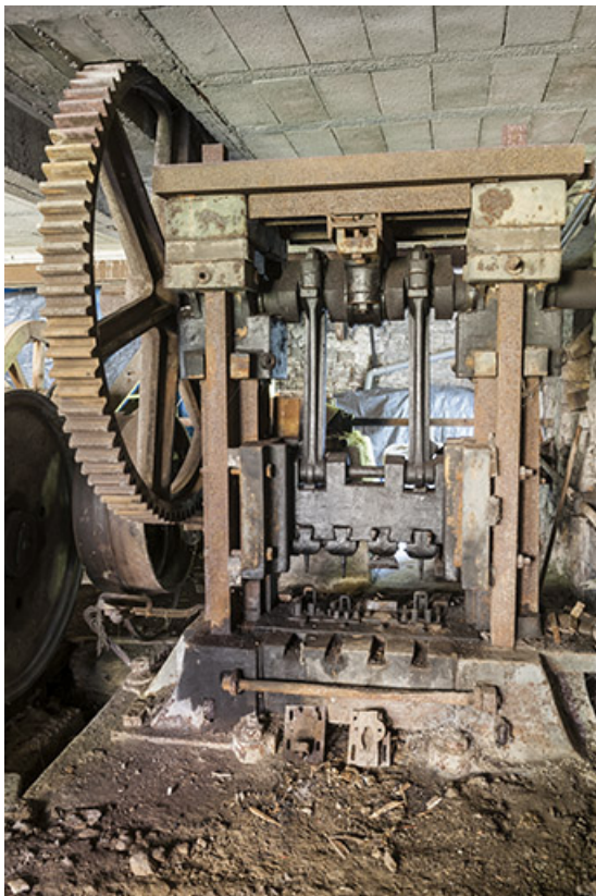
Presse à forger.

25, Guillon-les-Bains, 4 rue de la Taillanderie