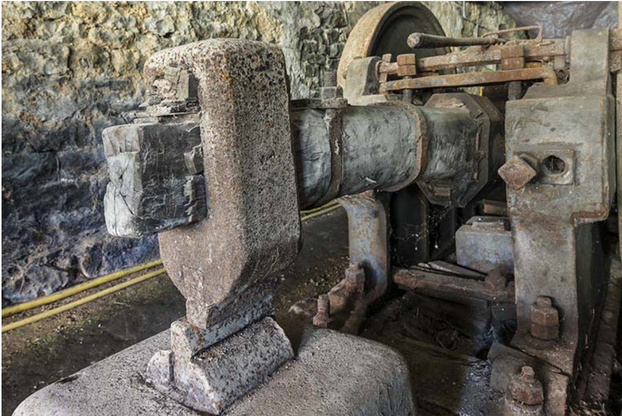
Tête du martinet (côté droit).

25, Guillon-les-Bains, 4 rue de la Taillanderie