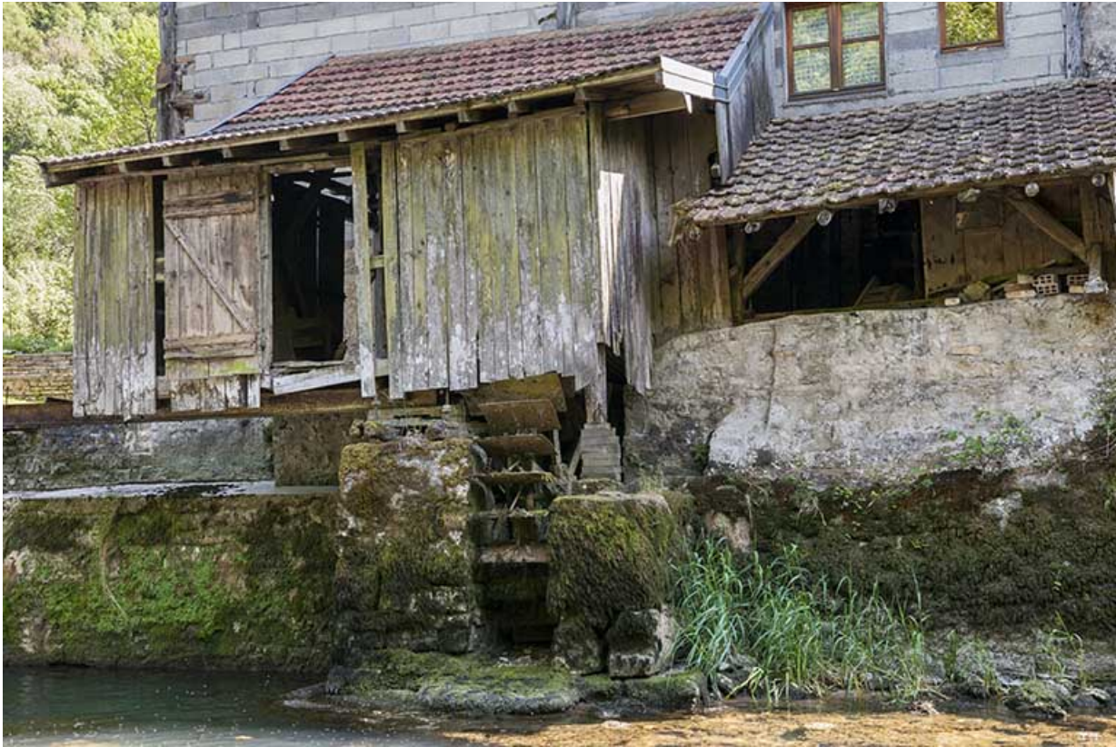
Façade nord. Le bâtiment d'eau.

25, Guillon-les-Bains, 4 rue de la Taillanderie