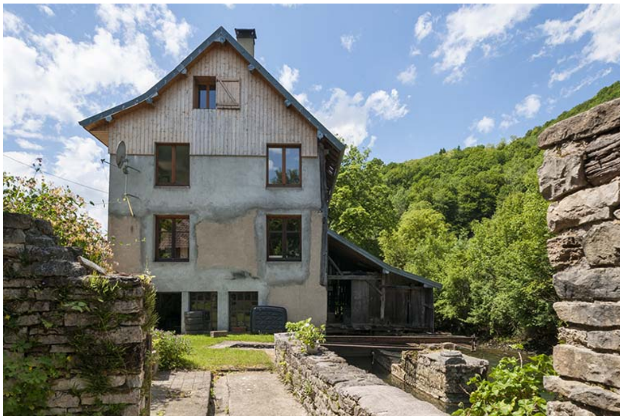
Pignon est (atelier de taillanderie à l'étage de soubassement).

25, Guillon-les-Bains, 4 rue de la Taillanderie