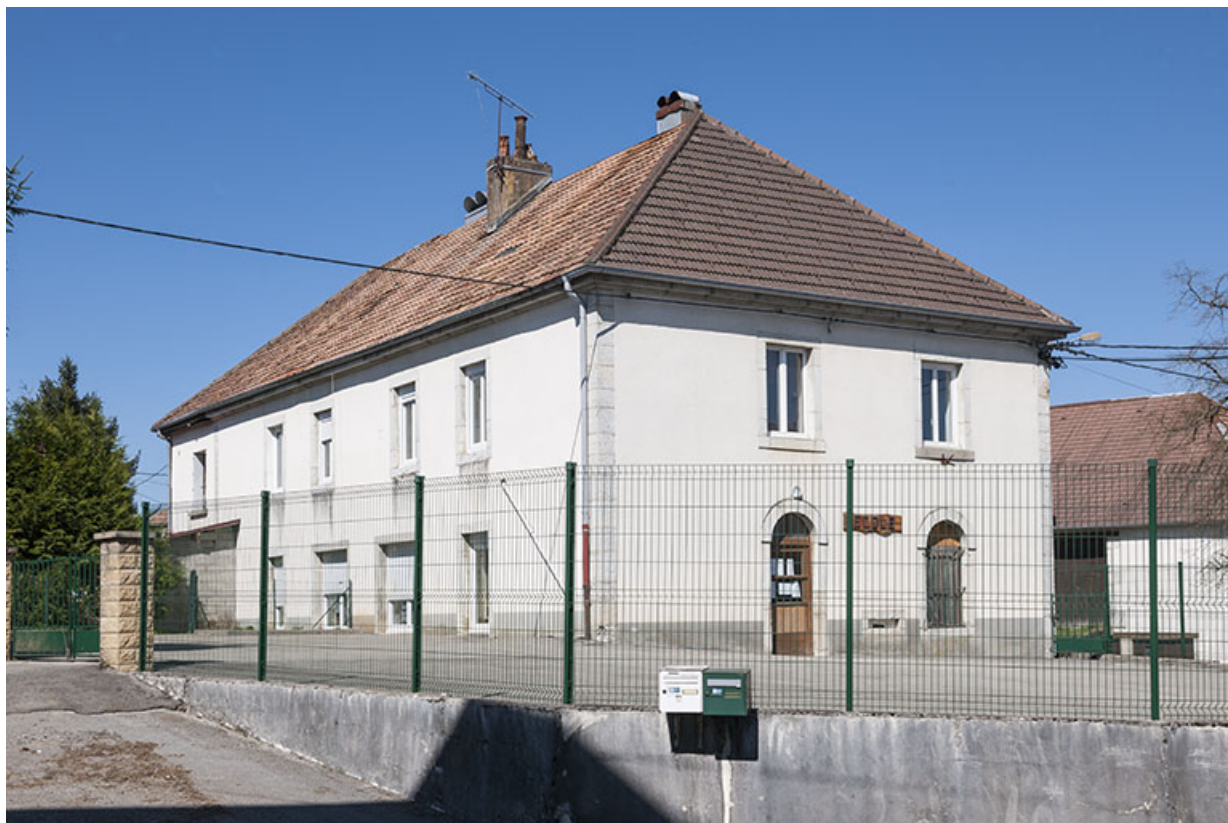
Vue depuis l'est (façade et pignon de l'école). 25, Fallérans, 22 Grande Rue