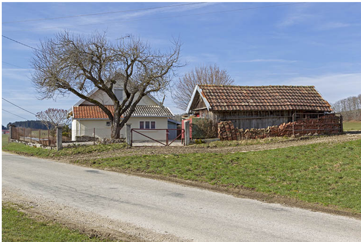
Vue d'ensemble, depuis le nord (façade latérale droite). 25, Charquemont rue du Crôt