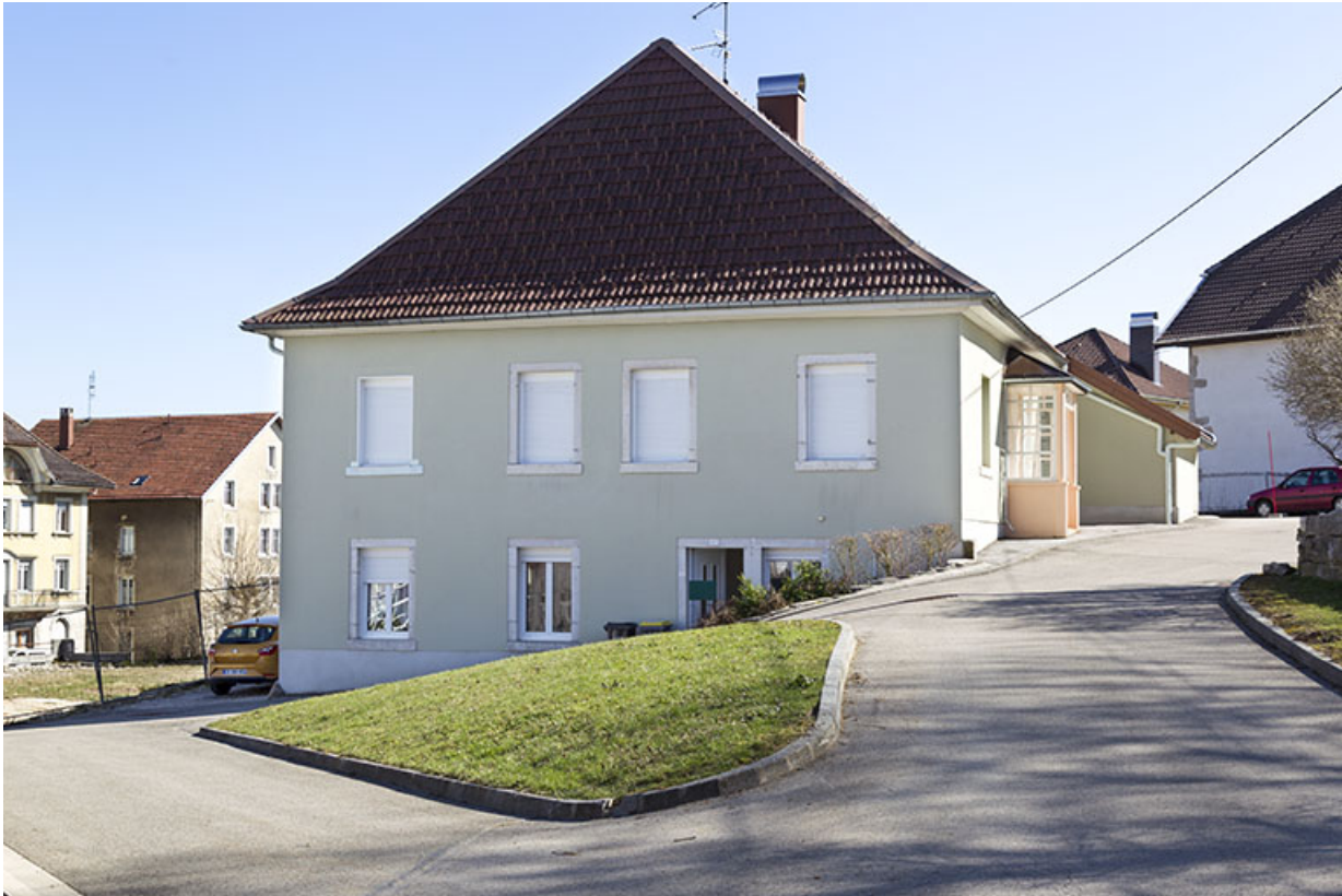
Façade latérale gauche, de trois quarts droite. 25, Charquemont, 3 et 3 bis rue du Général Leclerc