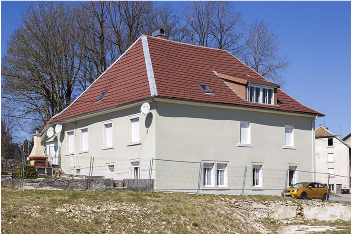
Façades postérieure et latérale droite.

25, Charquemont, 3 et 3 bis rue du Général Leclerc