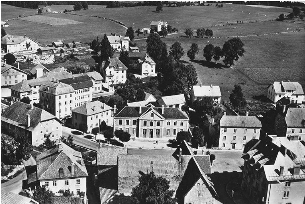
En avion au-dessus de... 2. Charquemont (Doubs) [le quartier de la mairie vu du sud], années 1960 ? 25, Charquemont, 6 rue Cuvier