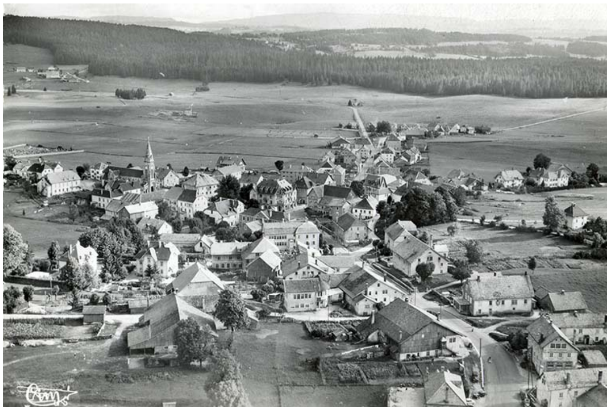
Charquemont (Doubs). 11059 - Vue aérienne [depuis l'ouest], entre 1950 et 1955. La levée de grange est encore visible. 25, Charquemont, 3 et 3 bis rue du Général Leclerc