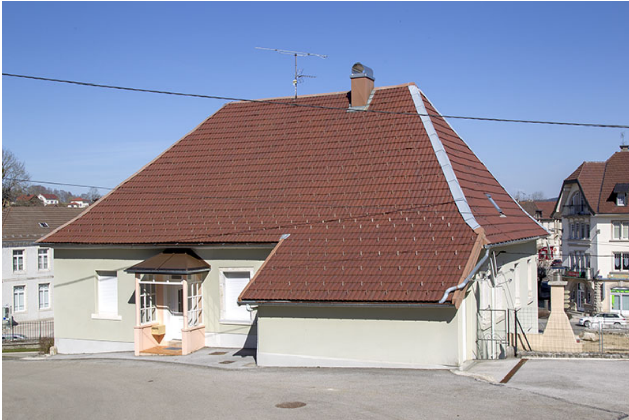
Façade antérieure, de trois quarts droite.

25, Charquemont, 3 et 3 bis rue du Général Leclerc