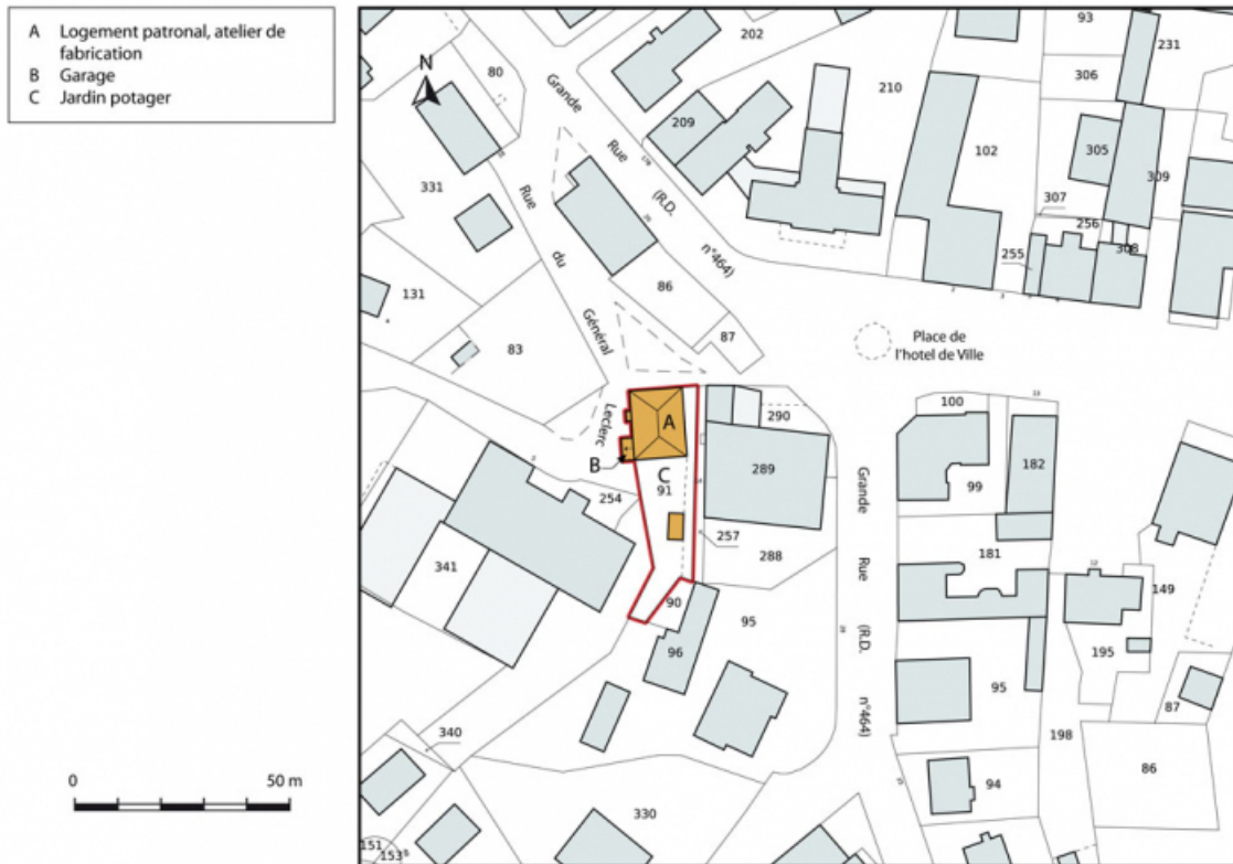
Plan-masse et de situation. Extrait du plan cadastral, 2015, section AI. 25, Charquemont, 3 et 3 bis rue du Général Leclerc