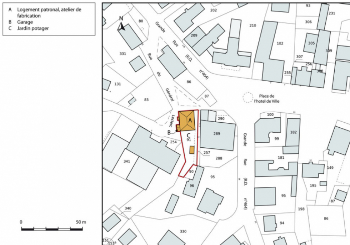
Plan-masse et de situation. Extrait du plan cadastral, 2015, section AI. 25, Charquemont, 3 et 3 bis rue du Général Leclerc