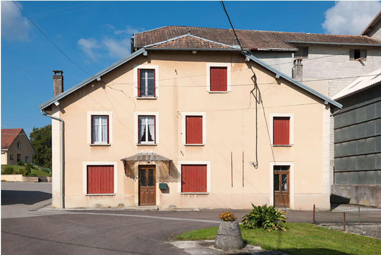
Façade sud du logement.

25, Mancenans, lieudit : moulin de l'Abbaye