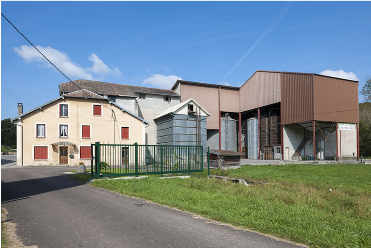
Vue rapprochée depuis le sud.

25, Mancenans, lieudit : moulin de l'Abbaye