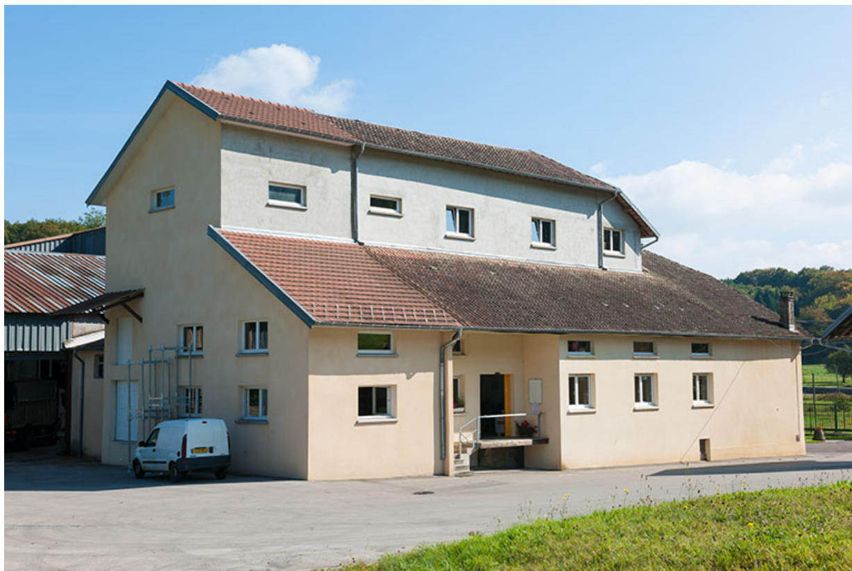
L'atelier du moulin, depuis le nord-est.

25, Mancenans, lieudit : moulin de l'Abbaye