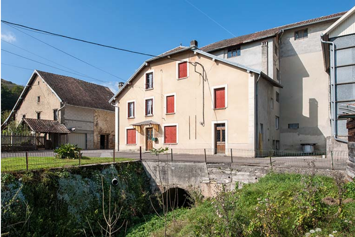
La ferme et le moulin, depuis le sud-est.

25, Mancenans, lieudit : moulin de l'Abbaye