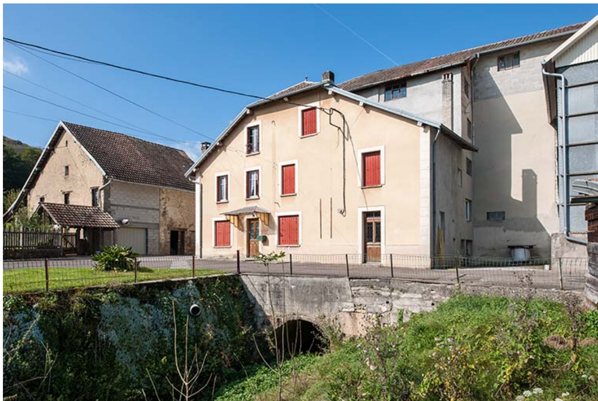
La ferme et le moulin, depuis le sud-est. 25, Mancenans, lieudit : moulin de l'Abbaye