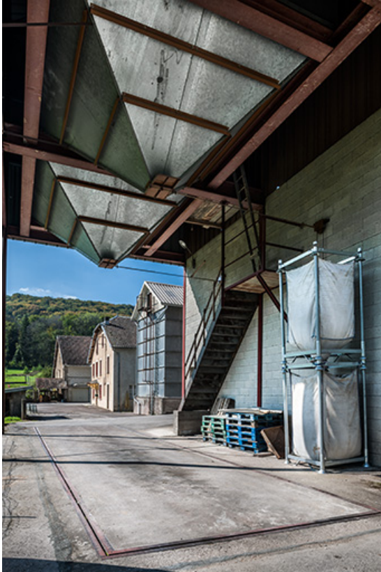
Vue depuis le pont bascule.

25, Mancenans, lieudit : moulin de l'Abbaye