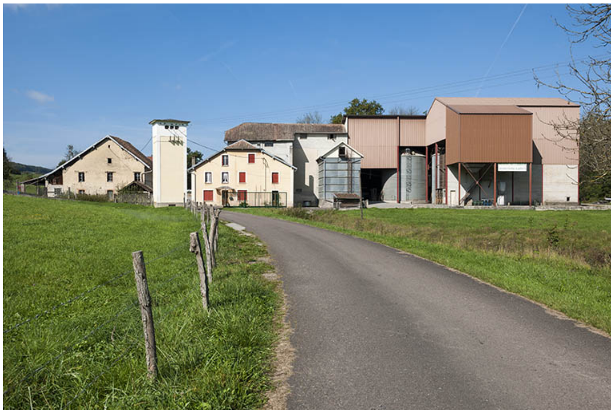
Vue depuis la route d'accès.

25, Mancenans, lieudit : moulin de l'Abbaye