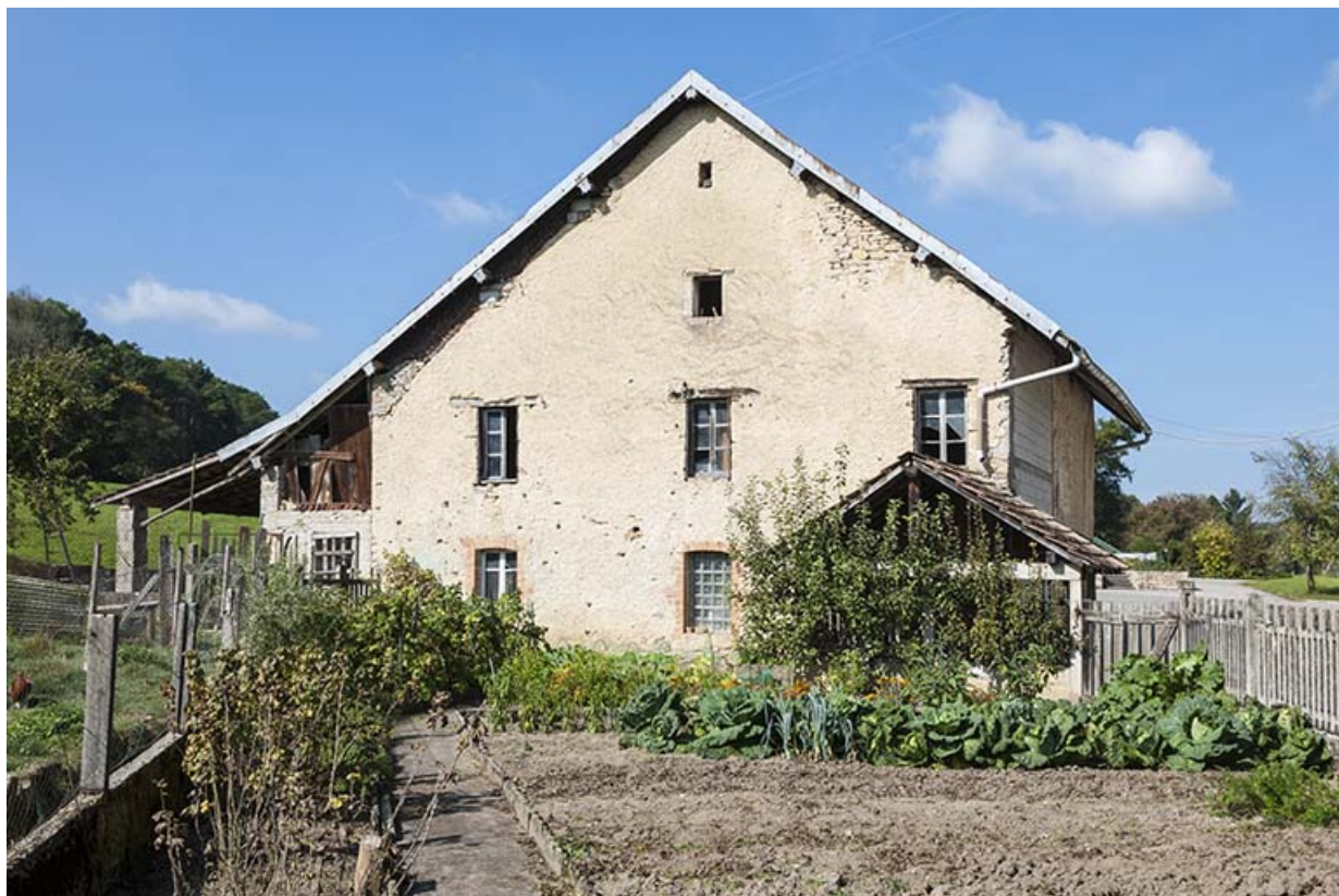
Vestige de la ferme, depuis le sud.

25, Mancenans, lieudit : moulin de l'Abbaye