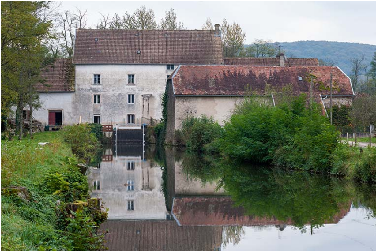
Vue rapprochée de la minoterie depuis le bief d'amenée.

21, Rougemont, 2 quartier du Moulin, lieudit : Montferney