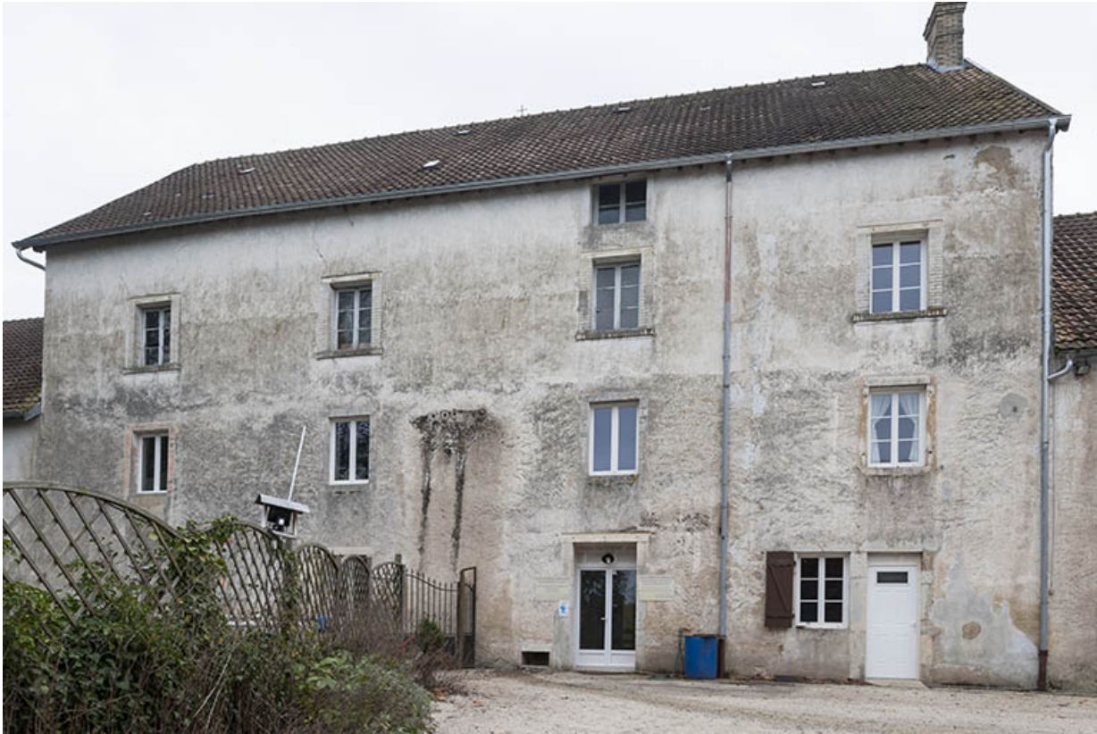
Elévation de l'atelier de fabrication de la minoterie.

21, Rougemont, 2 quartier du Moulin, lieudit : Montferney