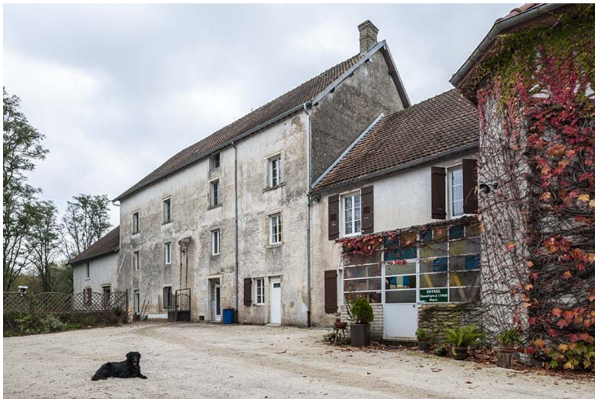
Atelier de fabrication vu de trois quarts droite.

21, Rougemont, 2 quartier du Moulin, lieudit : Montferney