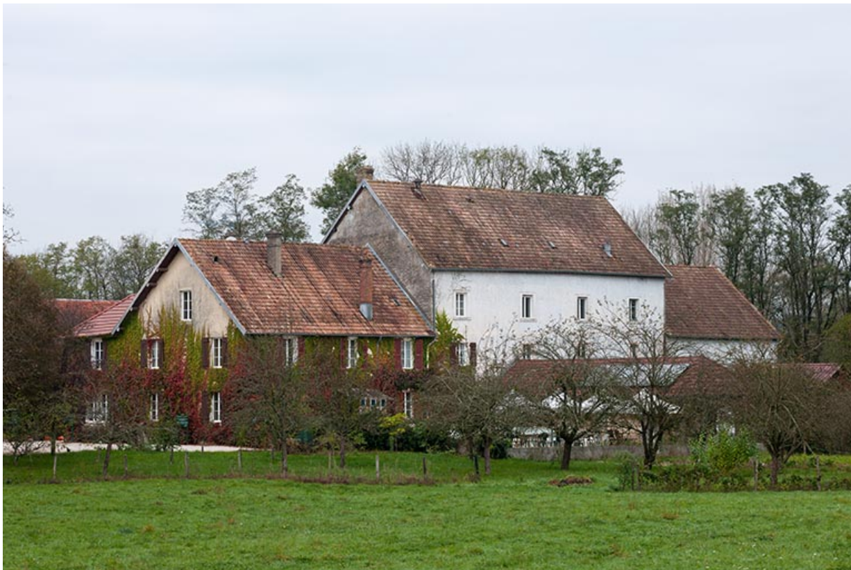
Vue depuis le sud.

21, Rougemont, 2 quartier du Moulin, lieudit : Montferney