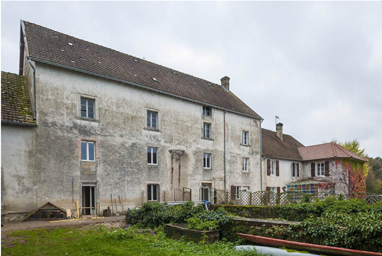
Atelier de fabrication vu de trois quarts gauche.

21, Rougemont, 2 quartier du Moulin, lieudit : Montferney