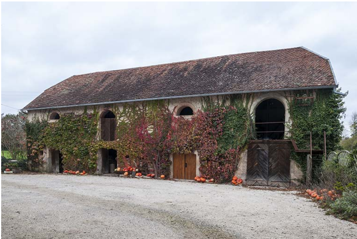
Façade est du bâtiment à fonction agricole.

21, Rougemont, 2 quartier du Moulin, lieudit : Montferney