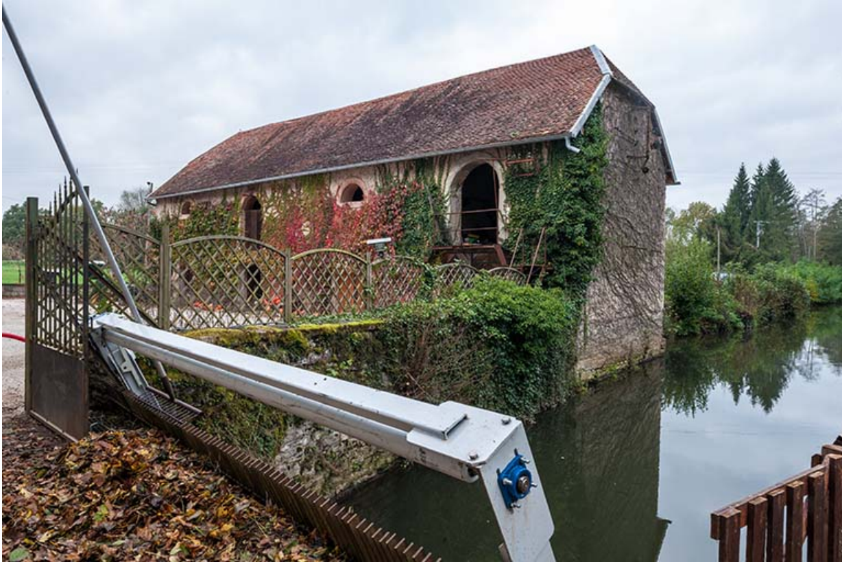
Le bâtiment à fonction agricole depuis le dégrilloir du bief d'amenée.

21, Rougemont, 2 quartier du Moulin, lieudit : Montferney