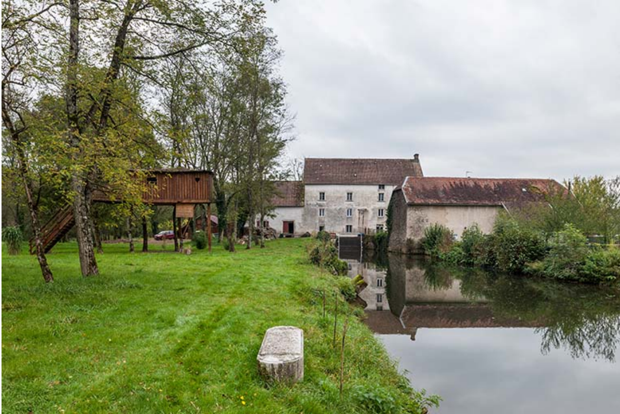
Vue d'ensemble depuis le bief d'aménée.

21, Rougemont, 2 quartier du Moulin, lieudit : Montferney