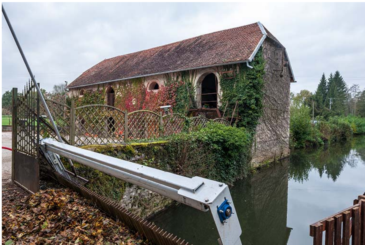
Le bâtiment à fonction agricole depuis le dégrilloir du bief d'amenée.

21, Rougemont, 2 quartier du Moulin, lieu-dit : Montferney