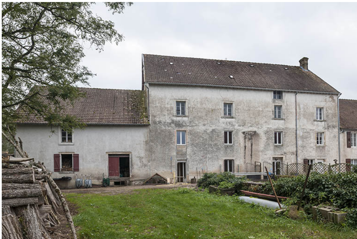
Façade ouest de l'atelier de minoterie.

21, Rougemont, 2 quartier du Moulin, lieudit : Montferney