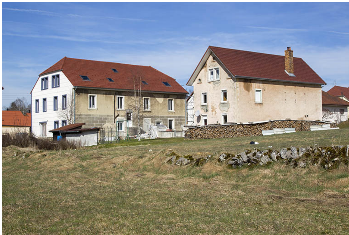
Vue d'ensemble, depuis le sud-est (façades postérieures et latérales droites). 25, Charquemont, 39 et 41 Grande Rue