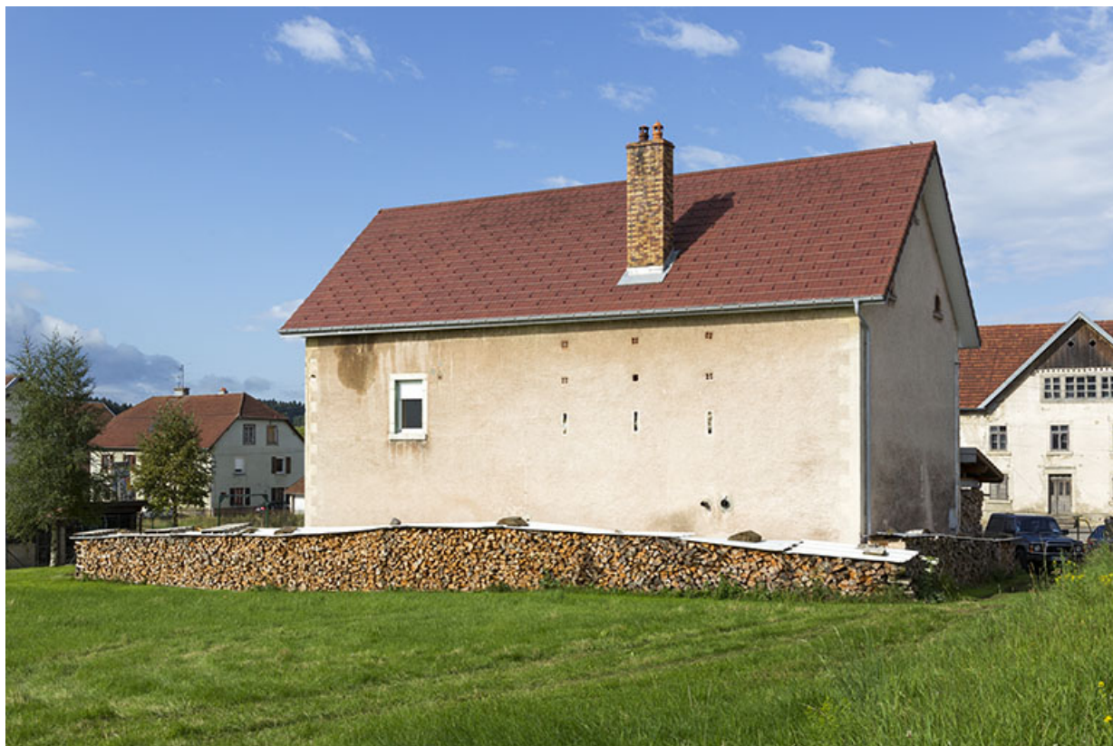
Bâtiment au n° 39 : façades postérieure et latérale gauche.