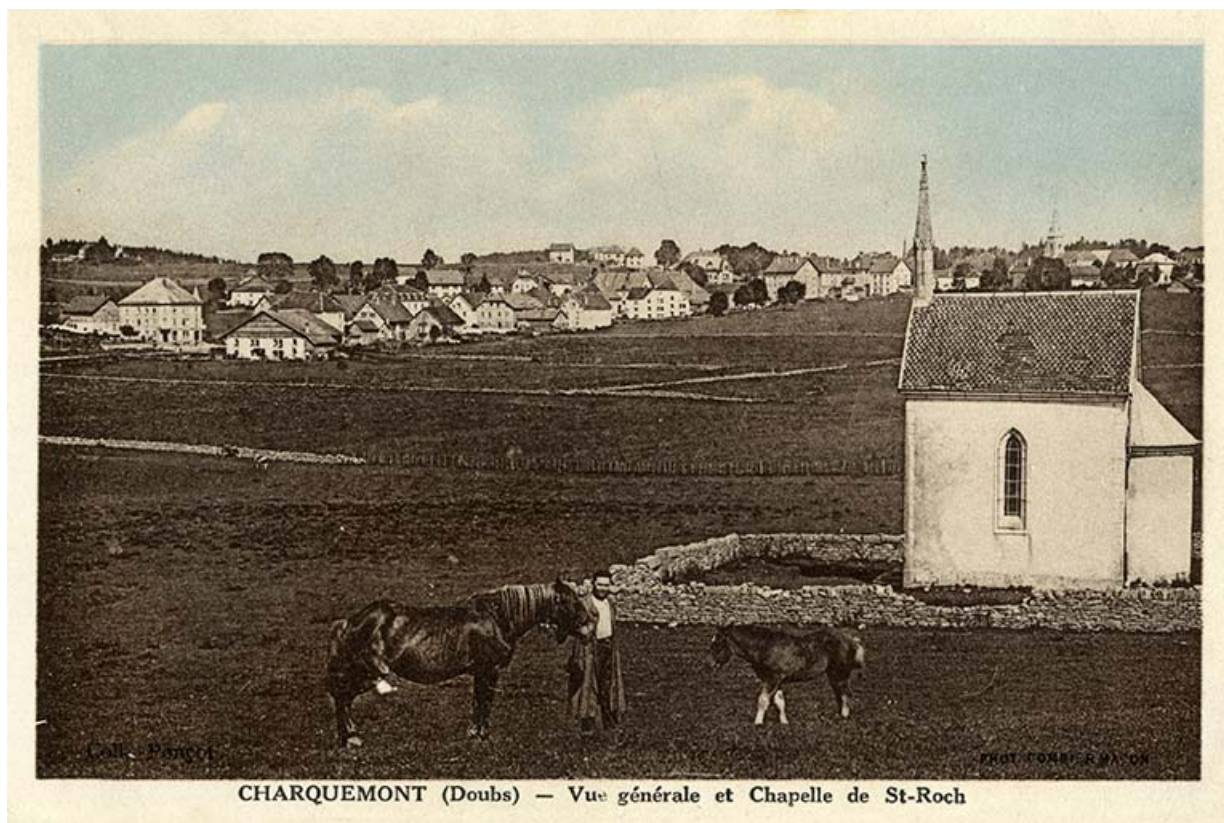
Charquemont (Doubs) - Vue générale et Chapelle de St-Roch, 2e quart 20e siècle (avant 1945). Les trois bâtiments sont visibles au centre de l'image.