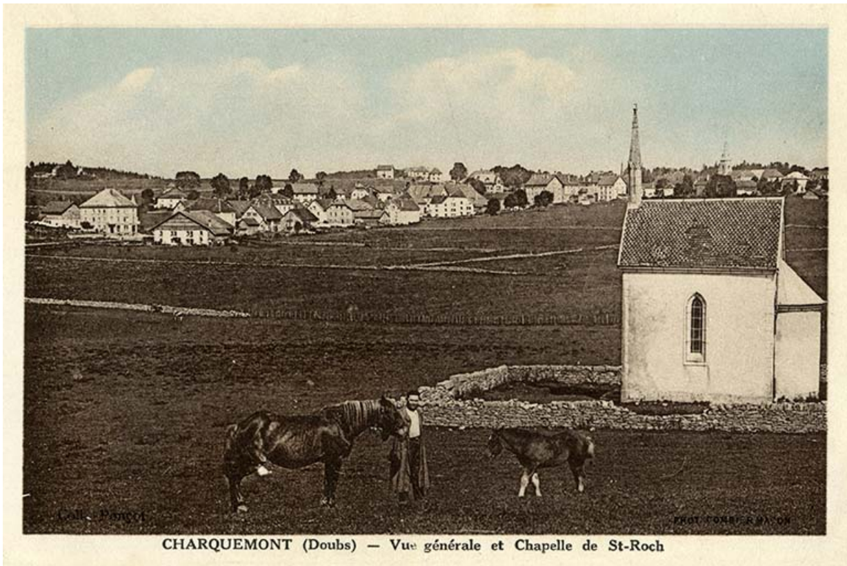
Charquemont (Doubs) - Vue générale et Chapelle de St-Roch, 2e quart 20e siècle (avant 1945). Les trois bâtiments sont visibles au centre de l'image.