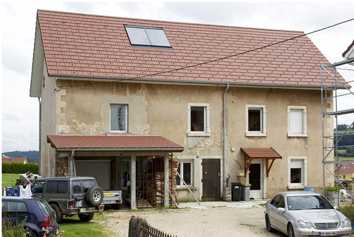
Bâtiment au n° 39 : façade antérieure. 25, Charquemont, 39 et 41 Grande Rue