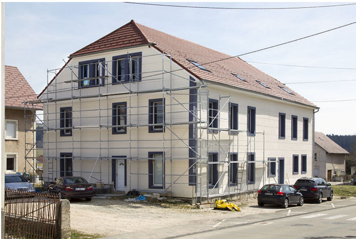
Bâtiment au n° 41 : façades antérieure et latérale gauche. 25, Charquemont, 39 et 41 Grande Rue