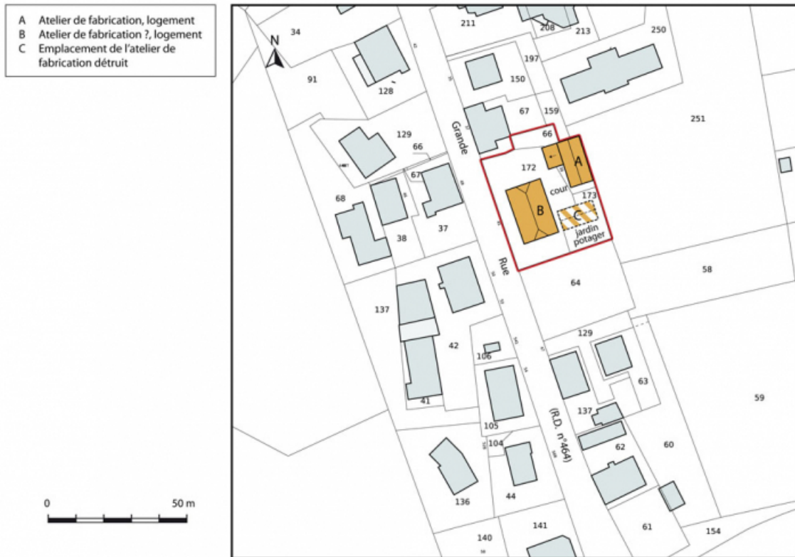
Plan-masse et de situation. Extrait du plan cadastral, 2015, section AE. 25, Charquemont, 39 et 41 Grande Rue