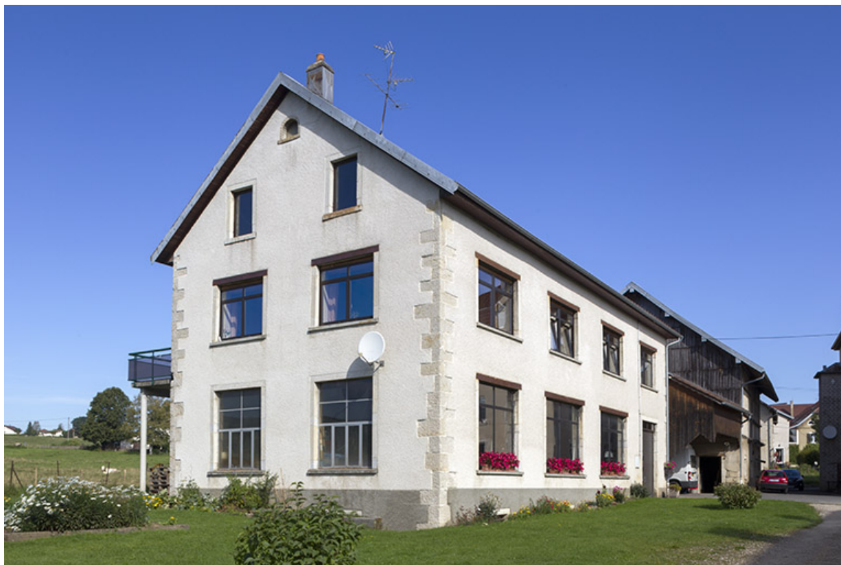
Ancienne fonderie : façades antérieure et latérale gauche.