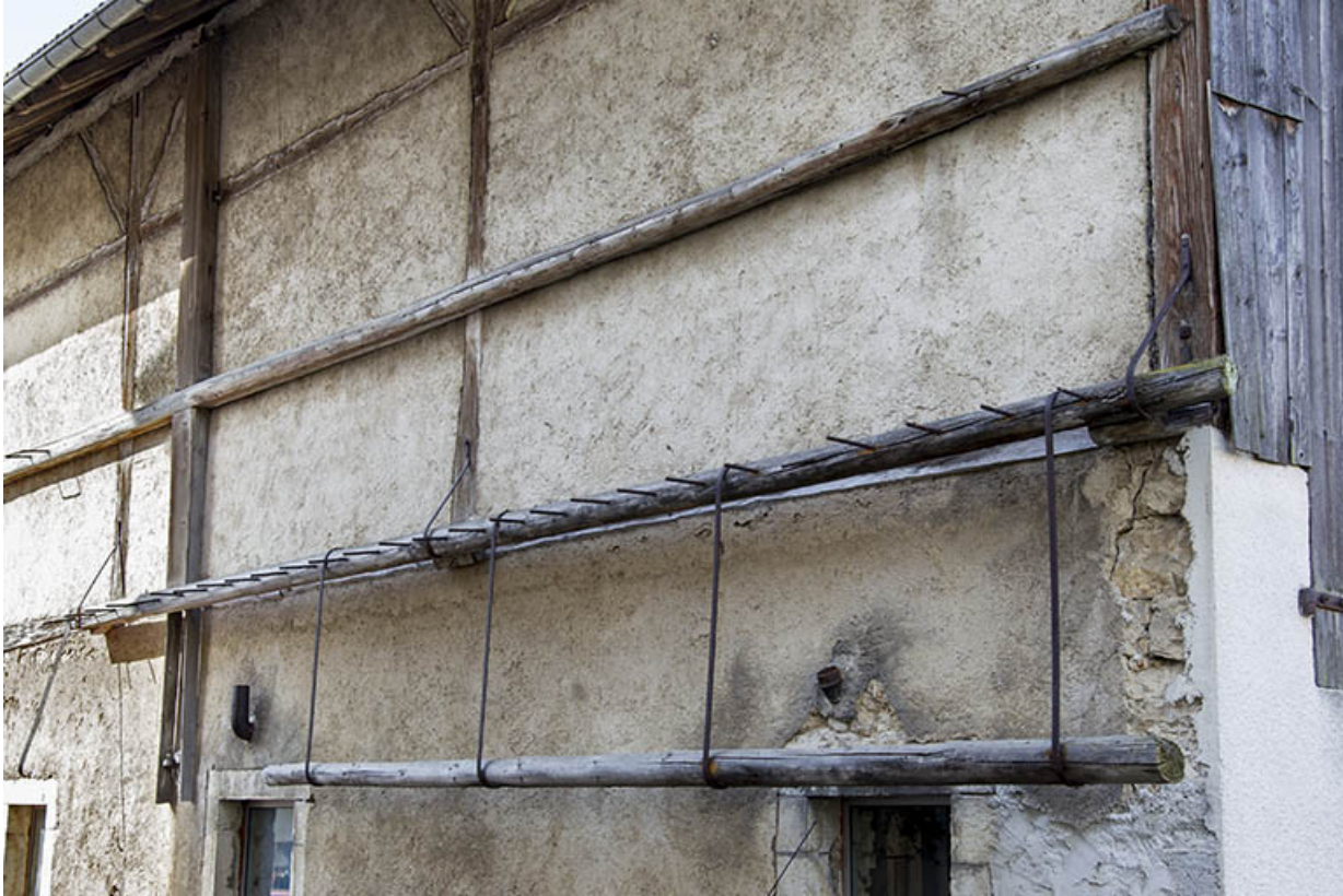
Ecurie : support pour stockage vertical de barres métalliques, sur la façade antérieure.