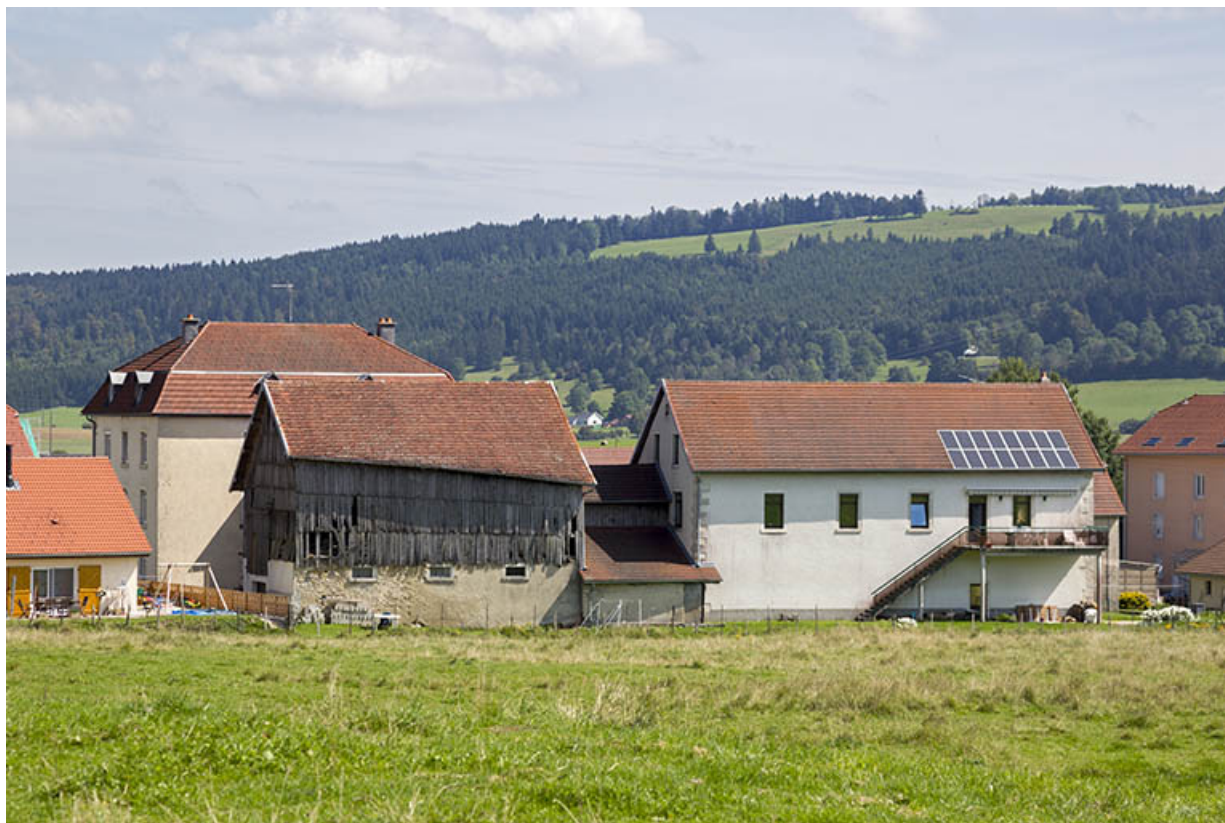
Vue d'ensemble, depuis l'ouest. De gauche à droite : écurie-fenil, remise et ancienne fonderie. 25, Charquemont, 50 et 52 Grande Rue