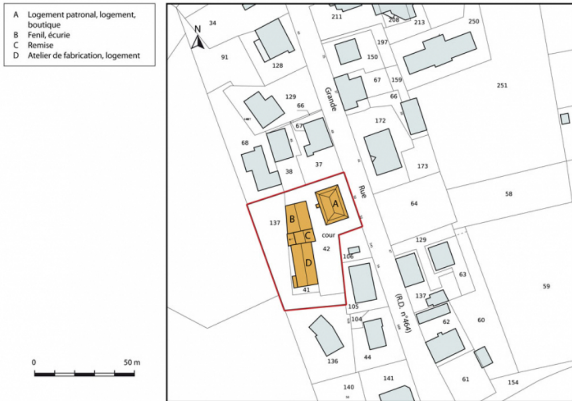
Plan-masse et de situation. Extrait du plan cadastral, 2015, section AH. 25, Charquemont, 50 et 52 Grande Rue