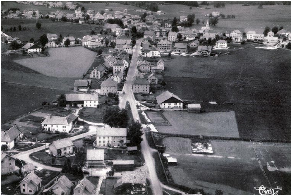
[Vue aérienne du bas du village depuis le sud], 3e quart 20e siècle.