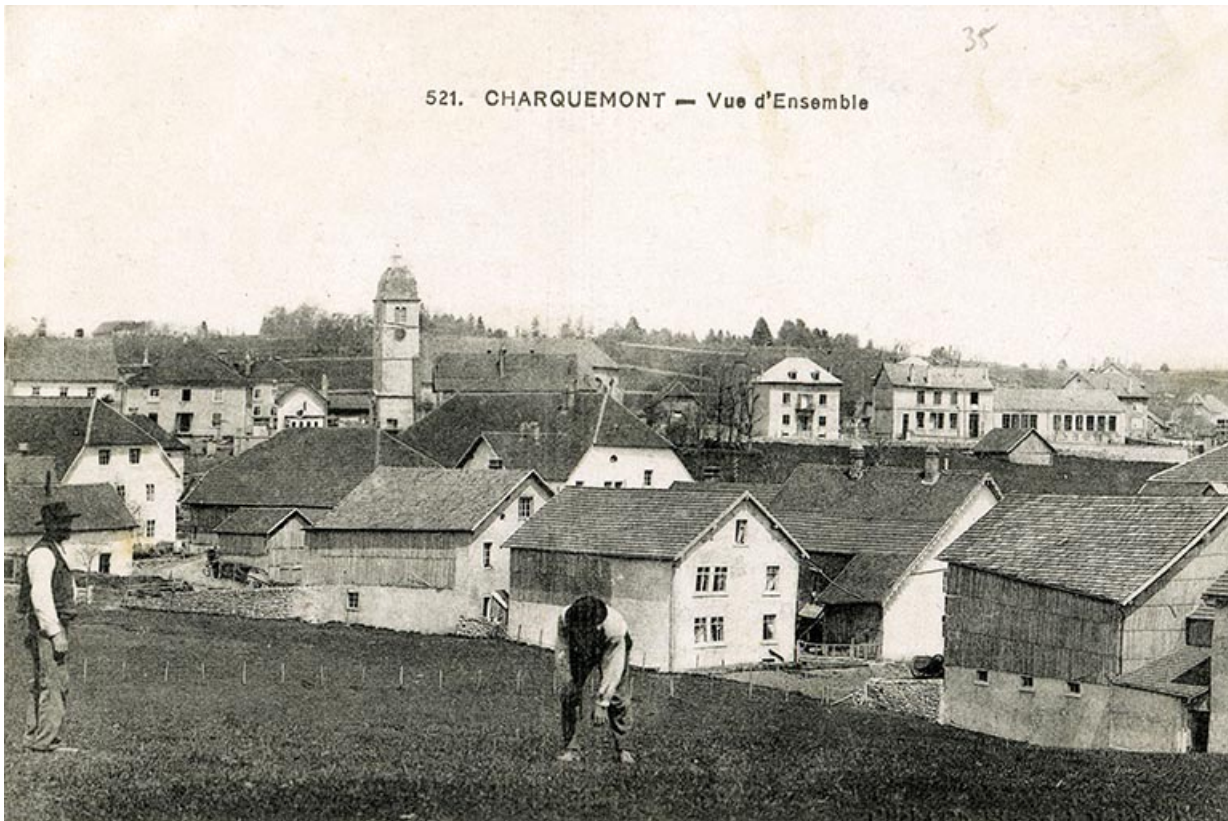
521. Charquemont - Vue d'ensemble [le quartier de l'église et le bas du village vus du sud], 1er quart 20e siècle 25, Charquemont, 50 et 52 Grande Rue