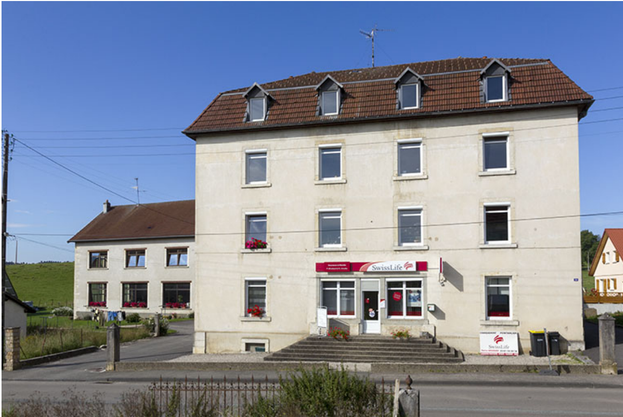
Logement patronal : façade antérieure.