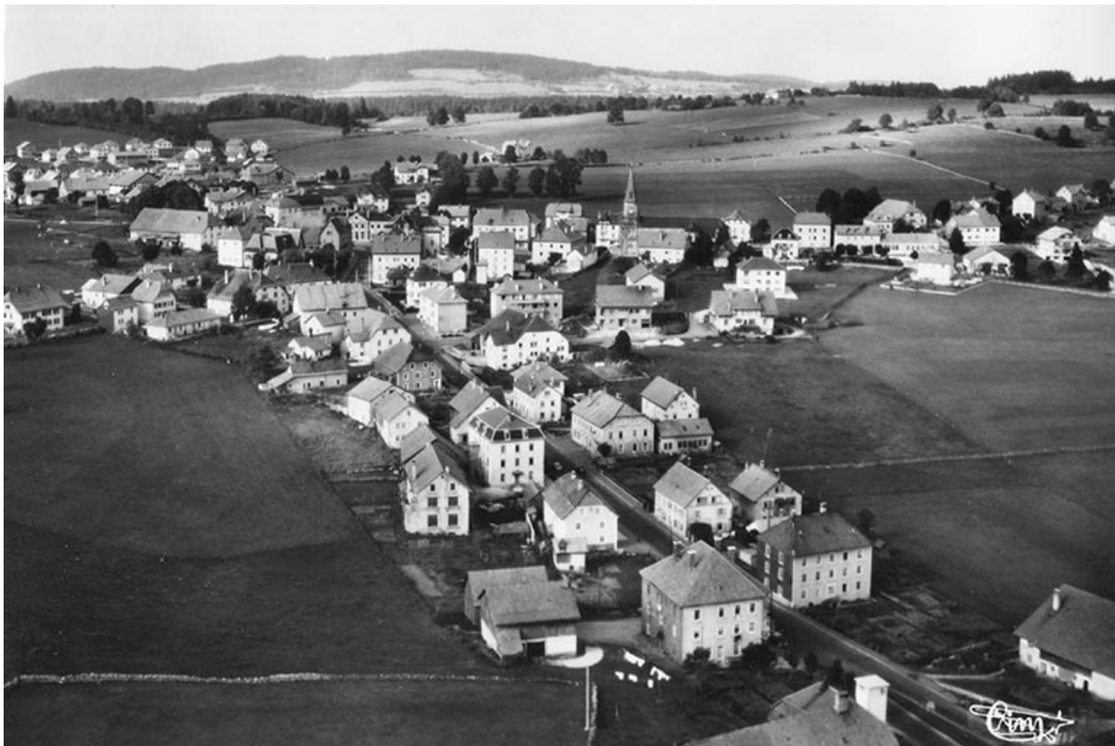
Charquemont (Doubs). 210-1 A. Vue générale [la Grande Rue et le bas du village vus du sud], 3e quart 20e siècle. 25, Charquemont, 8 rue de l' Eglise

Charquemont (Doubs). 210-1 A. Vue générale [la Grande Rue et le bas du village vus du sud], carte postale, s.n., s.d. [3e quart 20e siècle], Combier Impr. à Mâcon