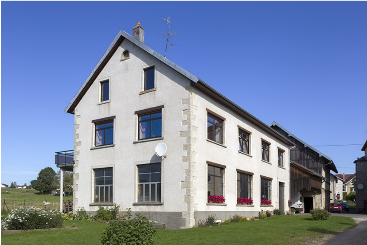
Ancienne fonderie : façades antérieure et latérale gauche.