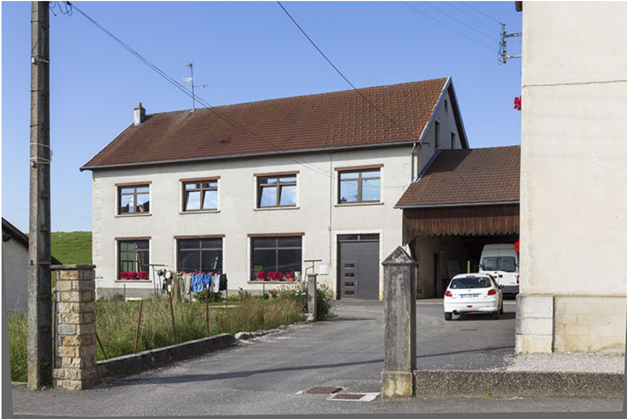
Ancienne fonderie : façade antérieure.