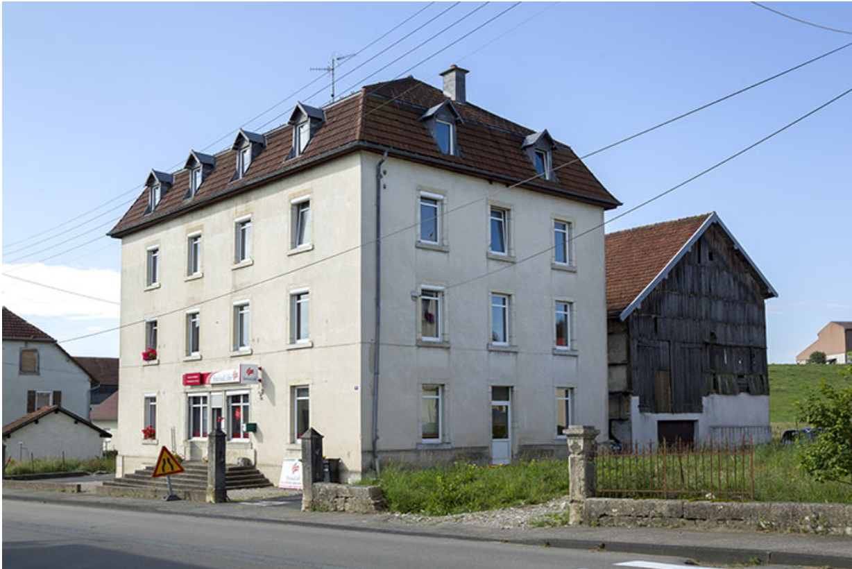
Vue d'ensemble, depuis le nord : logement patronal en avant du bâtiment d'écurie et fenil.