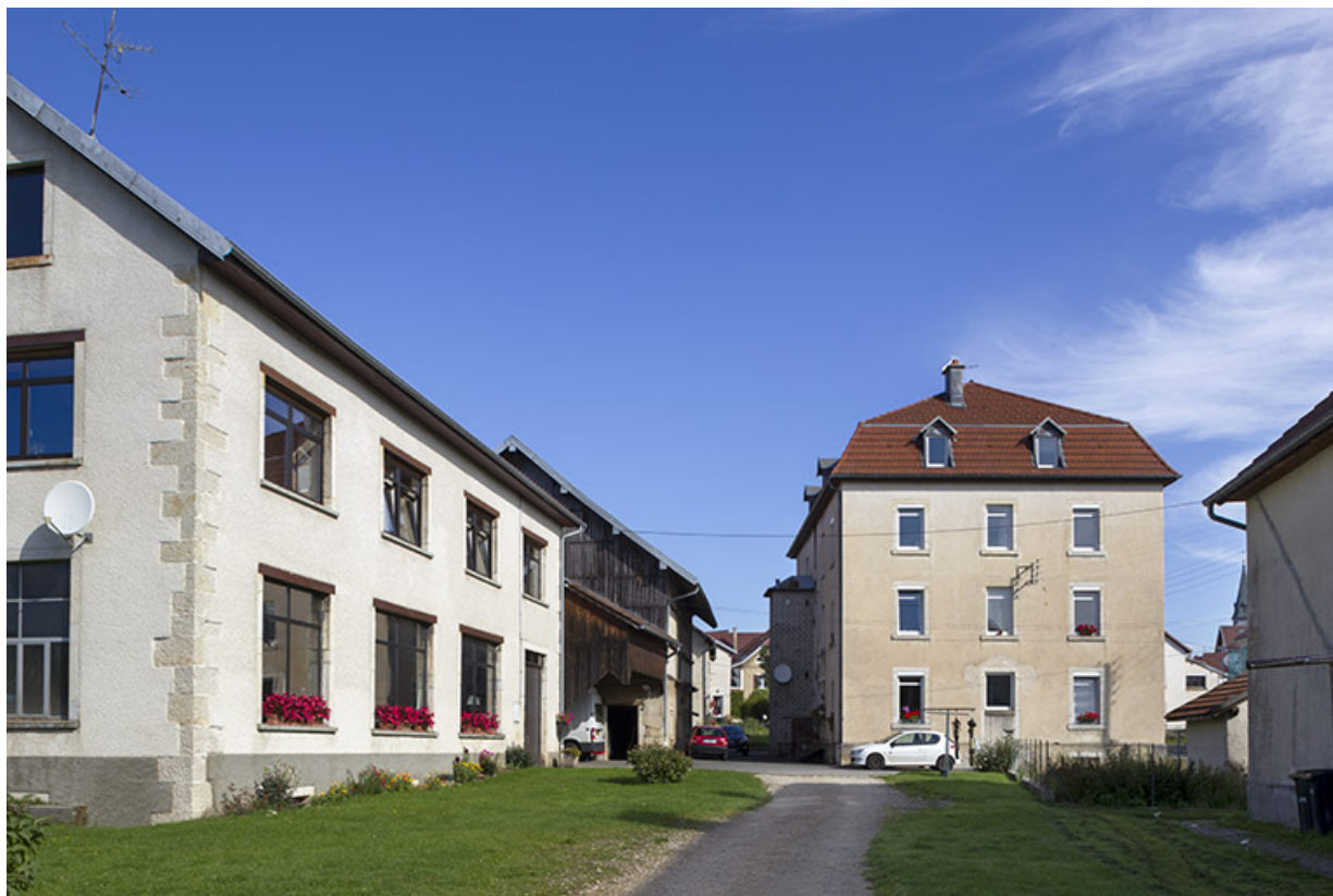
Logement patronal : façade latérale gauche. A gauche, l'ancienne fonderie se prolongeant par la remise et l'écurie-fenil. 25, Charquemont, 50 et 52 Grande Rue