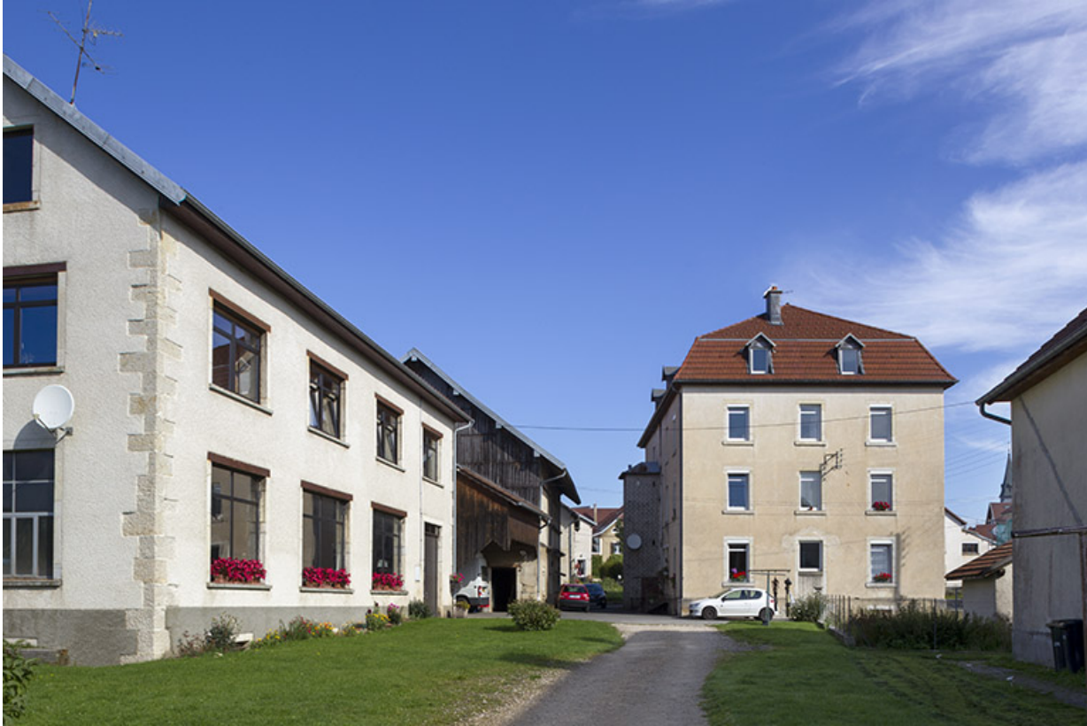
Logement patronal : façade latérale gauche. A gauche, l'ancienne fonderie se prolongeant par la remise et l'écurie-fenil. 25, Charquemont, 50 et 52 Grande Rue