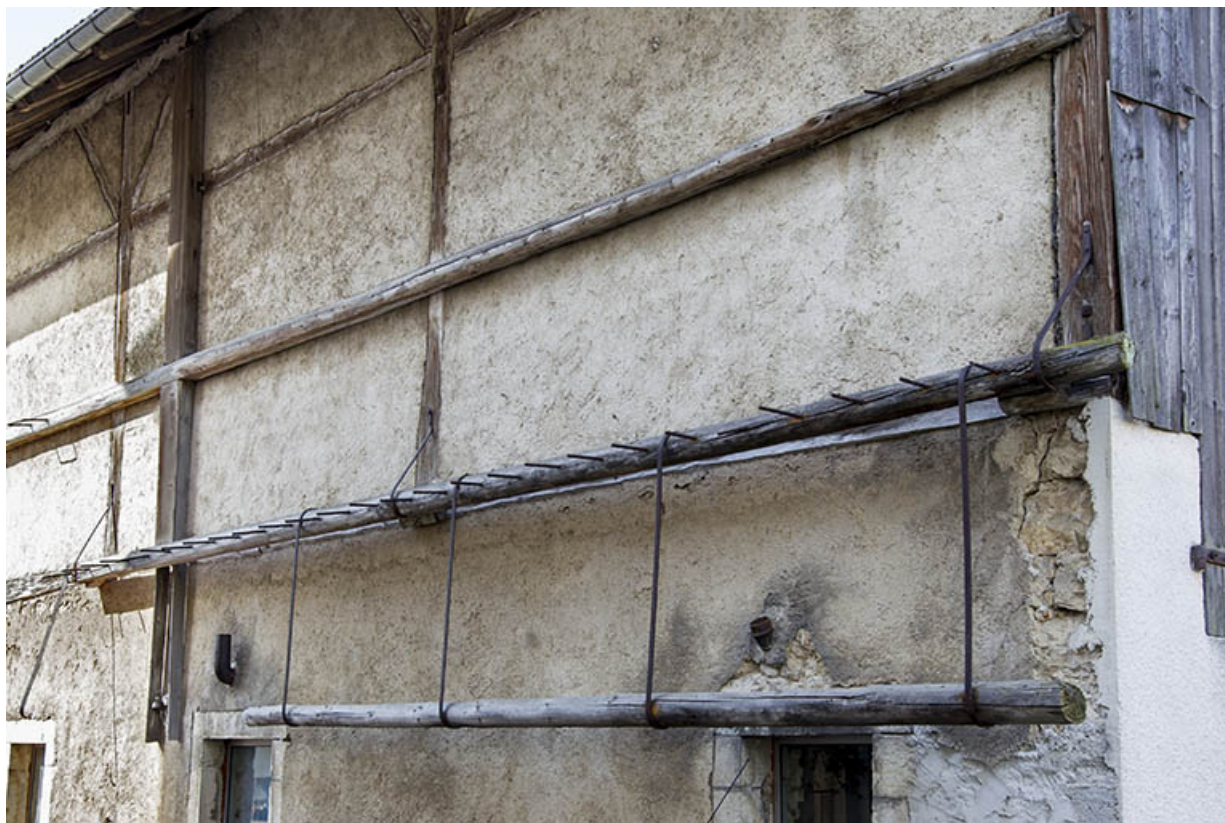
Ecurie : support pour stockage vertical de barres métalliques, sur la façade antérieure.