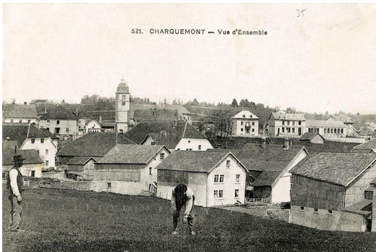
521. Charquemont - Vue d'ensemble [le quartier de l'église et le bas du village vus du sud], 1er quart 20e siècle 25, Charquemont, 50 et 52 Grande Rue