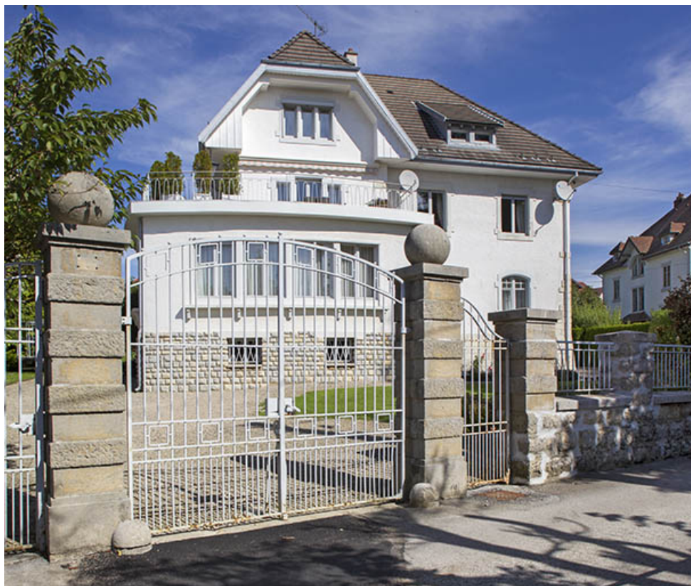
Vue d'ensemble, depuis le sud.