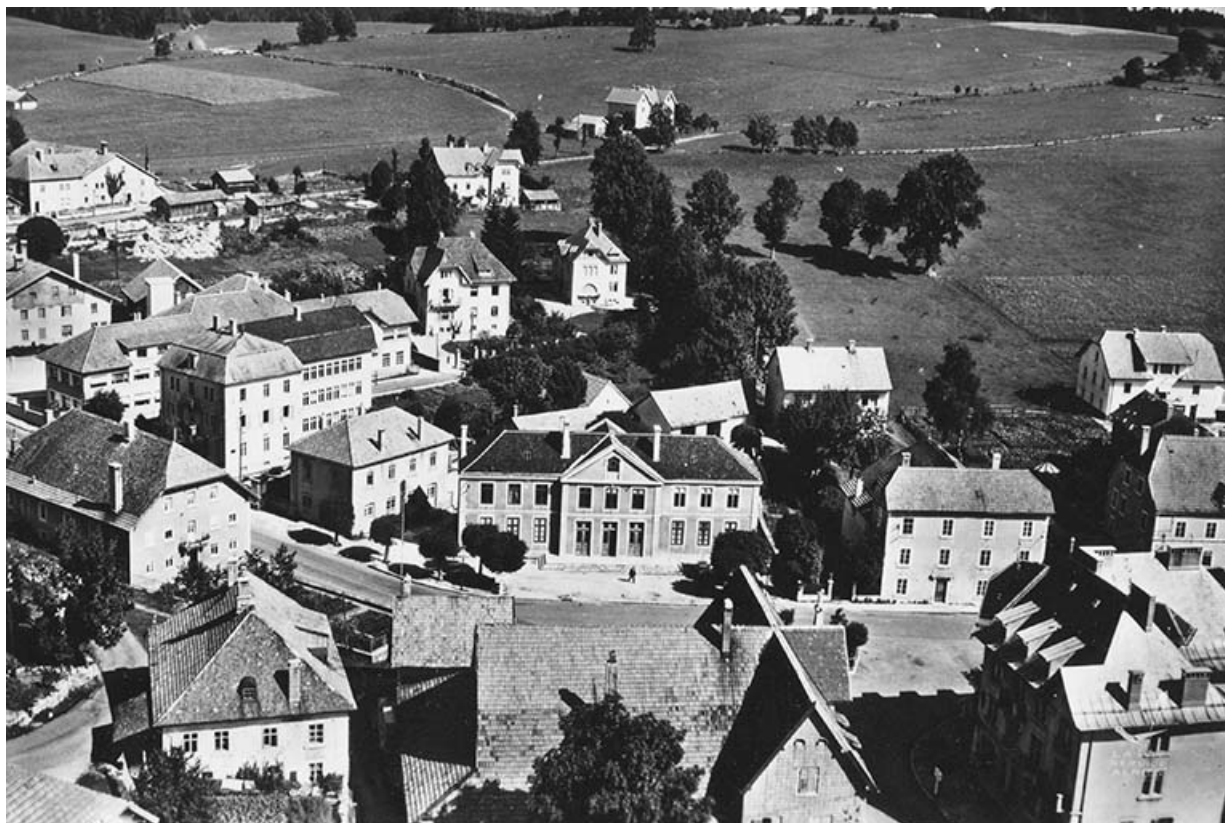
En avion au-dessus de... 2. Charquemont (Doubs) [le quartier de la mairie vu du sud], années 1960 ? 25, Charquemont, 6 rue Cuvier