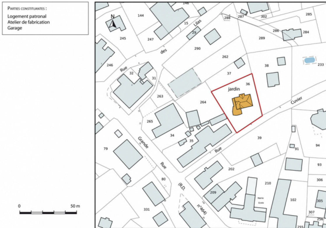
Plan-masse et de situation. Extrait du plan cadastral, 2015, section AC. 25, Charquemont, 4 rue Cuvier