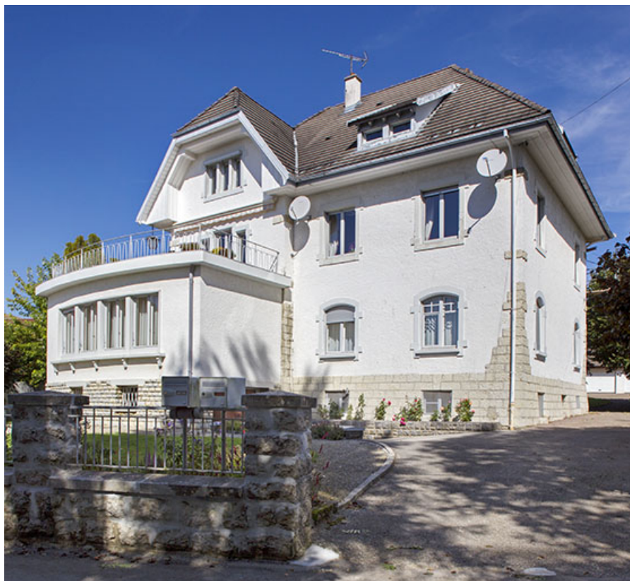
Une maison d'industriel de 1918 (architecte Crivelli) : maison Joseph Frésard et atelier d'horlogerie Brischoux-Donzé (4 rue Cuvier). 25, Charquemont, 4 rue Cuvier

N° de l'illustration : 20152500739NUC4AQ