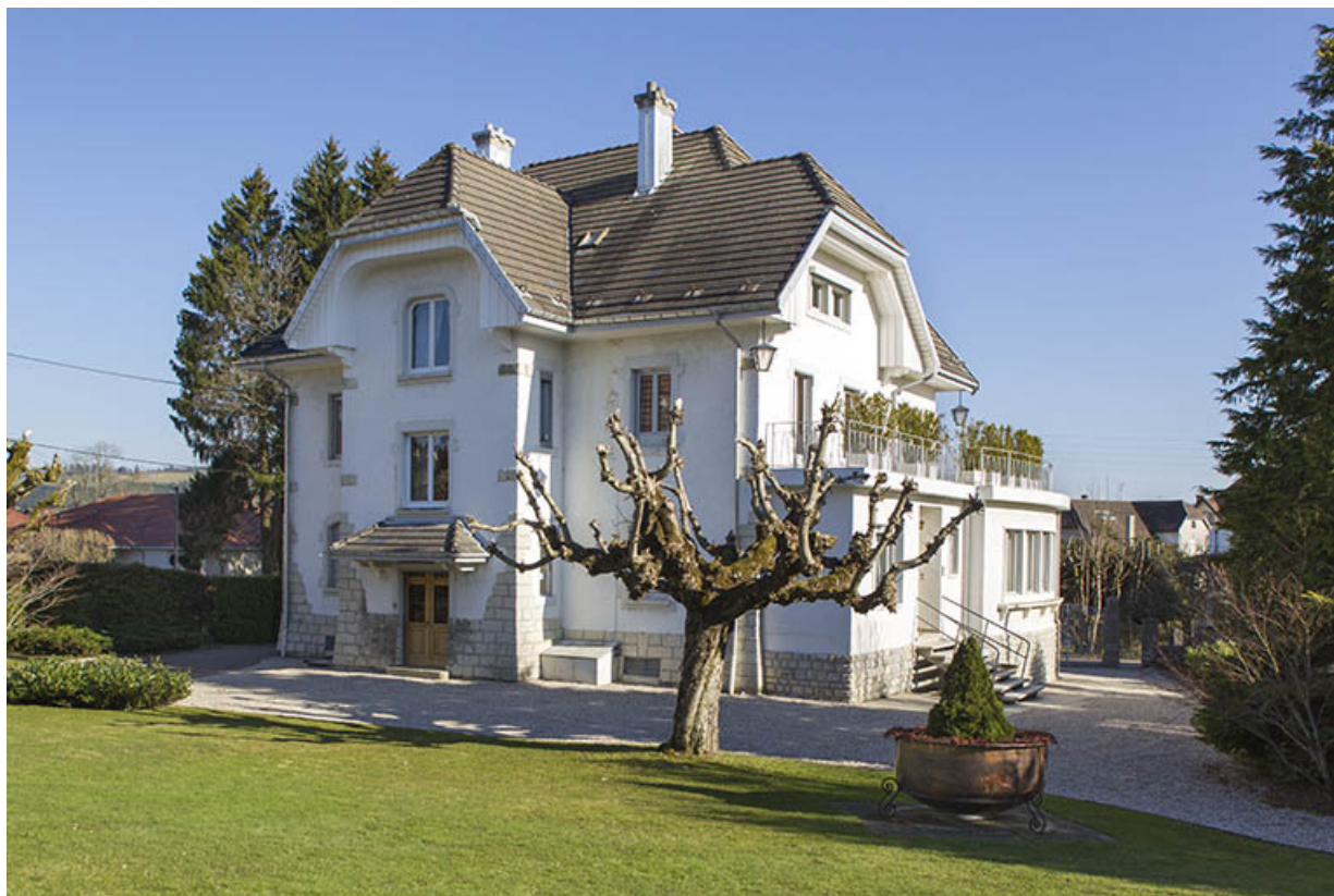
Façades postérieure et latérale gauche.