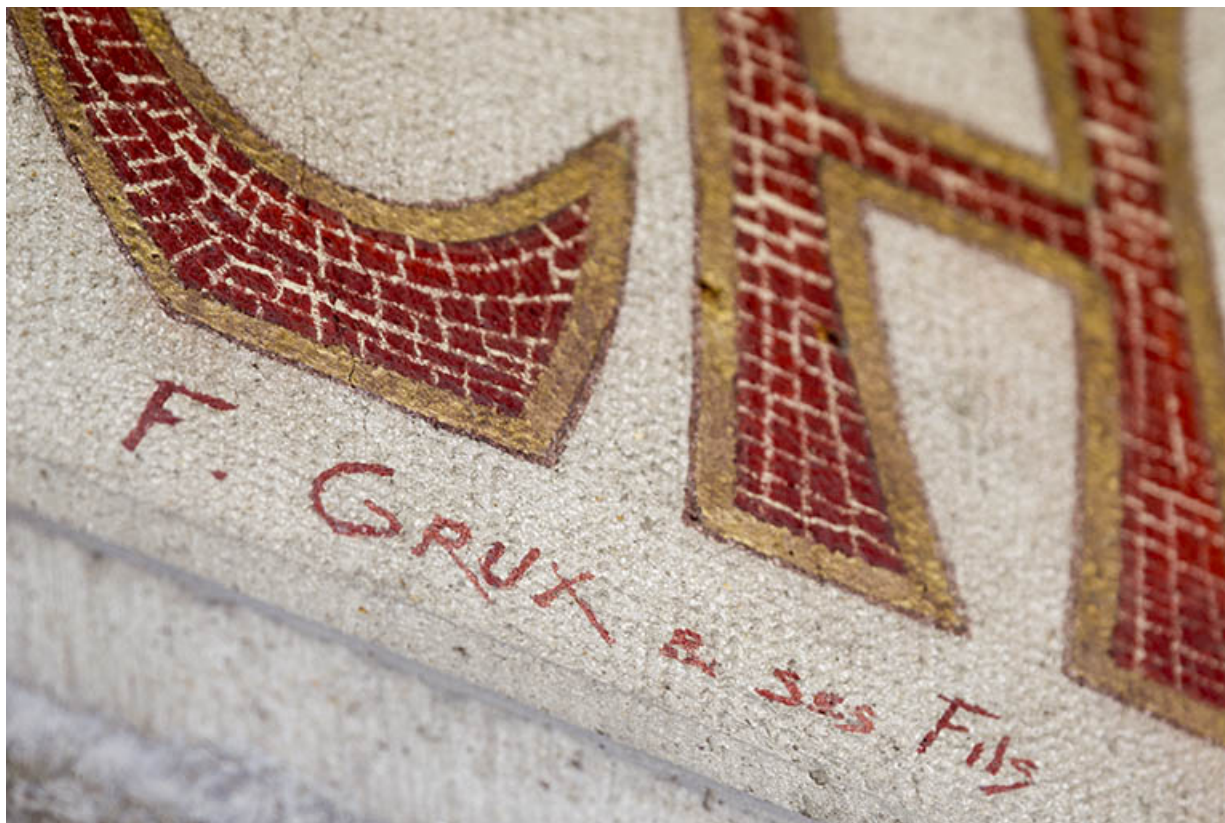
Façade antérieure : signature du peintre de l'enseigne (F. Grux). 25, Charquemont, 21 Grande Rue