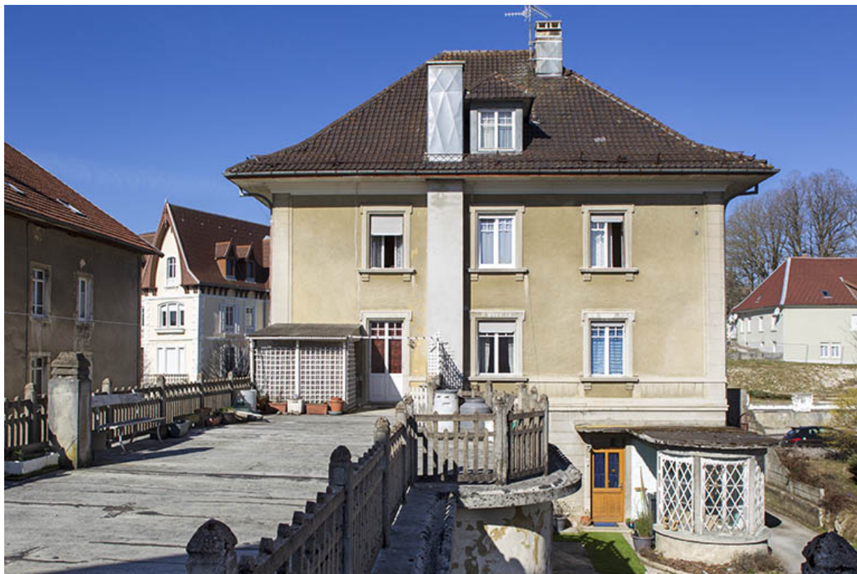
Façade postérieure et terrasse surmontant la cuisine.