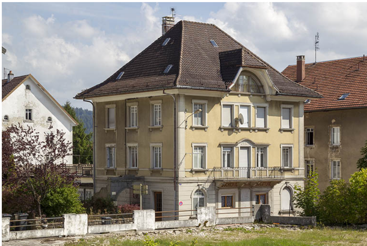
Vue d'ensemble, depuis le nord-ouest (façades antérieure et latérale gauche). 25, Charquemont, 21 Grande Rue