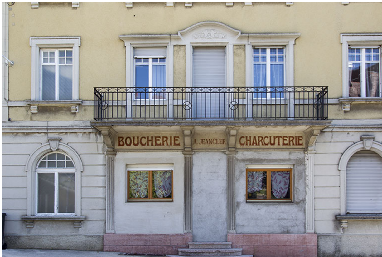
Façade antérieure : travées centrales.