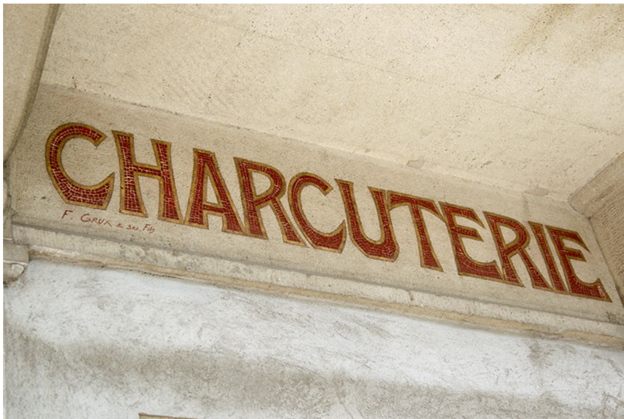
Façade antérieure : partie droite de l'enseigne peinte.