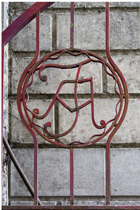
Portail : monogramme d'André Jeancler.