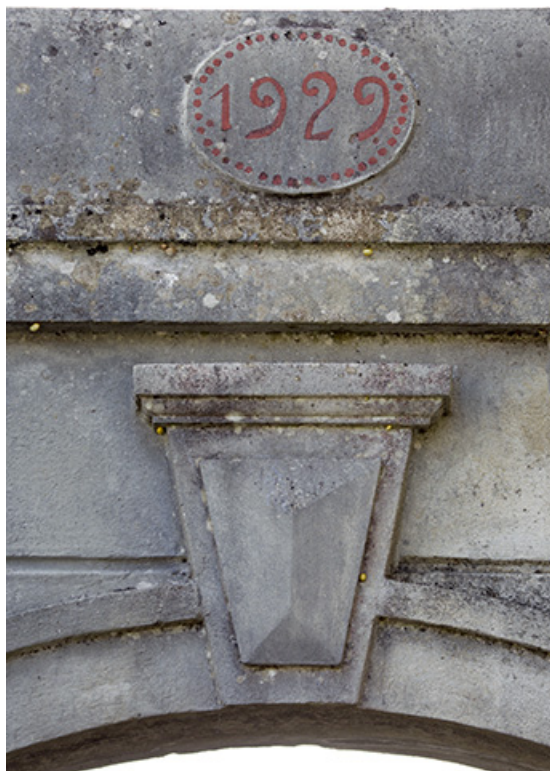
Portail : date et clé de voûte.