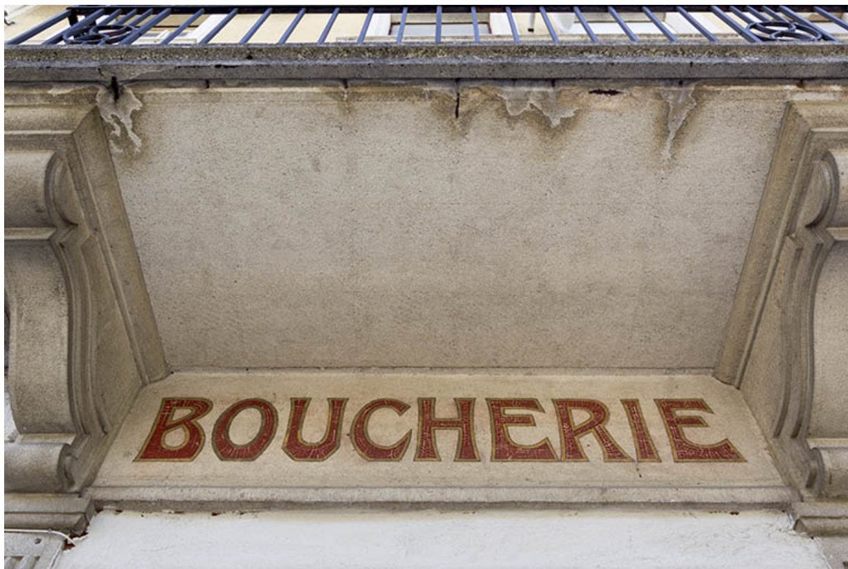
Façade antérieure : partie gauche de l'enseigne peinte.