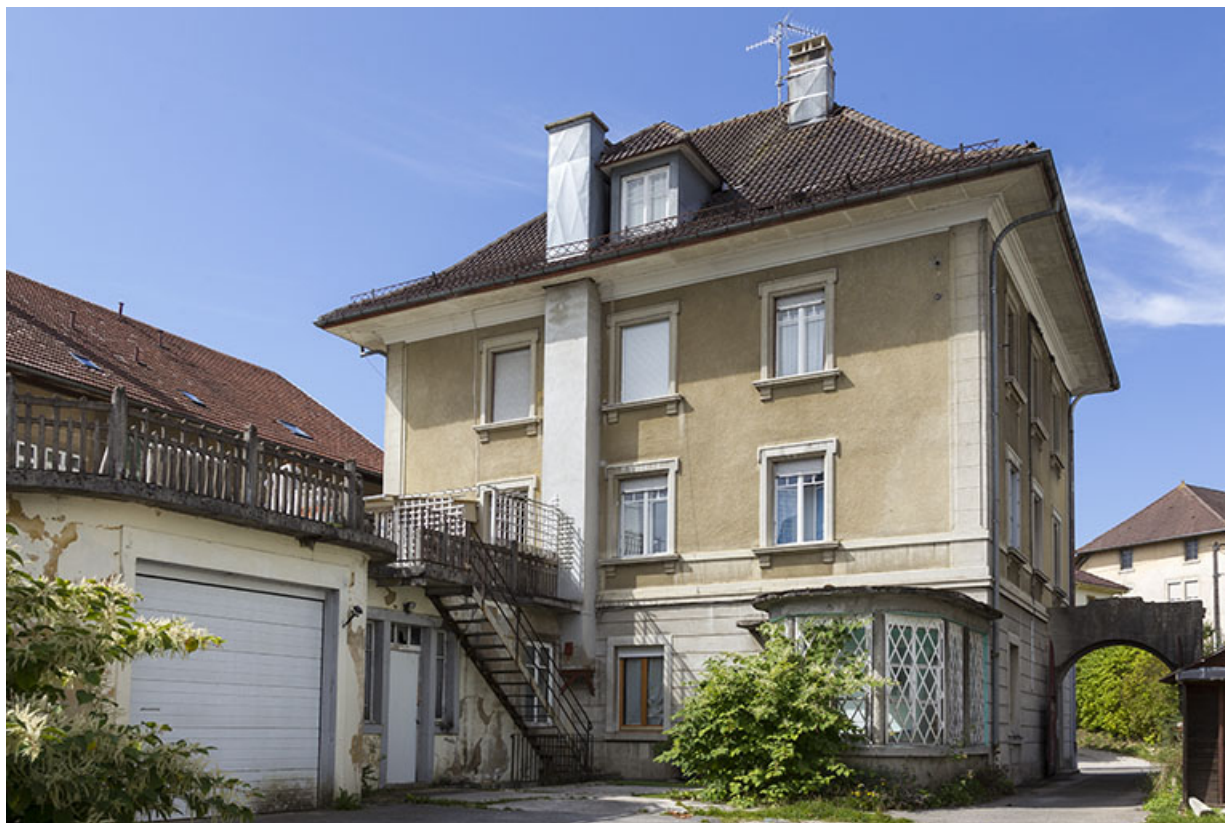
Façade postérieure, avec cuisine à gauche et portail à droite. 25, Charquemont, 21 Grande Rue