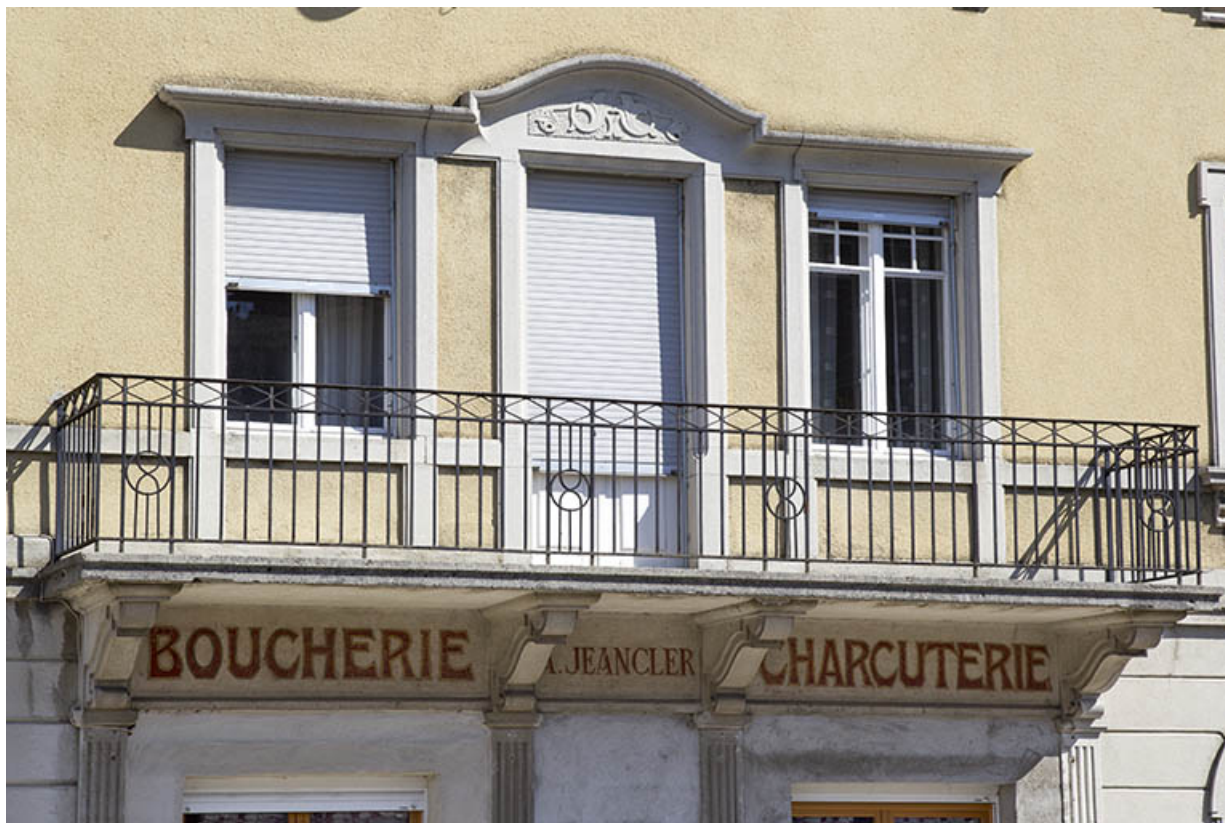
Façade antérieure : baies centrales à l'étage et balcon.