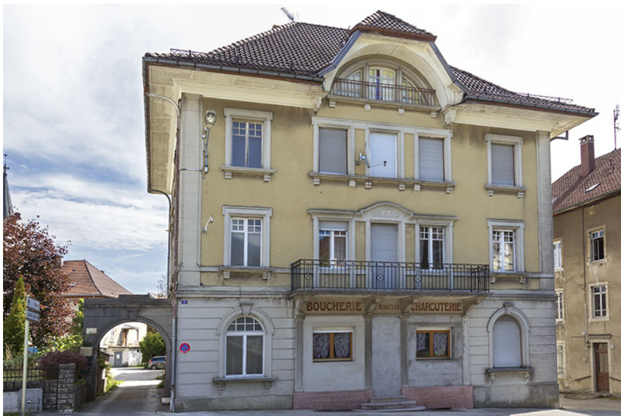
Façade antérieure, de trois quarts gauche. A gauche le portail. 25, Charquemont, 21 Grande Rue