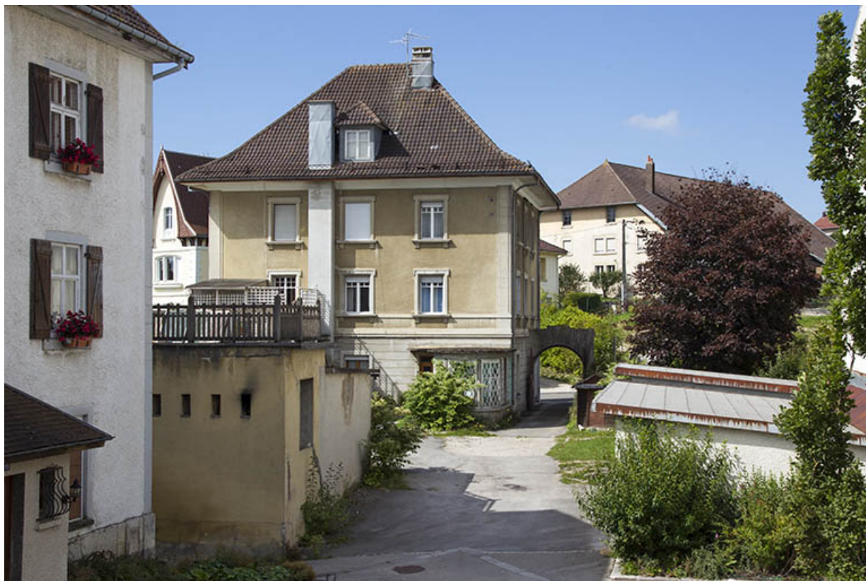
Vue d'ensemble, depuis l'est (façade postérieure).