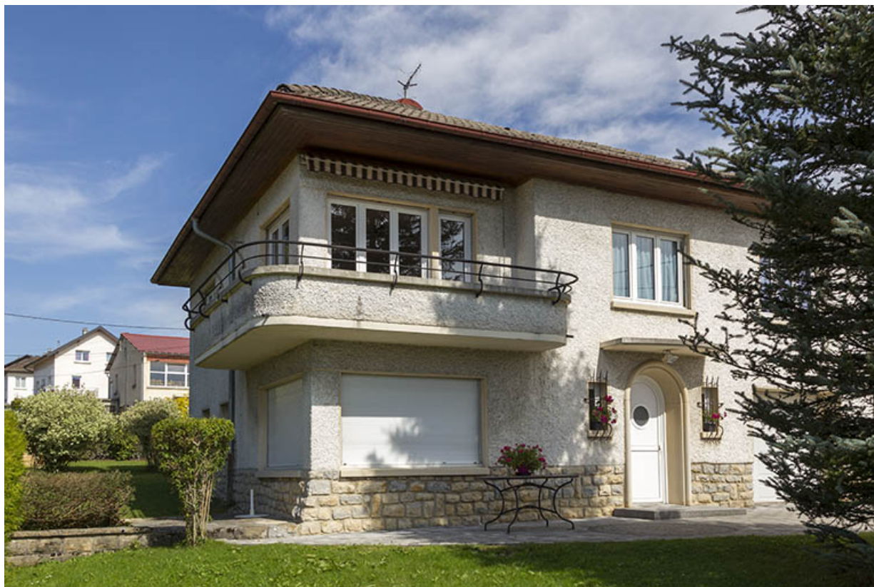
Façade antérieure, de trois quarts gauche.