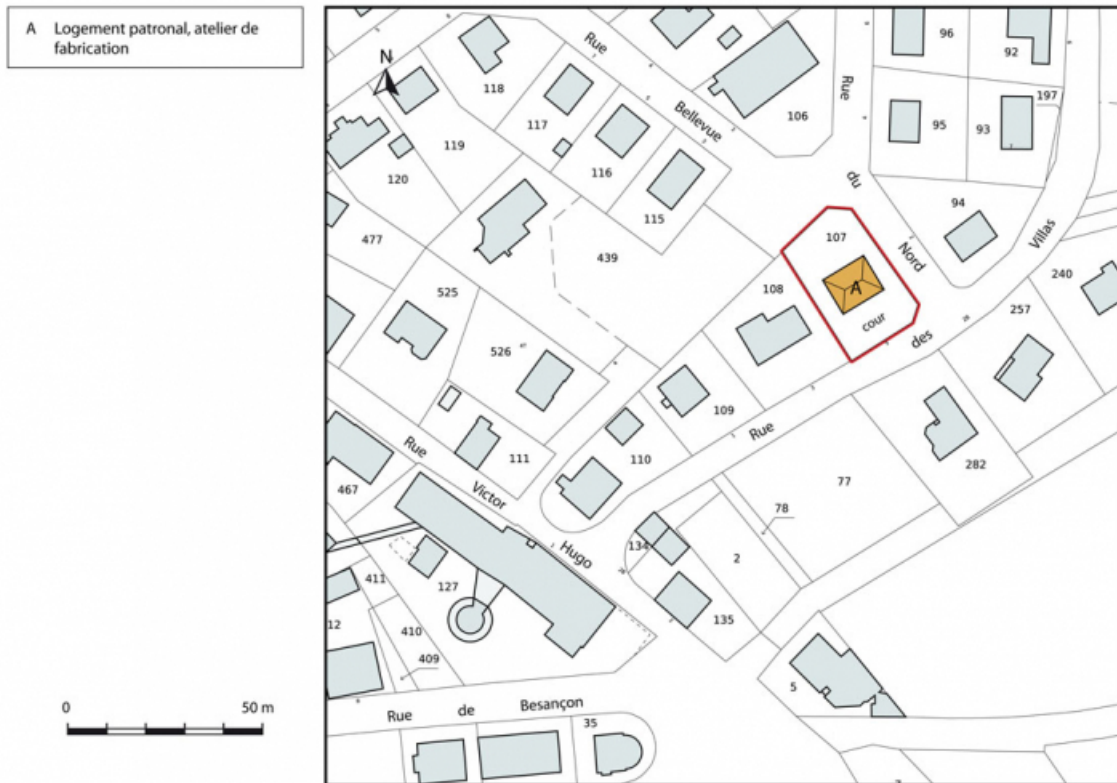
Plan-masse et de situation. Extrait du plan cadastral, 2015, section AB. 25, Charquemont, 5 rue des Villas