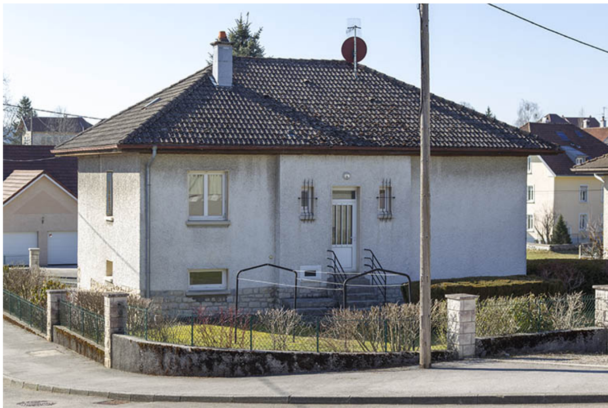
Façade postérieure, de trois quarts gauche. 25, Charquemont, 5 rue des Villas