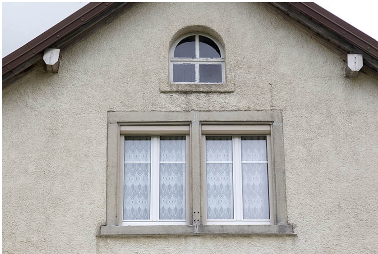
Façade latérale gauche : fenêtre horlogère et fenêtre du comble.