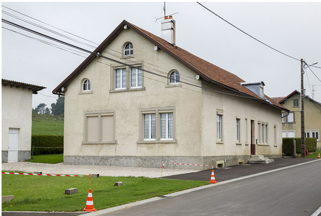
Une maison de la fin du 19e siècle (vers 1898) : usine de balanciers-spiraux Fallet (21 rue de l'Eglise). 25, Charquemont, 21 rue de l' Eglise