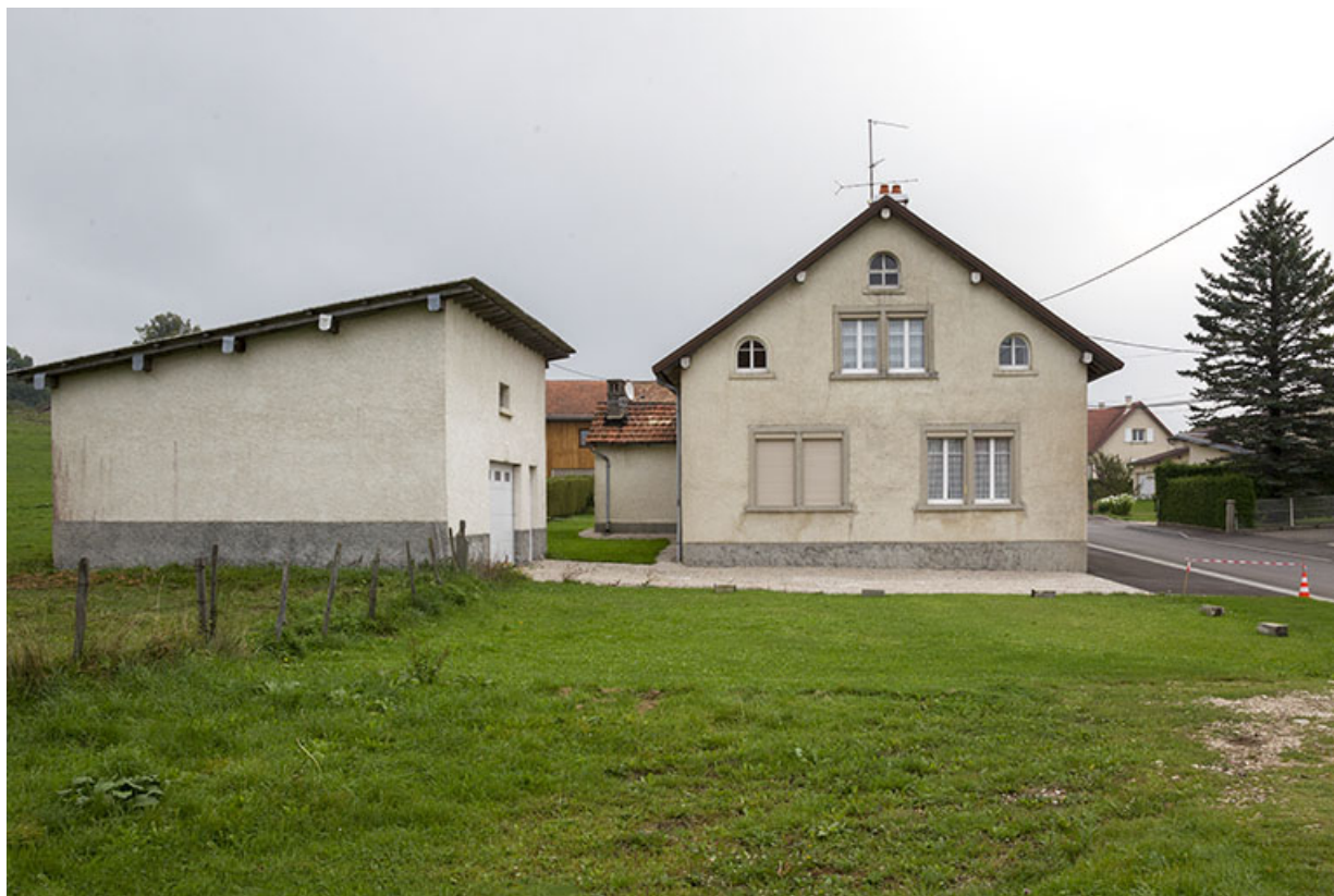
Vue d'ensemble, depuis le sud-ouest (garage et façade latérale gauche du bâtiment).