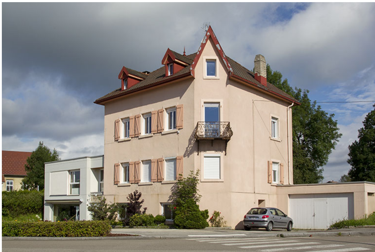
Vue d'ensemble, depuis le sud-est (façades antérieure et latérale droite). 25, Charquemont, 5 rue de l' Eglise