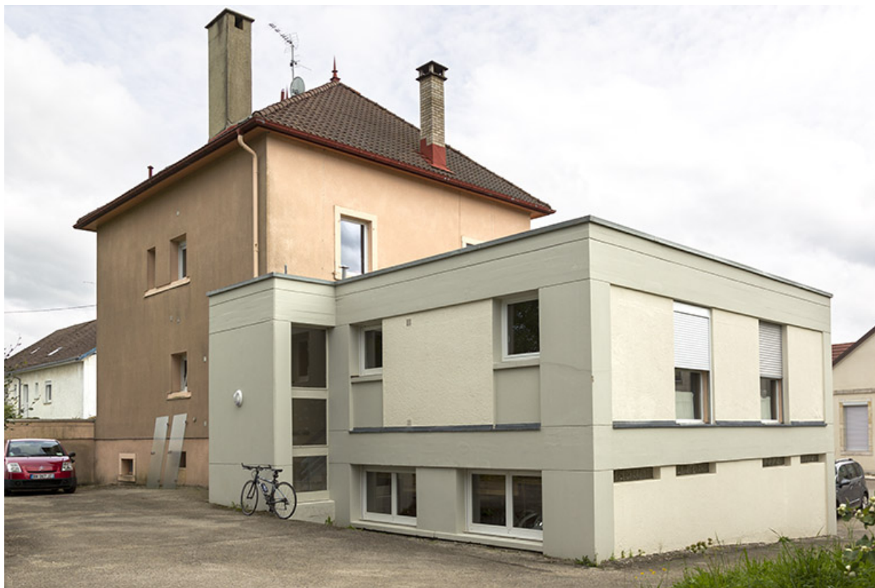
Vue d'ensemble, depuis le nord-ouest (façades postérieure et latérale gauche). 25, Charquemont, 5 rue de l' Eglise