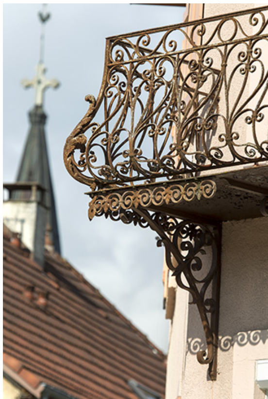
Balcon sur le pan coupé (détail). 25, Charquemont, 5 rue de l' Eglise