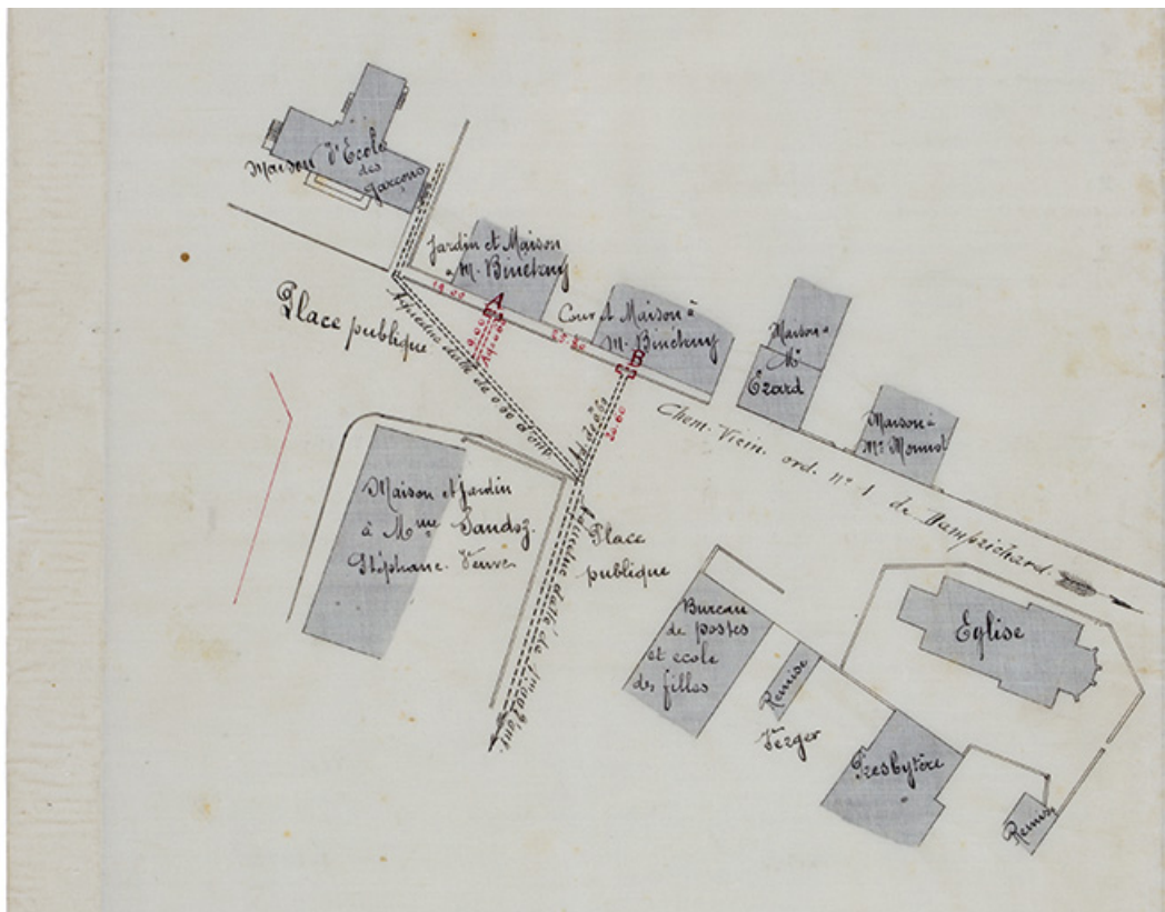
Chemin vicinal ordinaire n° 1 de Damprichard au Russey. Projet de construction d'aqueducs dans la traverse du village à Charquemont sur une longueur de [-] mètres. Plan d'ensemble, 4 octobre 1898

25, Charquemont, 8 place de l' Hôtel de Ville