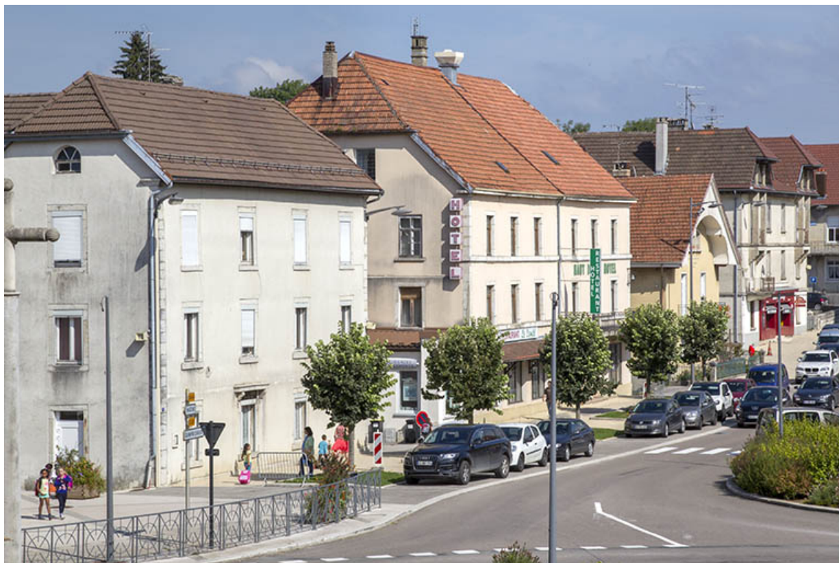
Vue d'ensemble du côté nord de la place de l'Hôtel de Ville. Le logement patronal est au premier plan à gauche. 25, Charquemont