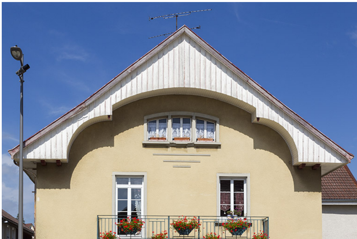
Corps de bâtiment principal, façade antérieure : niveaux supérieurs et lambrichure.

25, Charquemont, 8 place de l' Hôtel de Ville