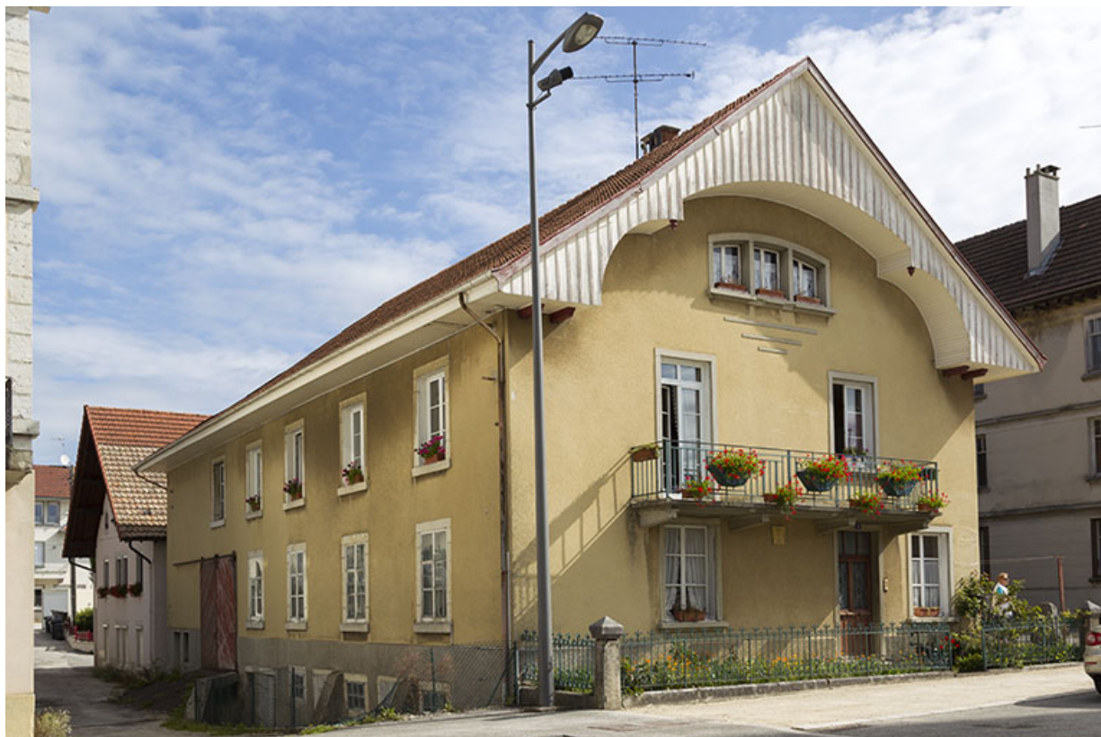
Corps de bâtiment principal : façades antérieure et latérale gauche.

25, Charquemont, 8 place de l' Hôtel de Ville