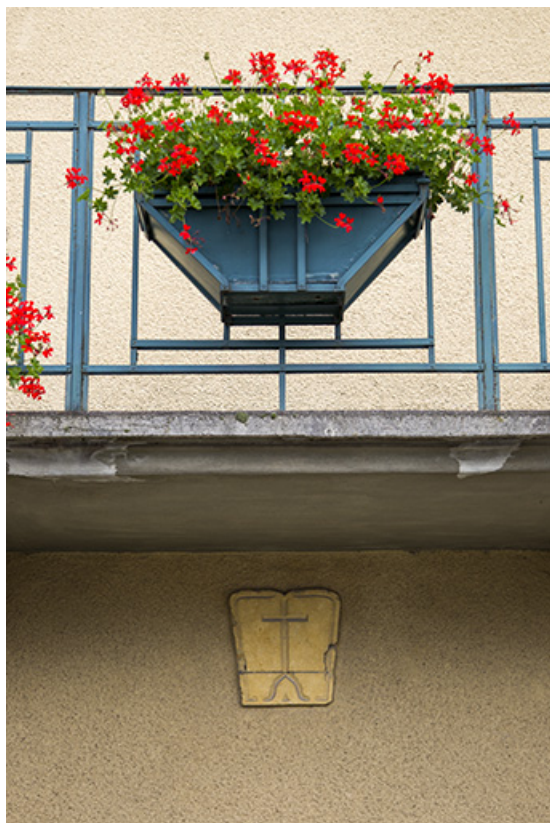
Corps de bâtiment principal, façade antérieure : pierre gravée d'une croix et grille du balcon. 25, Charquemont, 8 place de l' Hôtel de Ville