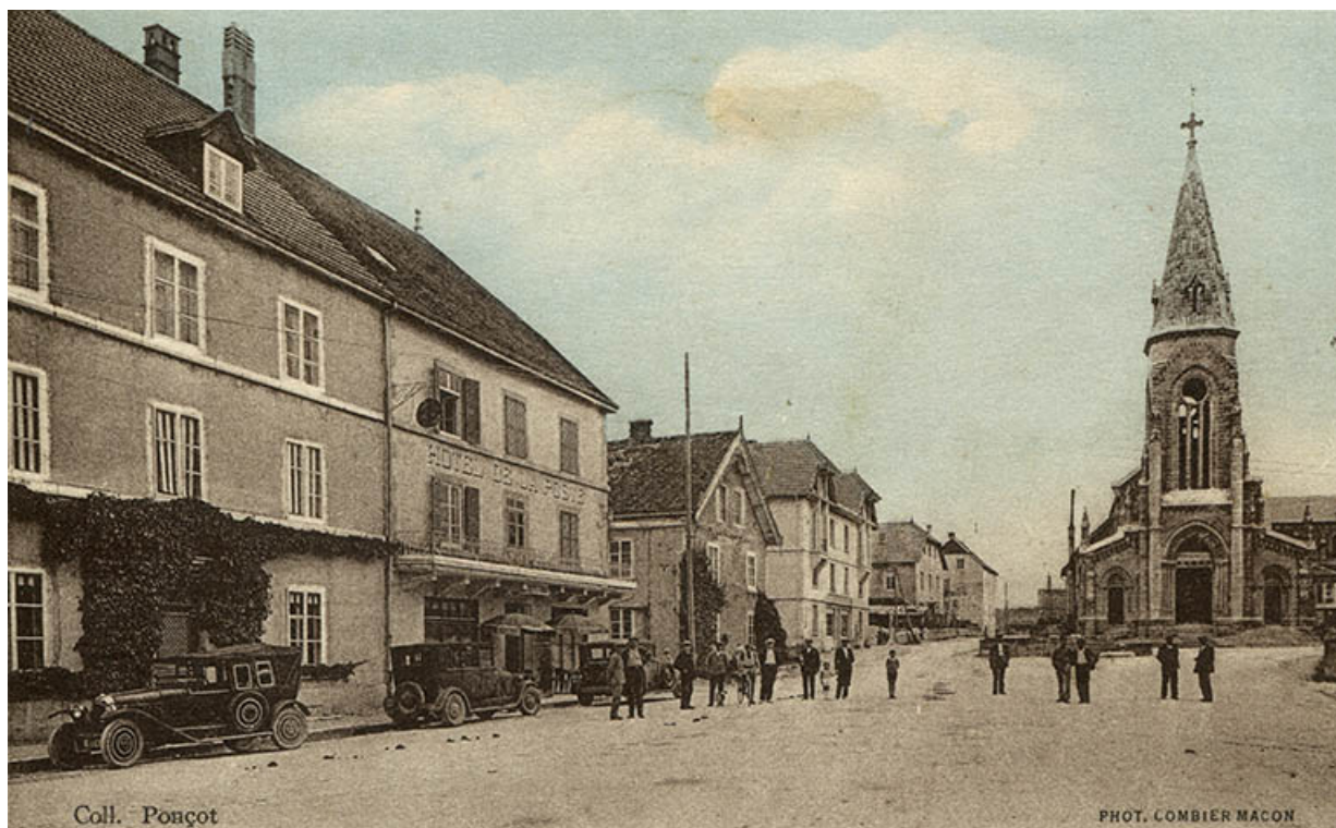
Charquemont (Doubs) - L'église et l'hôtel de la Poste, milieu 20e siècle.

25, Charquemont, 8 place de l' Hôtel de Ville