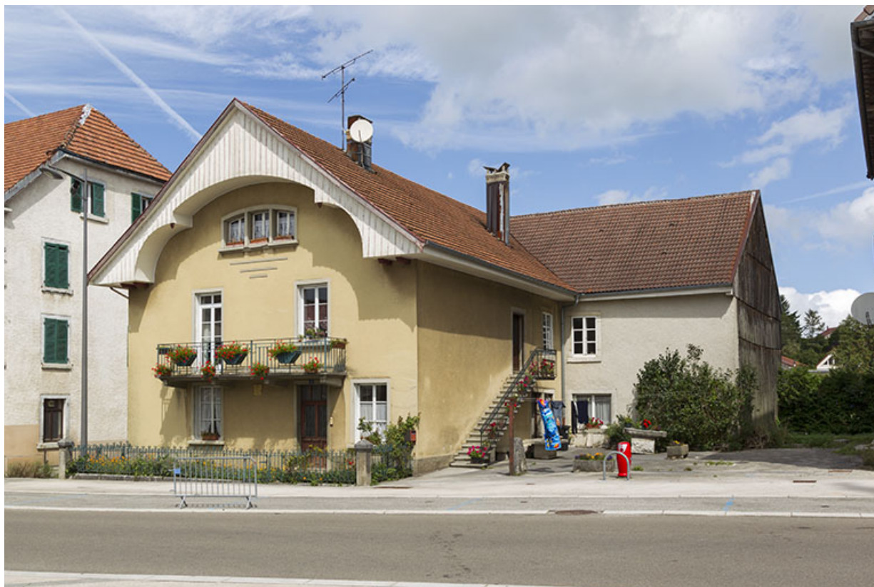
Vue d'ensemble des deux corps de bâtiment, depuis le sud-est.

25, Charquemont, 8 place de l' Hôtel de Ville