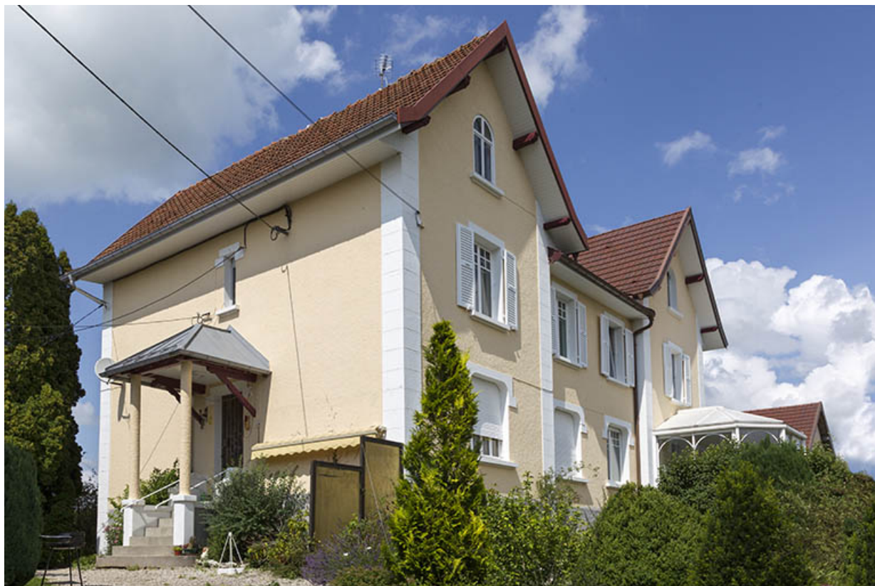
Maison, vue de trois quarts gauche.

25, Charquemont, 15 A et 17 rue des Lilas