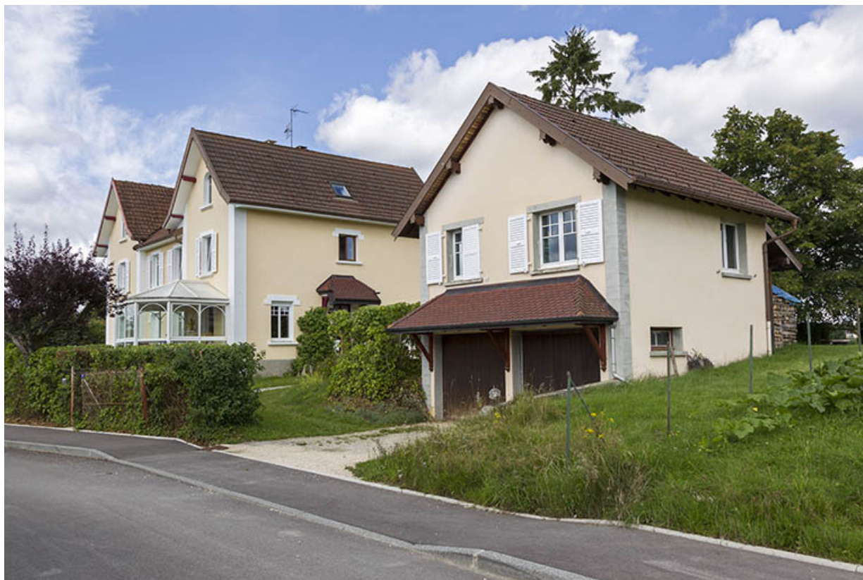
Vue d'ensemble, depuis l'est (maison et garage).

25, Charquemont, 15 A et 17 rue des Lilas