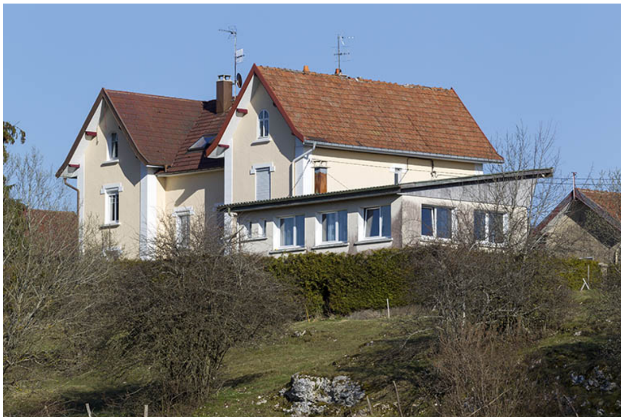
Vue d'ensemble, depuis l'ouest (maison et atelier).

25, Charquemont, 15 A et 17 rue des Lilas