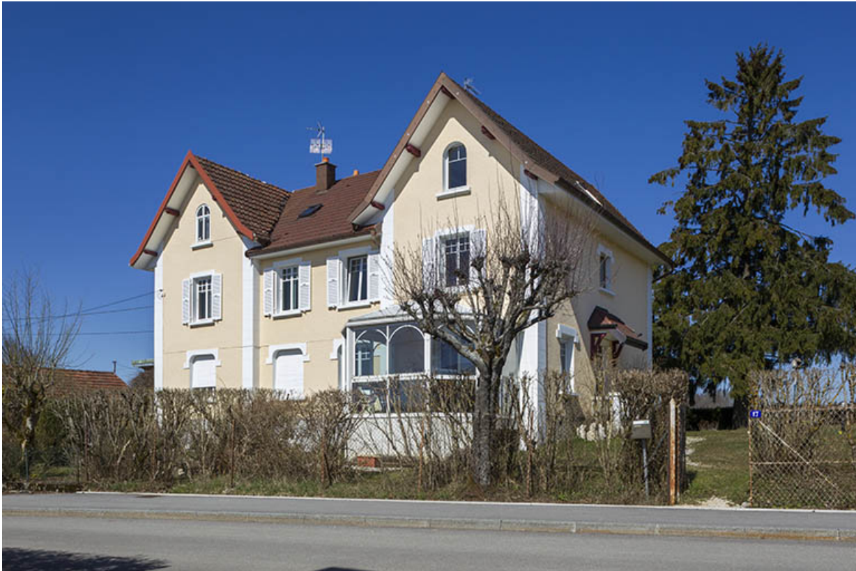
Maison, vue de trois quarts droite.

25, Charquemont, 15 A et 17 rue des Lilas