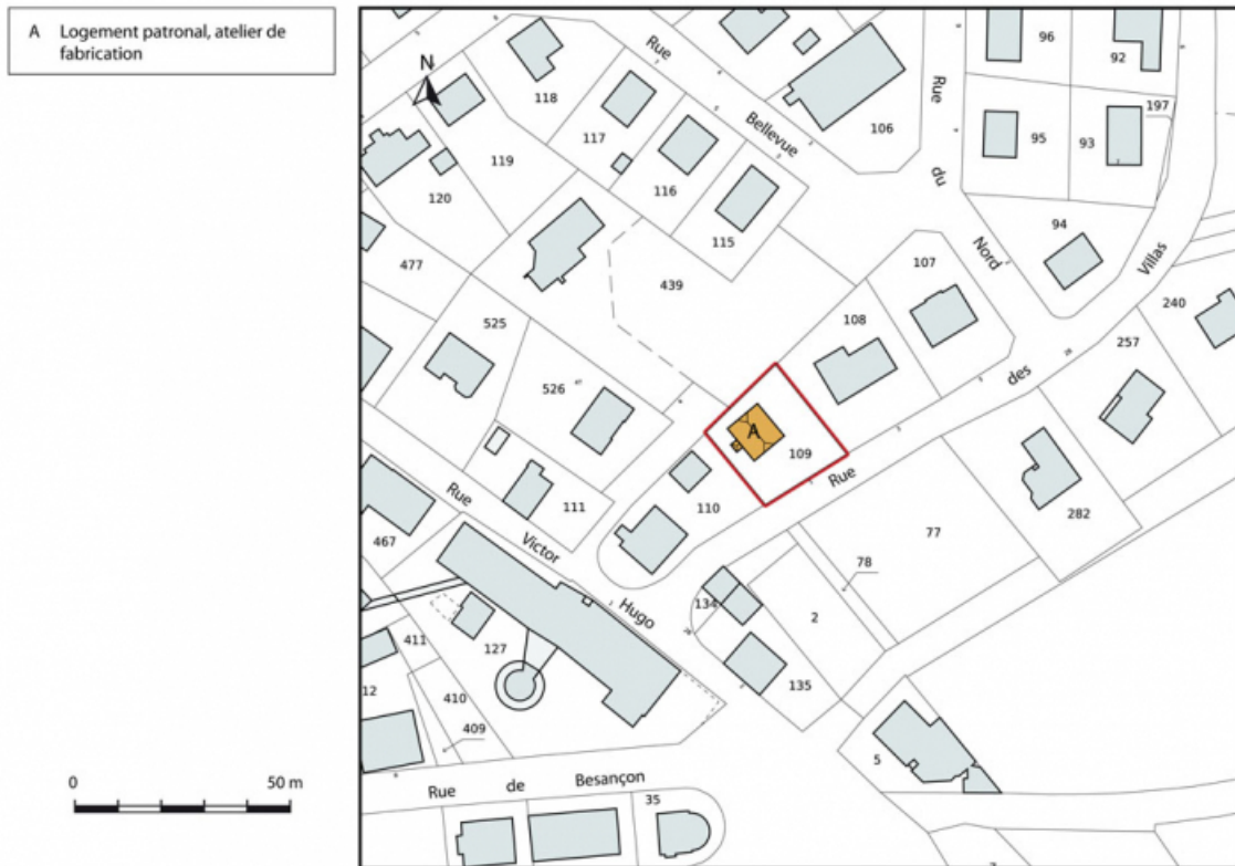
Plan-masse et de situation. Extrait du plan cadastral, 2015, section AB. 25, Charquemont, 1 rue des Villas