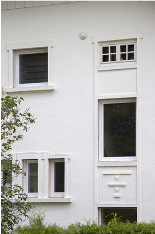
Façade postérieure : détail de baies.