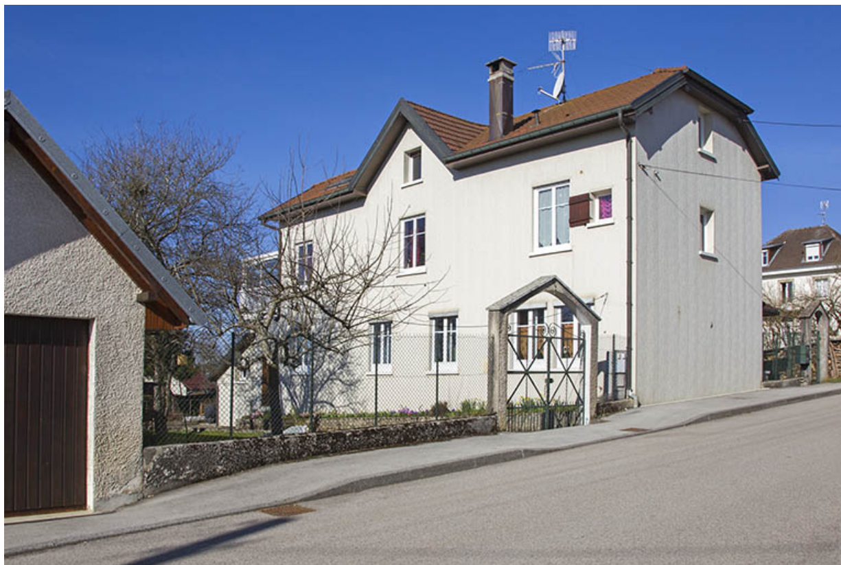
Façades postérieure et latérale gauche.