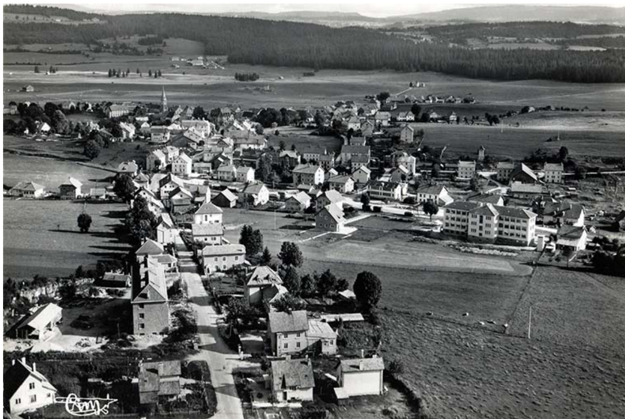
Charquemont (Doubs). 11058 - Vue générale aérienne, entre 1951 et 1958. La maison se trouve entre l'usine Rubis-Précis et le transformateur, à gauche de la scierie.