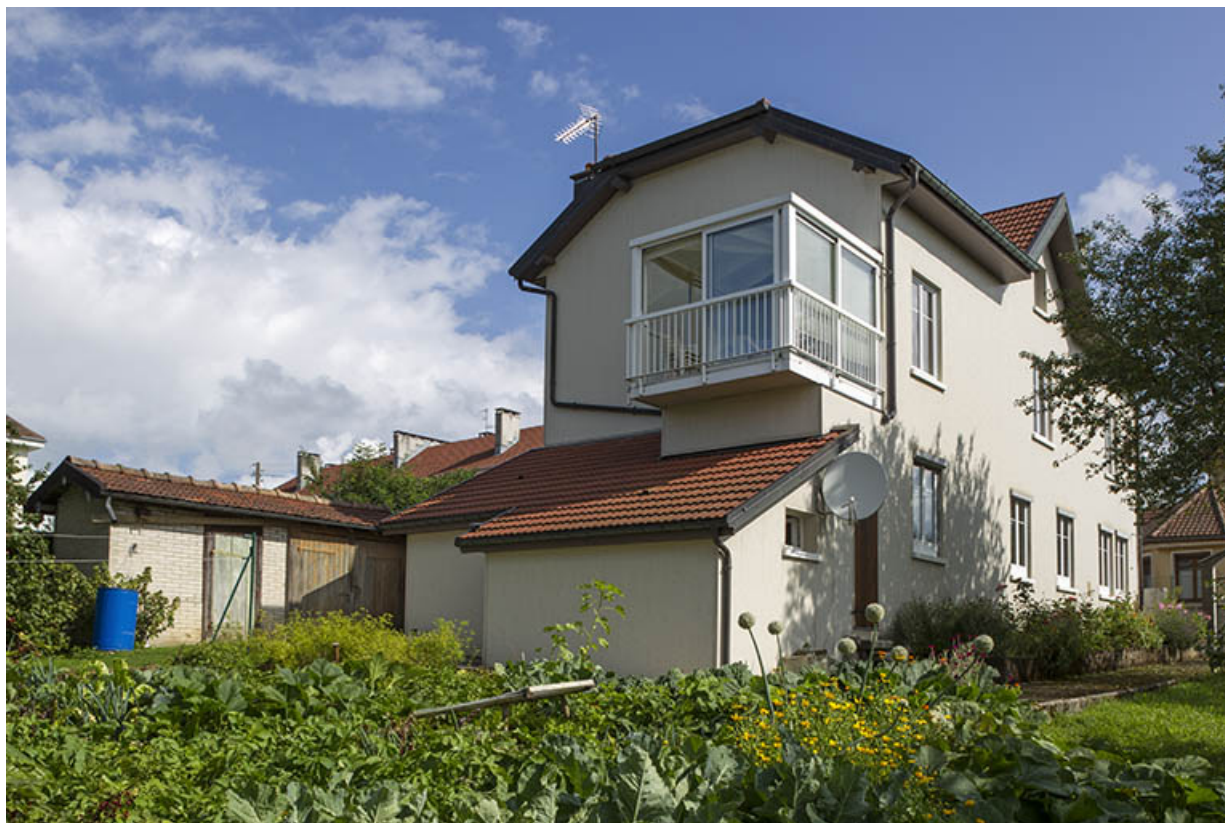
Façades postérieure et latérale droite.