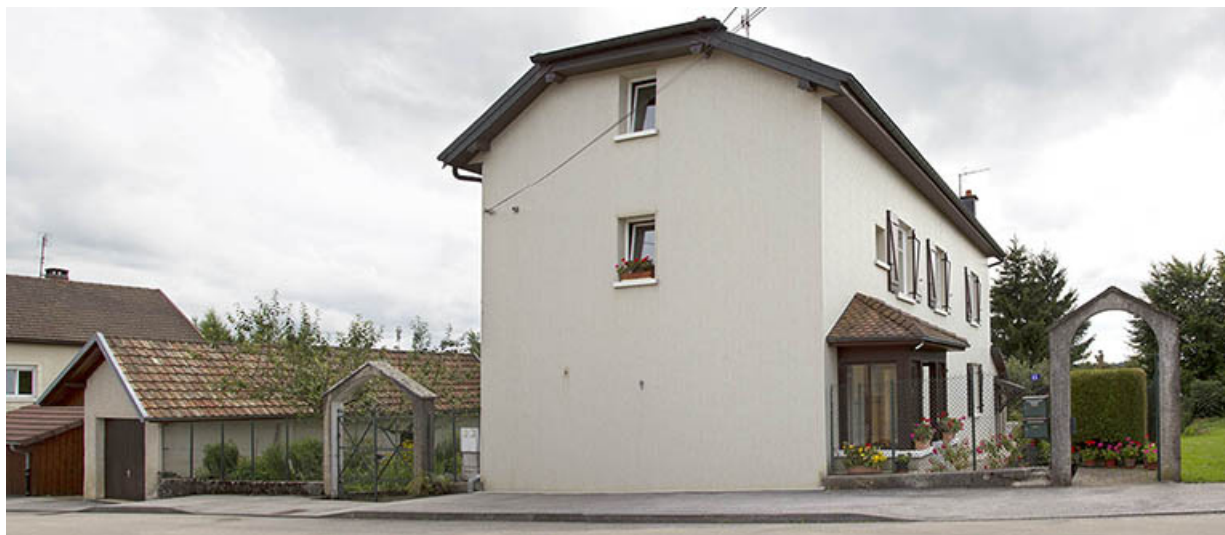
Vue d'ensemble depuis le nord-est (façades antérieure et latérale gauche). A gauche le garage. 25, Charquemont, 15 rue Victor Hugo

N° de l'illustration : 20152500886NUC4AQ