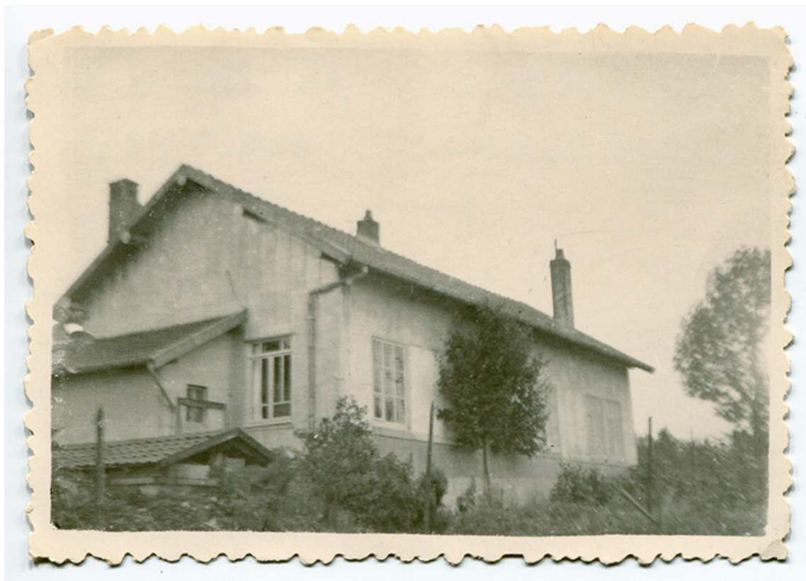
La maison 15 rue V. Hugo Charquemont avant 1950, 2e quart 20e siècle. 25, Charquemont, 15 rue Victor Hugo