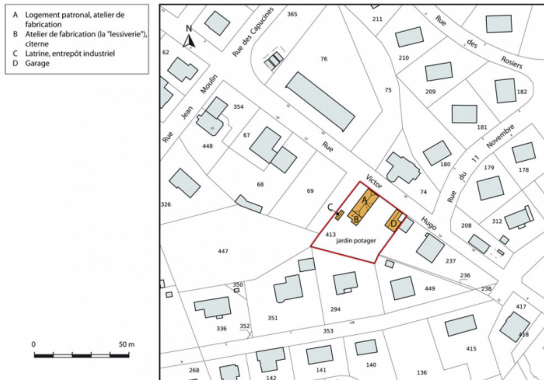
Plan-masse et de situation. Extrait du plan cadastral, 2015, section AB. 25, Charquemont, 15 rue Victor Hugo