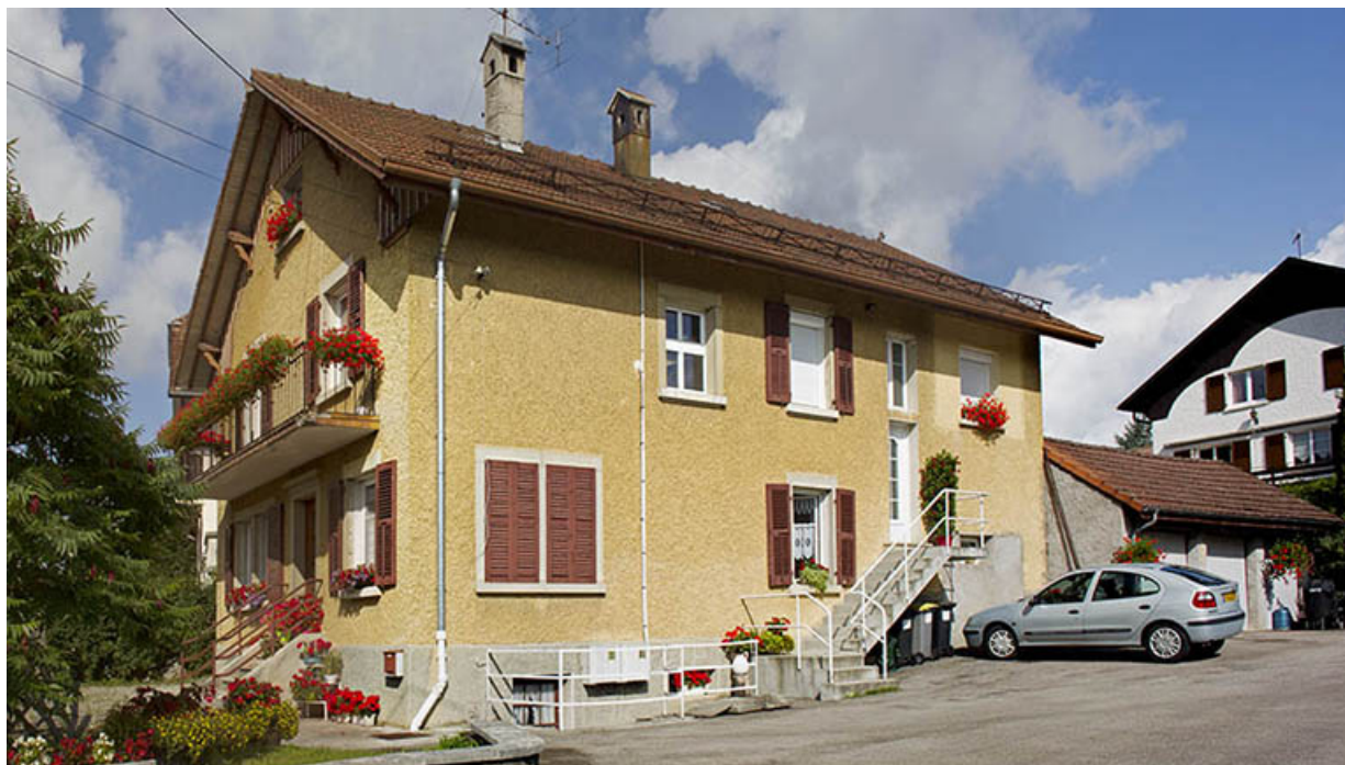
Façades antérieure et latérale droite. 25, Charquemont, 10 rue de Besançon

N° de l'illustration : 20142501741NUC4AQ