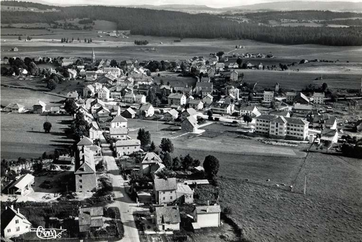
Charquemont (Doubs). 11058 - Vue générale aérienne, entre 1951 et 1958. La maison se trouve entre l'usine Rubis-Précis et le transformateur, à gauche de la scierie.