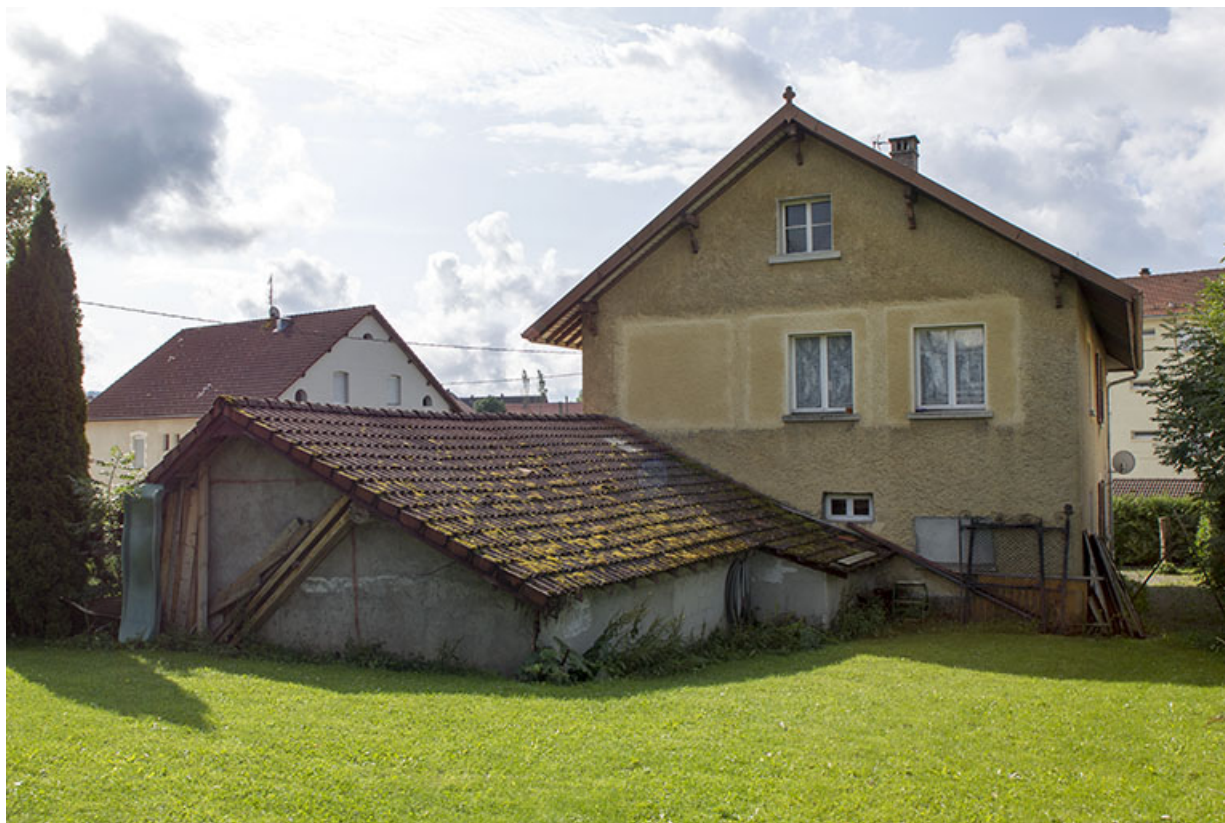
Façade postérieure. Noter les fenêtres d'atelier partiellement murées.