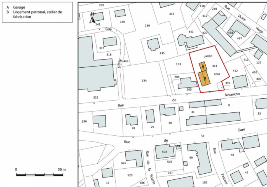
Plan-masse et de situation. Extrait du plan cadastral, 2015, section AB. 25, Charquemont, 10 rue de Besançon