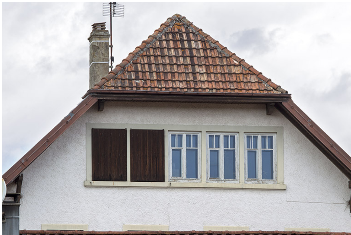
Façade postérieure : fenêtres multiples éclairant l'étage en surcroît.