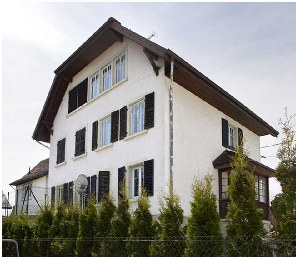
Vue d'ensemble, depuis l'est (façades postérieure et latérale gauche).