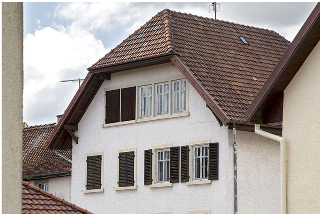
Façade postérieure : fenêtres de l'étage carré et de l'étage en surcroît. 25, Charquemont, 7 rue du Château