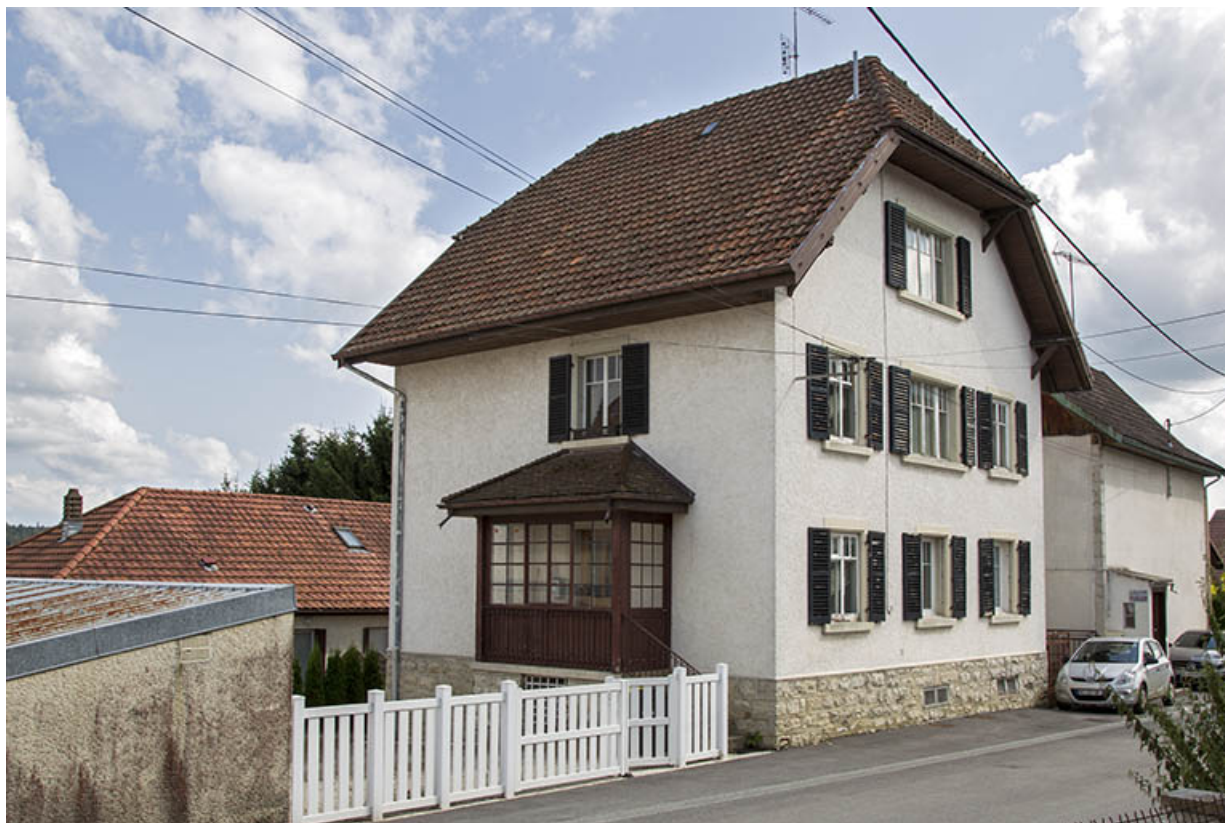
Vue d'ensemble, depuis le nord (façades antérieure et latérale gauche). 25, Charquemont, 7 rue du Château