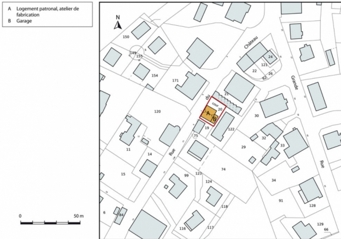
Plan-masse et de situation. Extrait du plan cadastral, 2015, section AH. 25, Charquemont, 7 rue du Château