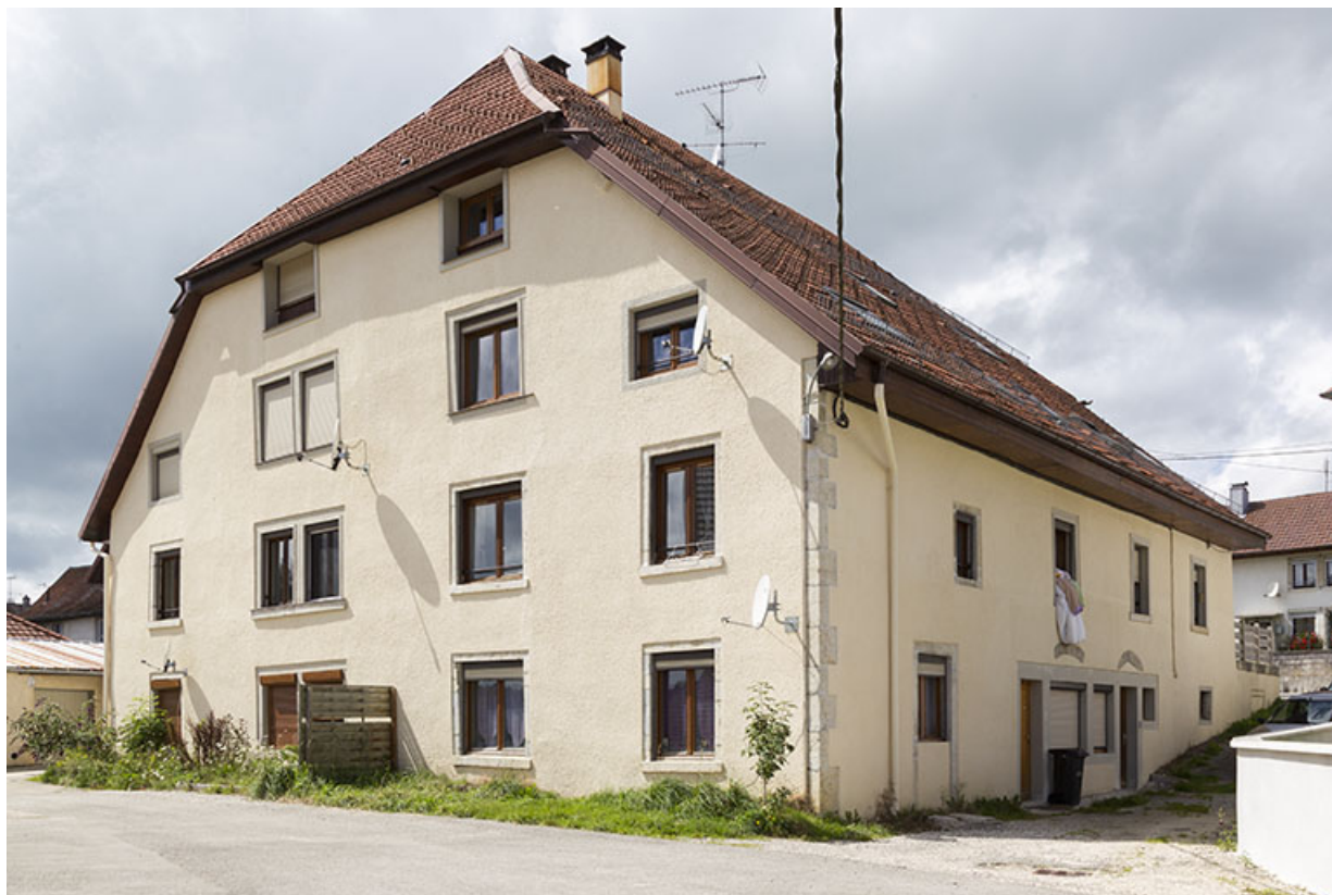
Vue d'ensemble, depuis l'est (façades postérieure et latérale gauche). 25, Charquemont, 5 rue du Château