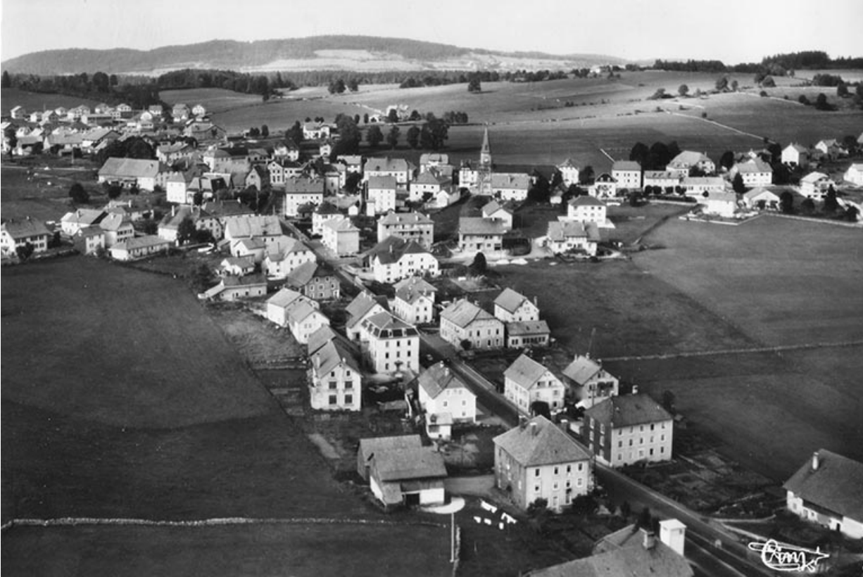
Charquemont (Doubs). 210-1 A. Vue générale [la Grande Rue et le bas du village vus du sud], 3e quart 20e siècle. 25, Charquemont, 8 rue de l' Eglise