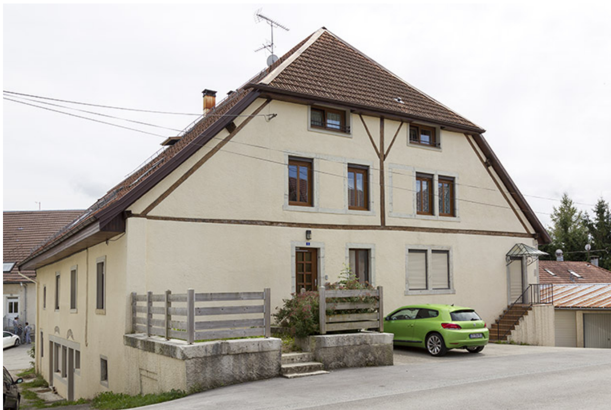
Vue d'ensemble, depuis le nord (façades antérieure et latérale gauche). 25, Charquemont, 5 rue du Château