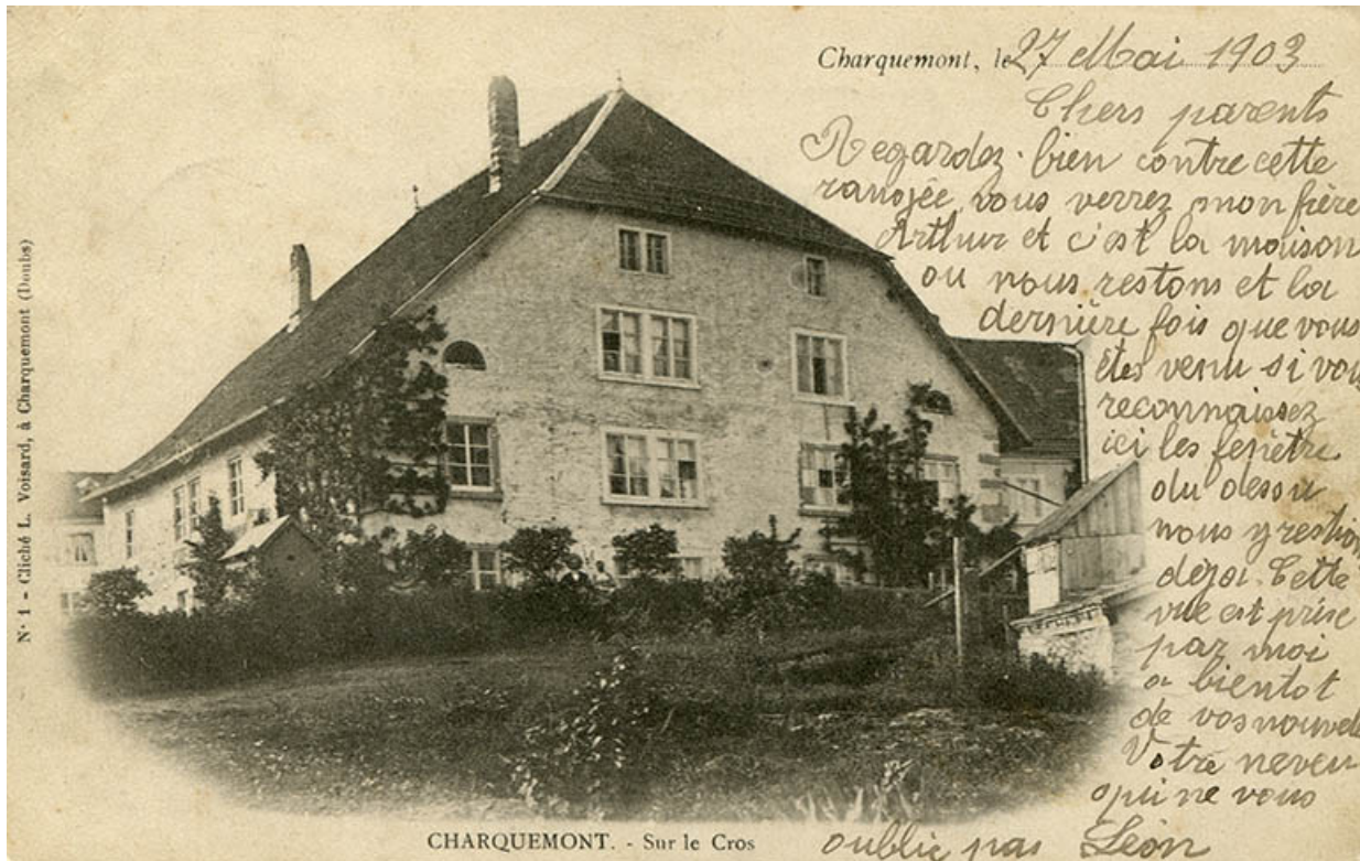
Charquemont. - Sur le Cros [façade postérieure de la maison], 4e quart 19e siècle (avant 1903). 25, Charquemont, 5 rue du Château