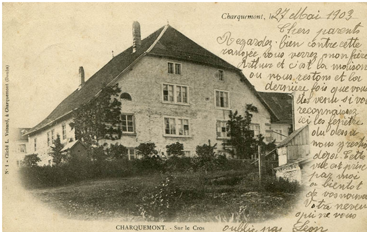
Charquemont. - Sur le Cros [façade postérieure de la maison], 4e quart 19e siècle (avant 1903). 25, Charquemont, 5 rue du Château