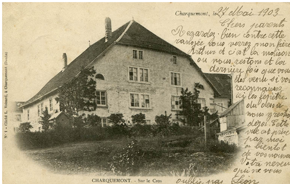
Charquemont. - Sur le Cros [façade postérieure de la maison], 4e quart 19e siècle (avant 1903).