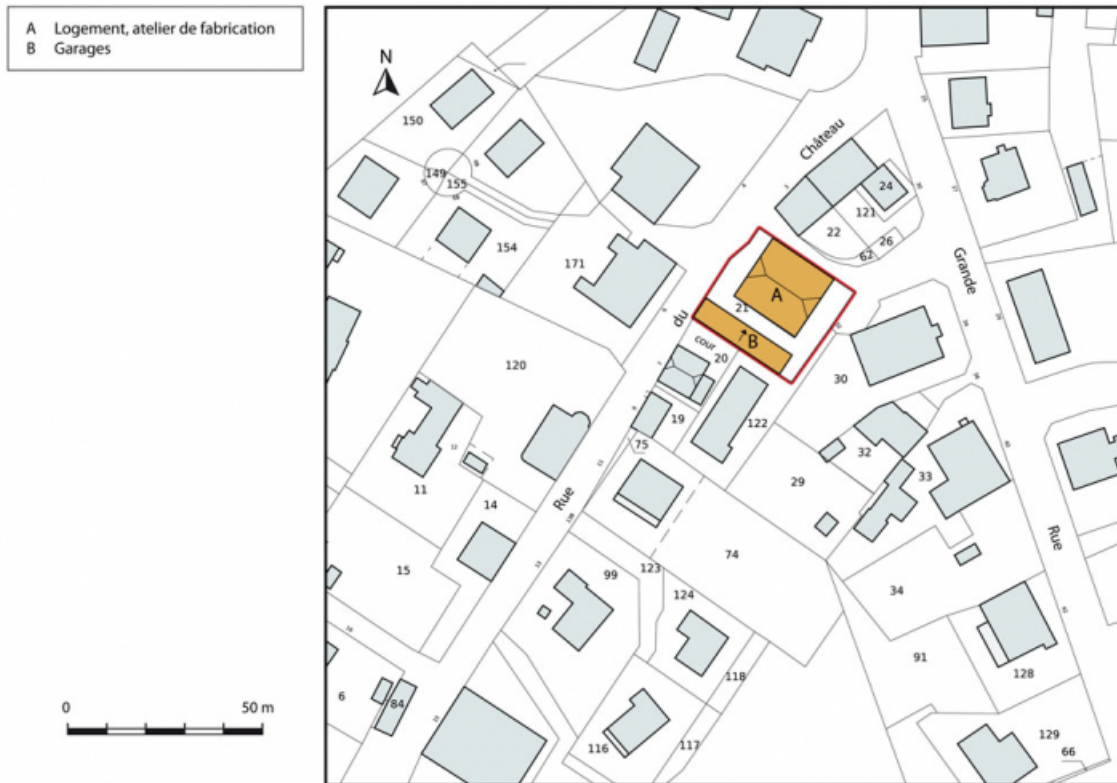
Plan-masse et de situation. Extrait du plan cadastral, 2015, section AH. 25, Charquemont, 5 rue du Château