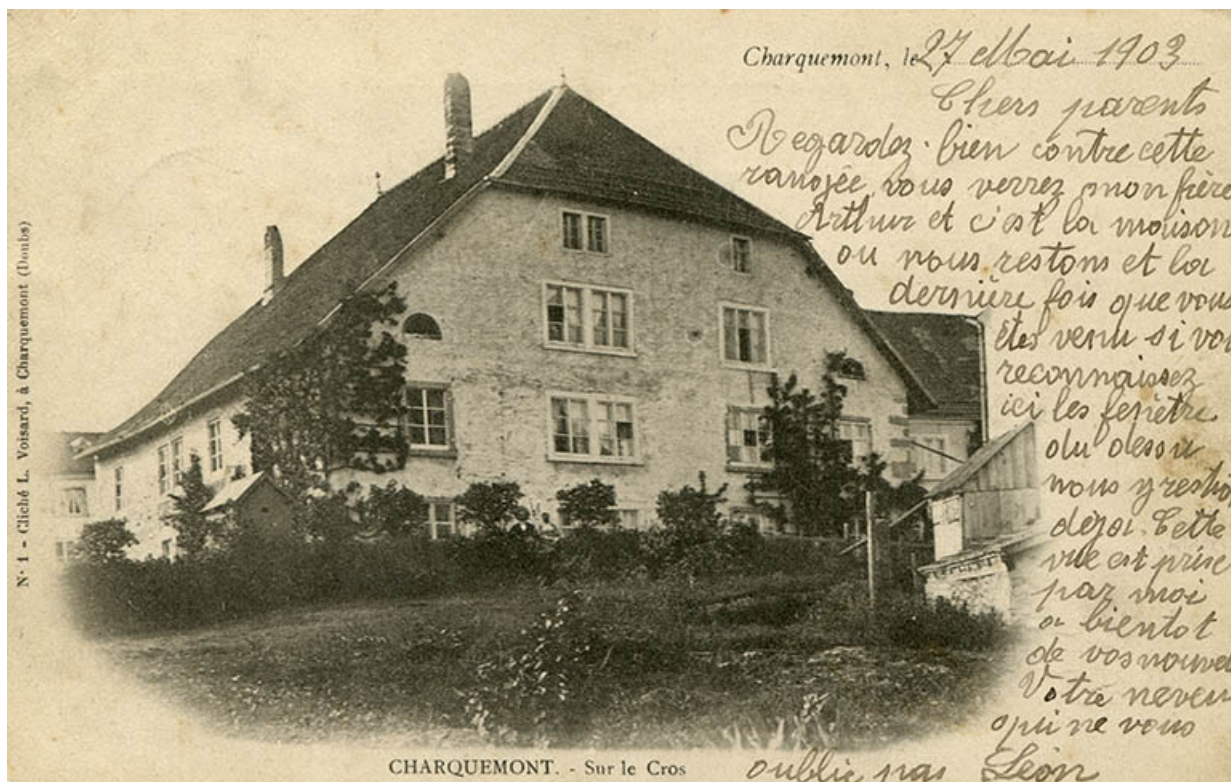
Charquemont. - Sur le Cros [façade postérieure de la maison], 4e quart 19e siècle (avant 1903). 25, Charquemont, 5 rue du Château