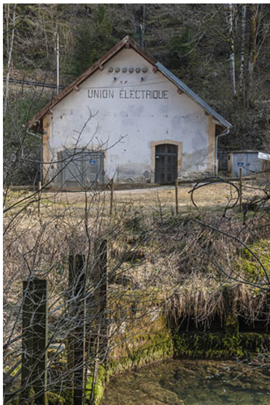
Façade antérieure de la centrale.