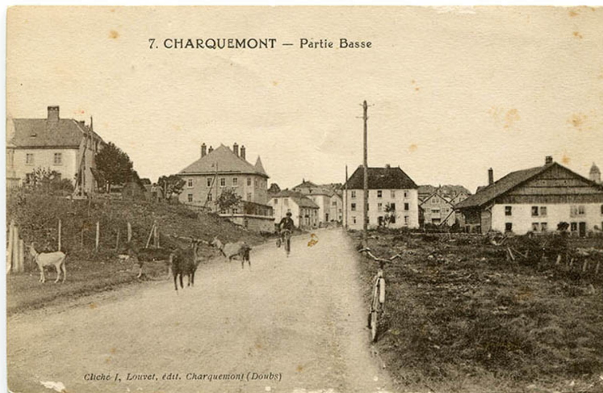
7. Charquemont - Partie basse [la Grande Rue depuis la rue de la Vierge], 1er quart 20e siècle. 25, Charquemont, 49 Grande Rue

7. Charquemont - Partie basse [la Grande Rue depuis la rue de la Vierge], carte postale, par J. Louvet, s.d. [1er quart 20e siècle], J. Louvet éd. à Charquemont