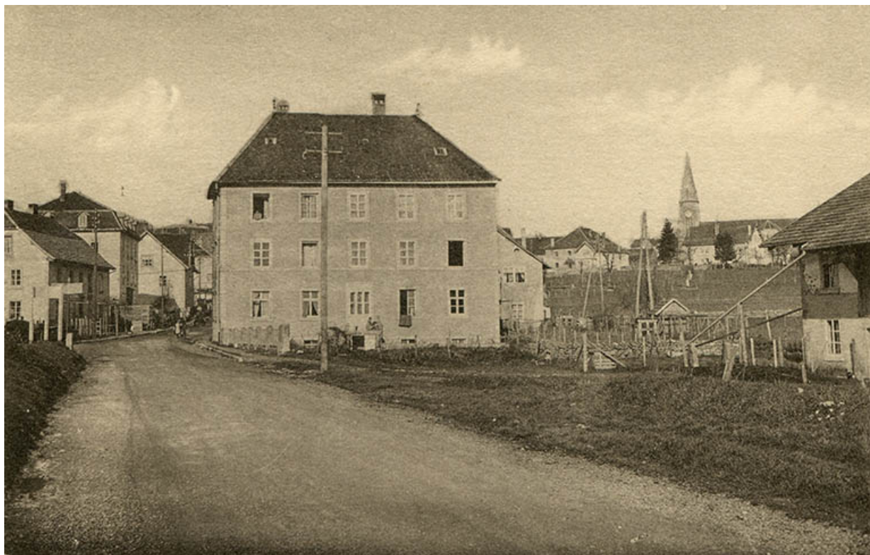
Charquemont (Doubs) - Vue générale [l'immeuble vu du sud], milieu 20e siècle. 25, Charquemont, 49 Grande Rue