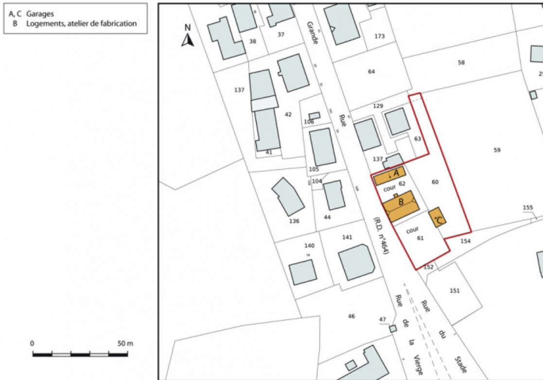
Plan-masse et de situation. Extrait du plan cadastral, 2015, section AE. 25, Charquemont, 49 Grande Rue