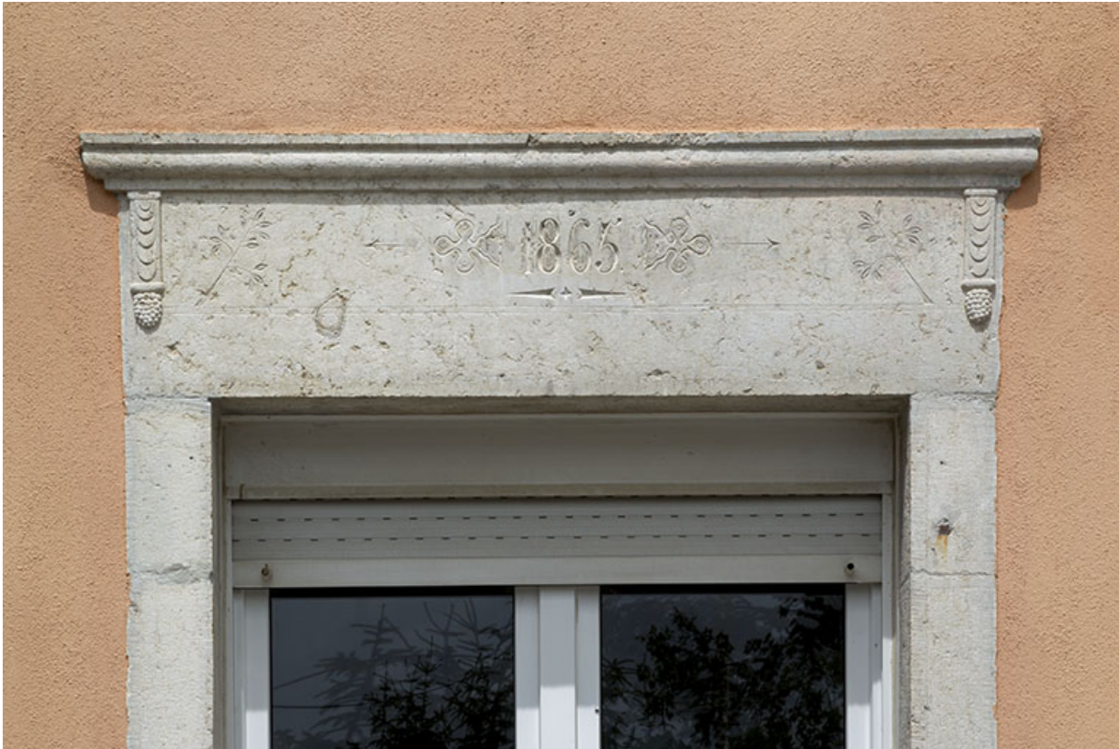
Façade postérieure : ancienne porte avec linteau daté.