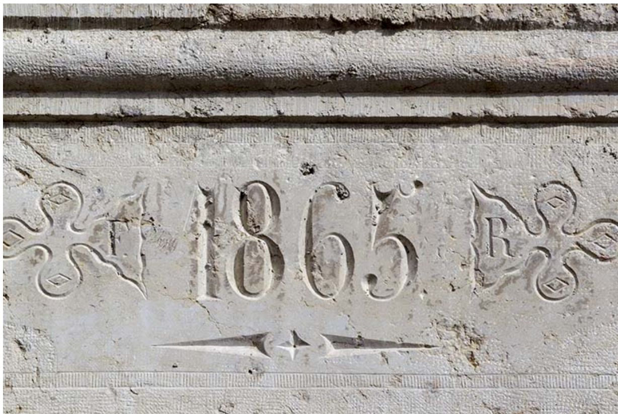
Façade postérieure : date et initiales sur le linteau de l'ancienne porte.