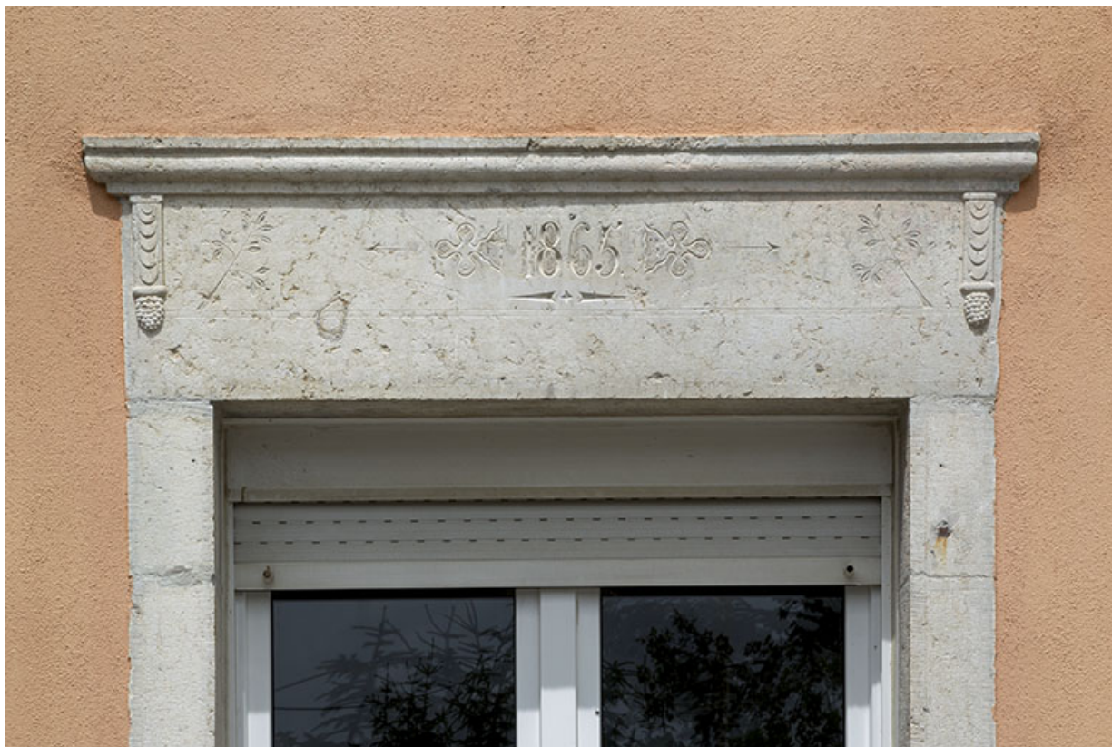
Façade postérieure : ancienne porte avec linteau daté.