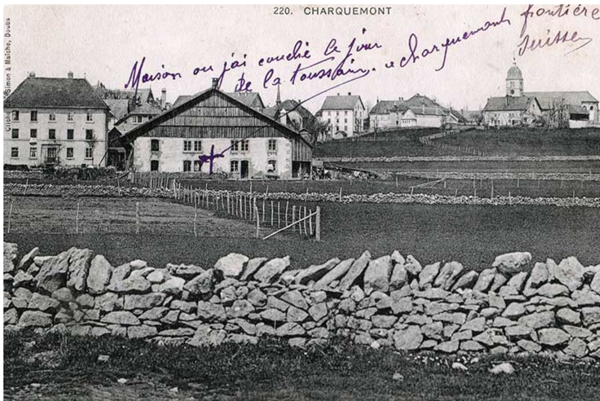
220. Charquemont [le bas du village et le quartier de l'église, vus du sud-est], 1er quart 20e siècle (avant 1911). 25, Charquemont, 49 Grande Rue