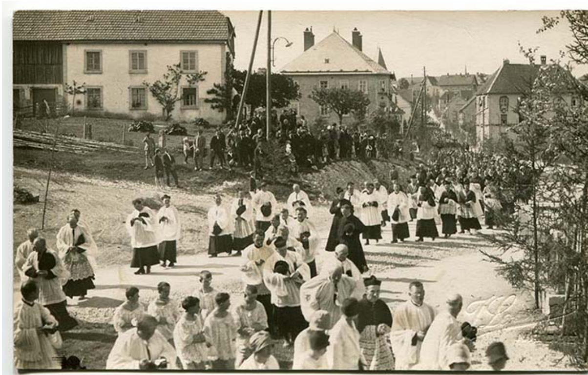
[Procession pour l'inauguration de la chapelle Sainte-Thérèse, rue de la Vierge (au niveau de la statue de Notre-Dame de Lourdes), le 3 juin 1929]. L'usine se devine à droite.