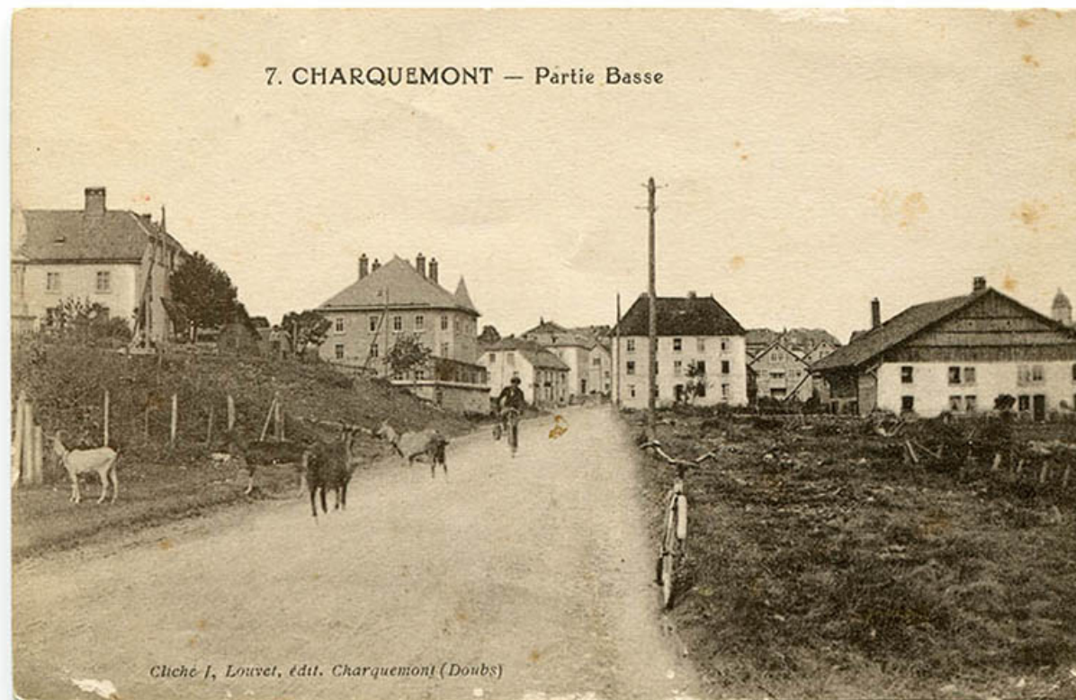
7. Charquemont - Partie basse [la Grande Rue depuis la rue de la Vierge], 1er quart 20e siècle. 25, Charquemont, 49 Grande Rue