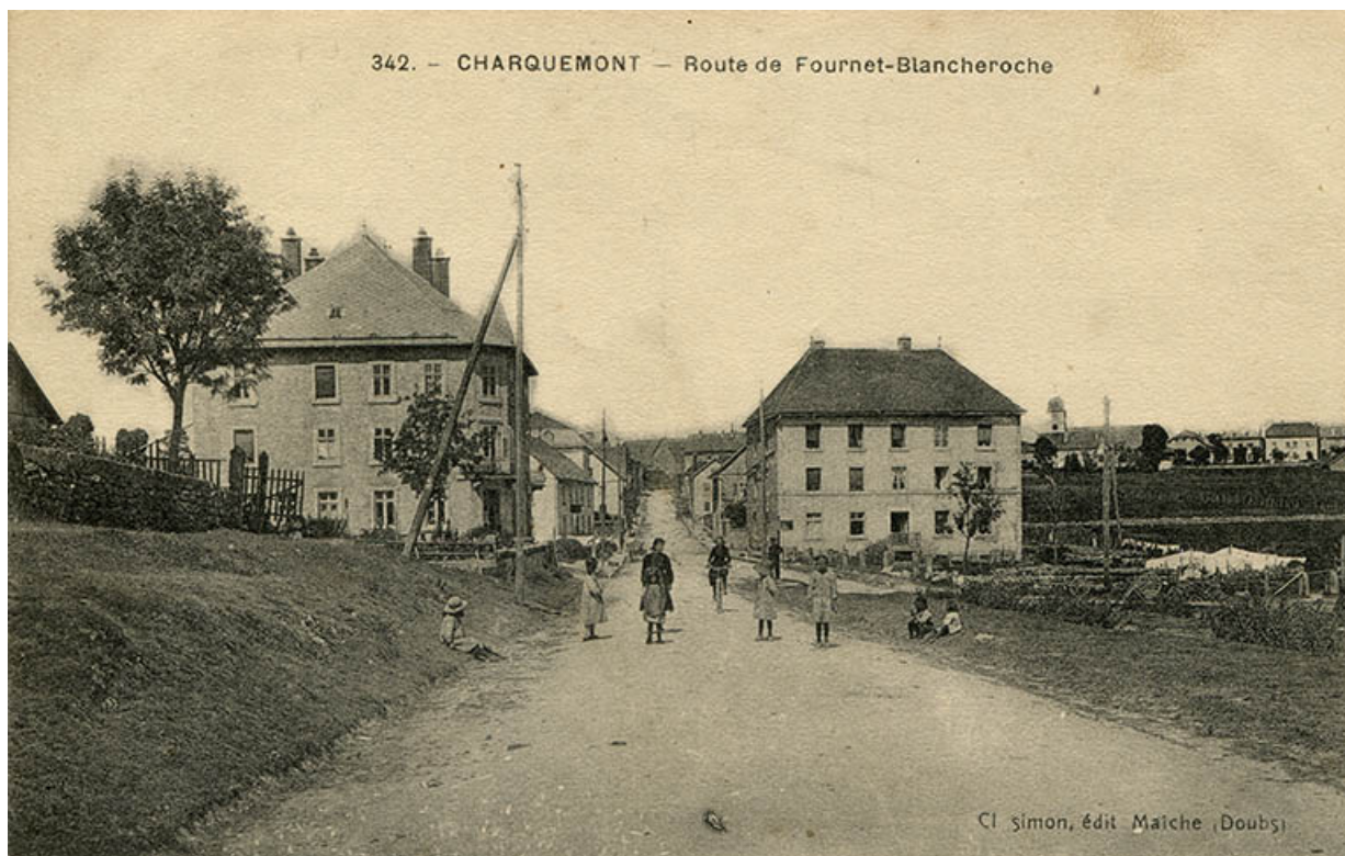
342. - Charquemont - Route de Fournet-Blancheroche [le bas du village depuis la statue de la Vierge], 1er quart 20e siècle. 25, Charquemont, 49 Grande Rue