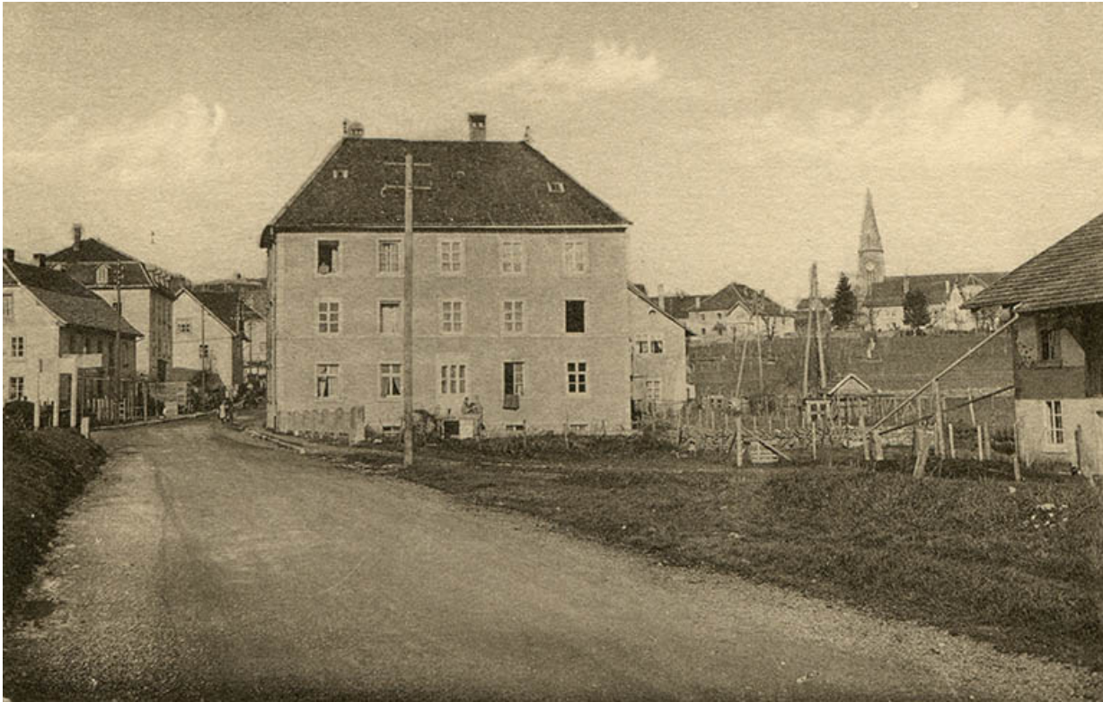
Charquemont (Doubs) - Vue générale [l'immeuble vu du sud], milieu 20e siècle. 25, Charquemont, 49 Grande Rue