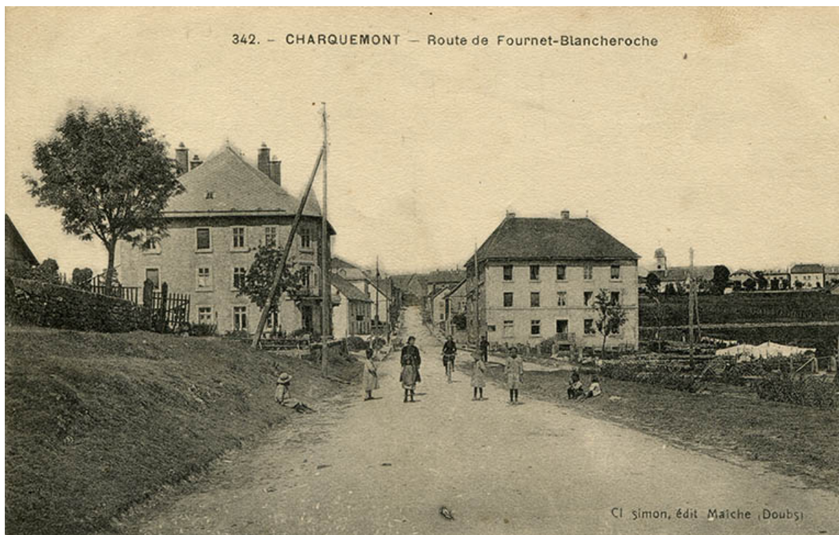
342. - Charquemont - Route de Fournet-Blancheroche [le bas du village depuis la statue de la Vierge], 1er quart 20e siècle. 25, Charquemont, 49 Grande Rue