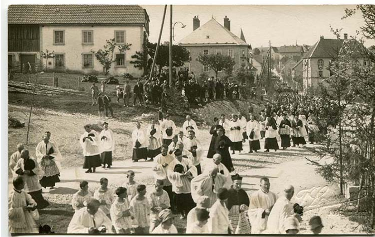
[Procession pour l'inauguration de la chapelle Sainte-Thérèse, rue de la Vierge (au niveau de la statue de Notre-Dame de Lourdes), le 3 juin 1929]. L'usine se devine à droite.