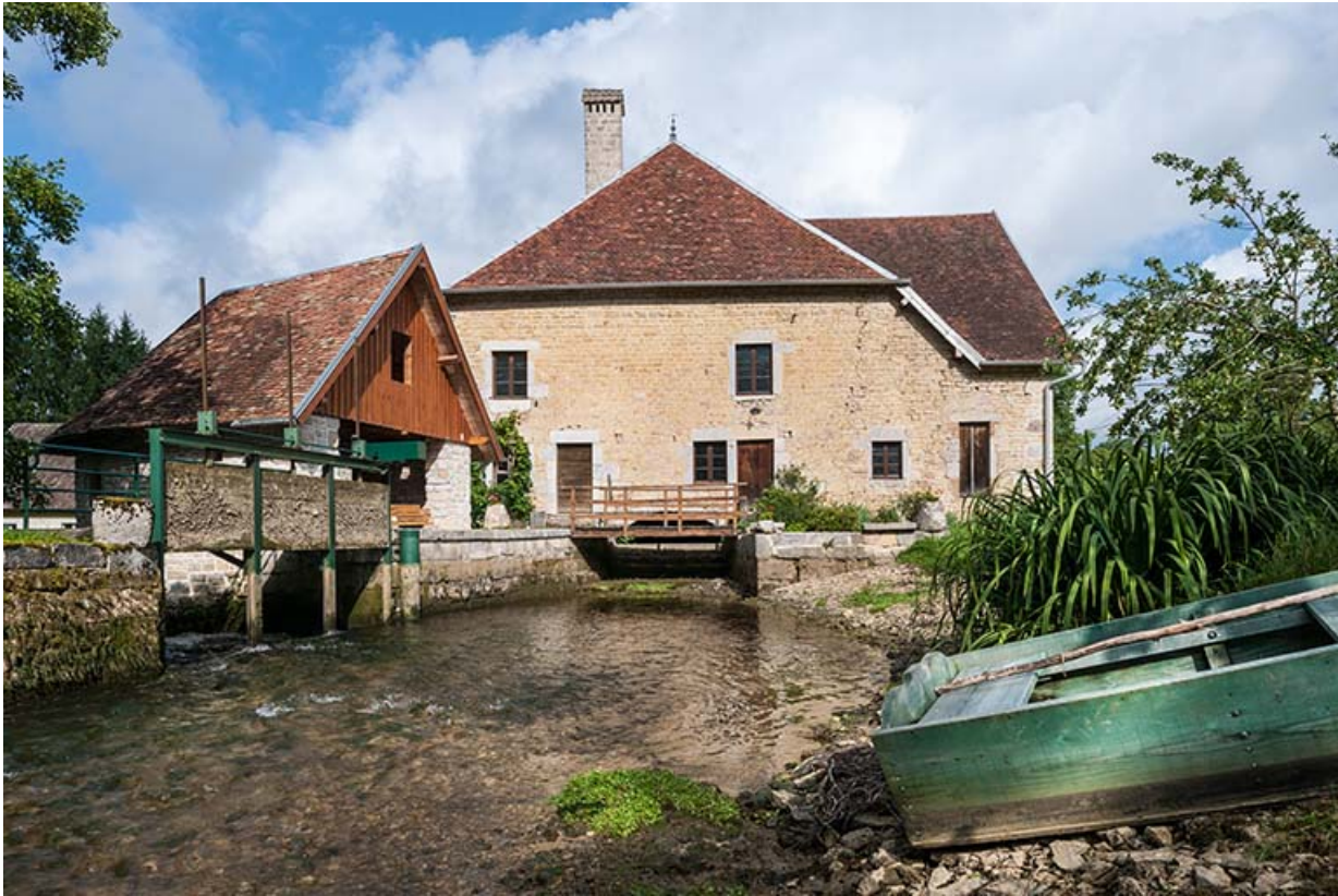
Vue rapprochée depuis le sud-est.