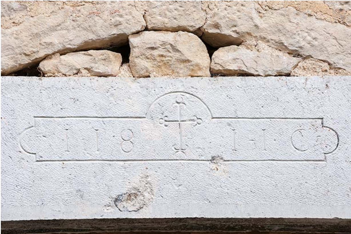
Détail d'un linteau de la façade sud.