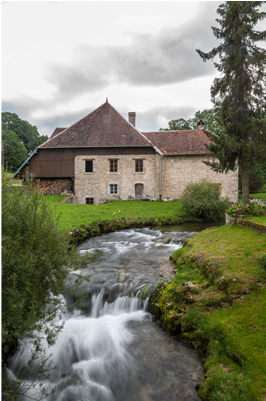
Vue d'ensemble depuis le nord-ouest (cadrage vertical). 25, Bremondans, lieudit : Amans