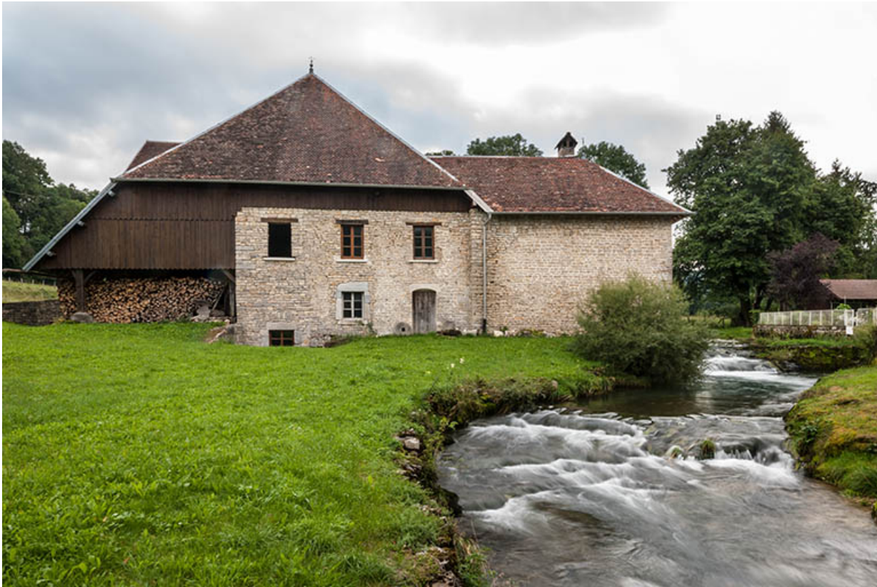
Vue d'ensemble depuis le nord-ouest.