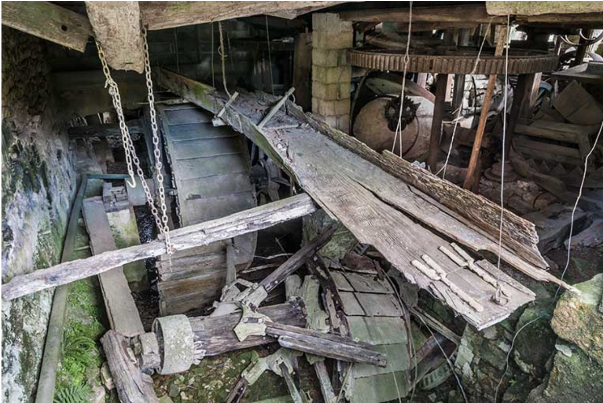
Vue plongeante sur la partie motrice : vestiges de deux roues hydrauliques et de la huche d'amenée. 25, Bremondans, lieudit : Amans