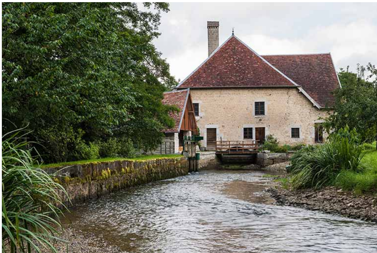
Vue depuis l'amont (canal d'amenée vidé). 25, Bremondans, lieudit : Amans