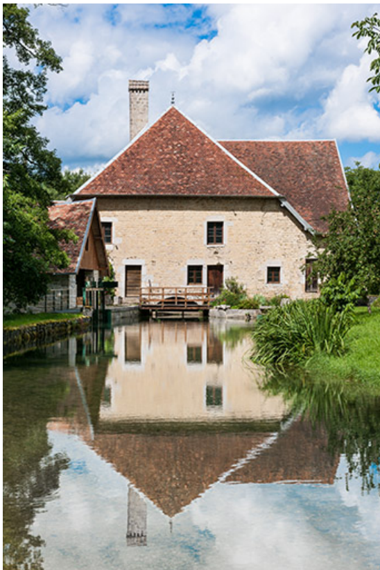
Vue d'ensemble depuis l'amont (cadrage vertical). 25, Bremondans, lieudit : Amans