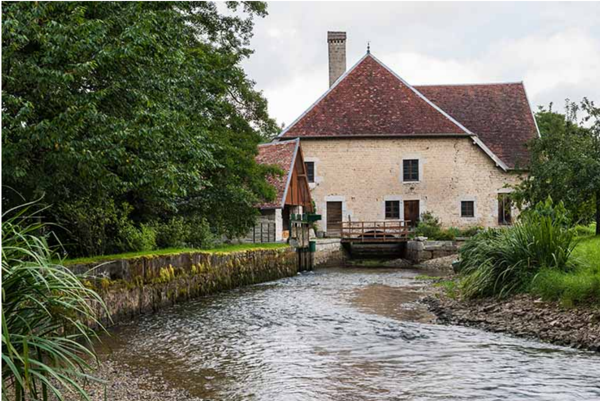
Vue depuis l'amont (canal d'amenée vidé). 25, Bremondans, lieudit : Amans