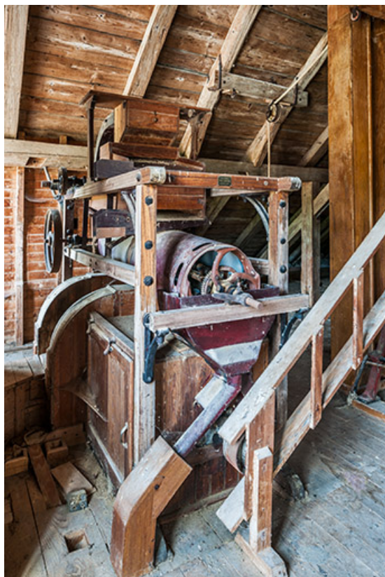
Etage de comble : trieur à grains Lhuillier.