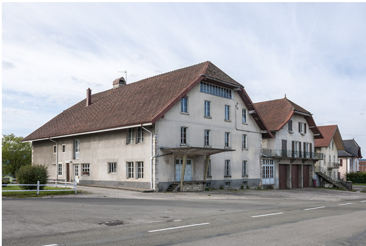
Vue de trois quarts depuis le nord.