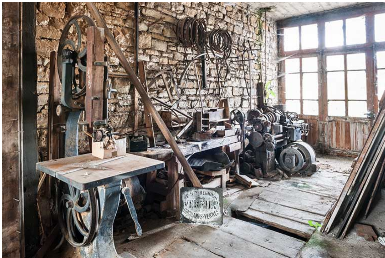
Atelier de réparation et salle des machines.