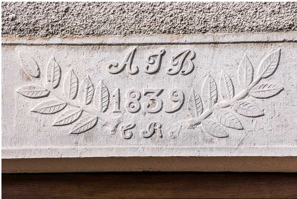
Détail du linteau de la porte (façade ouest).