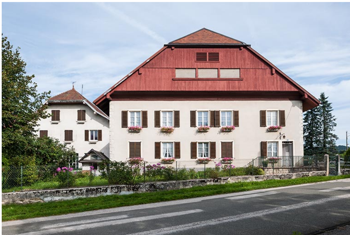
Façade sud de bâtiment (côté logement).