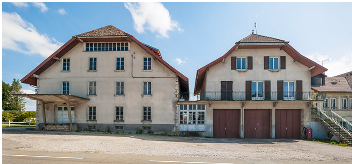
Murs-pignons nord de la minoterie et du bâtiment des garages et des logements.