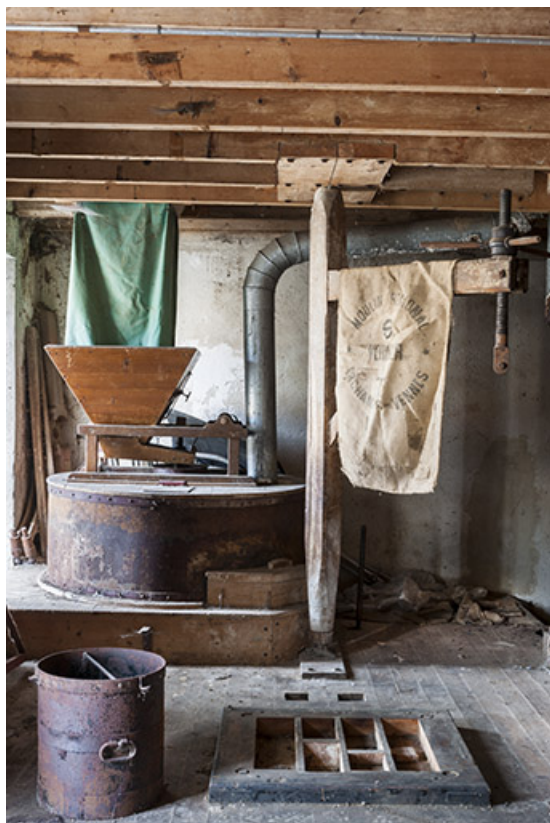
Rez-de-chaussée : une meule et sa potence.