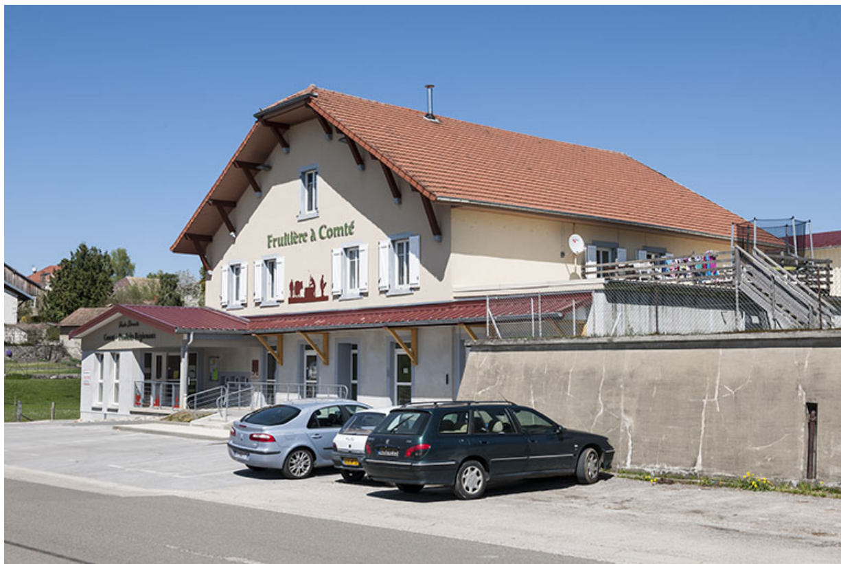
Vue de trois quarts droite. 25, Étalans, 41 Grande Rue