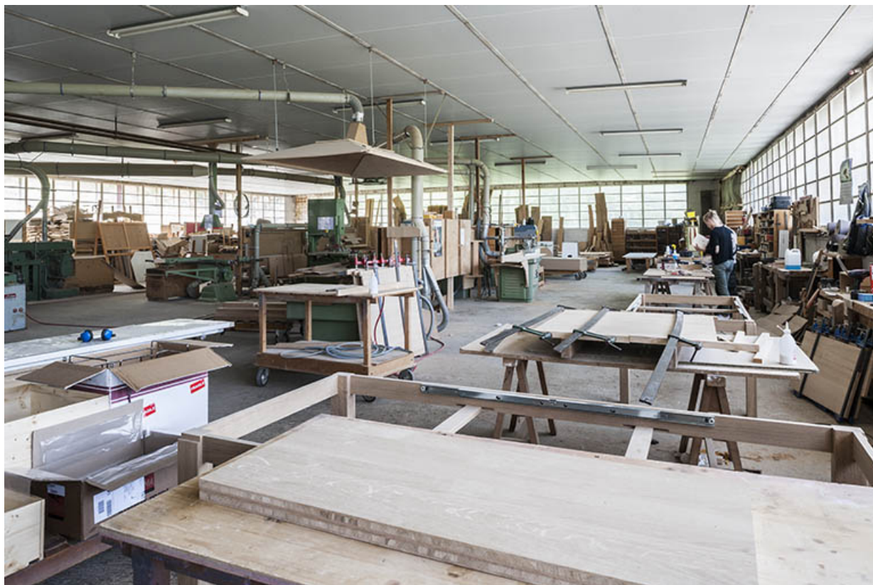
Atelier de menuiserie. Vue d'ensemble depuis l'est.

25, Orchamps-Vennes, 4 rue du Château d'eau