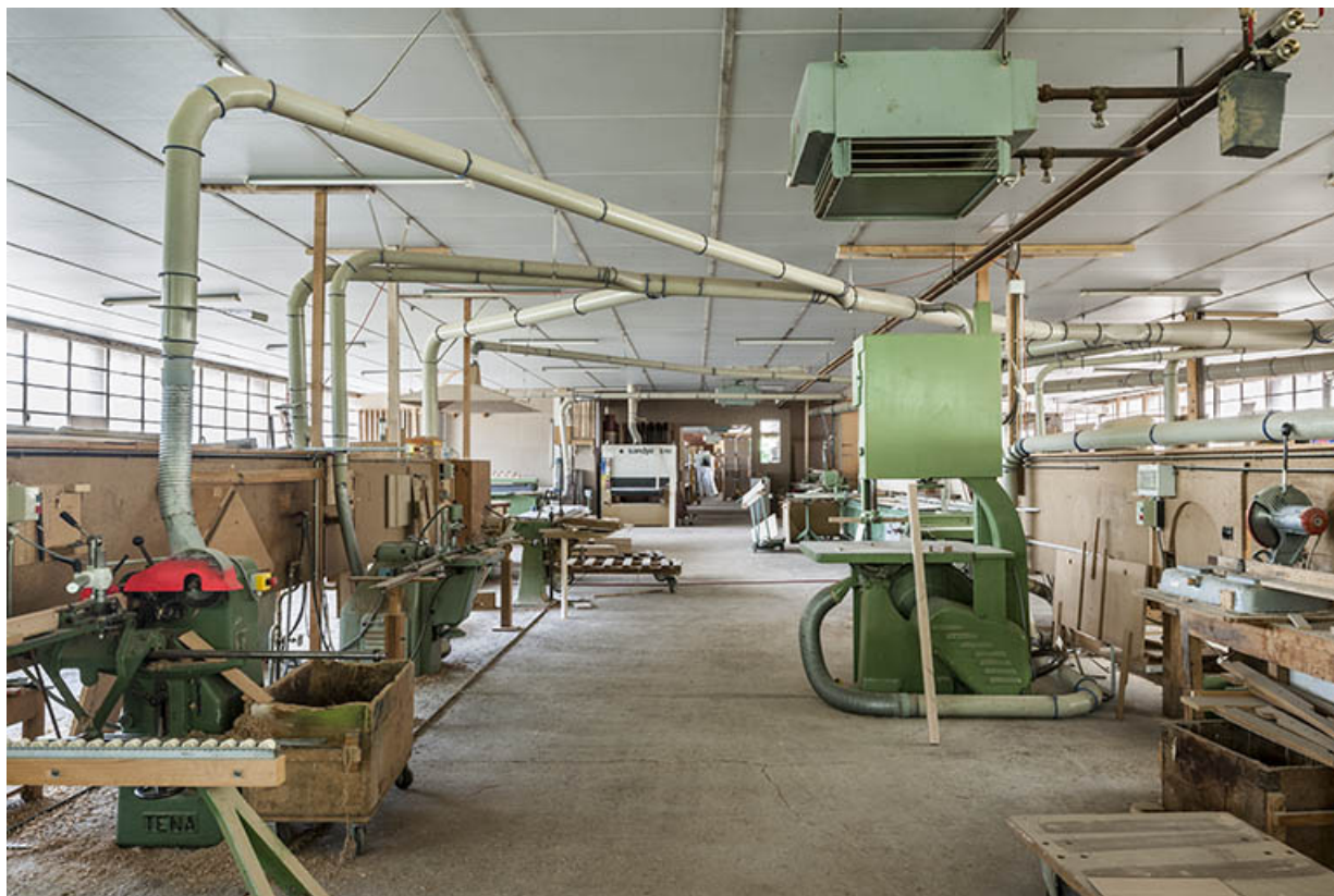
Atelier de menuiserie. Vue depuis le nord.

25, Orchamps-Vennes, 4 rue du Château d'eau