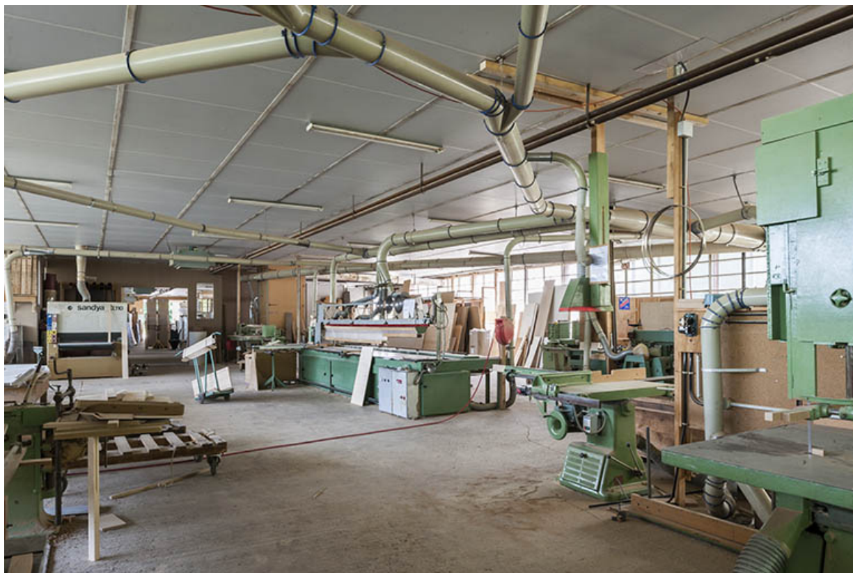
Atelier de menuiserie. Vue depuis l'entrée.

25, Orchamps-Vennes, 4 rue du Château d'eau