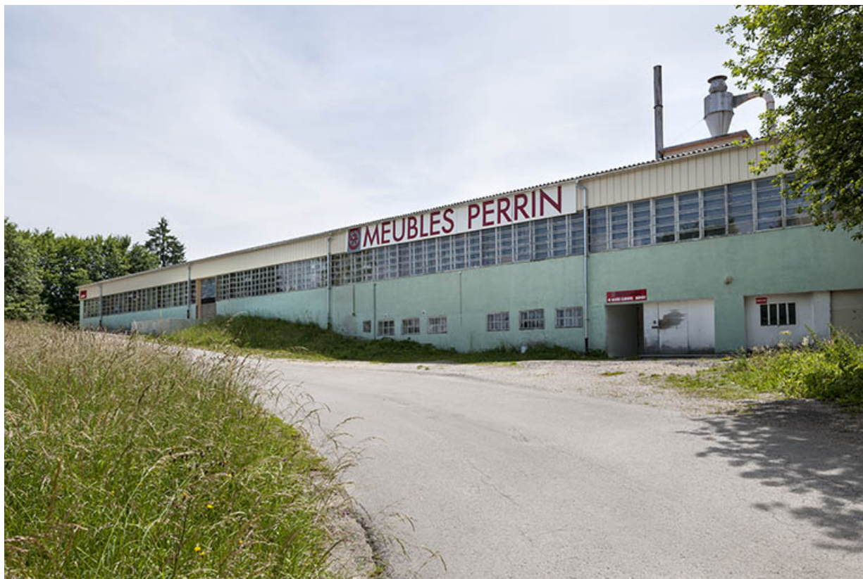
Atelier de menuiserie nord. Vue de trois quarts.

25, Orchamps-Vennes, 4 rue du Château d'eau