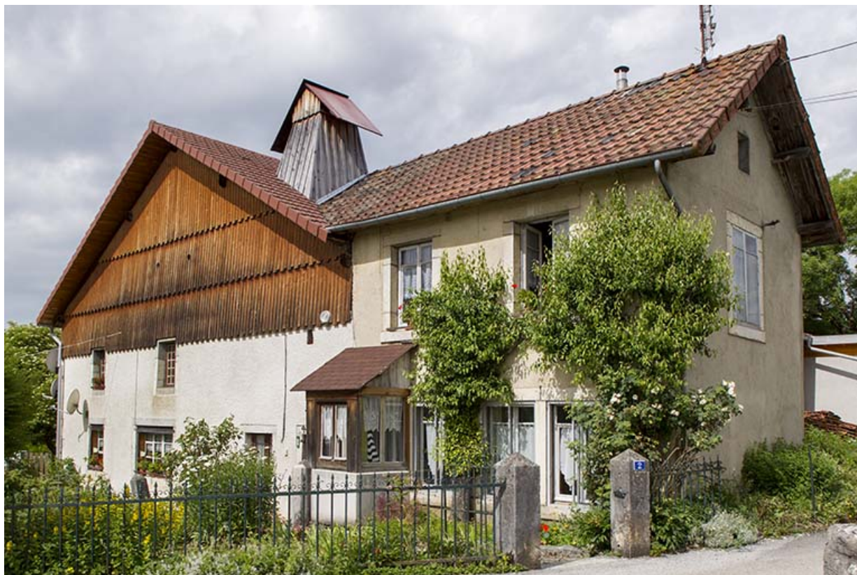
Vue d'ensemble, depuis l'est. Les fenêtres de l'atelier sont visibles au premier plan.