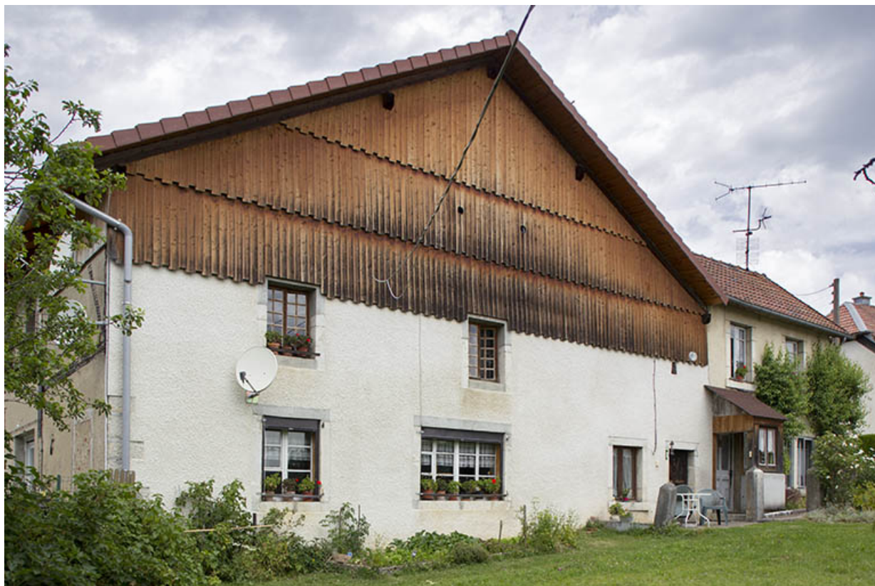
Façade antérieure de la ferme. 25, Les Écorces, 41 Grande Rue