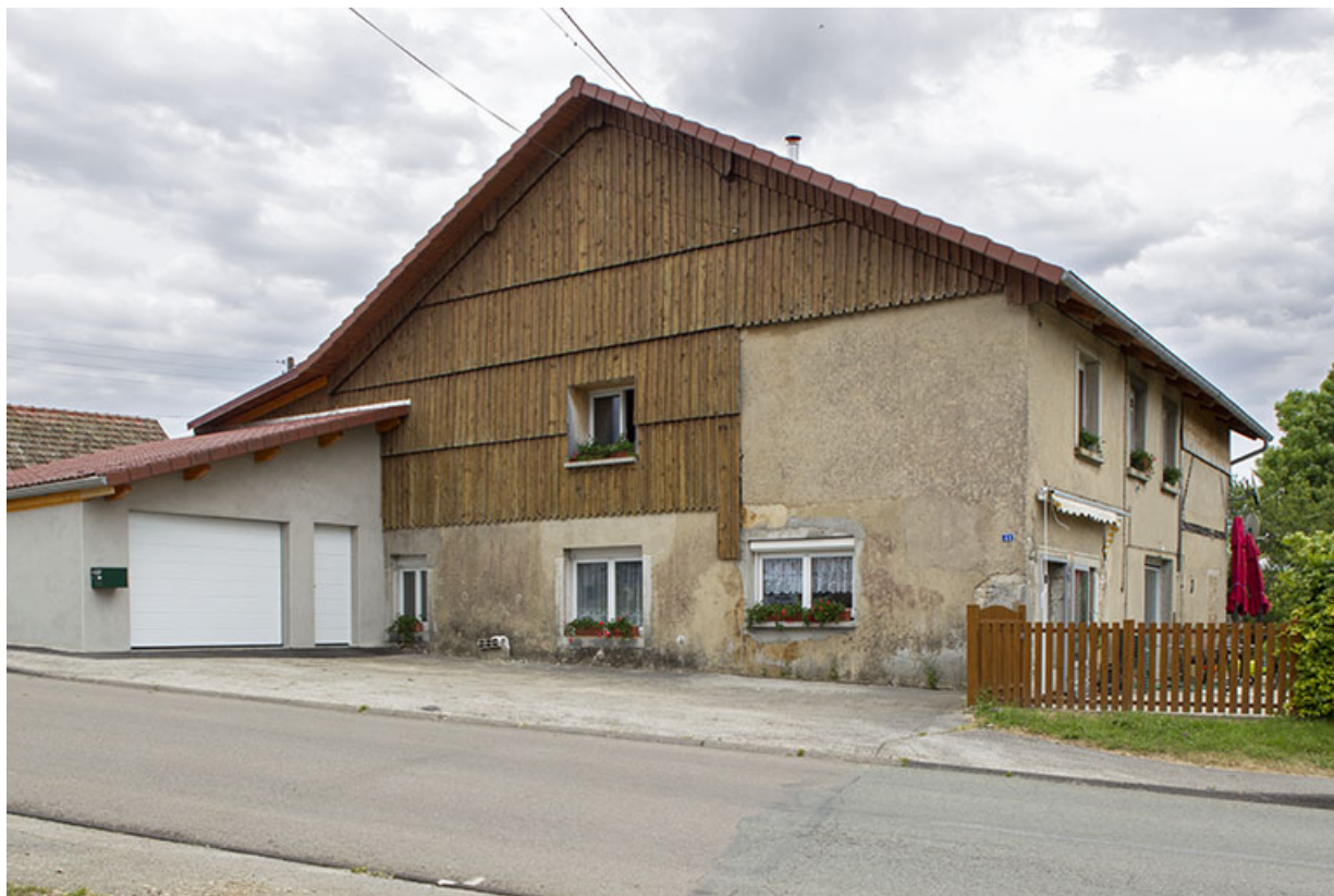
Façades postérieure et latérale gauche de la ferme. 25, Les Écorces, 41 Grande Rue