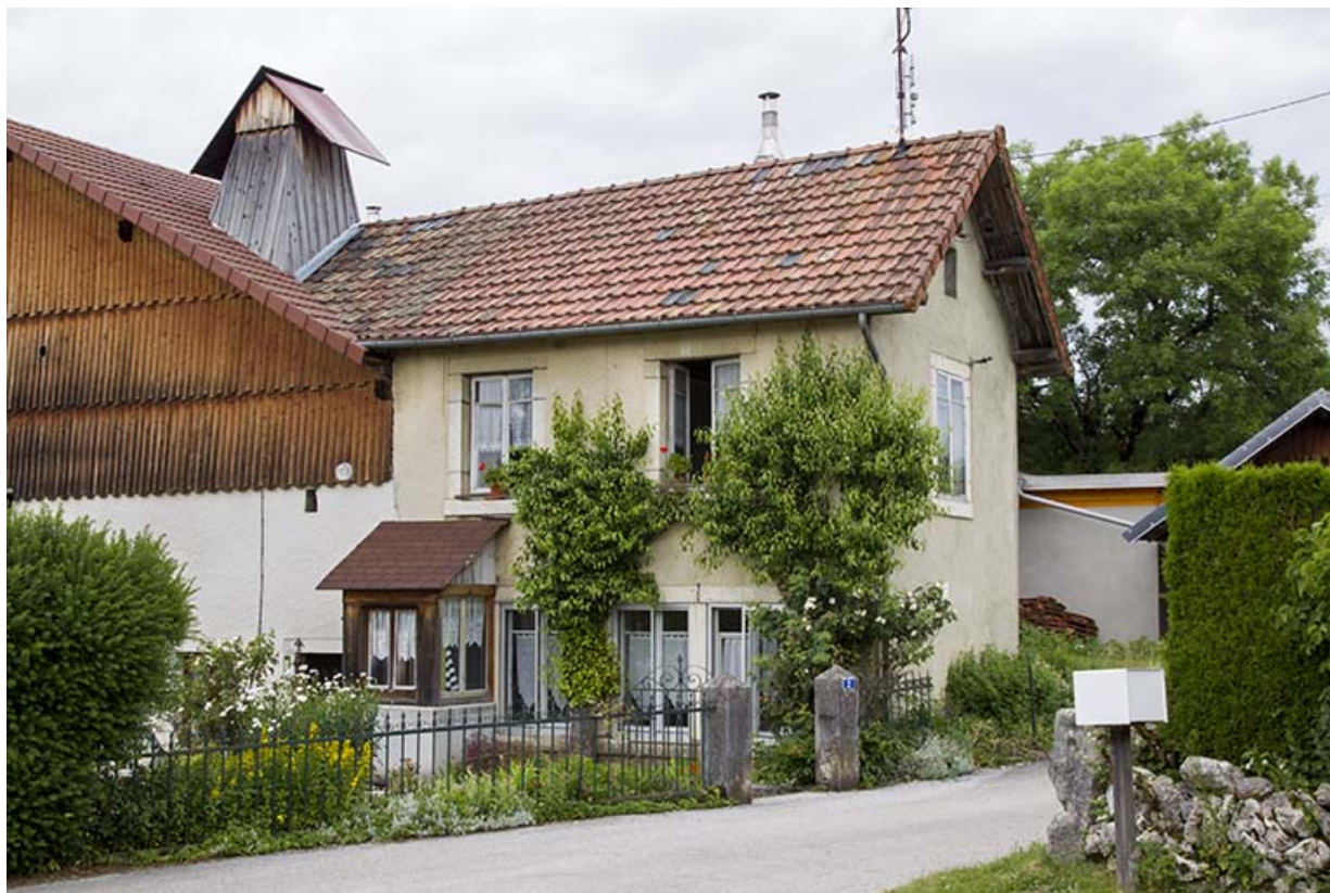
Façade antérieure de l'atelier. 25, Les Écorces, 41 Grande Rue