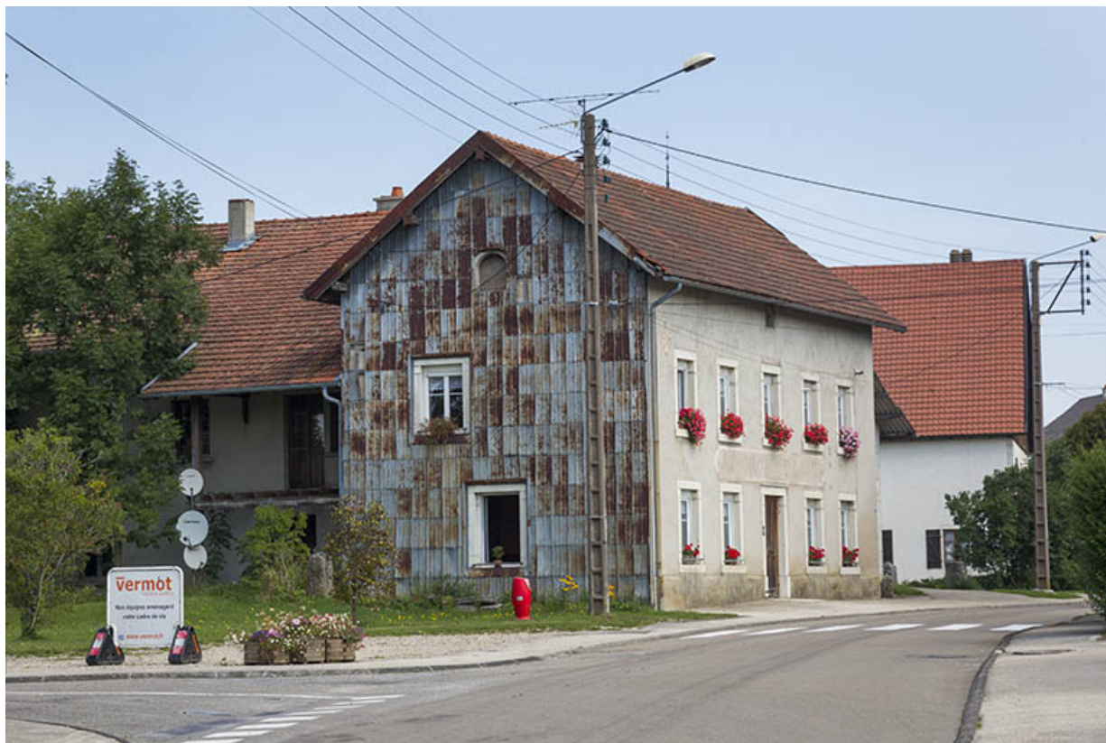
Vue d'ensemble, de trois quarts gauche. 25, Les Écorces, 20 Grande Rue