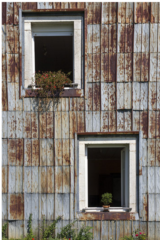
Façade latérale gauche : fenêtres et essentage de tôle. 25, Les Écorces, 20 Grande Rue