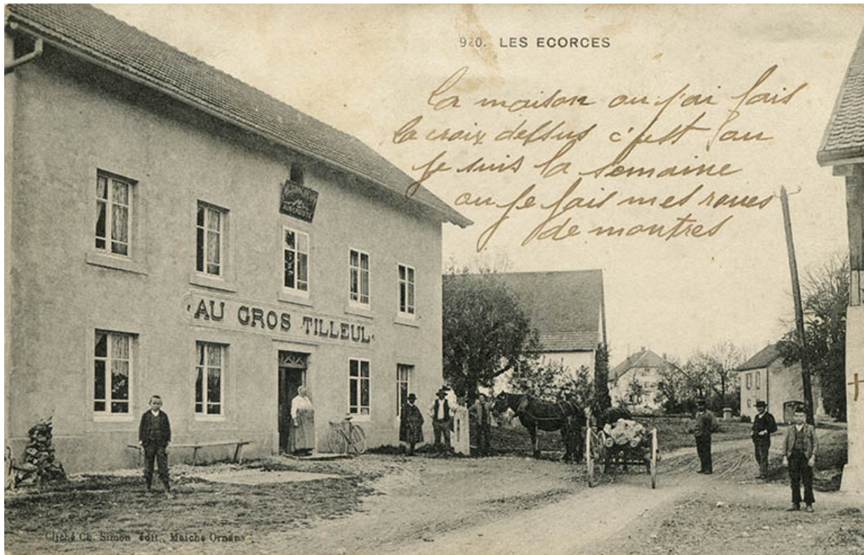
920. Les Ecorces [façade antérieure, de trois quarts gauche], entre 1903 et 1913. 25, Les Écorces, 20 Grande Rue