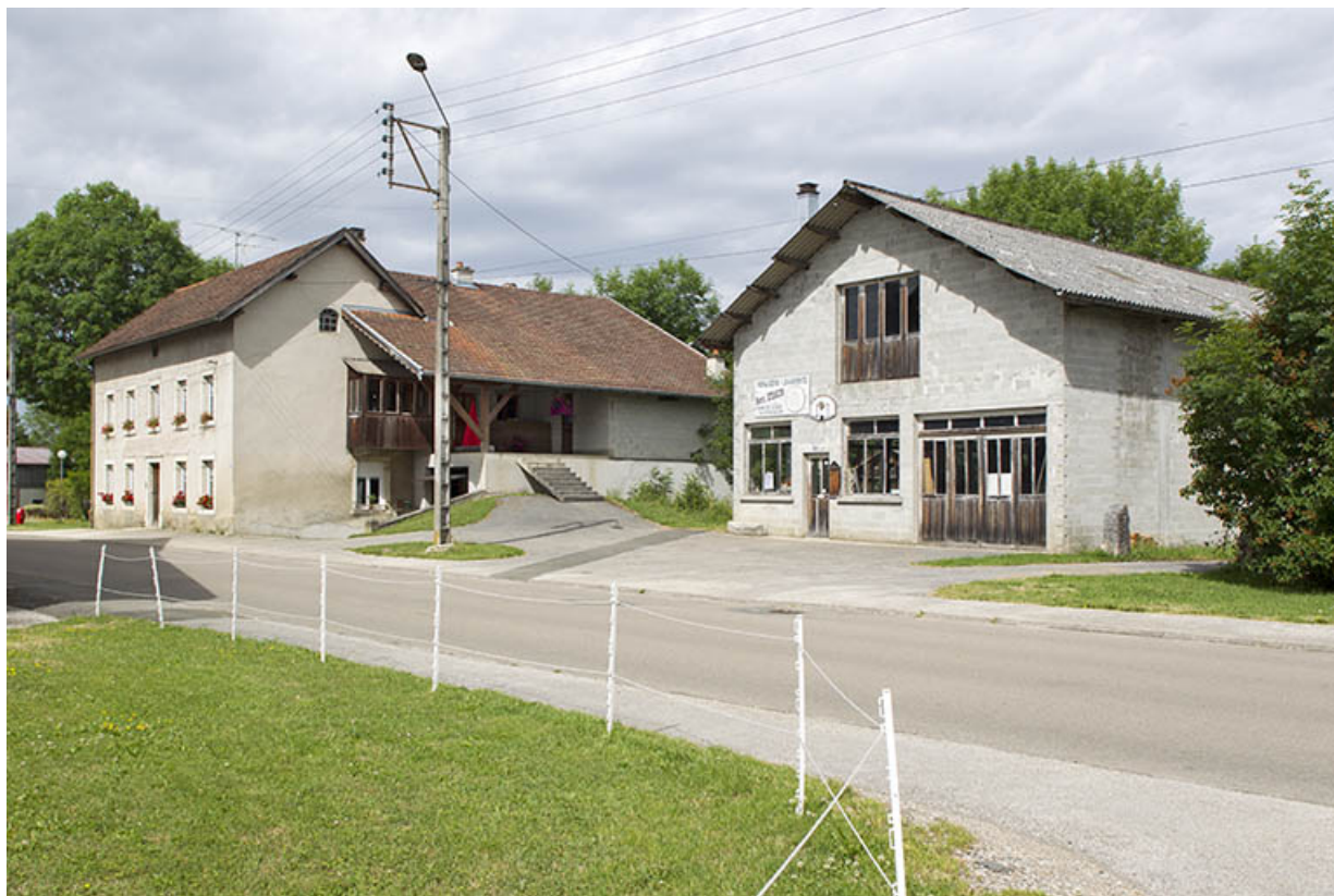
Vue d'ensemble, depuis le nord-est.