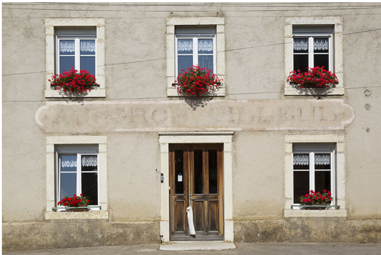
Façade antérieure : enseigne et baies des trois travées centrales.