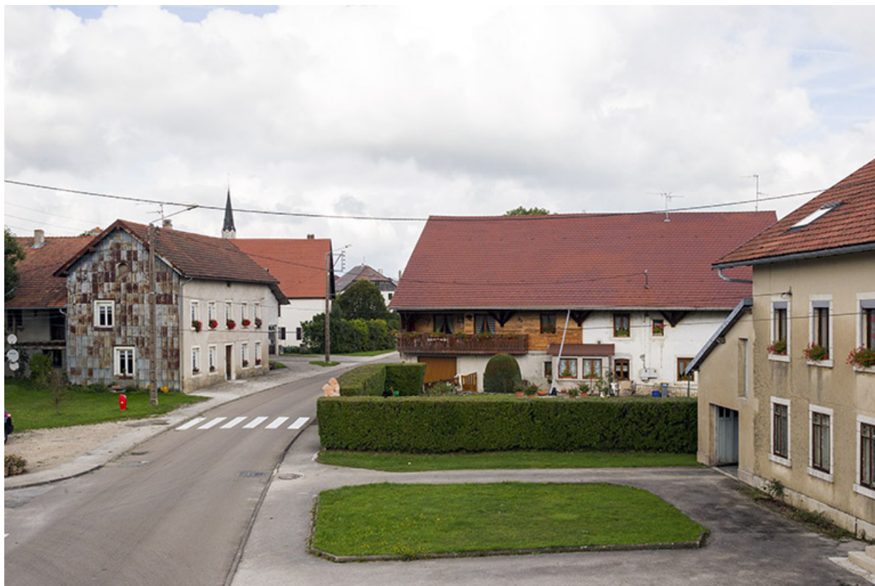
Vue d'ensemble, depuis le sud. Au centre la ferme Guigon-Cuenot et à droite l'atelier d'horlogerie Léon Cuenot et ses Fils. 25, Les Écorces, 20 Grande Rue