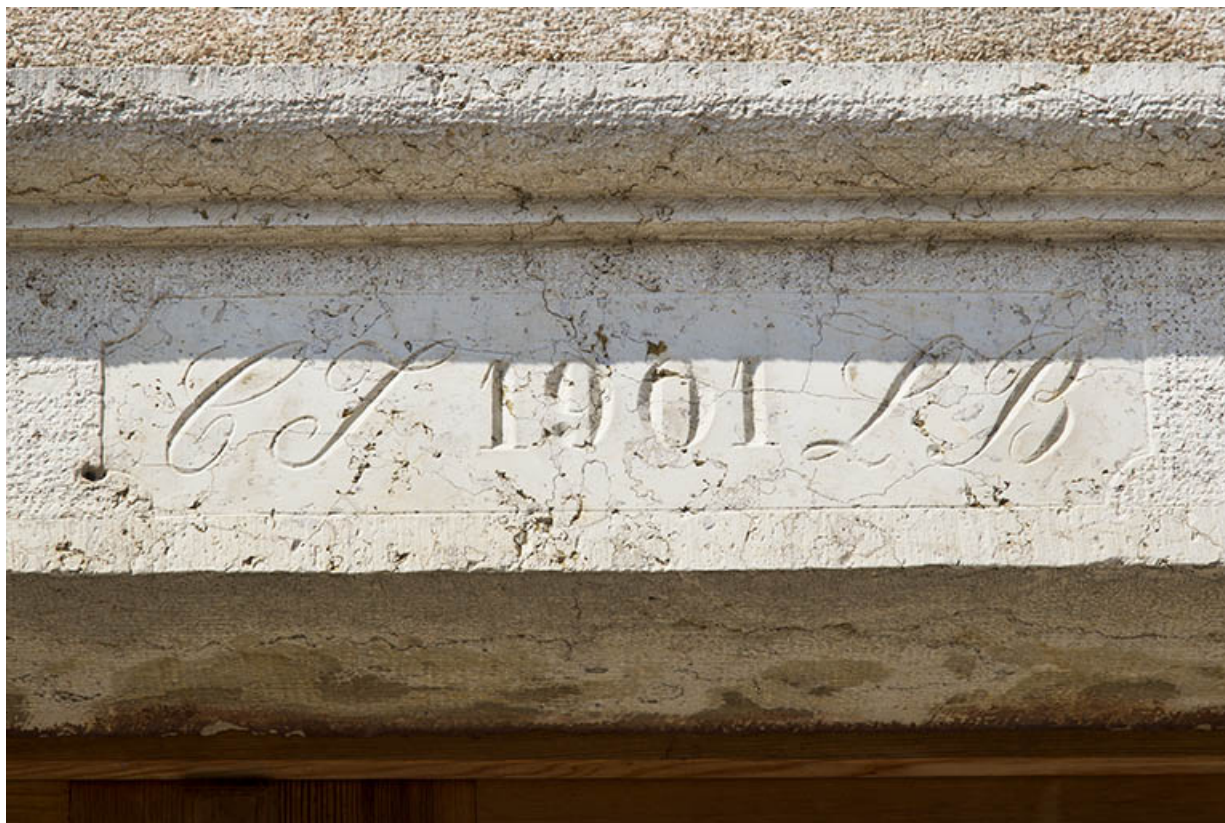
Façade antérieure : linteau daté.