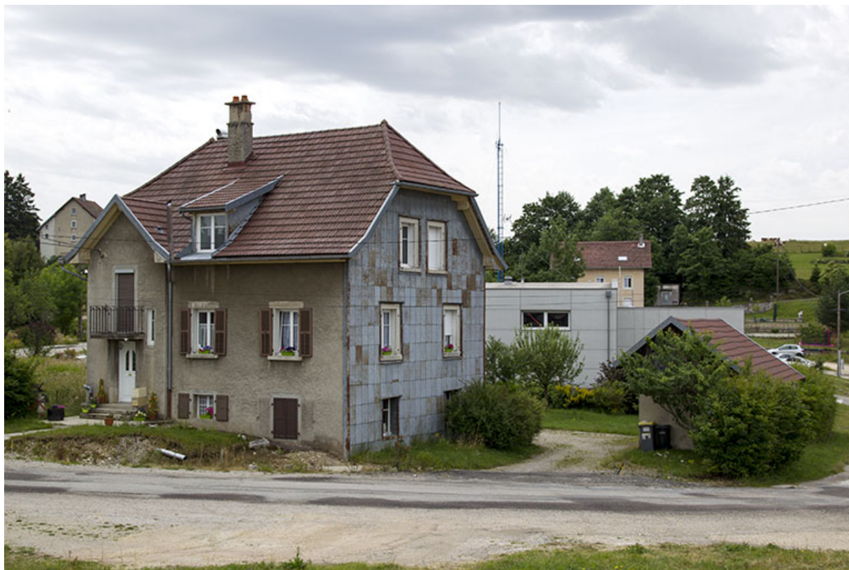
Vue d'ensemble, depuis le nord (façades antérieure et latérale droite). 25, Charquemont, 1 rue du Tacot