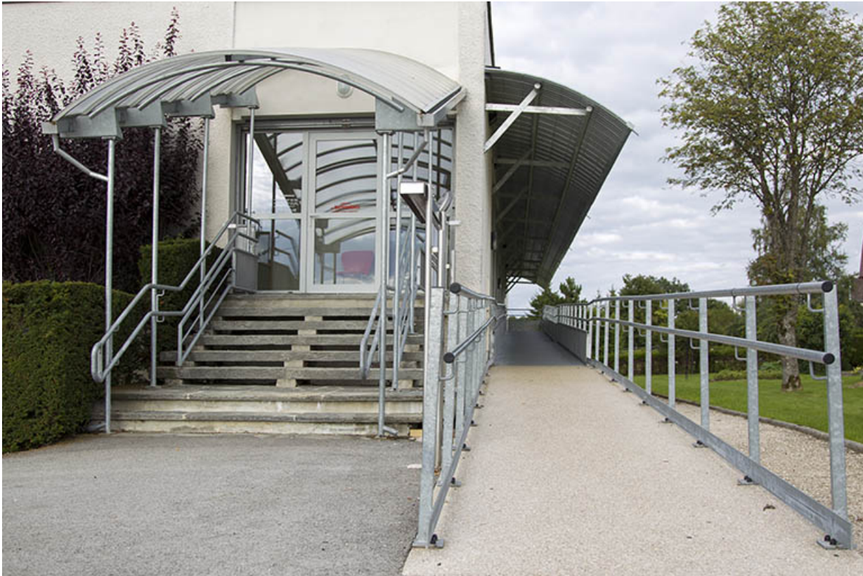
Façade latérale droite : escalier et rampe d'accès.