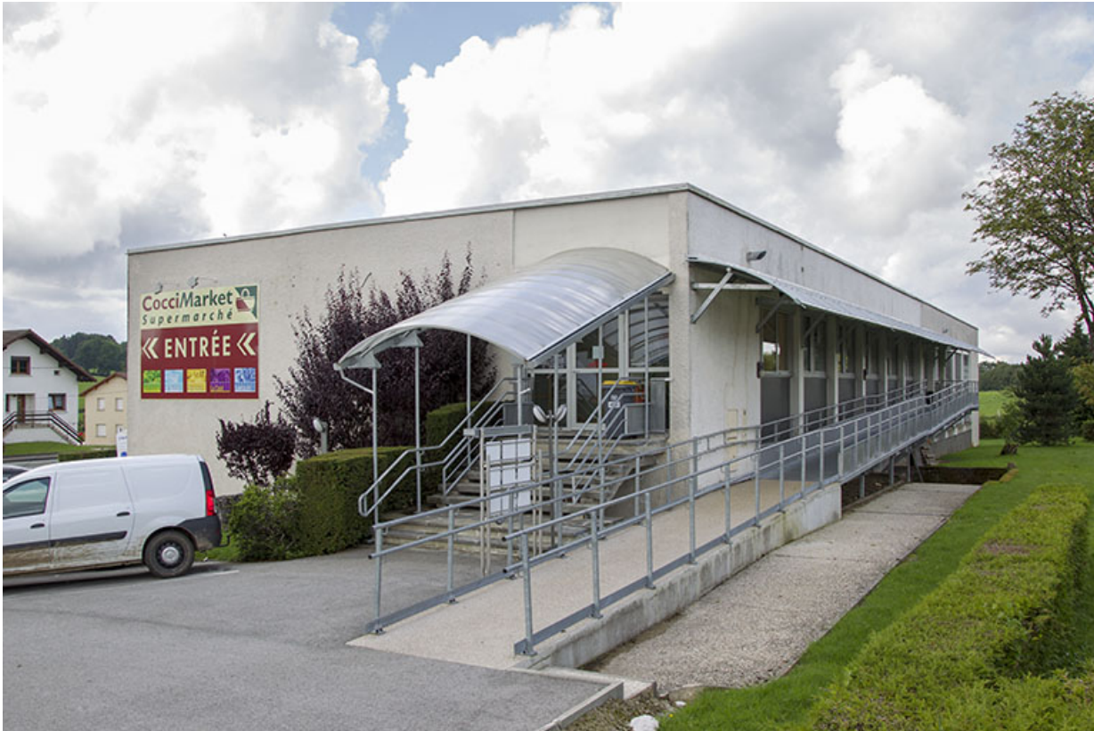
Façades latérale droite et postérieure.