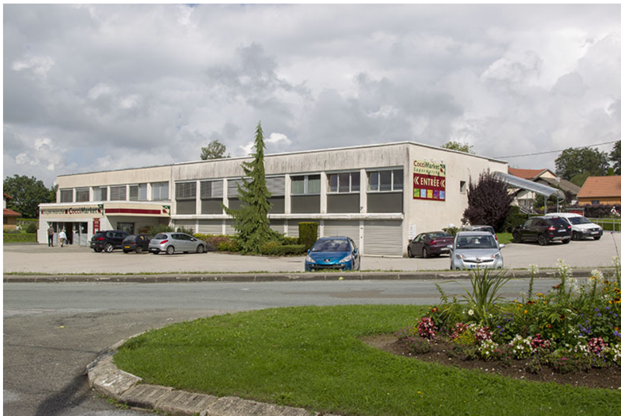
Une usine de 1975 (architecte Pierre Joly) et 1982 (Sanzio Ferraroli) : usine de montres Clyda (2 rue des Armaillis). 25, Charquemont, 2 rue des Armaillis