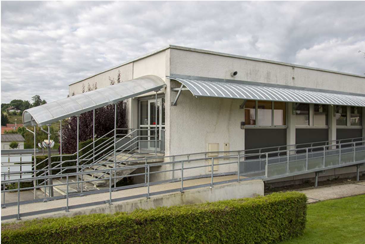
Façade latérale droite : escalier. A gauche la rampe d'accès récente.