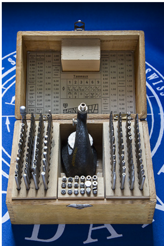
Potence à river Manhora, dans sa boîte.

25, Châtillon-le-Duc, 2 chemin des Barbizets