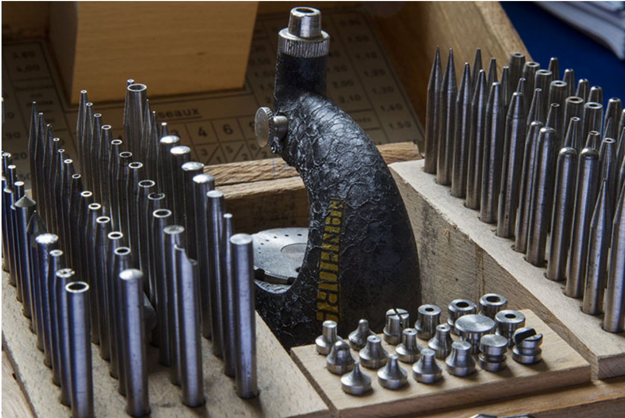
Potence à river Manhora.

25, Châtillon-le-Duc, 2 chemin des Barbizets