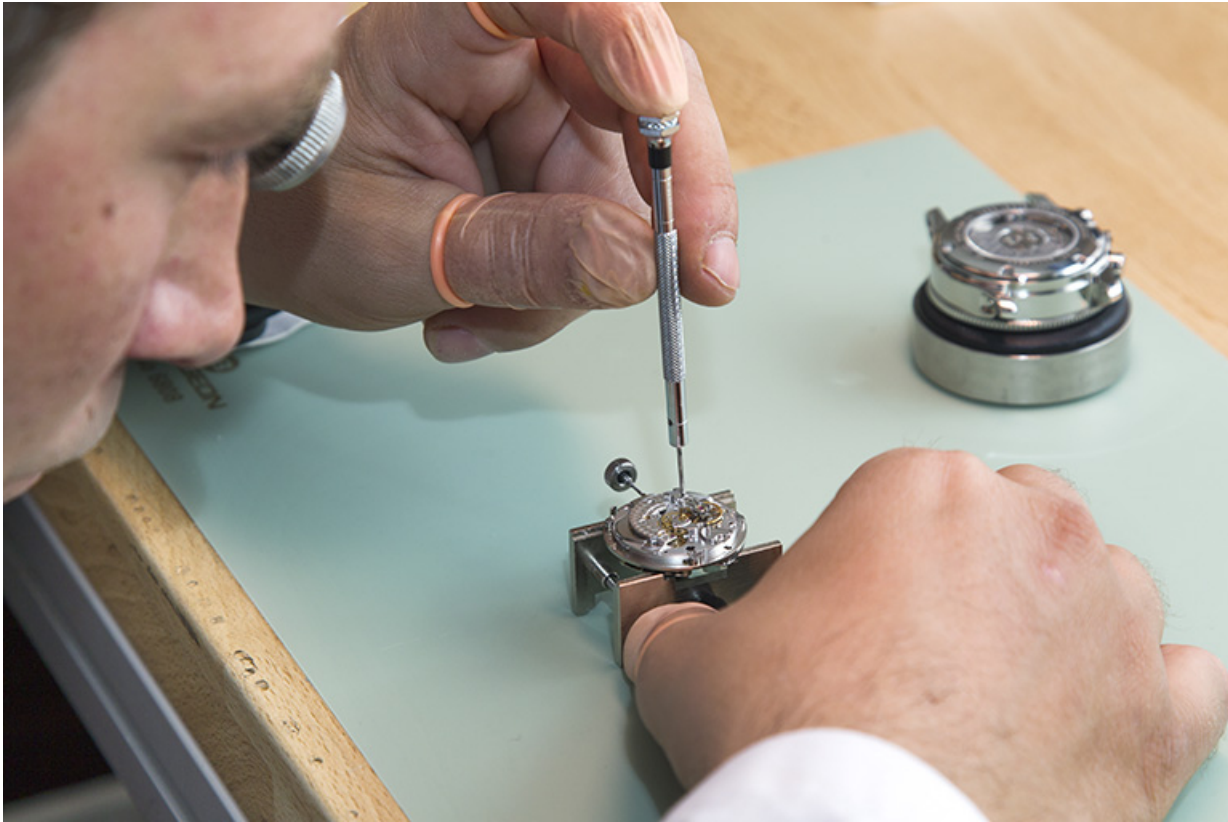
Montage d'une montre par Florian Dodane.

25, Châtillon-le-Duc, 2 chemin des Barbizets