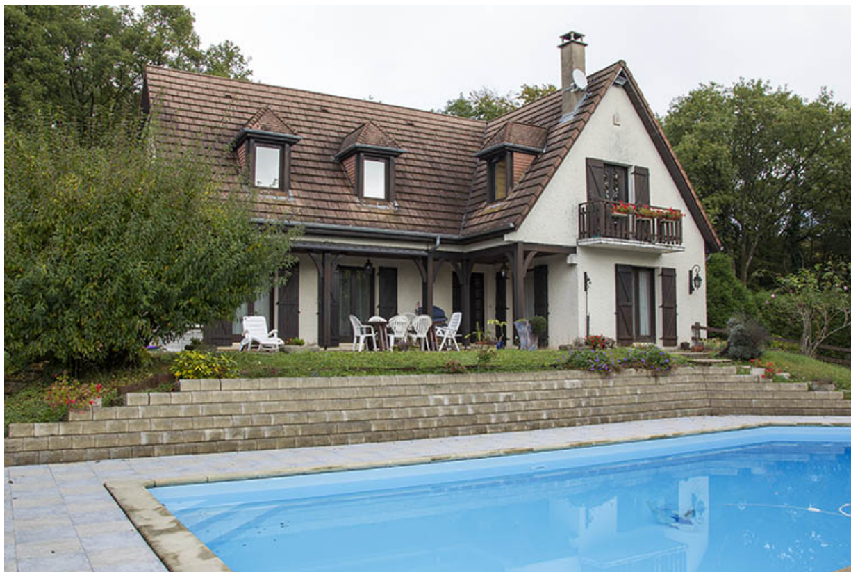
Vue d'ensemble, de trois quarts gauche. 25, Châillon-le-Duc, 2 chemin des Barbizets