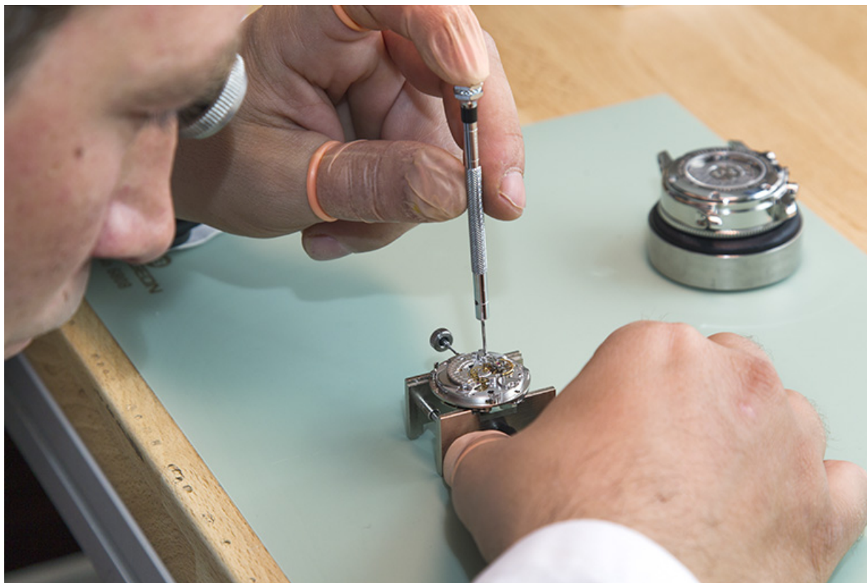
Montage d'une montre par Florian Dodane. 25, Châtillon-le-Duc, 2 chemin des Barbizets