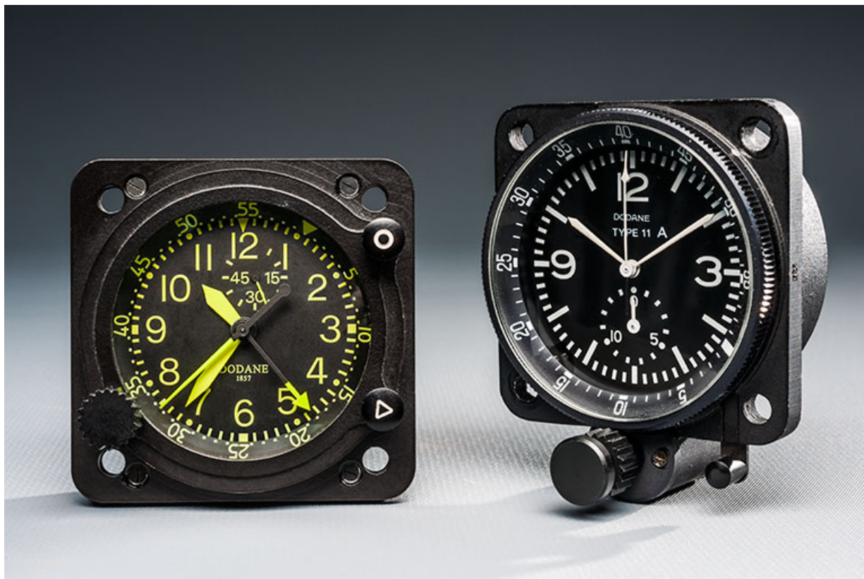
Exemples de production : chronographe de bord type 11 A (à droite) et sa version actuelle type 211 (à gauche). 25, Besançon