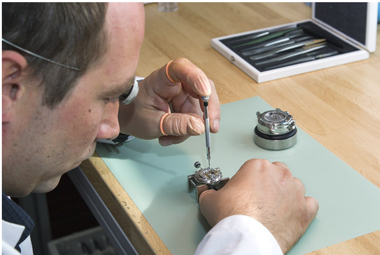
Montage d'une montre par Florian Dodane. 25, Châtillon-le-Duc, 2 chemin des Barbizets