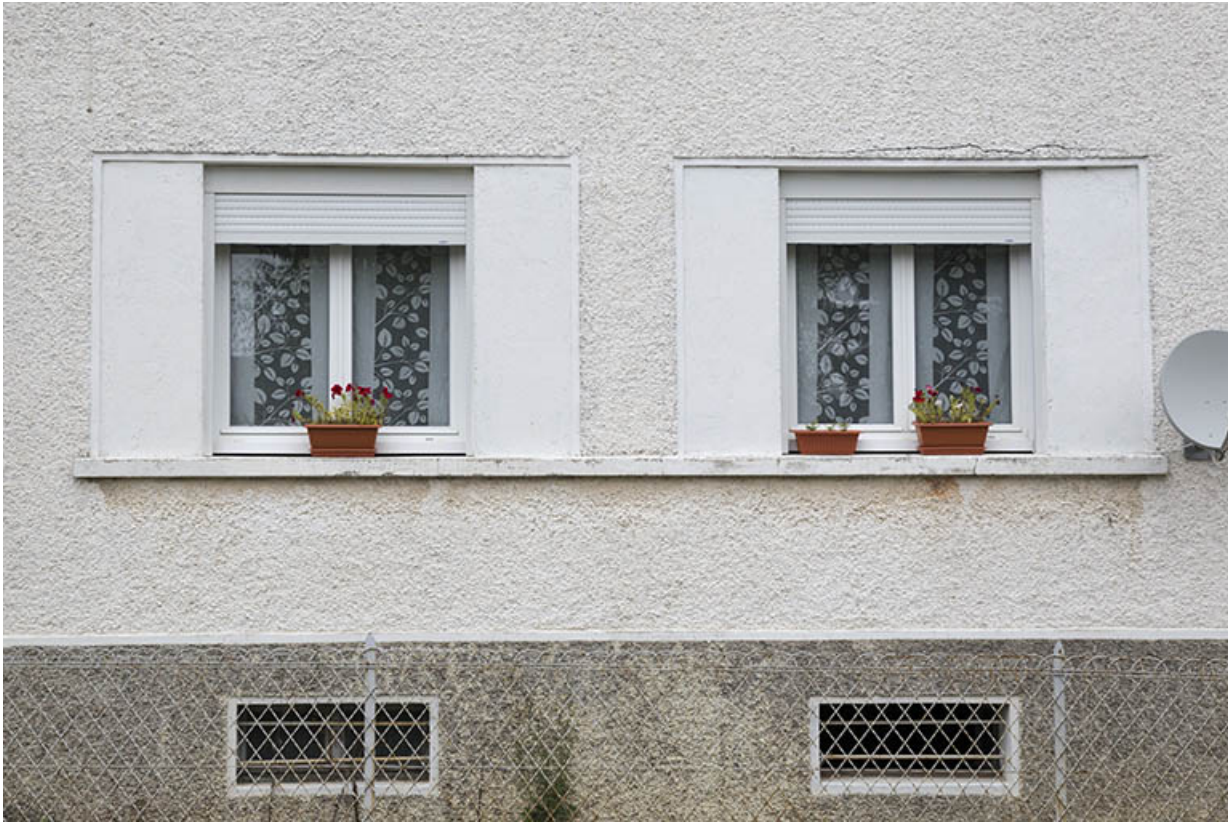
Des fenêtres d'atelier (partiellement murées) : usine d'horlogerie Numa Monnin puis Georges Monnin et Cie (8 rue de l'Eglise). 25, Charquemont, 8 rue de l' Eglise