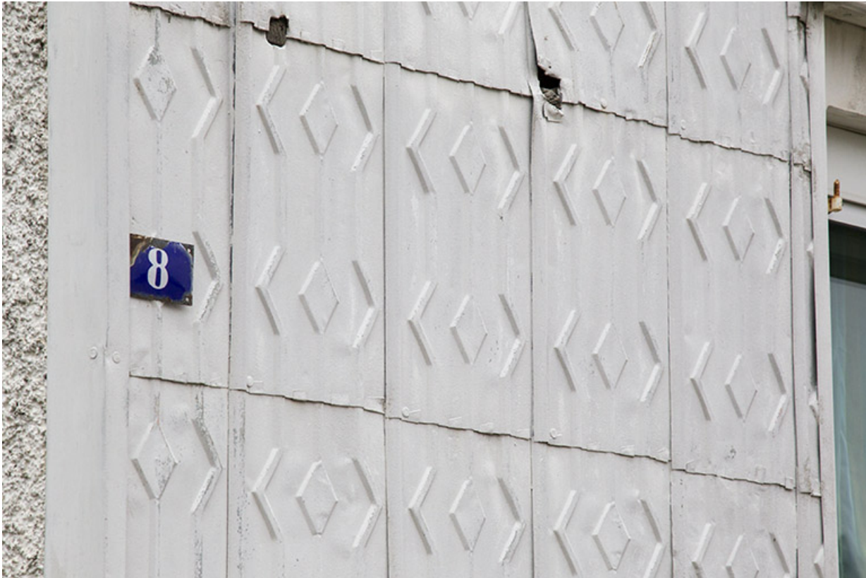
Façade latérale gauche : détail de l'essentage de tôle.