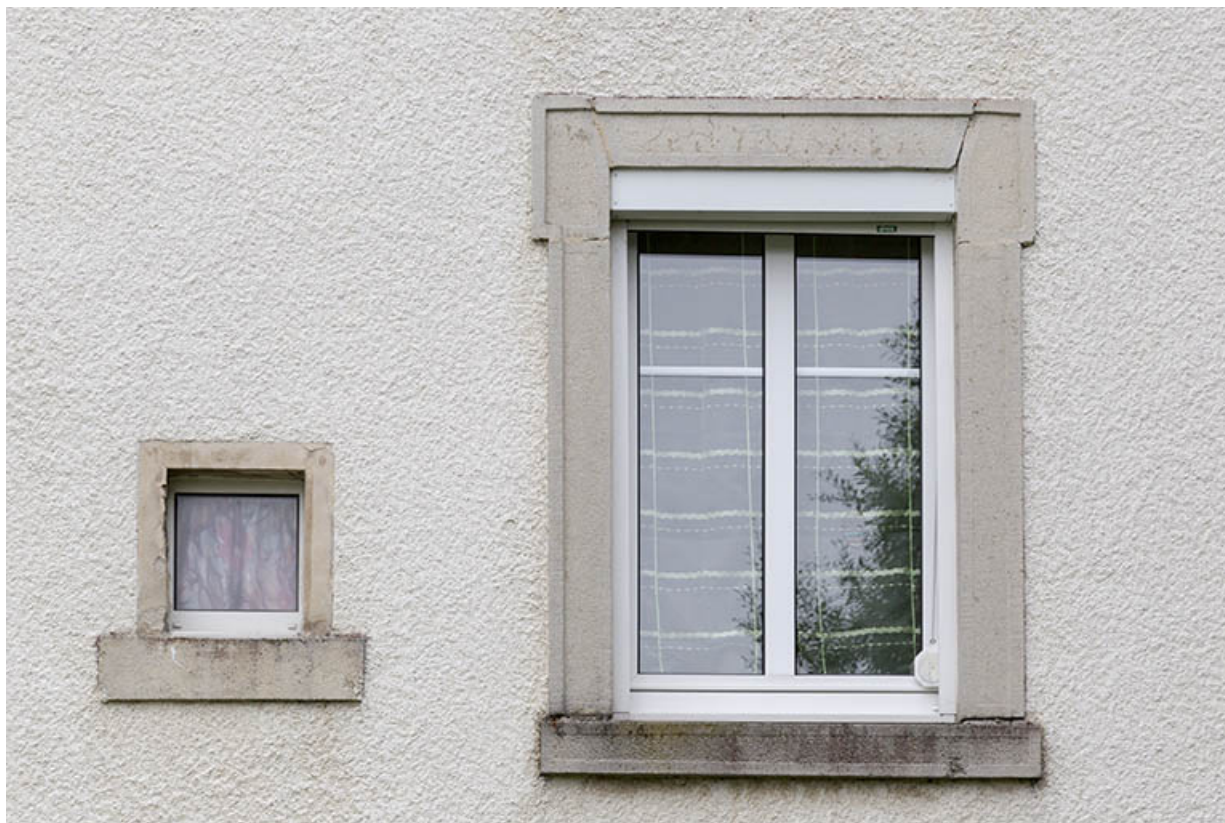
Logement patronal, façade postérieure : fenêtre du rez-de-chaussée surélevé. 25, Charquemont, 16 Rue Neuve