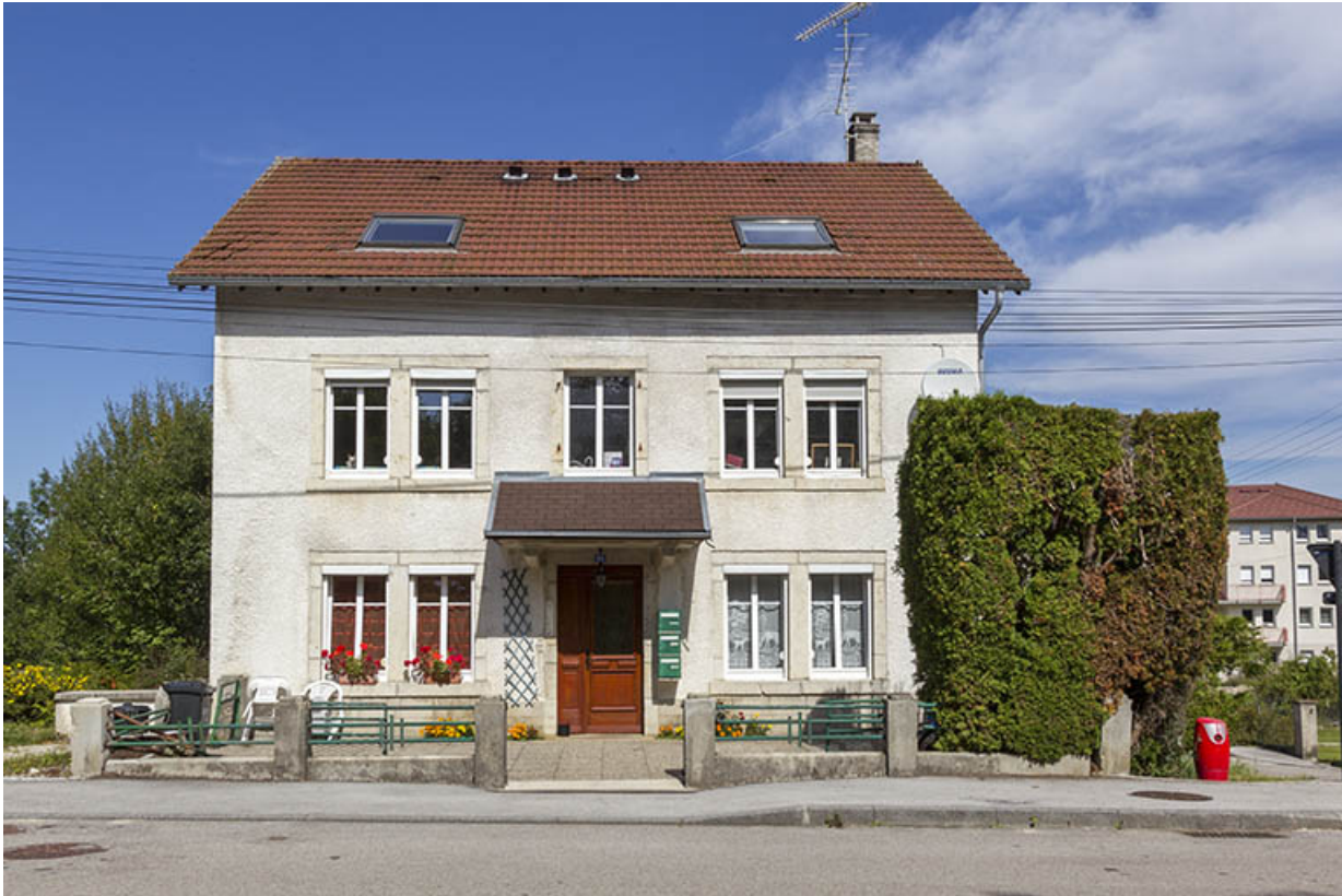
Logement patronal : façade antérieure.