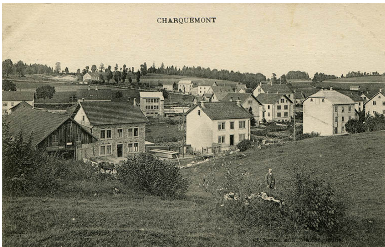
Charquemont [la Rue Neuve et le quartier de la gare, depuis le sud], décennie 1910.