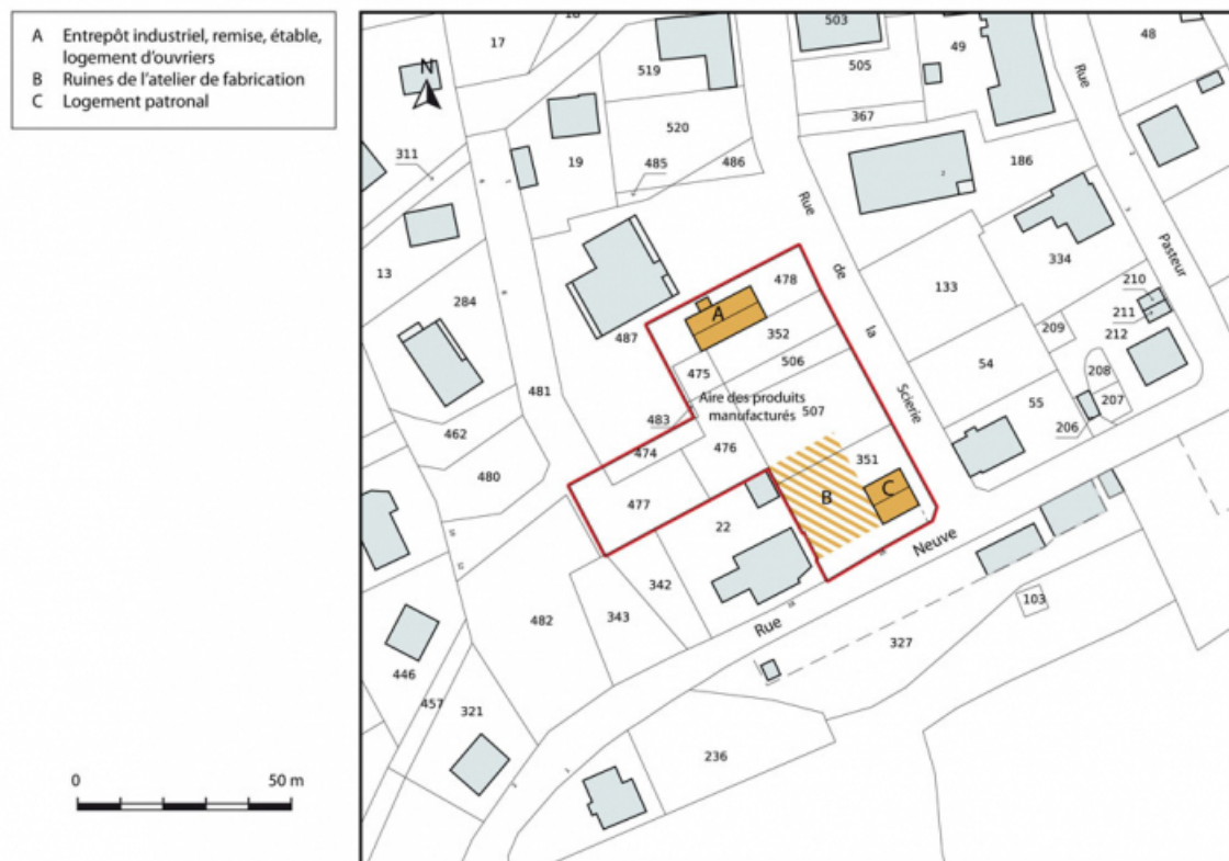
Plan-masse et de situation. Extrait du plan cadastral, 2015, section AI. 25, Charquemont, 16 Rue Neuve