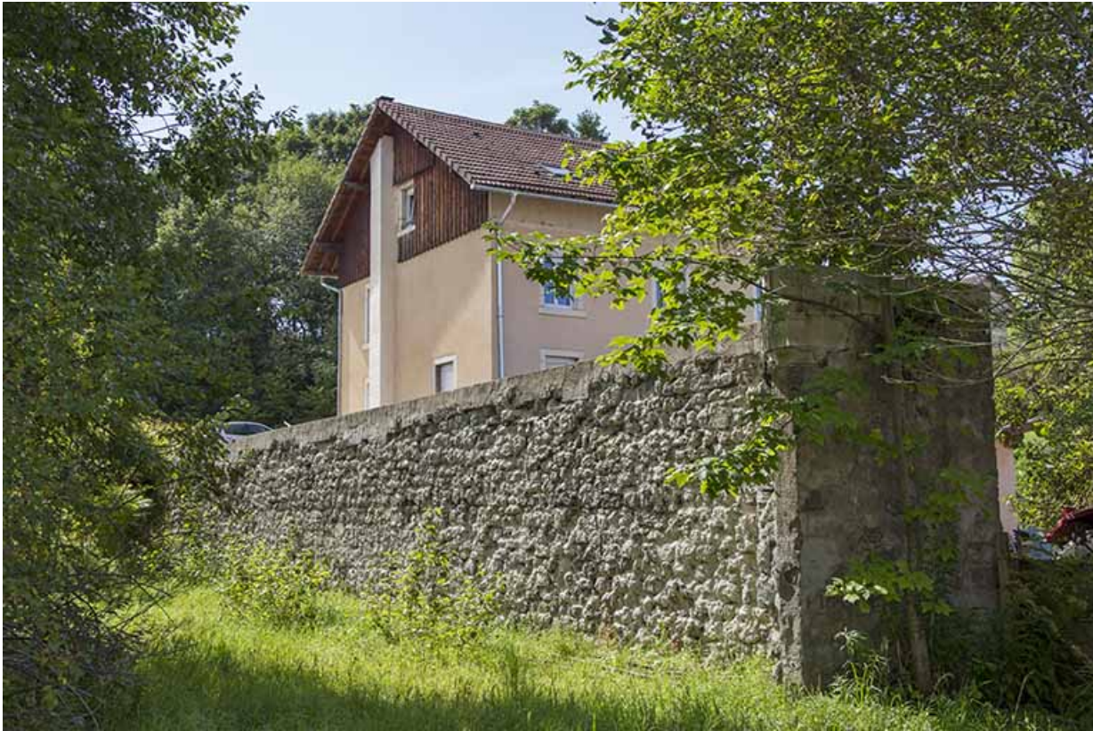
Vestige du mur de la scierie.