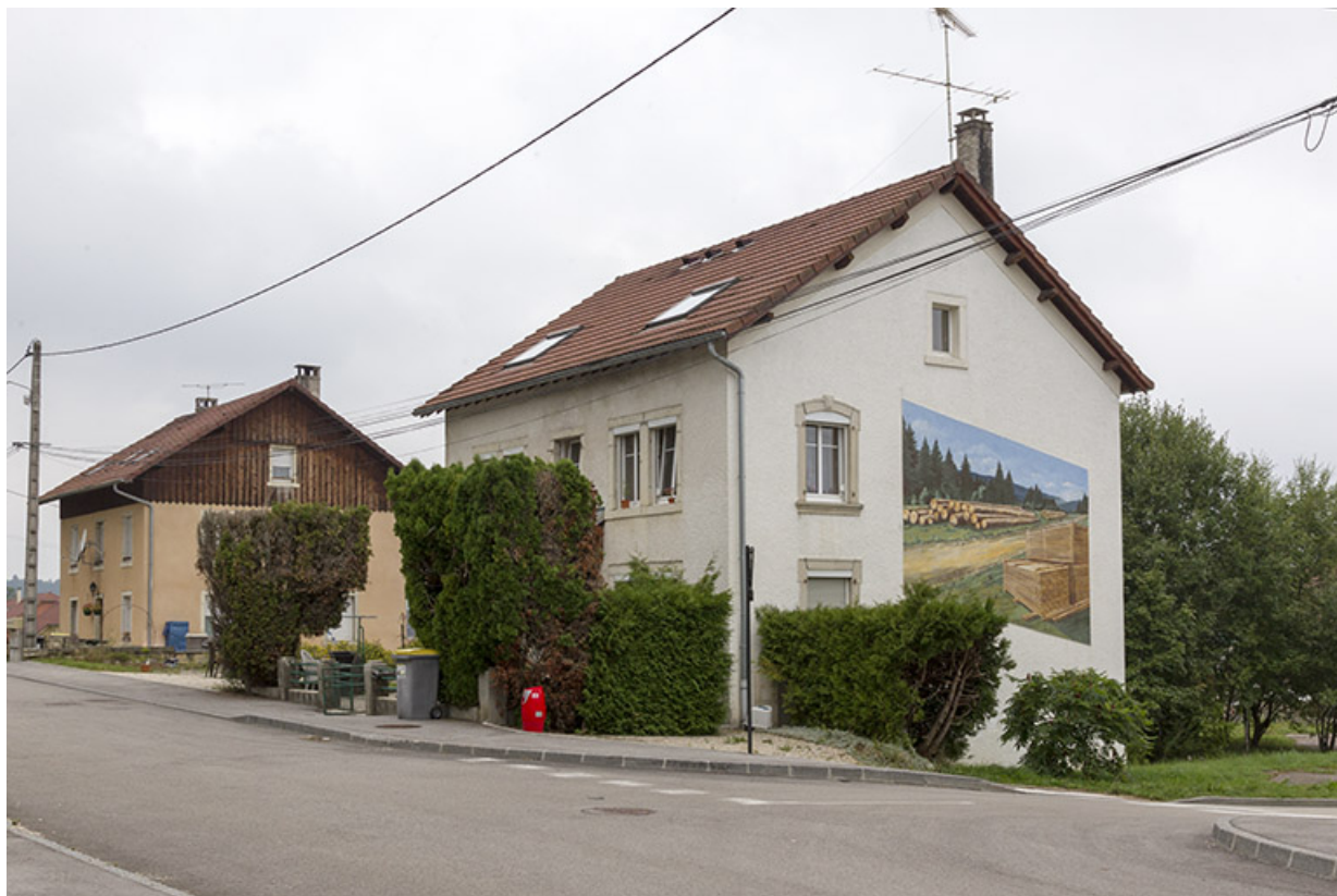
Logement patronal : vue d'ensemble, depuis l'est (façades antérieure et latérale droite).