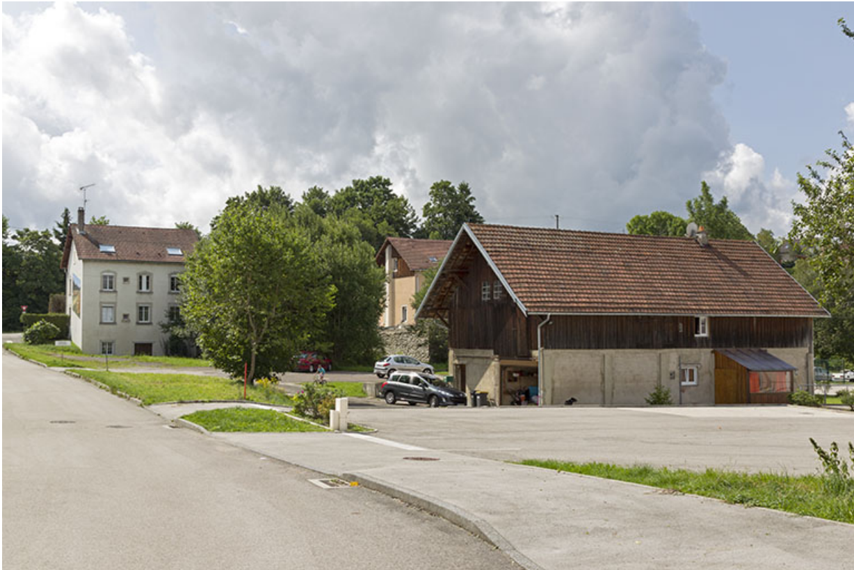
Vue d'ensemble, depuis le nord. Au premier plan à droite, bâtiment ayant servi de logement d'ouvriers, étable et dépôt de sciure ; à l'arrière-plan à gauche, le logement patronal.