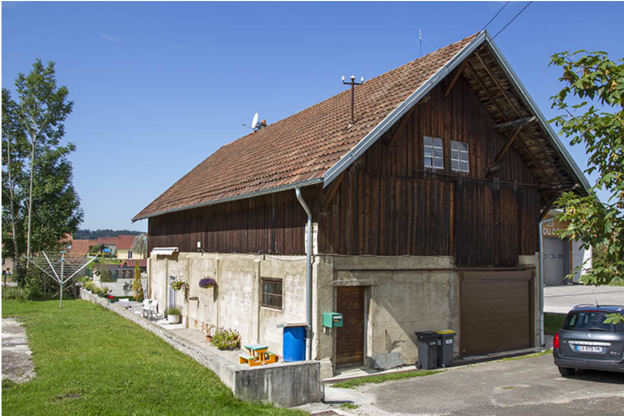
Logement d'ouvriers et dépôt de sciure, depuis la rue à l'est.