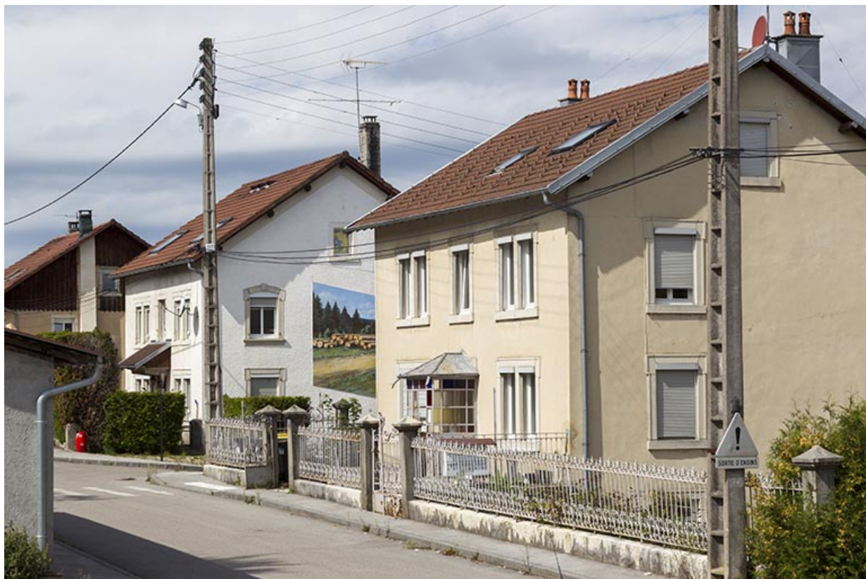
Extrémité ouest de la Rue Neuve (vers la rue de la Scierie). Du premier plan à l'arrière-plan : atelier d'horlogerie Domon Frères (n° 14), logement de la scierie Taillard (n° 16) et atelier de traitement thermique des métaux, de polissage et de galvanoplastie Perrot-Audet (n° 18).