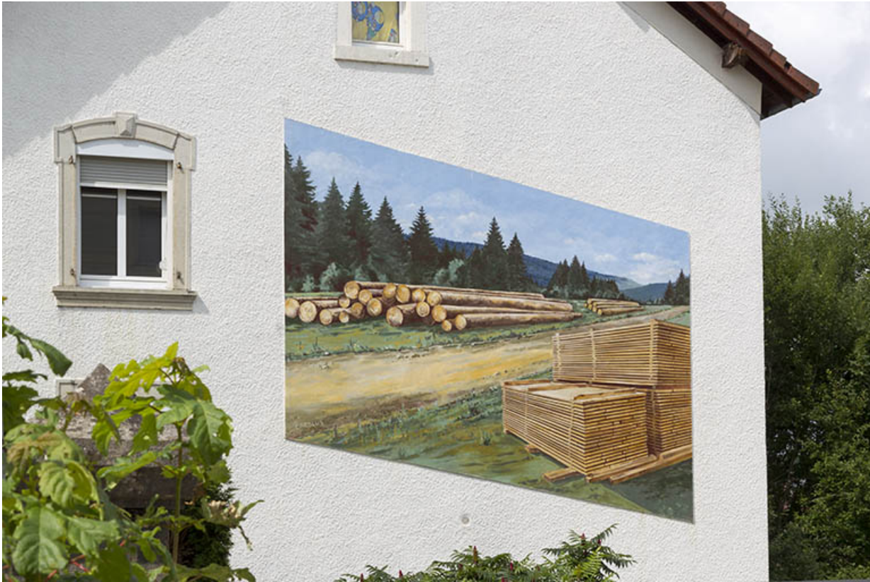
Logement patronal, façade latérale droite : peinture murale.