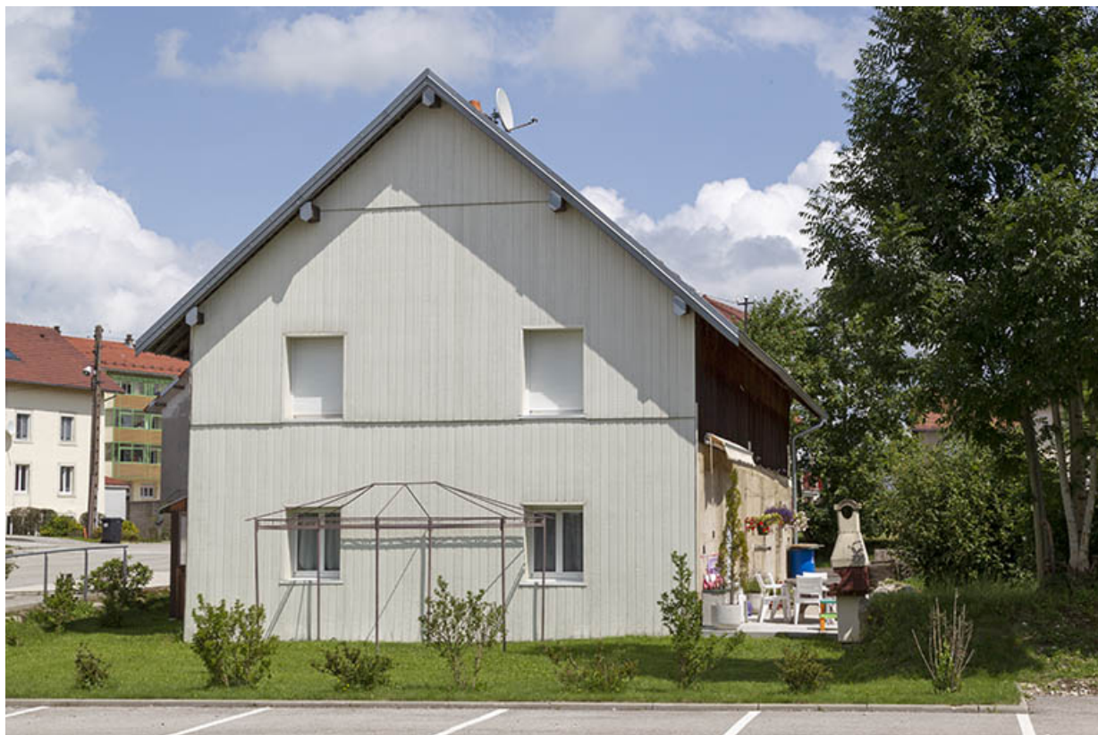
Logement d'ouvriers et dépôt de sciure : façade ouest.