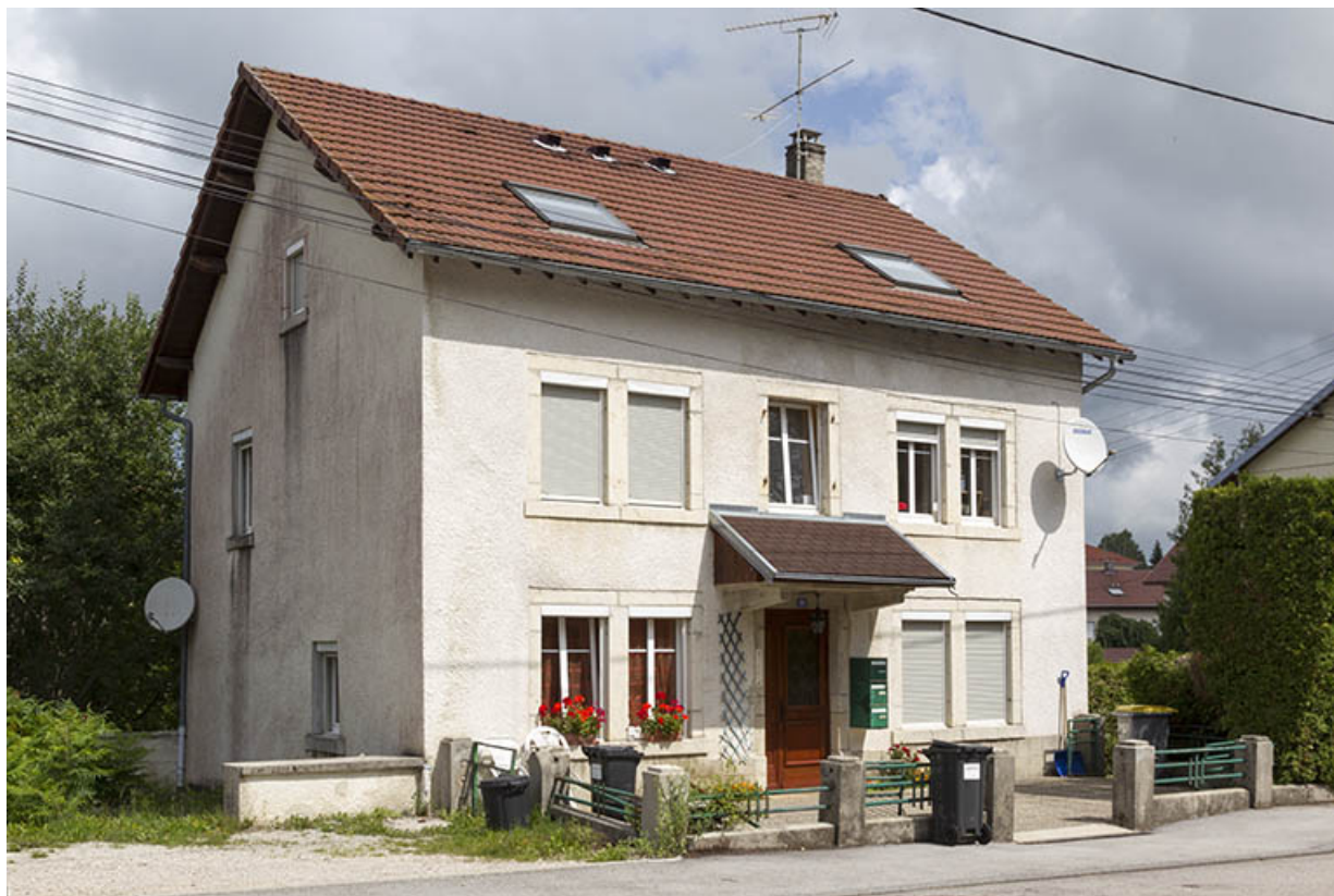
Logement patronal : façades antérieure et latérale gauche.