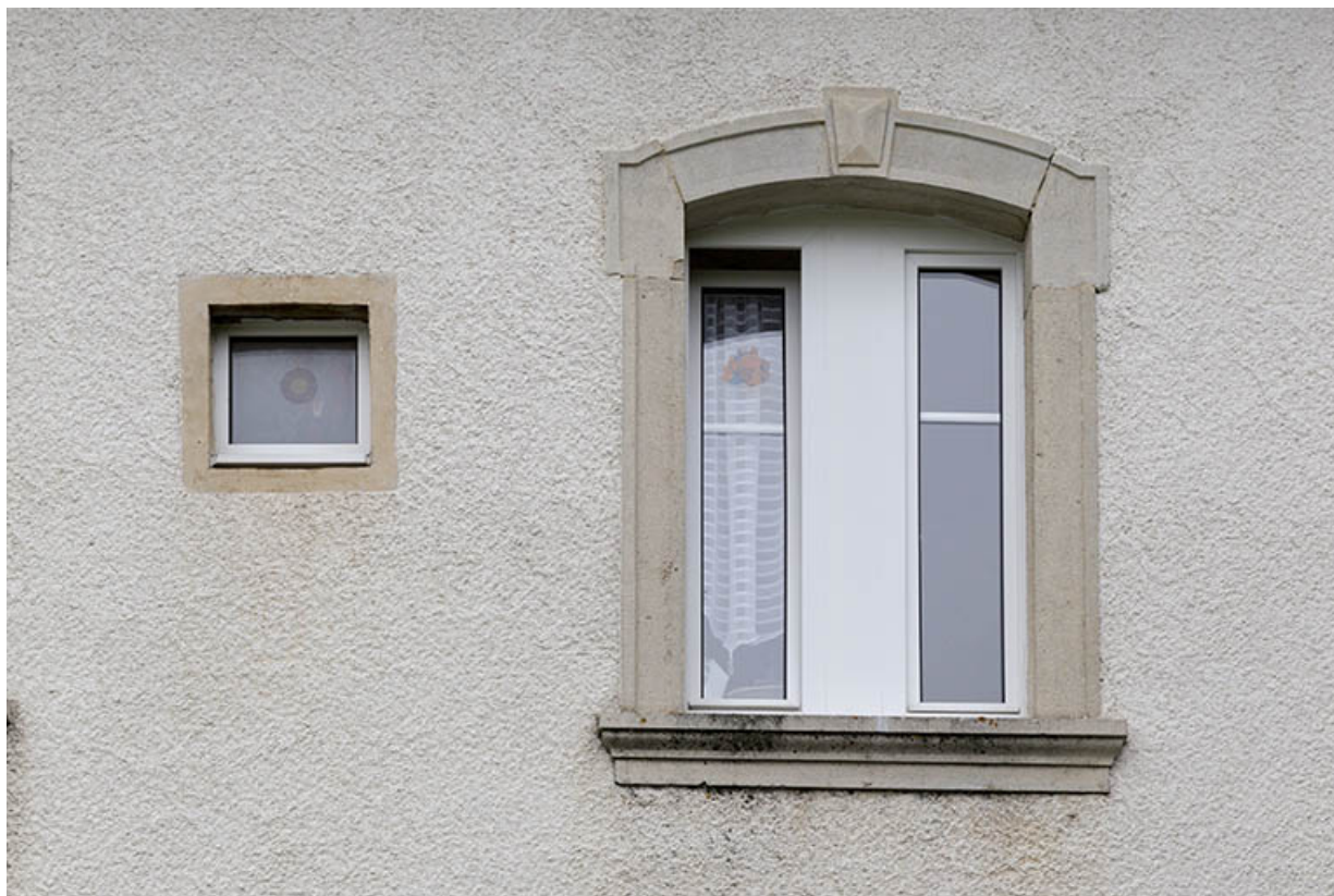
Logement patronal, façade postérieure : fenêtre du 1er étage.