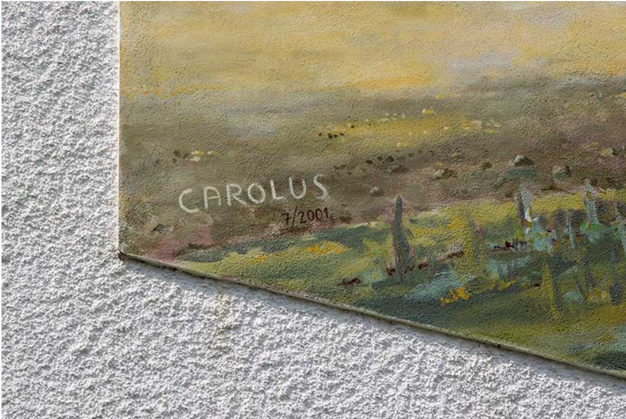
Logement patronal, façade latérale droite : signature et date de la peinture murale.