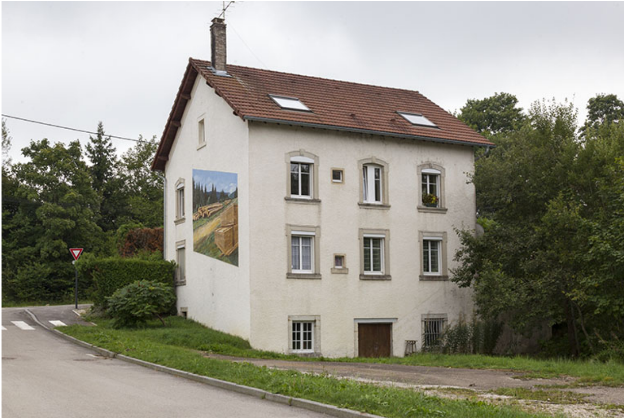
Logement patronal : façades postérieure et latérale droite.