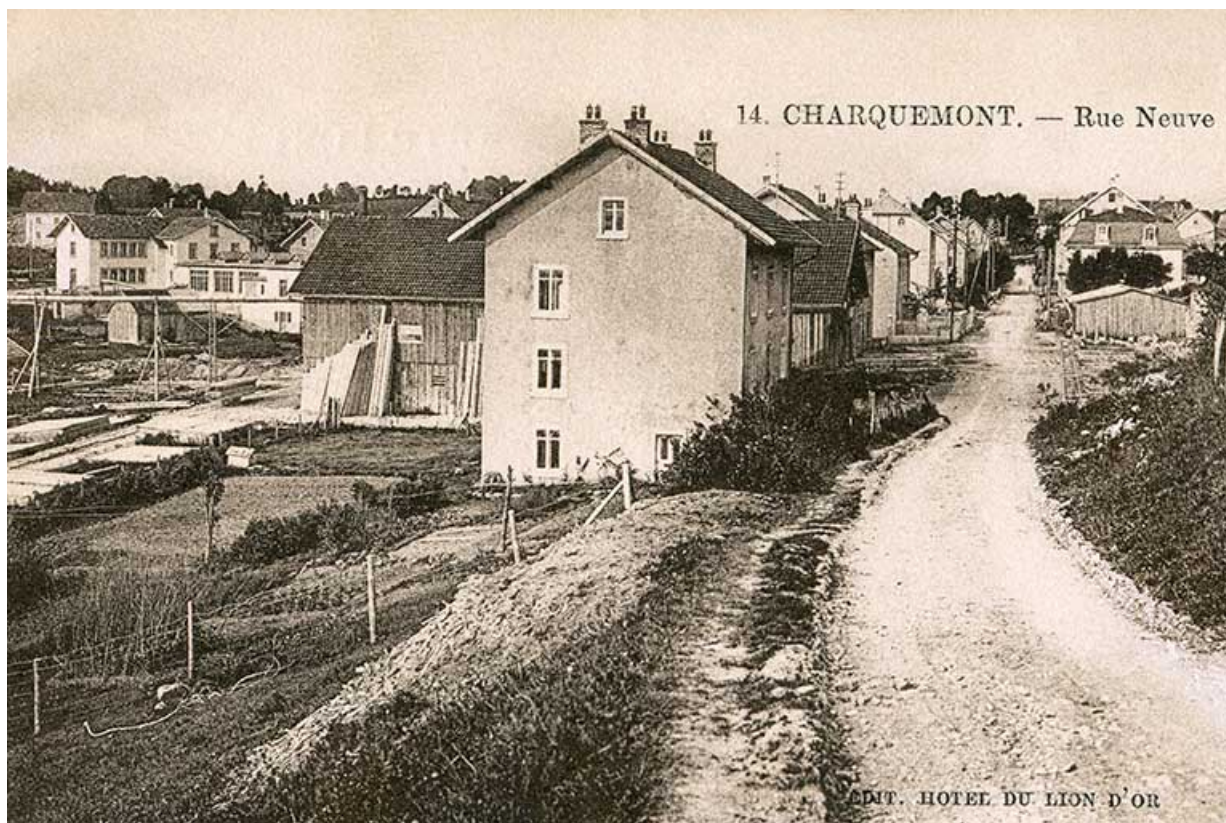
14. Charquemont. - Rue Neuve [vers la scierie], 2e quart 20e siècle 25, Charquemont, 16 Rue Neuve

14. Charquemont. - Rue Neuve [vers la scierie], carte postale, s.n., s.d. [2e quart 20e siècle], éd. Hôtel du Lion d'Or à Charquemont