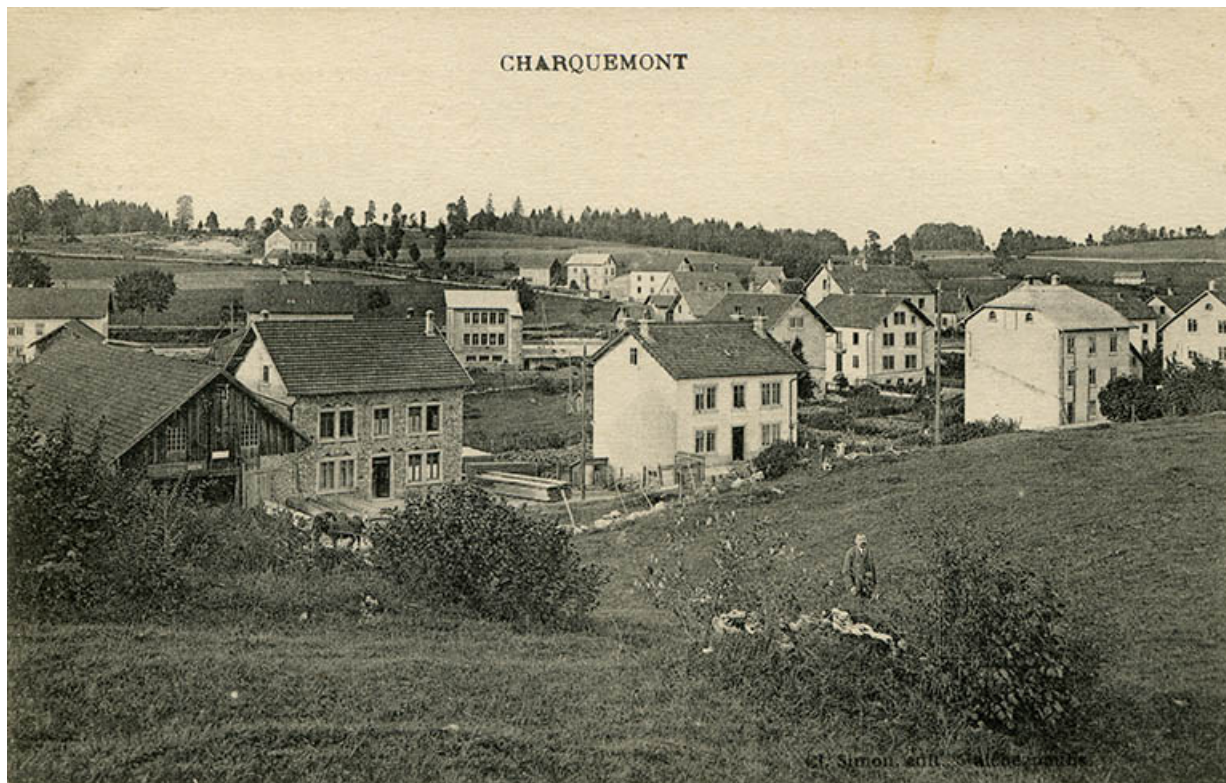
Charquemont [la Rue Neuve et le quartier de la gare, depuis le sud], décennie 1910. 25, Charquemont, 13 rue de la Gare