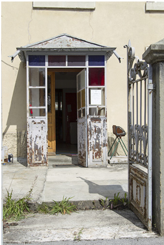
Façade antérieure : entrée.