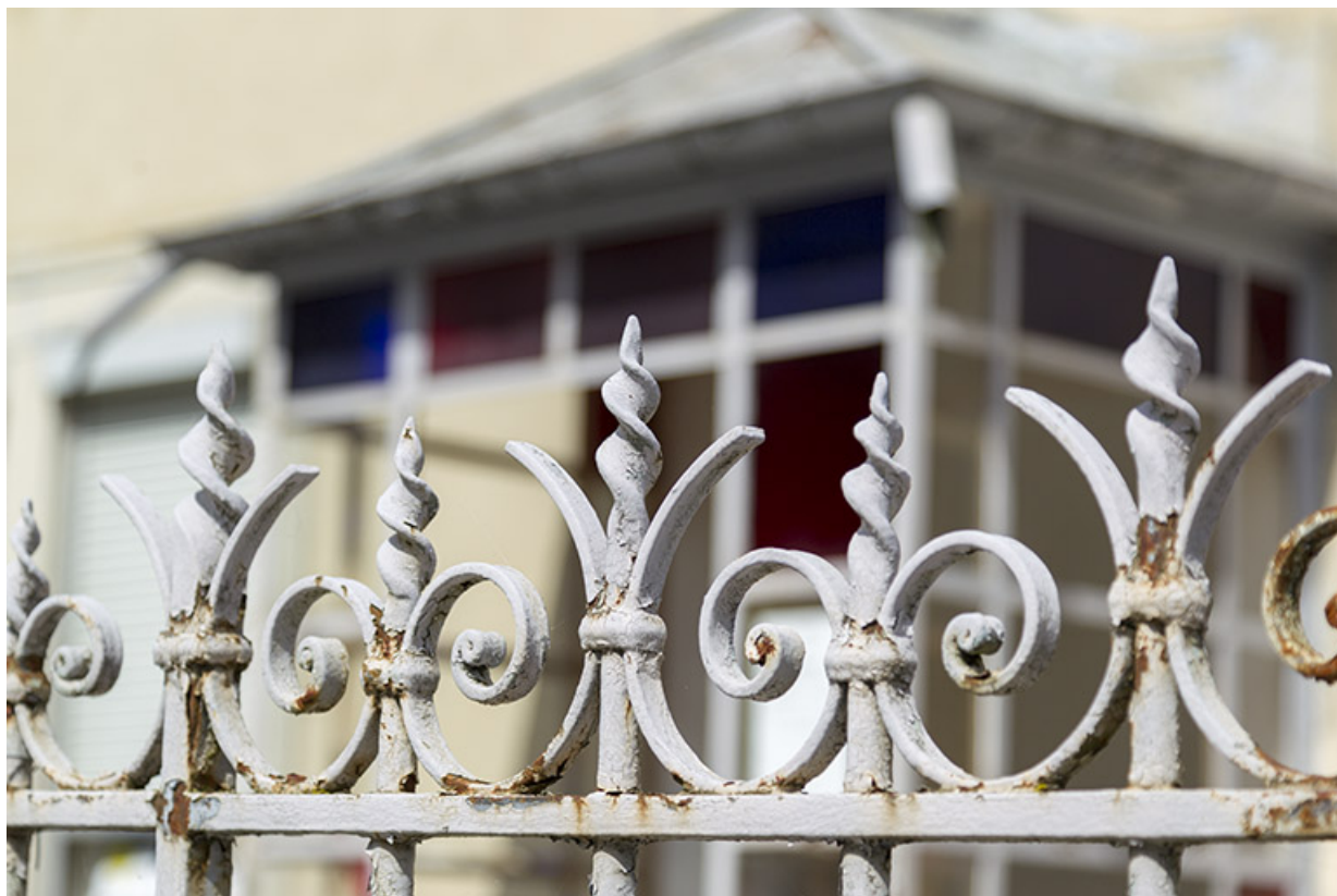
Détail de la ferronnerie de la grille de clôture.