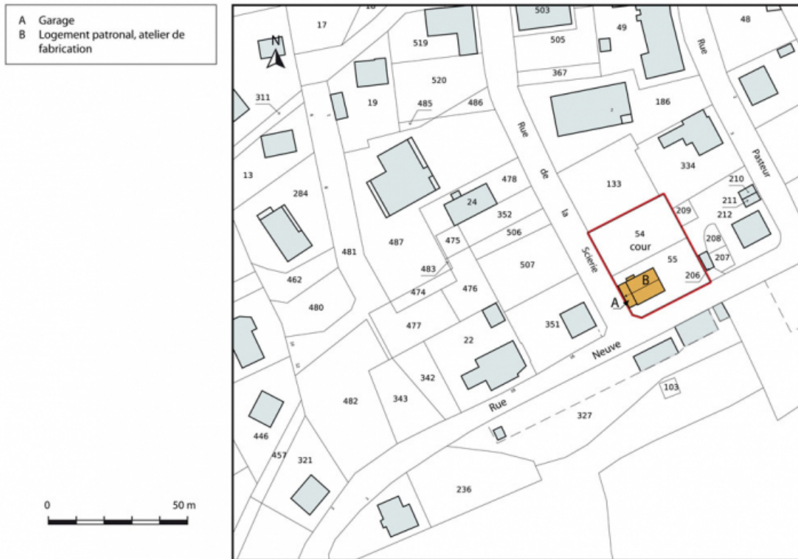
Plan-masse et de situation. Extrait du plan cadastral, 2015, section AI. 25, Charquemont, 14 Rue Neuve