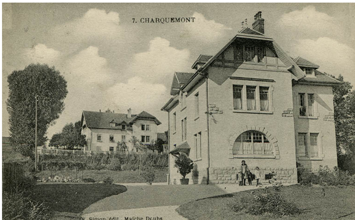
7. Charquemont [la maison de Gaston Maillot avec en arrière-plan celle de Paul Bessot], entre 1913 et 1926. 25, Charquemont, 6 rue Cuvier