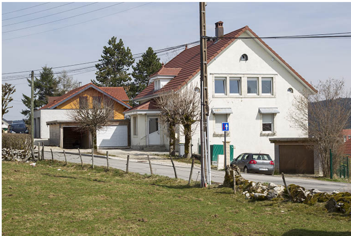
Vue d'ensemble, depuis l'ouest. 25, Charquemont, 14 rue des Lilas