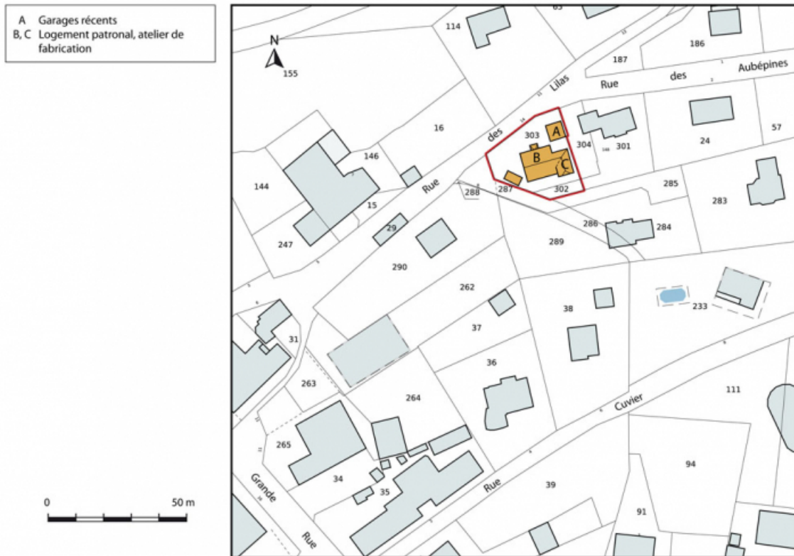
Plan-masse et de situation. Extrait du plan cadastral, 2015, section AC. 25, Charquemont, 14 rue des Lilas