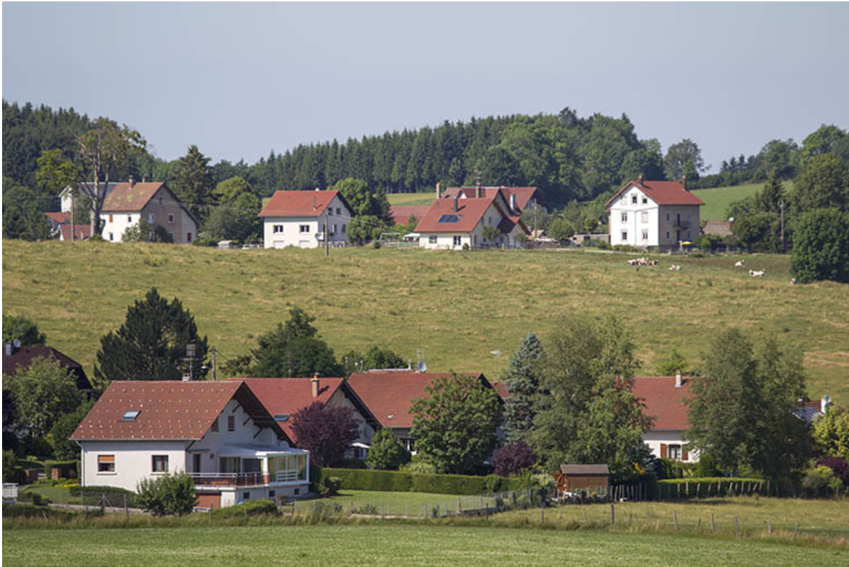
Vue d'ensemble du quartier du "Rif", depuis le sud. La maison est visible à droite.

25, Charquemont, 15 rue du Général Leclerc