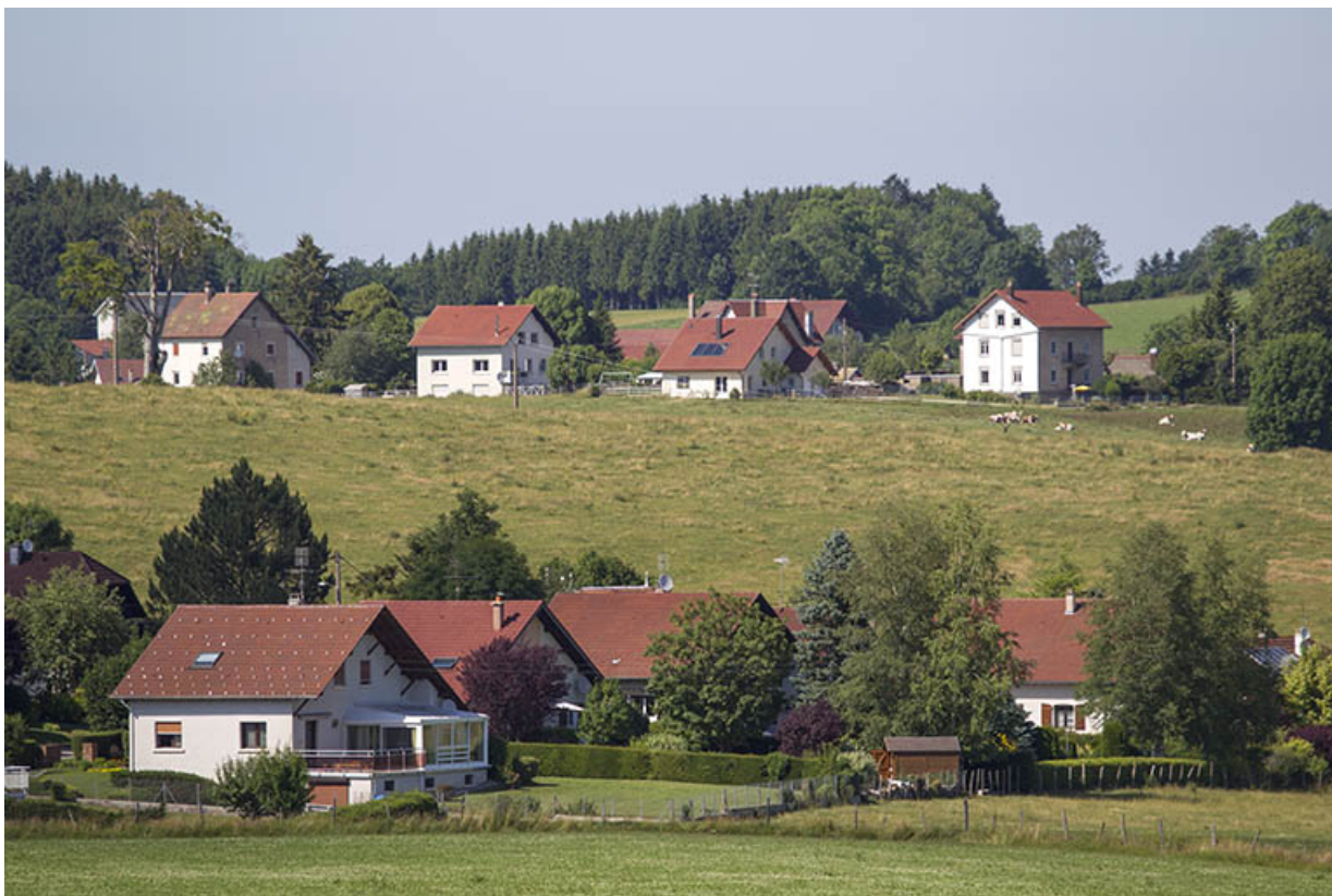
Vue d'ensemble du quartier du "Rif", depuis le sud. La maison est visible à droite.

25, Charquemont, 7 rue du Général Leclerc