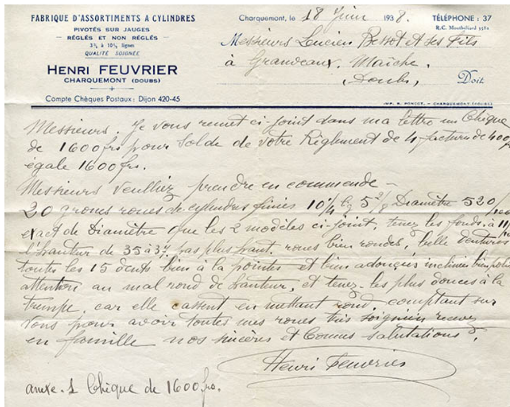
Papier à en-tête de la fabrique d'assortiments à cylindre Henri Feuvrier, 18 juin 1938. 25, Charquemont, 15 rue du Général Leclerc