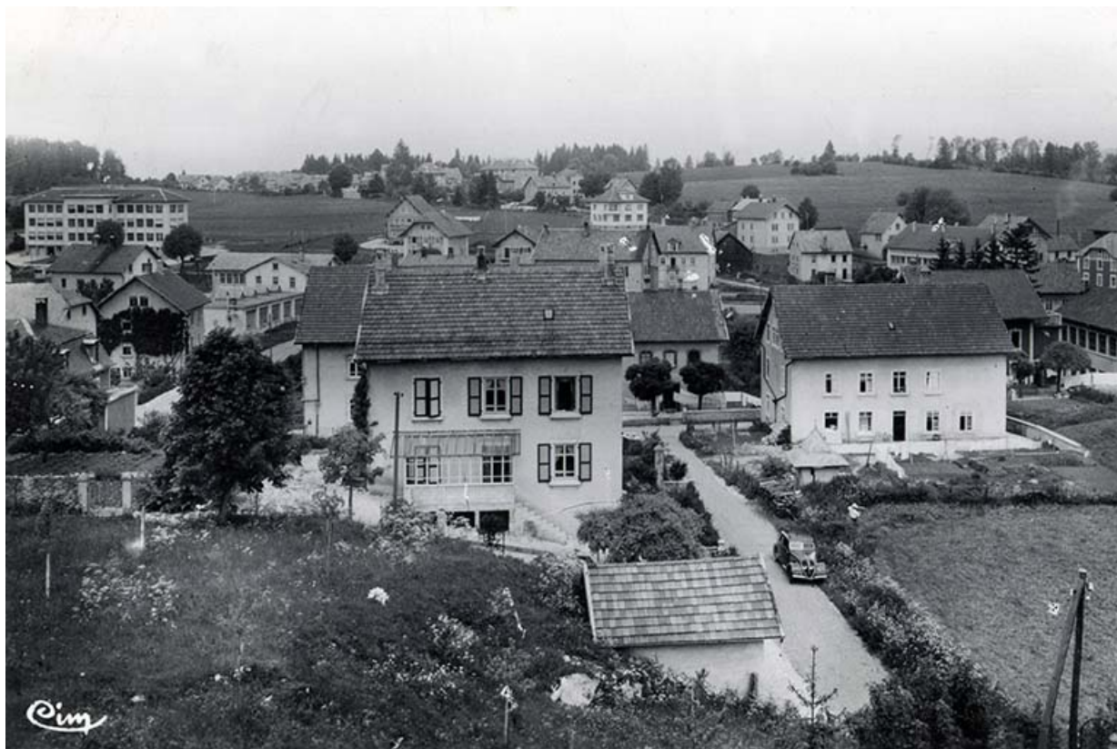
Charquemont (Doubs) - Les Cités [le quartier de la gare vu du sud (rue du Général Leclerc)], entre 1950 et 1954. La maison est à droite.

25, Charquemont, 17 rue du Général Leclerc