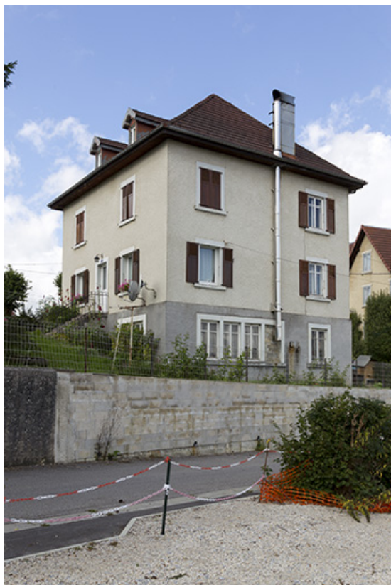
Vue d'ensemble, depuis l'est (façades antérieure et latérale droite).

25, Charquemont, 11 rue du Général Leclerc