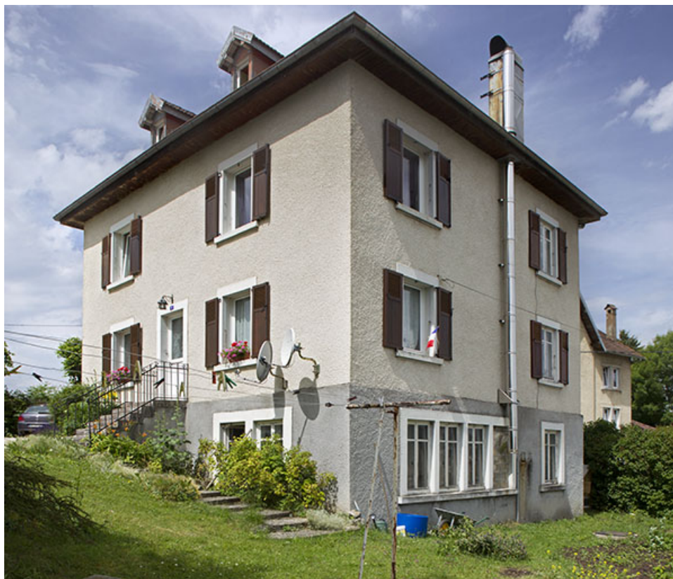
Une maison de la fin des années 1920-début des années 1930 : atelier d'horlogerie de Paul Poupney (11 rue du Général Leclerc). 25, Charquemont

N° de l'illustration : 20142501863NUC4AQ