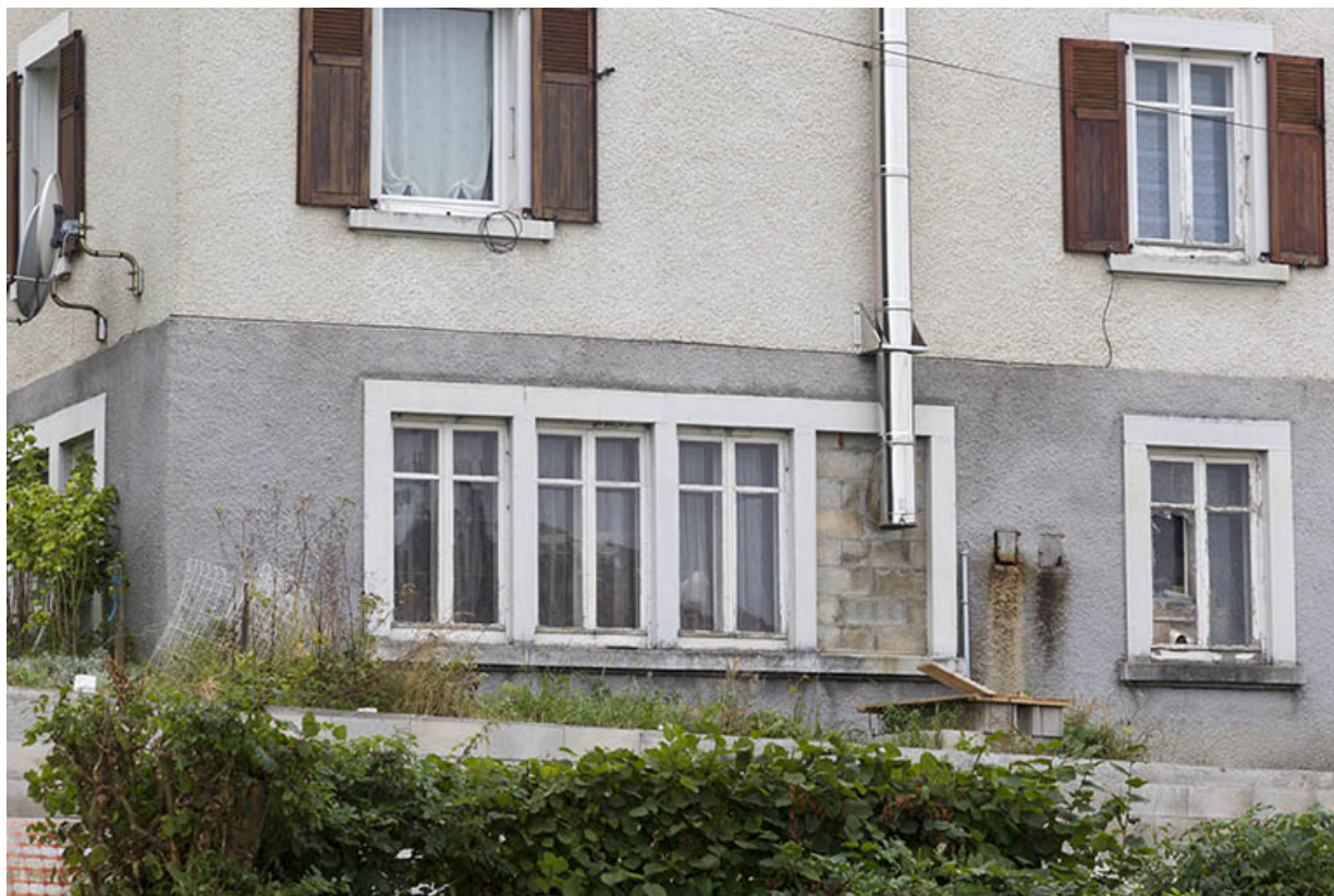
Façade latérale droite : fenêtres multiples ouvrant l'étage de soubassement.

25, Charquemont, 11 rue du Général Leclerc