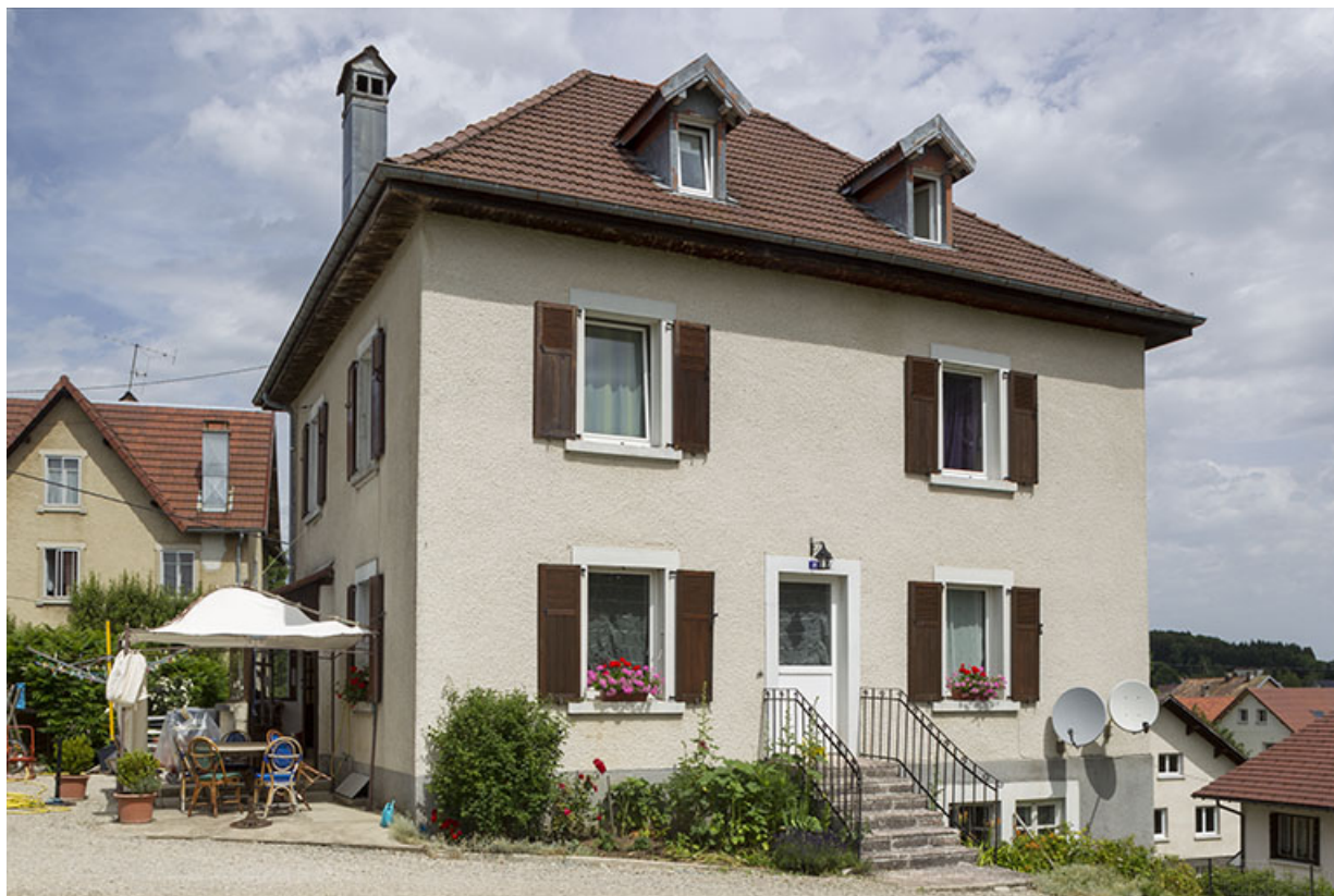
Façade antérieure, de trois quarts gauche. 25, Charquemont, 11 rue du Général Leclerc