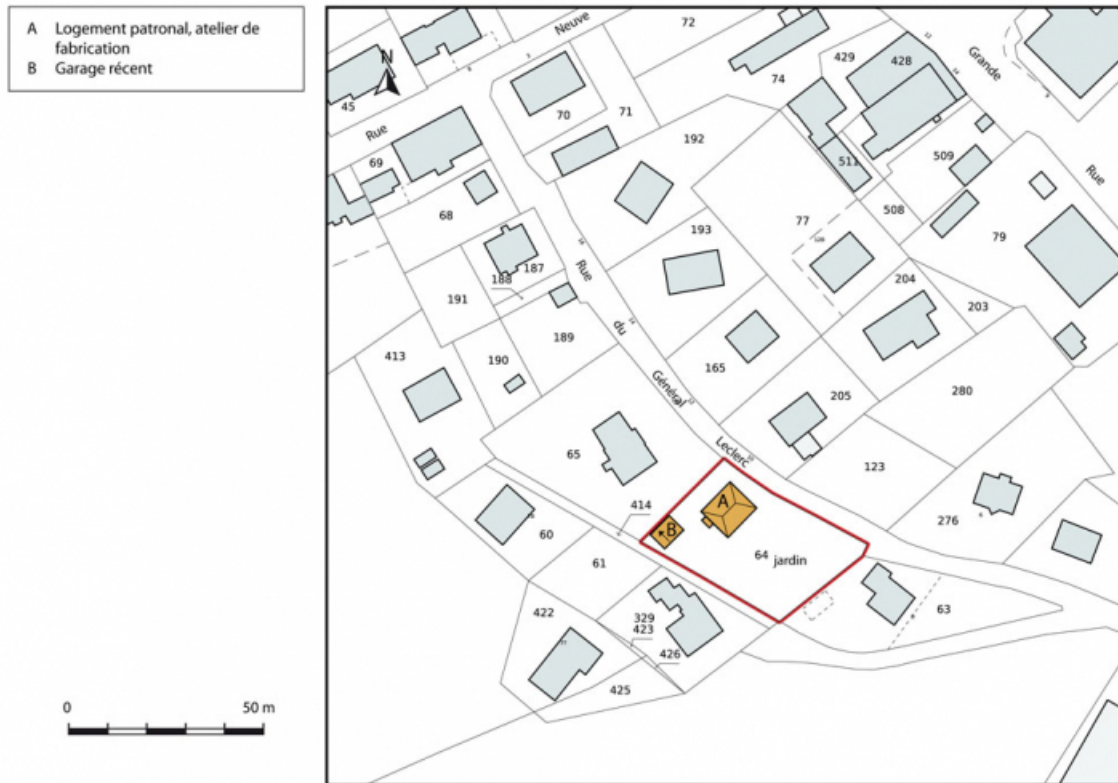
Plan-masse et de situation. Extrait du plan cadastral, 2015, section AI. 25, Charquemont, 11 rue du Général Leclerc