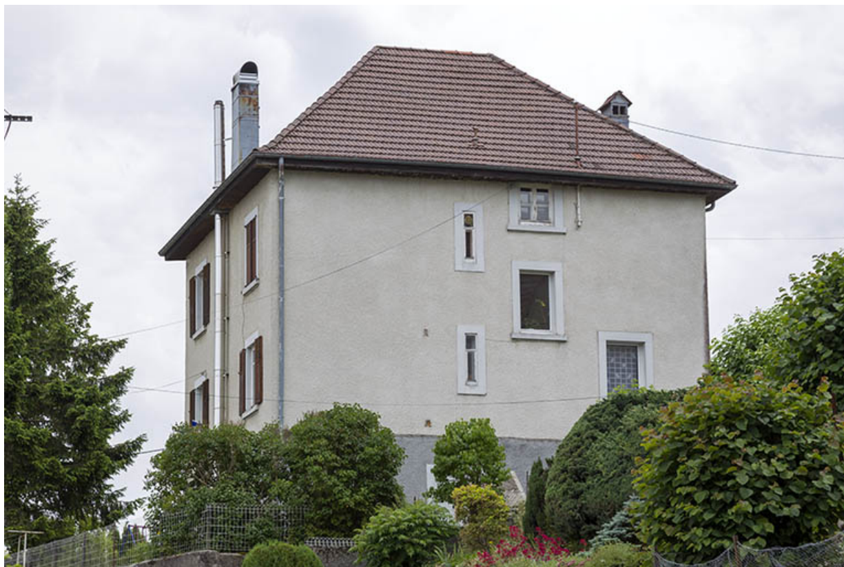
Façade postérieure, de trois quarts gauche.

25, Charquemont, 11 rue du Général Leclerc